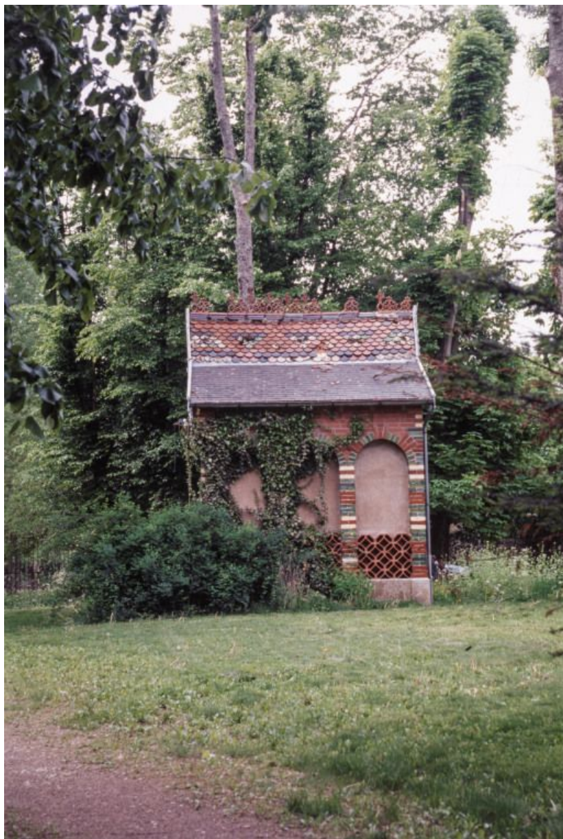
Chapelle du jardin : façade latérale. 21, Laignes Petite rue de la maison Dieu