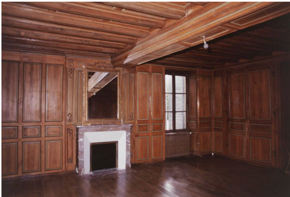
Premier étage : vue générale de la seconde salle.

21, Laignes Petite rue de la maison Dieu