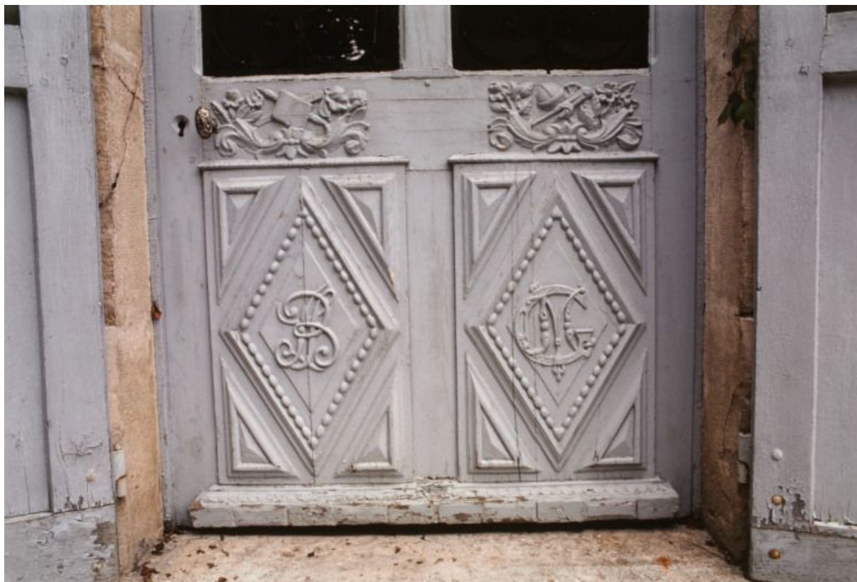
Porte d'entrée sur cour, détail : emblèmes et initiales.

21, Laignes Petite rue de la maison Dieu