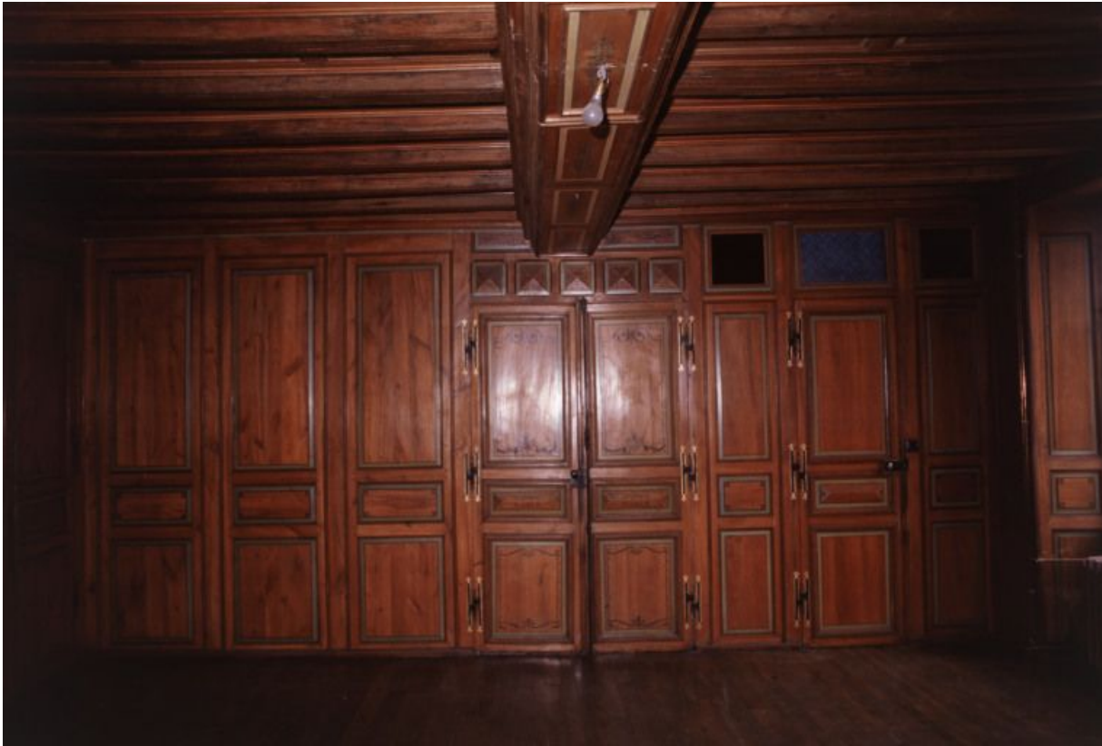
Premier étage : vue générale de la seconde salle.

21, Laignes Petite rue de la maison Dieu