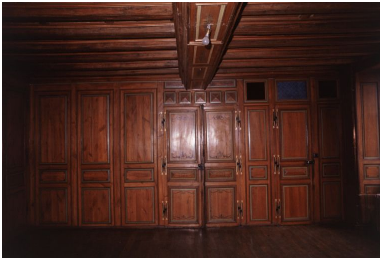
Premier étage : vue générale de la seconde salle.

21, Laignes Petite rue de la maison Dieu