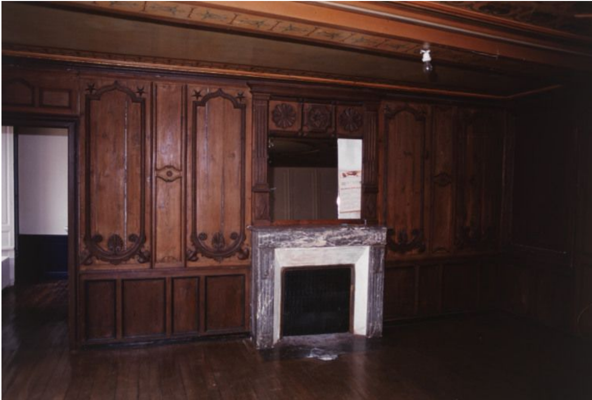
Premier étage : vue générale de la seconde salle avec la cheminée.

21, Laignes Petite rue de la maison Dieu