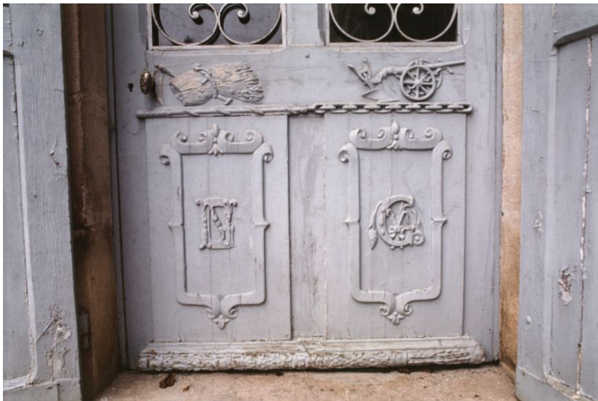
Porte d'entrée sur cour, détail : emblèmes et initiales.

21, Laignes Petite rue de la maison Dieu