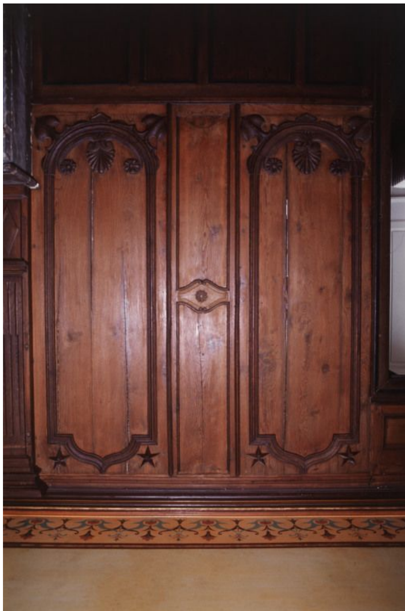
Premier étage : seconde salle, boiseries et frise du plafond peint.

21, Laignes Petite rue de la maison Dieu