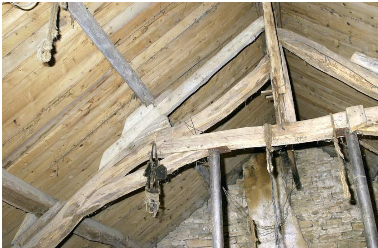
Logis de l'ancienne Maison-Dieu, détail de la charpente

21, Saffres C.R. 17, lieudit : Maison-Dieu