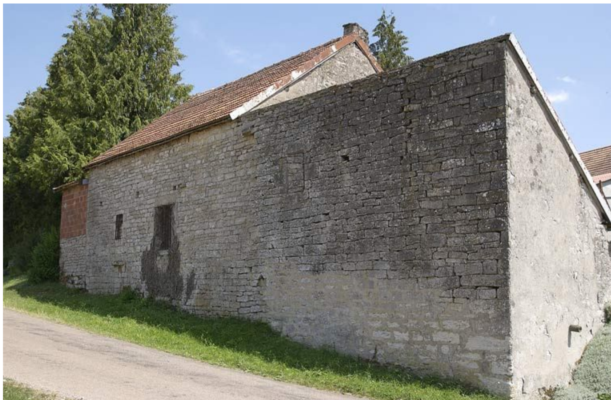
Les bâtiments de l'ancienne Maison-Dieu, depuis l'ancienne "rue haute".

21, Saffres C.R. 17, lieudit : Maison-Dieu