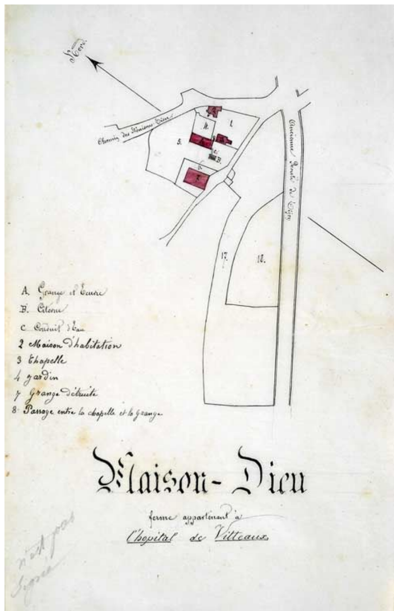
Plan extrait des archives hospitalières, 1875

21, Saffres C.R. 17, lieudit : Maison-Dieu