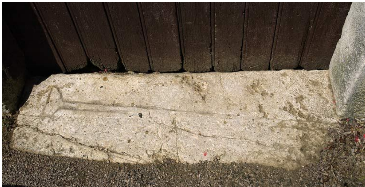
Pierre tombale en emploi à l'entrée de la grange.

21, Saffres C.R. 17, lieudit : Maison-Dieu