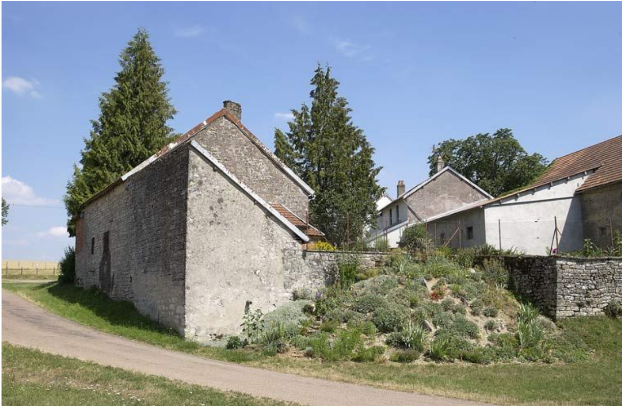
Les bâtiments de l'ancienne Maison-Dieu, depuis l'ancienne "rue haute"

21, Saffres C.R. 17, lieudit : Maison-Dieu