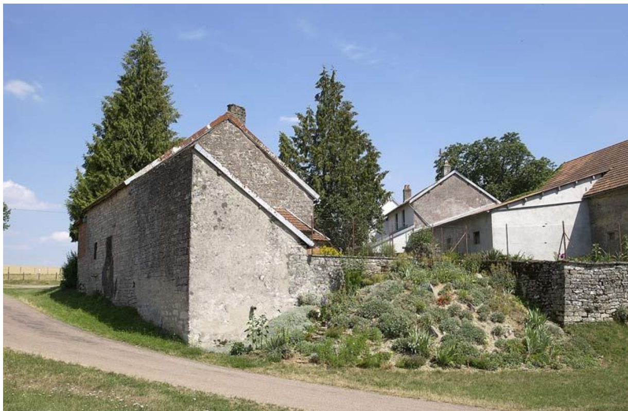
Les bâtiments de l'ancienne Maison-Dieu, depuis l'ancienne "rue haute"

21, Saffres C.R. 17, lieudit : Maison-Dieu