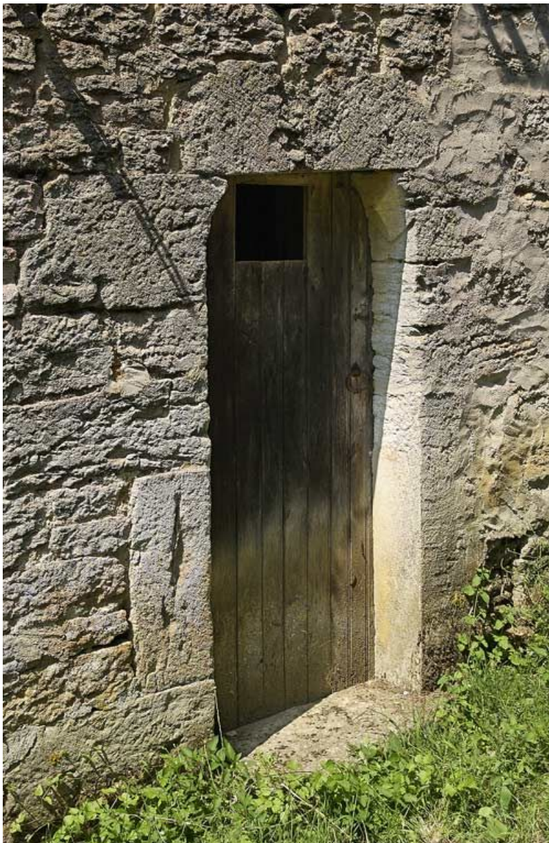
Logis de l'ancienne Maison-Dieu, détail de la porte à linteau sur coussinets. 21, Saffres C.R. 17, lieudit : Maison-Dieu