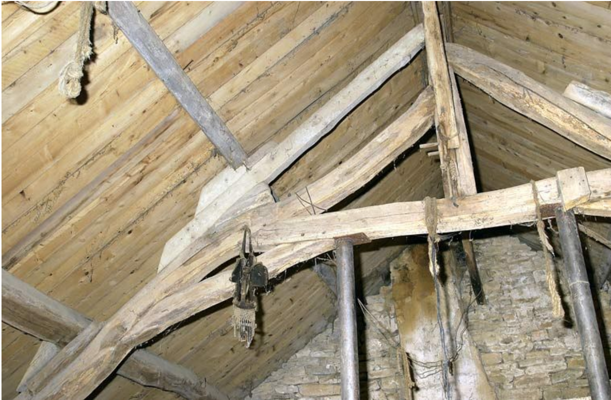
Logis de l'ancienne Maison-Dieu, détail de la charpente

21, Saffres C.R. 17, lieudit : Maison-Dieu