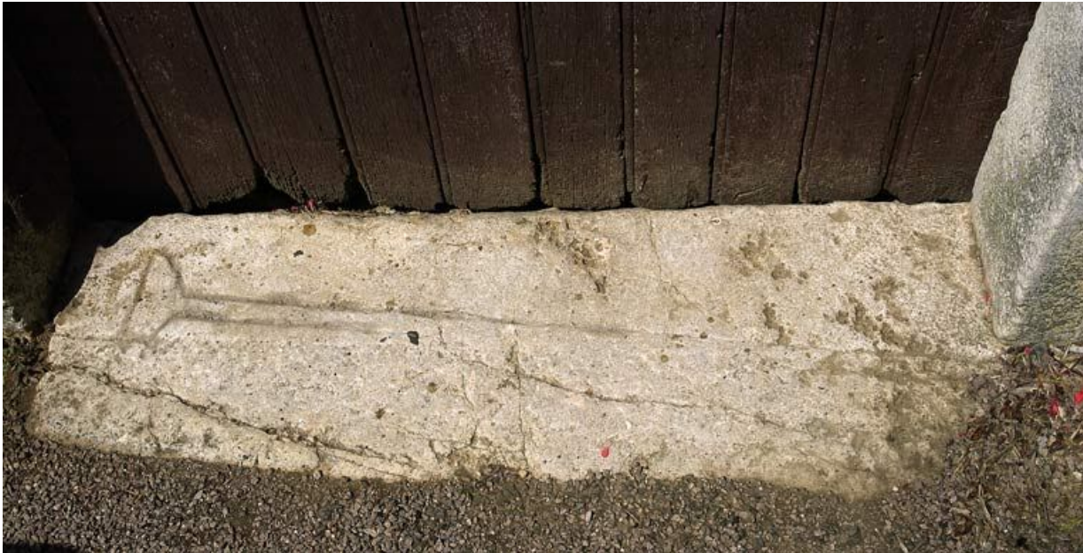
Pierre tombale en remploi à l'entrée de la grange.

21, Saffres C.R. 17, lieudit : Maison-Dieu