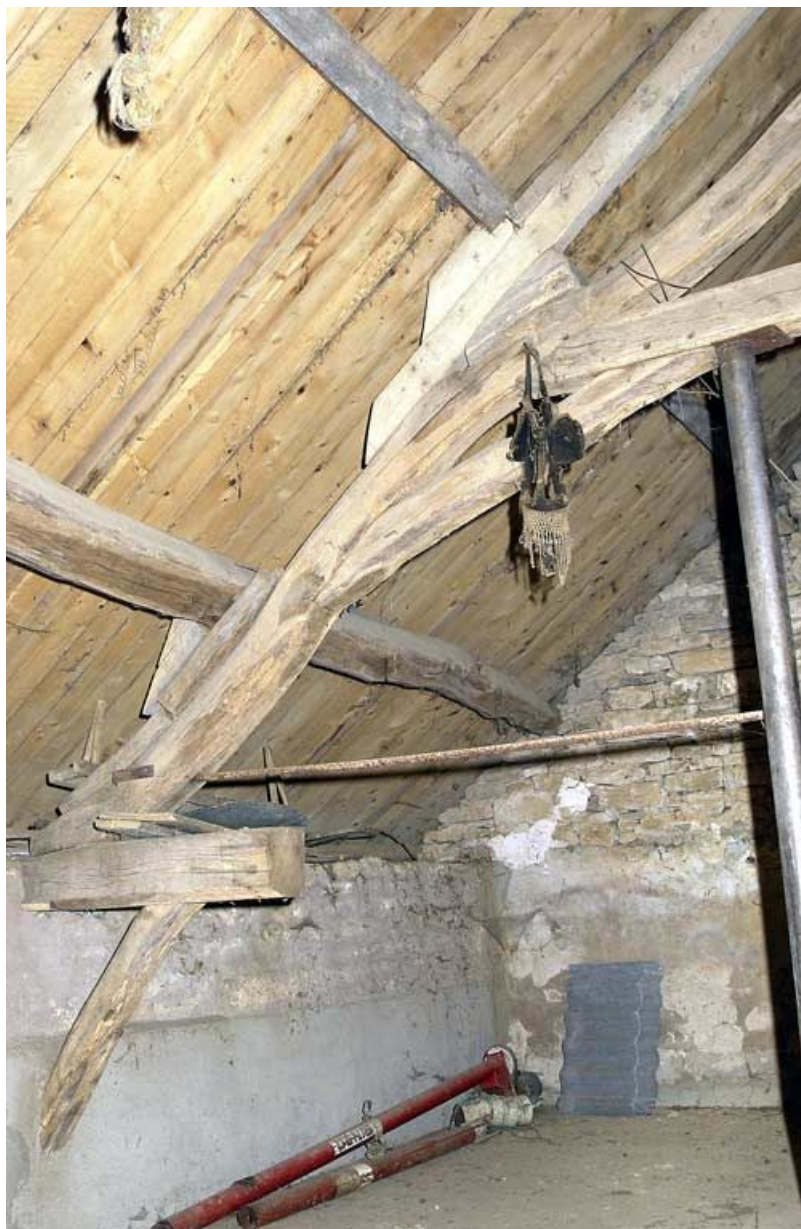
Logis de l'ancienne Maison-Dieu, détail de la charpente

21, Saffres C.R. 17, lieudit : Maison-Dieu