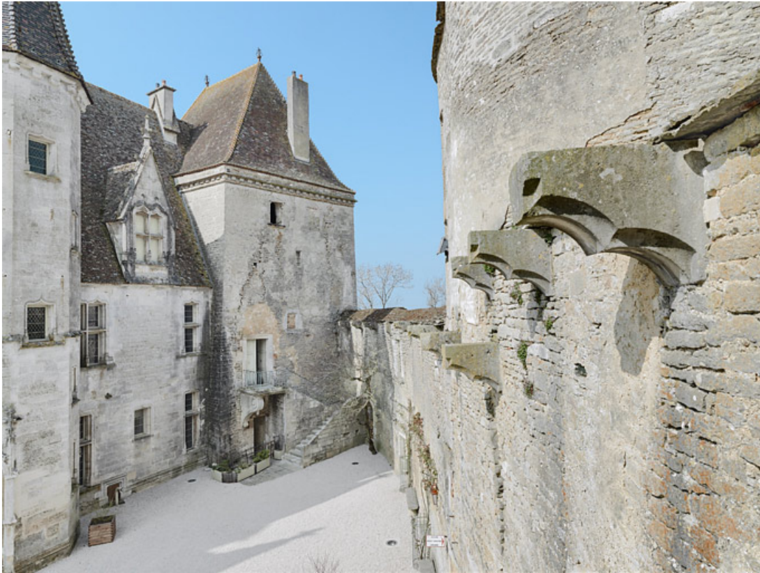
La cour en direction de la tour carrée. 21, Châteauneuf