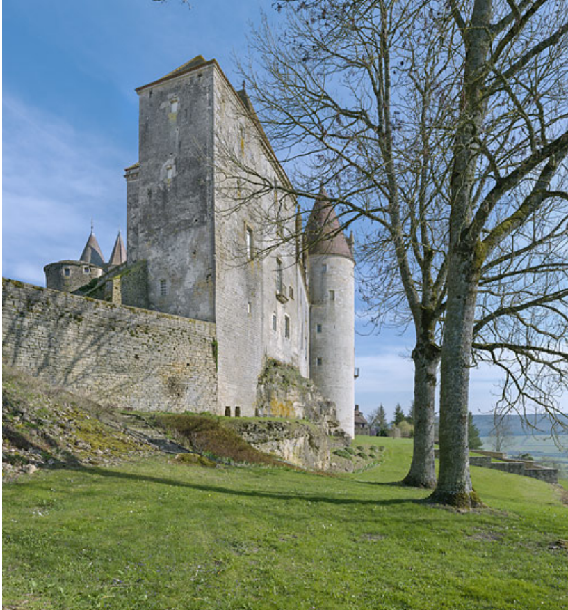
La tour carrée vue du nord-ouest.