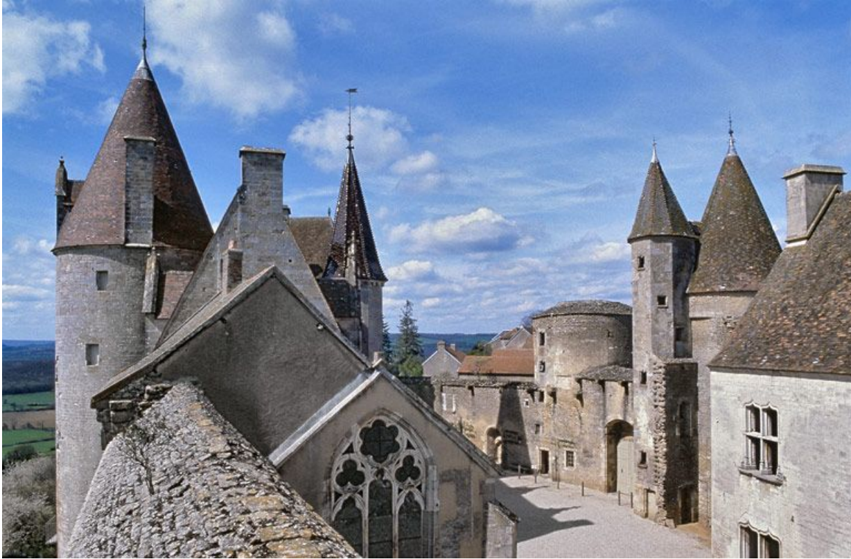
Vue de la cour depuis l'enceinte. 21, Châteauneuf