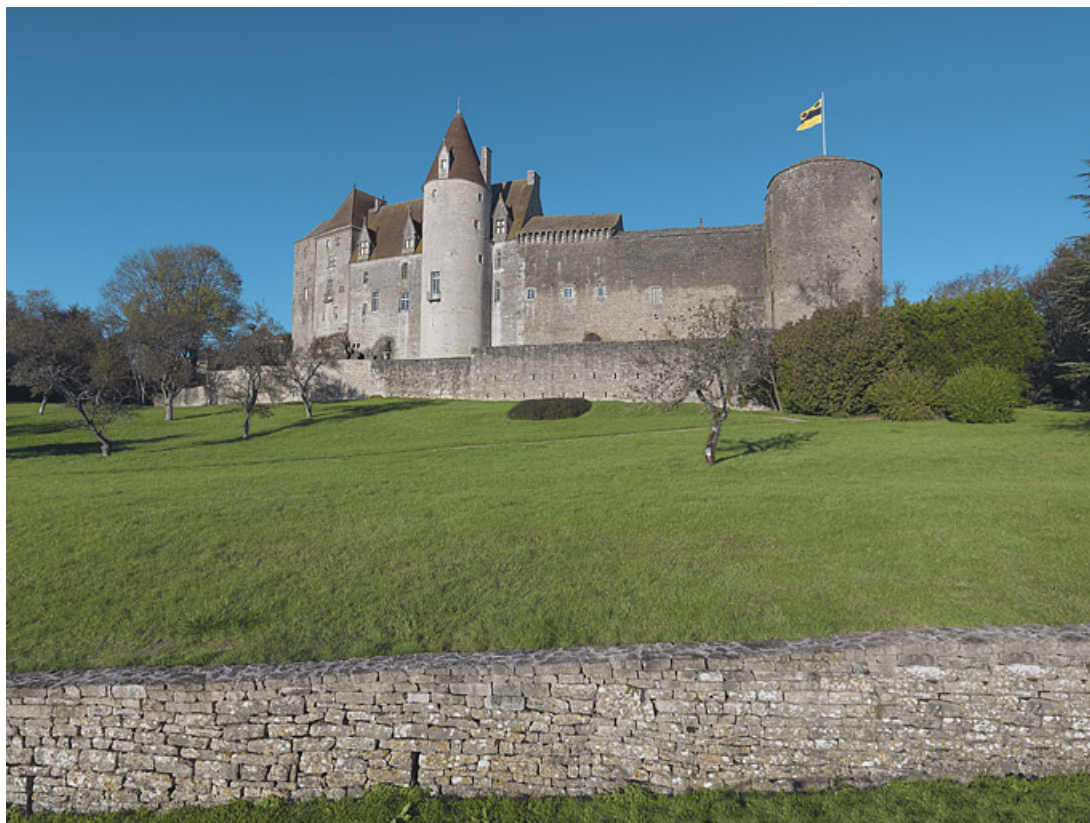
Vue du château de Châteauneuf, face sud des remparts.