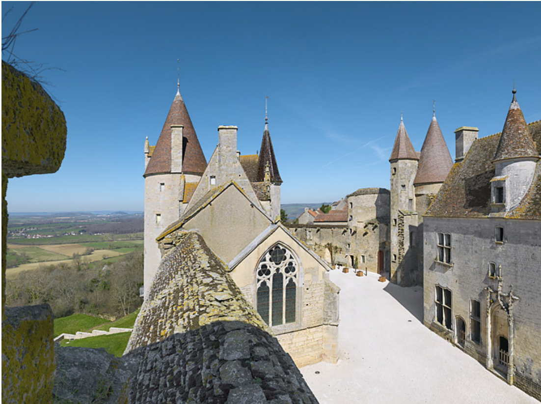
La cour avec la chapelle vues du chemin de ronde. 21, Châteauneuf