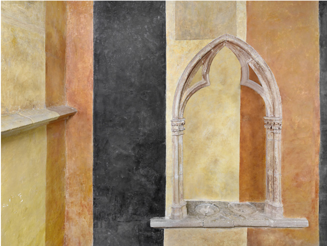
Le lavabo liturgique dans la chapelle de face. 21, Châteauneuf