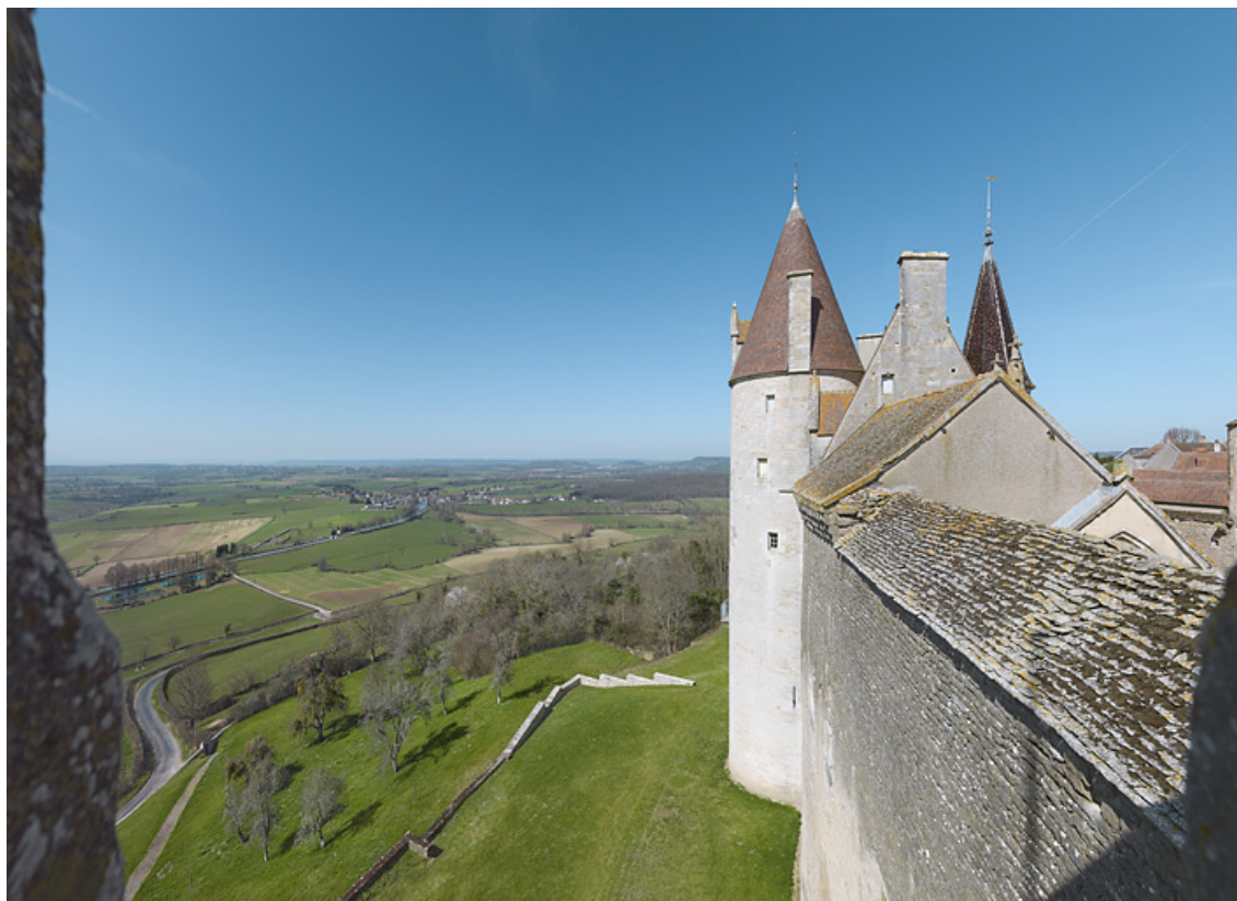
L'emplacement du chemin de ronde vu de la tour sud et la vallée vers Commarin. 21, Châteauneuf