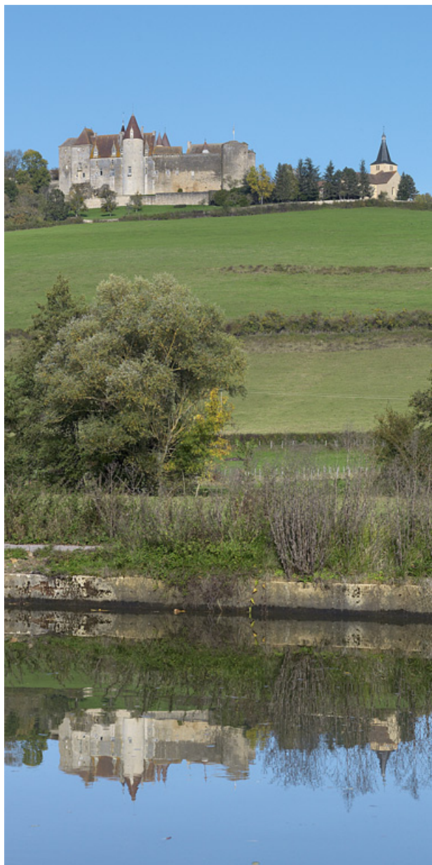
Vue du château de Châteauneuf, prise du canal.