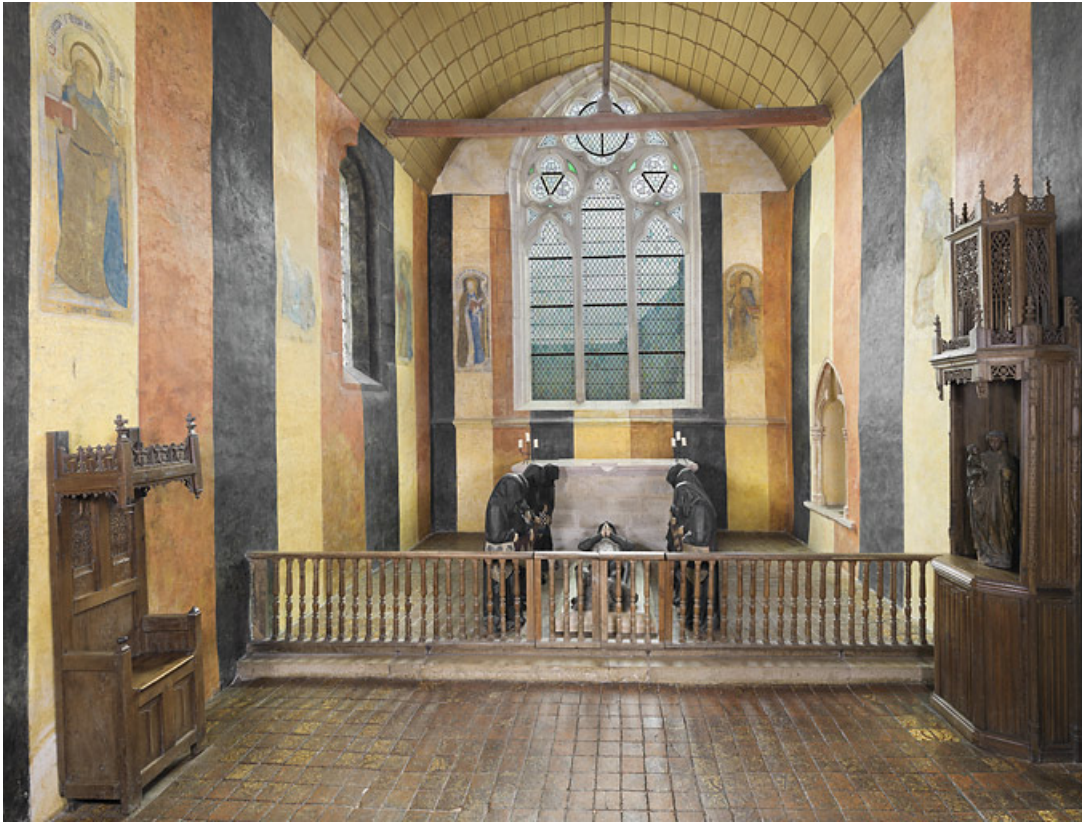
Vue d'ensemble de la chapelle.