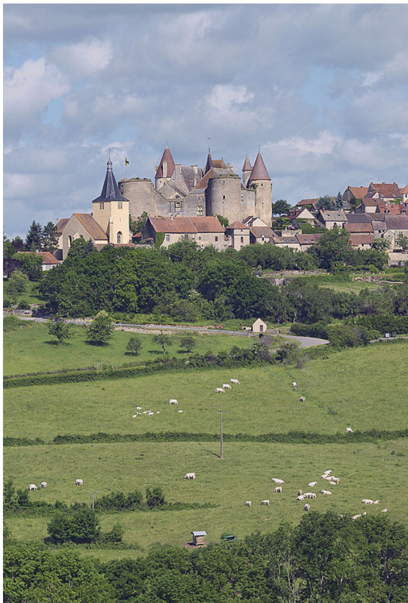
Vue du château de Châteauneuf, prise de la route de Bouhey. 21, Châteauneuf