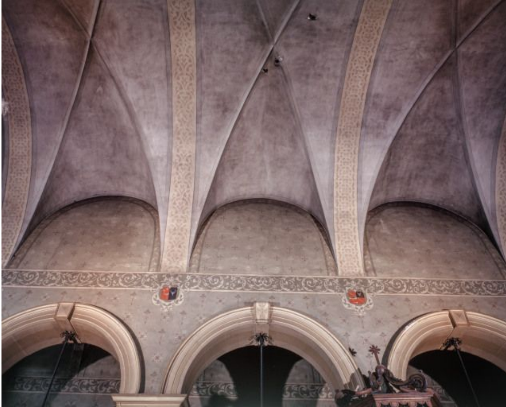
Nef, vaisseau central, détail des grandes arcades et de la voûte.