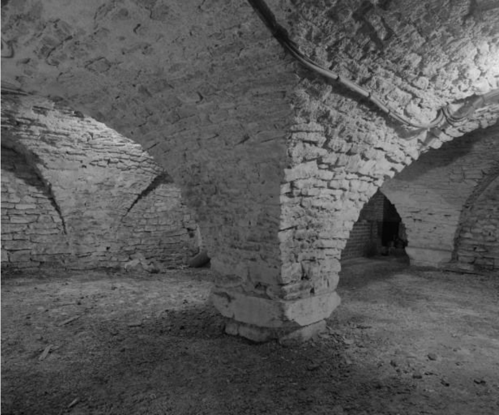
Partie de la crypte se prolongeant sous la sacristie.