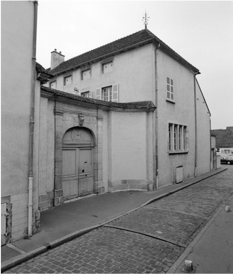
Portail principal et mur de croupe sud du bâtiment des services Sainte-Anne et Saint-Antoine. 21, Beaune, 3 rue Rousseau Deslandes