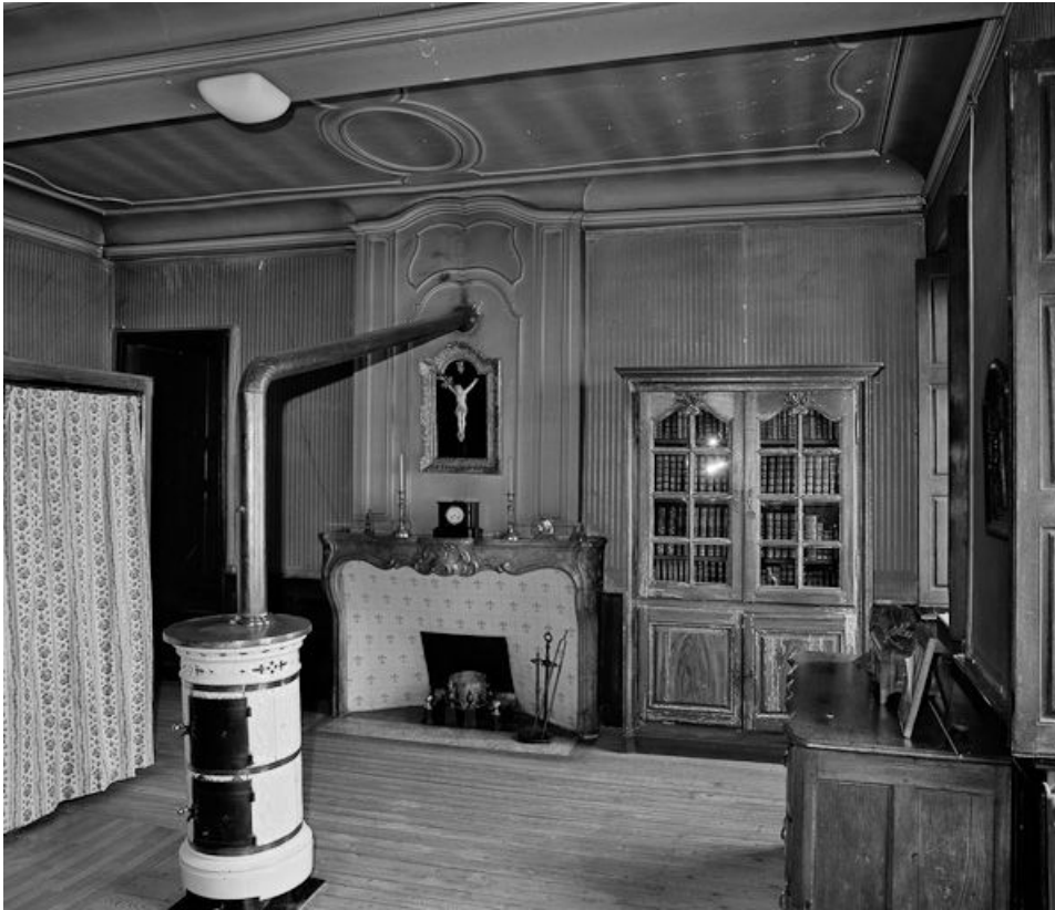
Ancien dortoir situé au dessus de la grande sacristie.