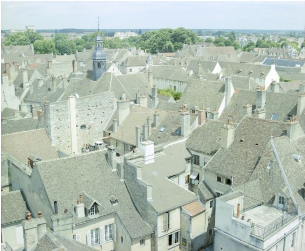
Vue d'ensemble prise depuis le beffroi.