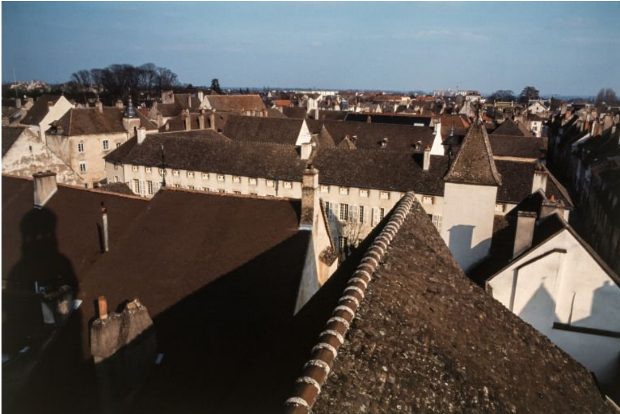
Vue d'ensemble des toitures depuis le clocher de l'église.