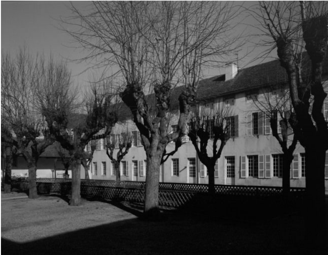
Bâtiment situé à l'est de la cour principale (services Sainte-Anne et Saint-Antoine)