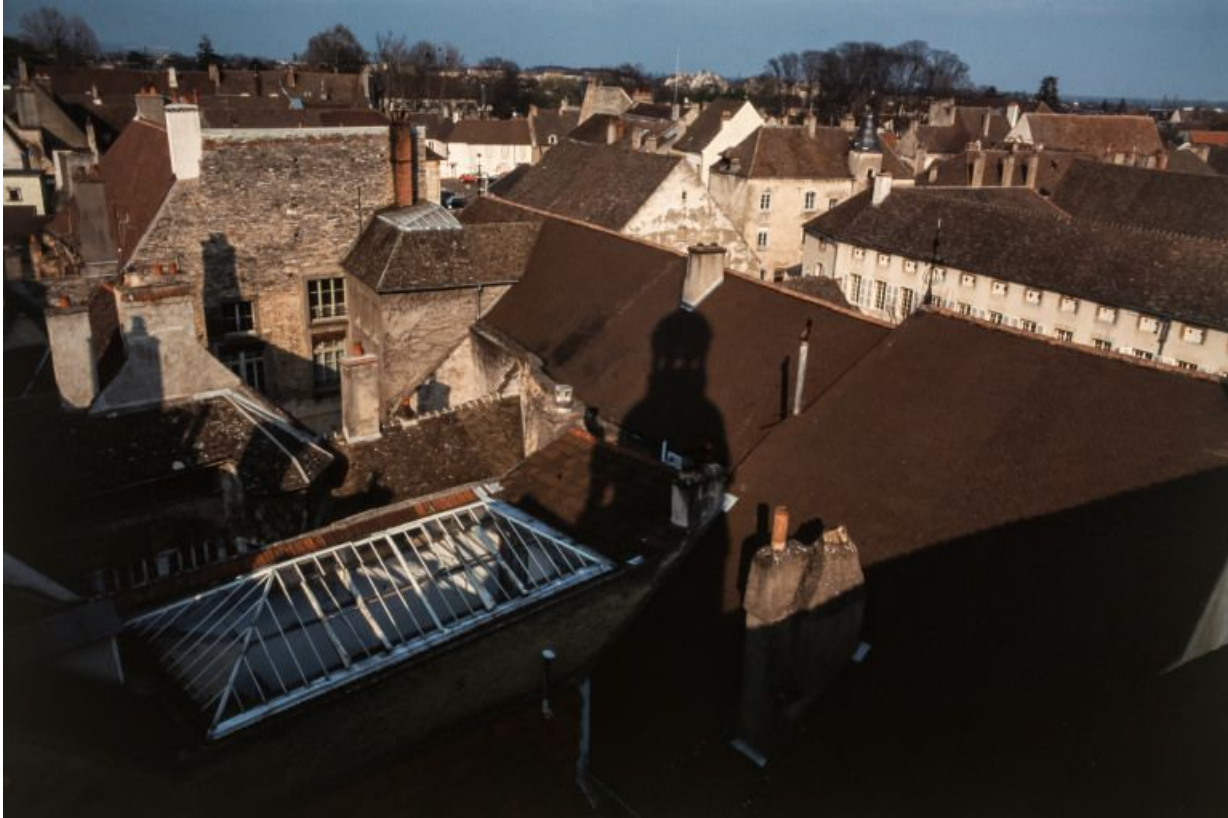
Toitures des différents corps composant le bâtiment de la Communauté des soeurs et des orphelines, vue prise du clocher de l'église.