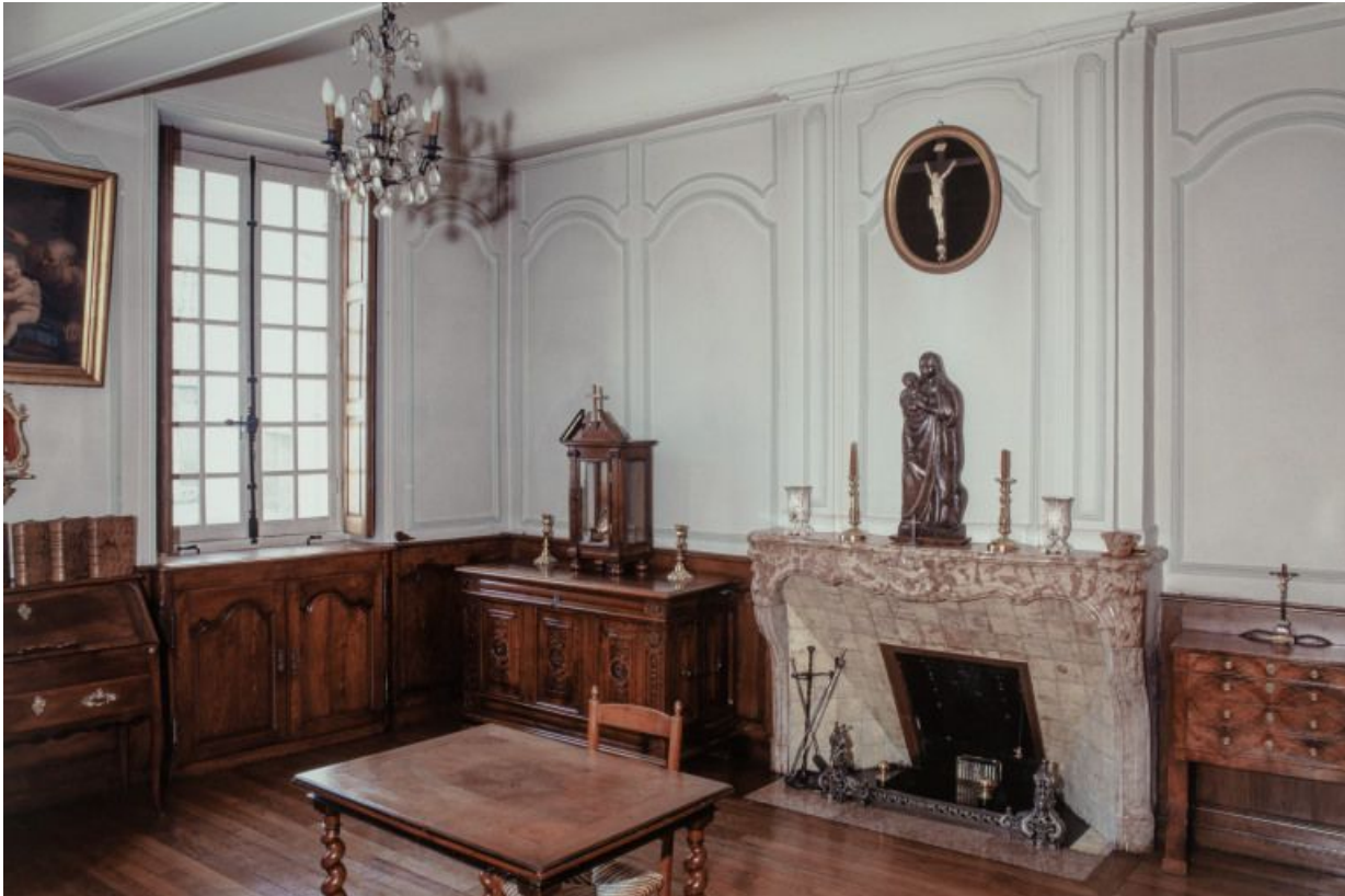
Bâtiment de la Communauté des soeurs et des orphelines, infirmerie des soeurs : cheminée et fenêtre sur cour. 21, Beaune, 3 rue Rousseau Deslandes