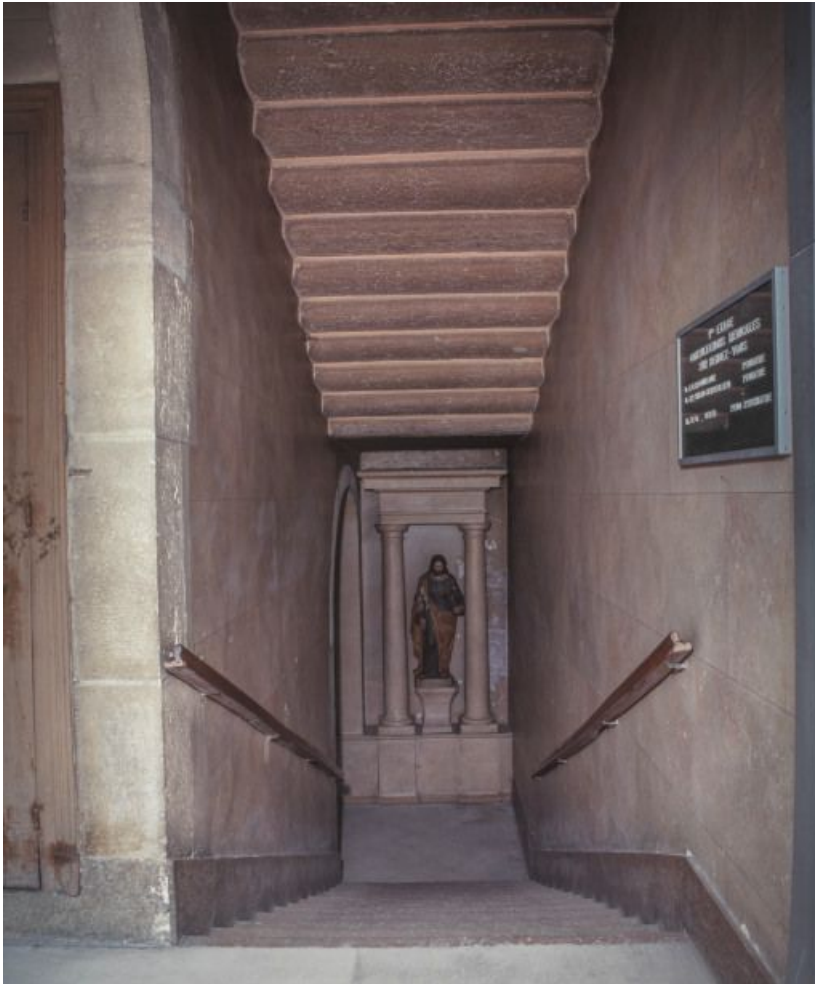
Bâtiment de la Communauté des sœurs et des orphelines, 2e volée de l'escalier principal, vue prise du 2e palier. 21, Beaune, 3 rue Rousseau Deslandes