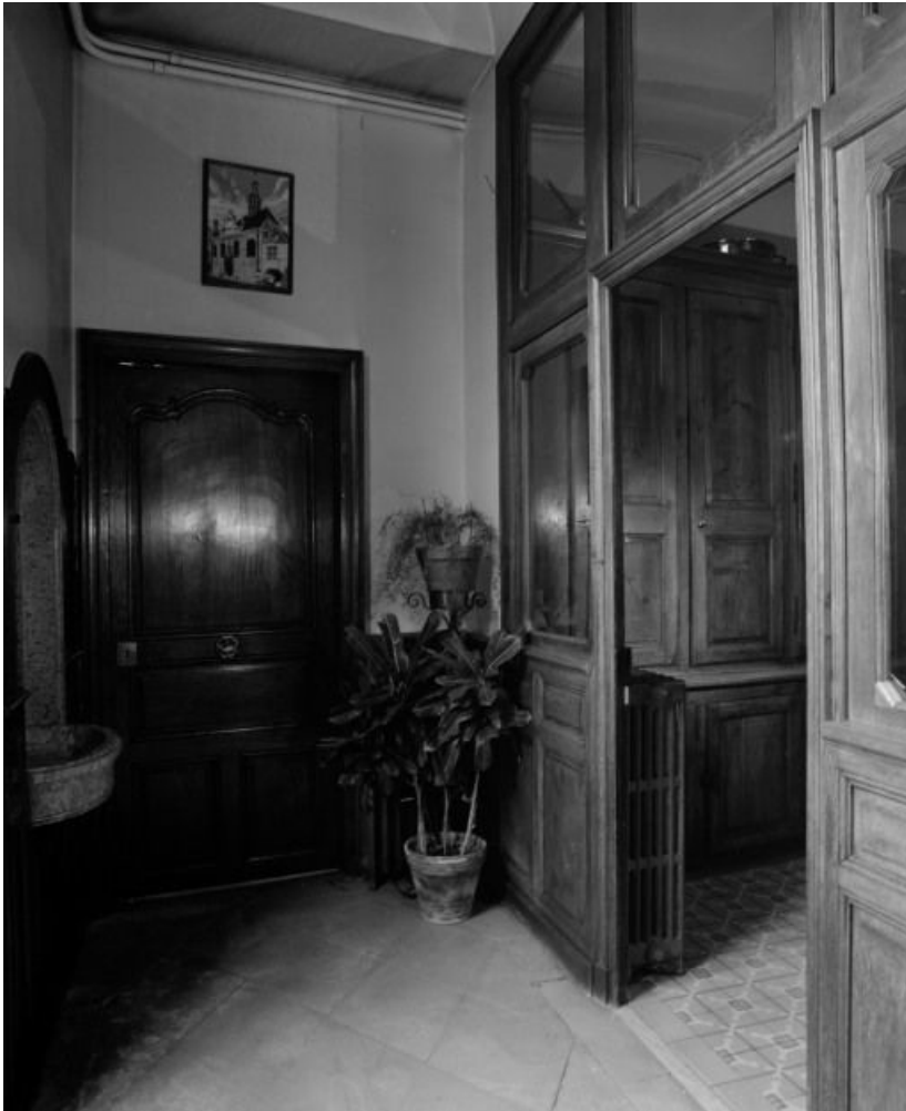
Bâtiment de la Communauté des soeurs et des orphelines, vestibule des soeurs ouvert sur l'office. 21, Beaune, 3 rue Rousseau Deslandes