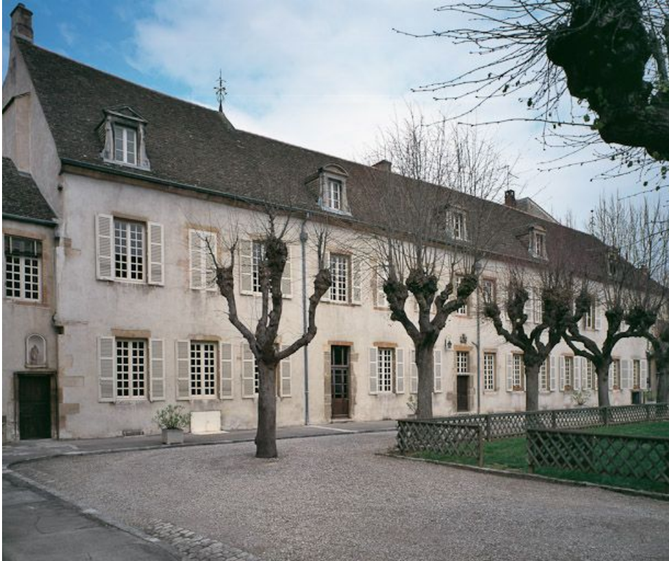
Bâtiment de la Communauté des sœurs et des orphelines, élévation est, sur cour.