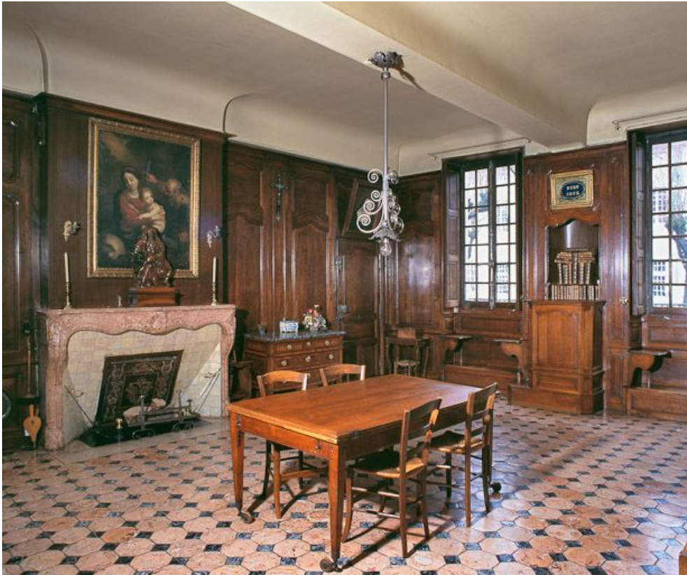
Bâtiment de la Communauté des soeurs et des orphelines, réfectoire des soeurs. 21, Beaune, 3 rue Rousseau Deslandes