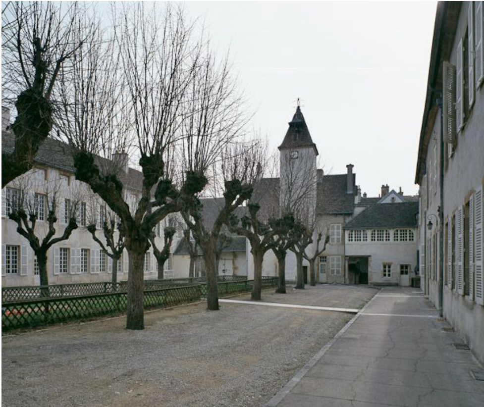
Vue d'ensemble des bâtiments entourant la cour principale.