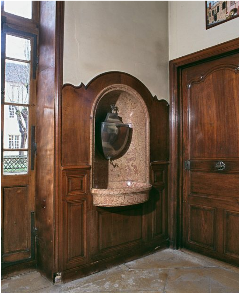
Bâtiment de la Communauté des soeurs et des orphelines, vestibule des soeurs. 21, Beaune, 3 rue Rousseau Deslandes