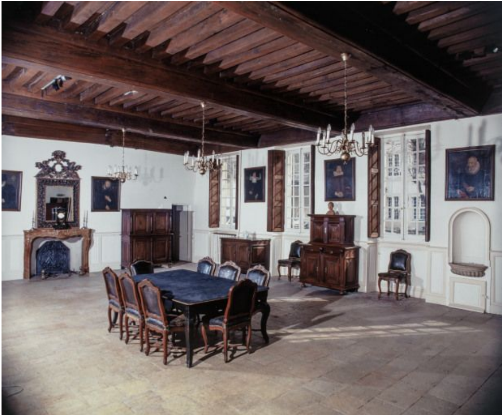
Bâtiment de la Communauté des soeurs et des orphelines, rez-de-chaussée, ancienne salle de classe. 21, Beaune, 3 rue Rousseau Deslandes