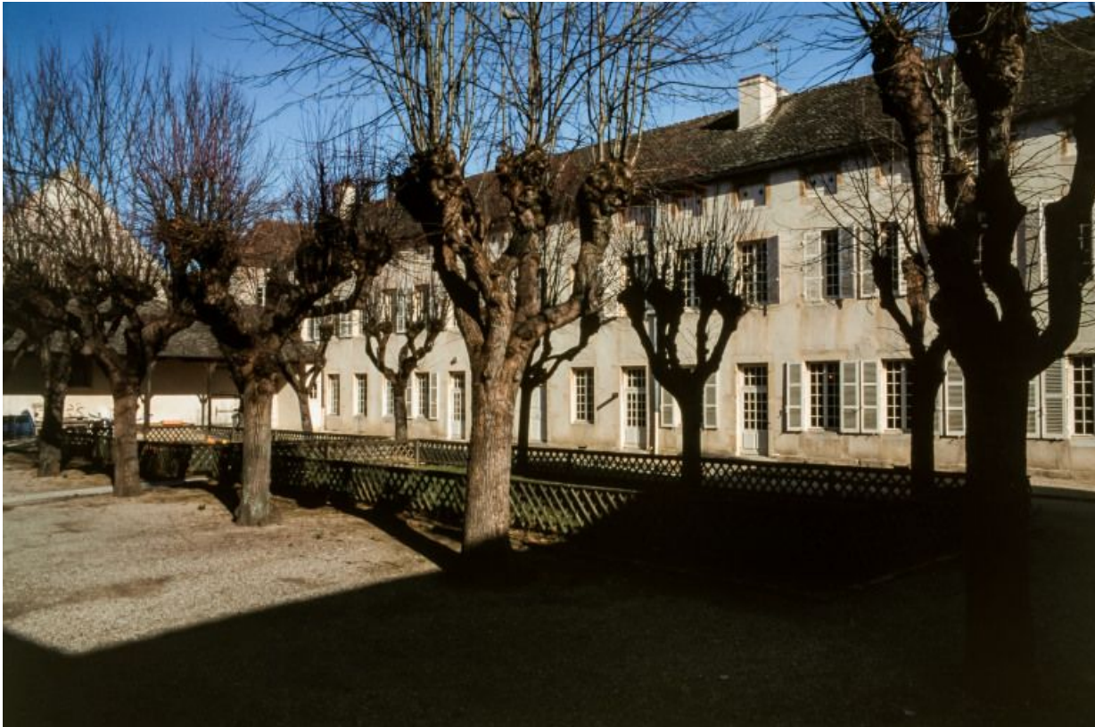
Bâtiment situé à l'est de la cour principale (services Sainte-Anne et Saint-Antoine)