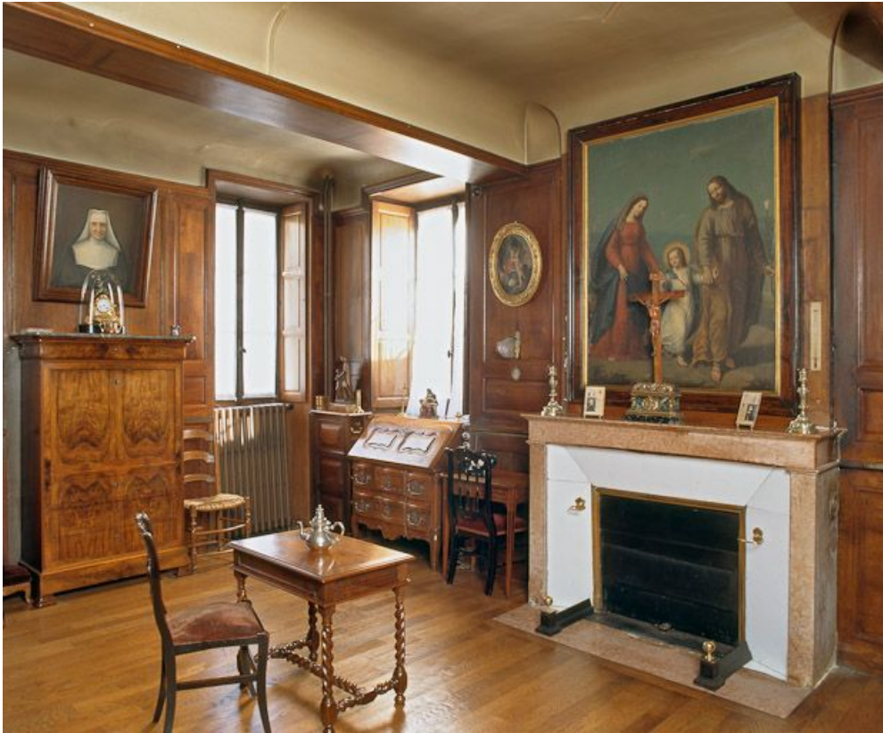
Maison des fondateurs, bureau du rez-de-chaussée.