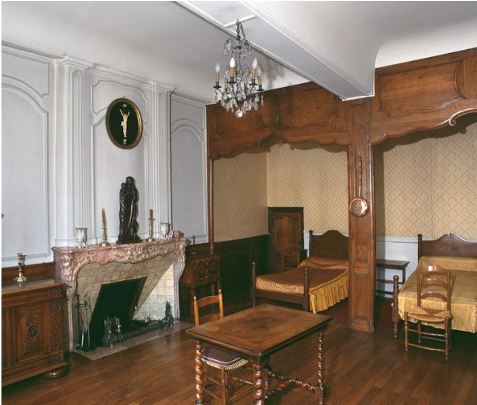
Bâtiment de la Communauté des sœurs et des orphelines, infirmerie des sœurs.