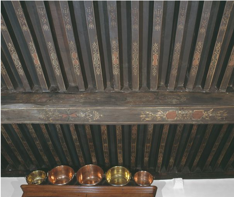
Maison des fondateurs, 1er étage, salle dite petit musée, détail du plafond. 21, Beaune, 3 rue Rousseau Deslandes