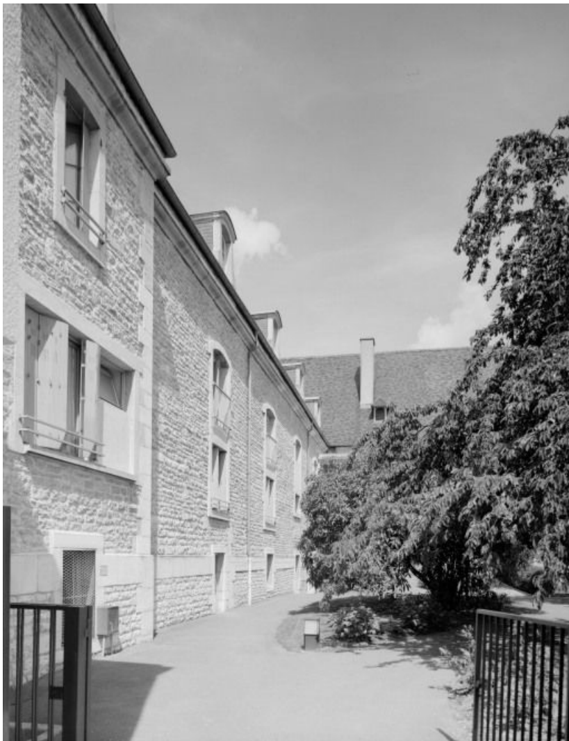
Salles Saint-Joseph et Saint-Etienne : élévation sur le jardin.