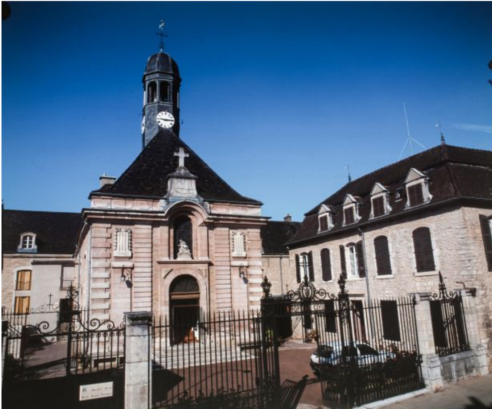
Ancienne salle Saint-Laurent.