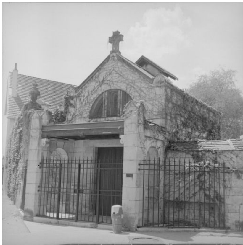
Dépositaire : élévation sur la rue.