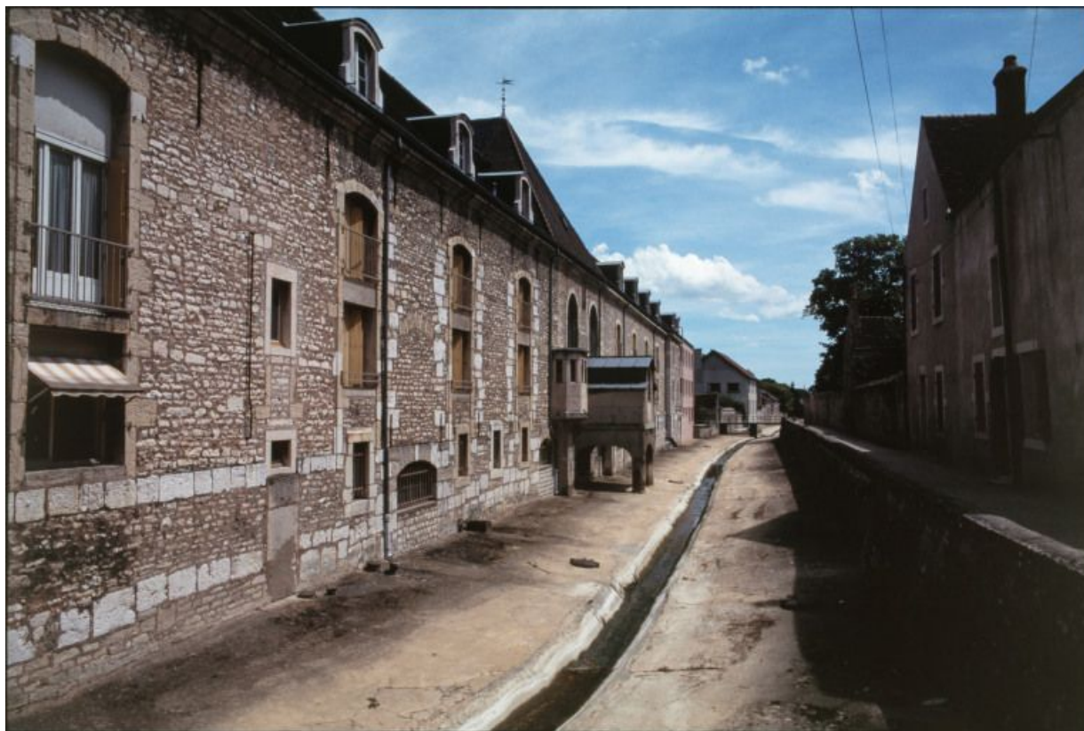
Élévation sur le Meuzin : vue d'ensemble.