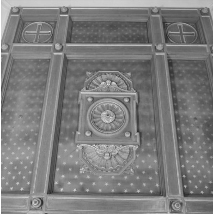
Intérieur de la chapelle : plafond à caissons.