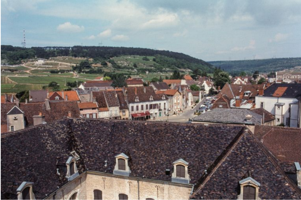
Vue depuis les toits sur la commune et les côtes.