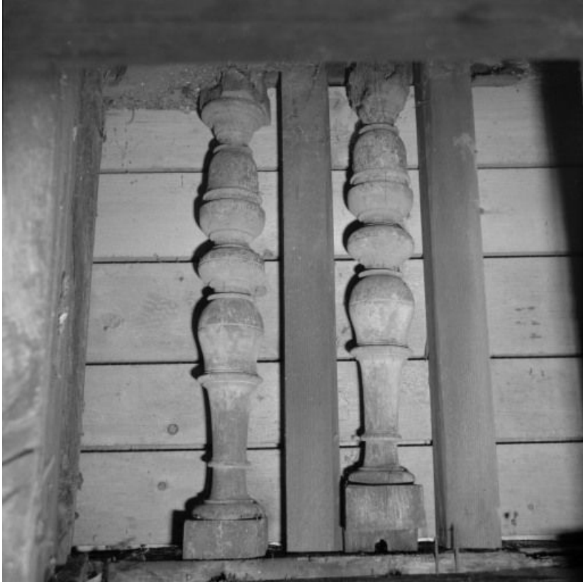
Salle Saint-Laurent, détail : campanile, vestige de l'ancienne balustrade aujourd'hui dissimulée par un essentage en ardoise. 21, Nuits-Saint-Georges Henri-Challand