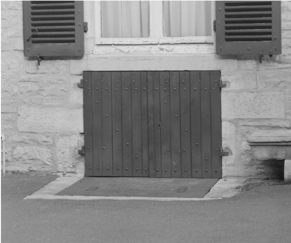
Bâtiment dit de l'administration, détail : porte d'entrée du sous-sol (élévation gauche). 21, Nuits-Saint-Georges Henri-Challand