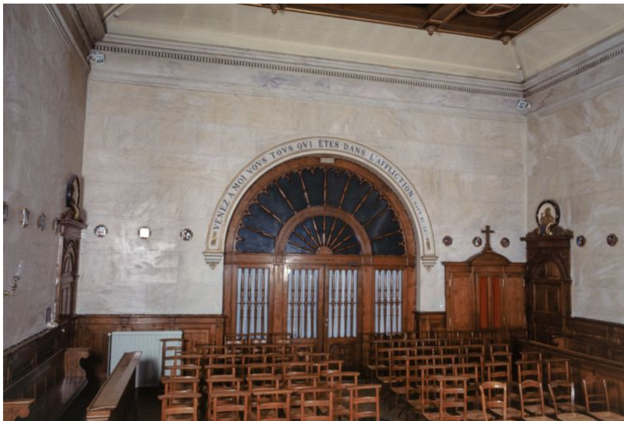
Intérieur de la chapelle : mur postérieur. 21, Nuits-Saint-Georges Henri-Challand