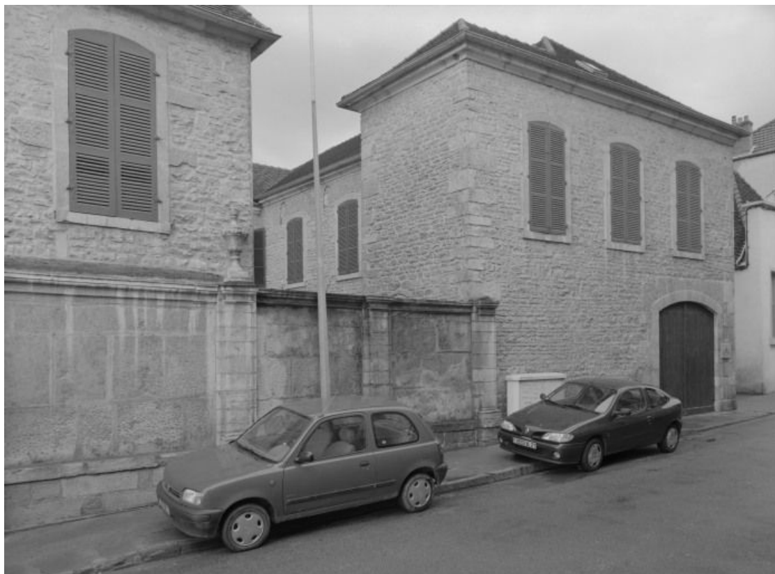
Bâtiment de la cuverie : élévation sur la rue.