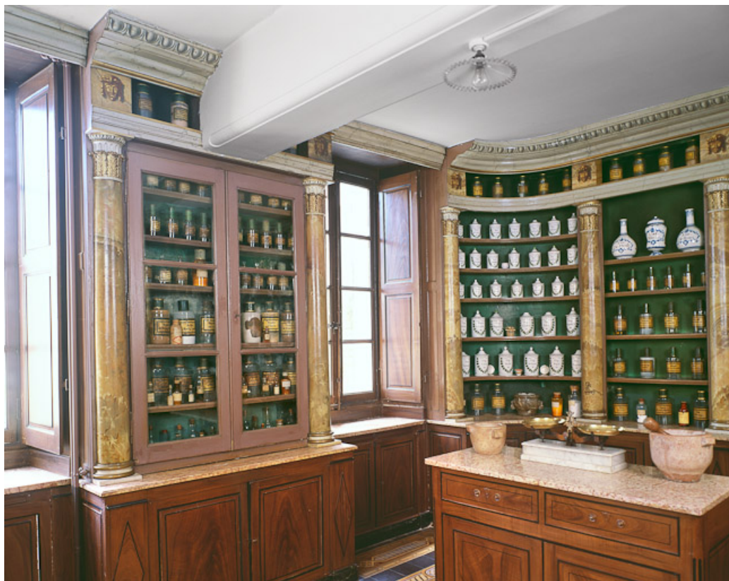
Bâtiment dit de l'administration : pharmacie, vue partielle des murs gauche et postérieur. 21, Nuits-Saint-Georges Henri-Challand