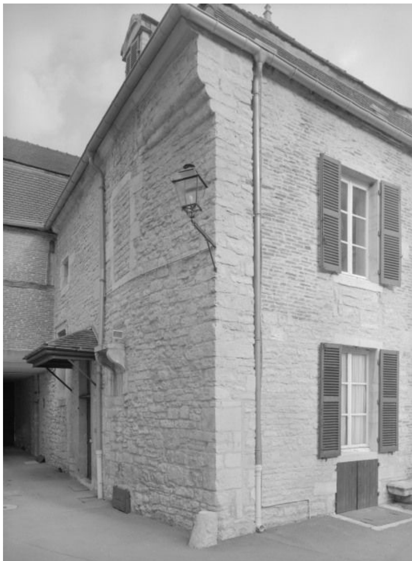
Bâtiment dit de l'administration : élévations postérieure et gauche sur la cour. 21, Nuits-Saint-Georges Henri-Challand