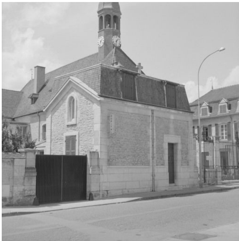
Loge de concierge : élévation sur la rue. 21, Nuits-Saint-Georges Henri-Challand