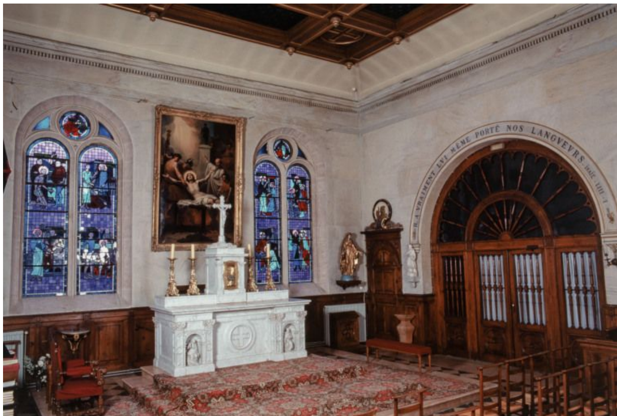
Intérieur de la chapelle : vue d'ensemble.