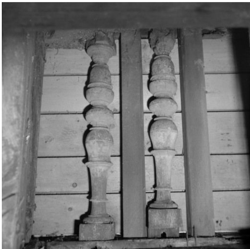
Salle Saint-Laurent, détail : campanile, vestige de l'ancienne balustrade aujourd'hui dissimulée par un essentage en ardoise. 21, Nuits-Saint-Georges Henri-Challand