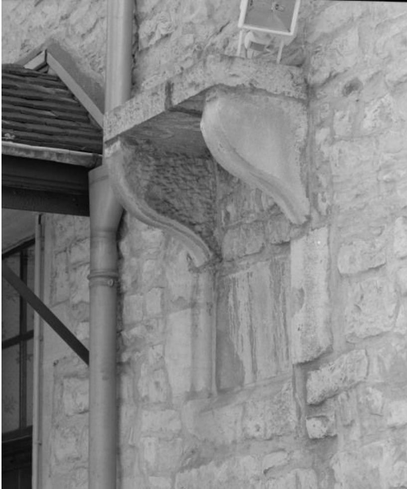
Bâtiment dit de l'administration, détail : consoles encore en place dans le mur postérieur. 21, Nuits-Saint-Georges Henri-Challand