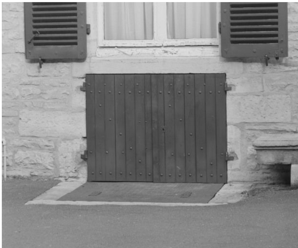
Bâtiment dit de l'administration, détail : porte d'entrée du sous-sol (élévation gauche). 21, Nuits-Saint-Georges Henri-Challand