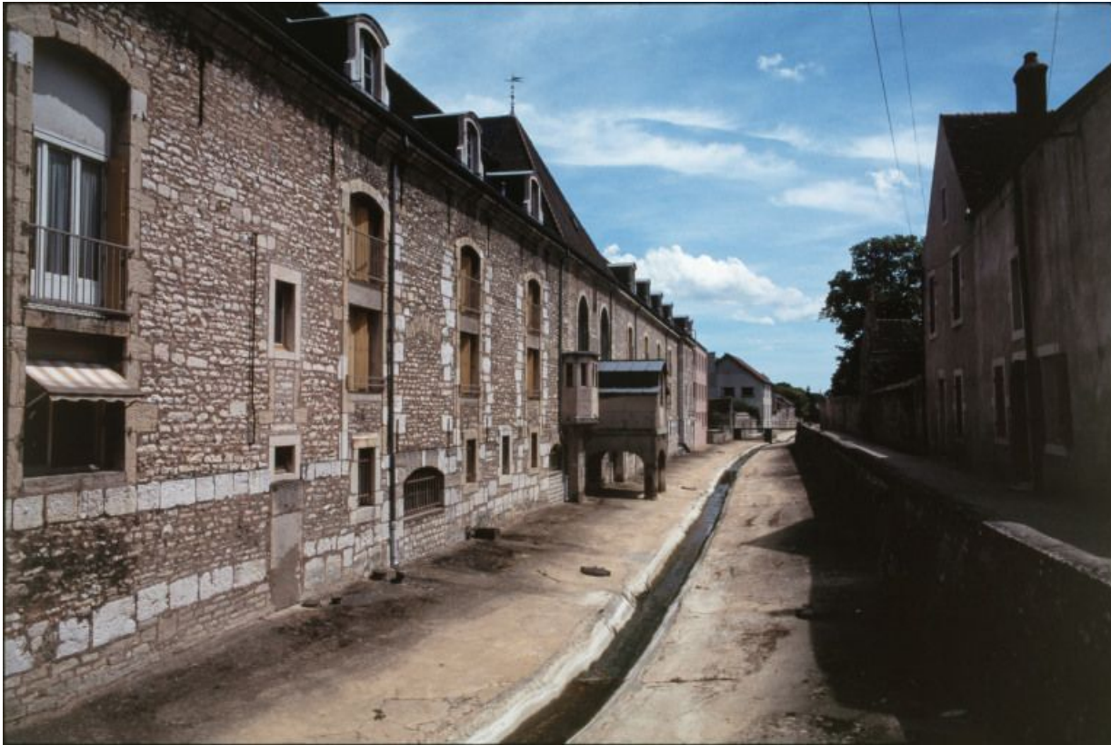
Elévation sur le Meuzin : vue d'ensemble.