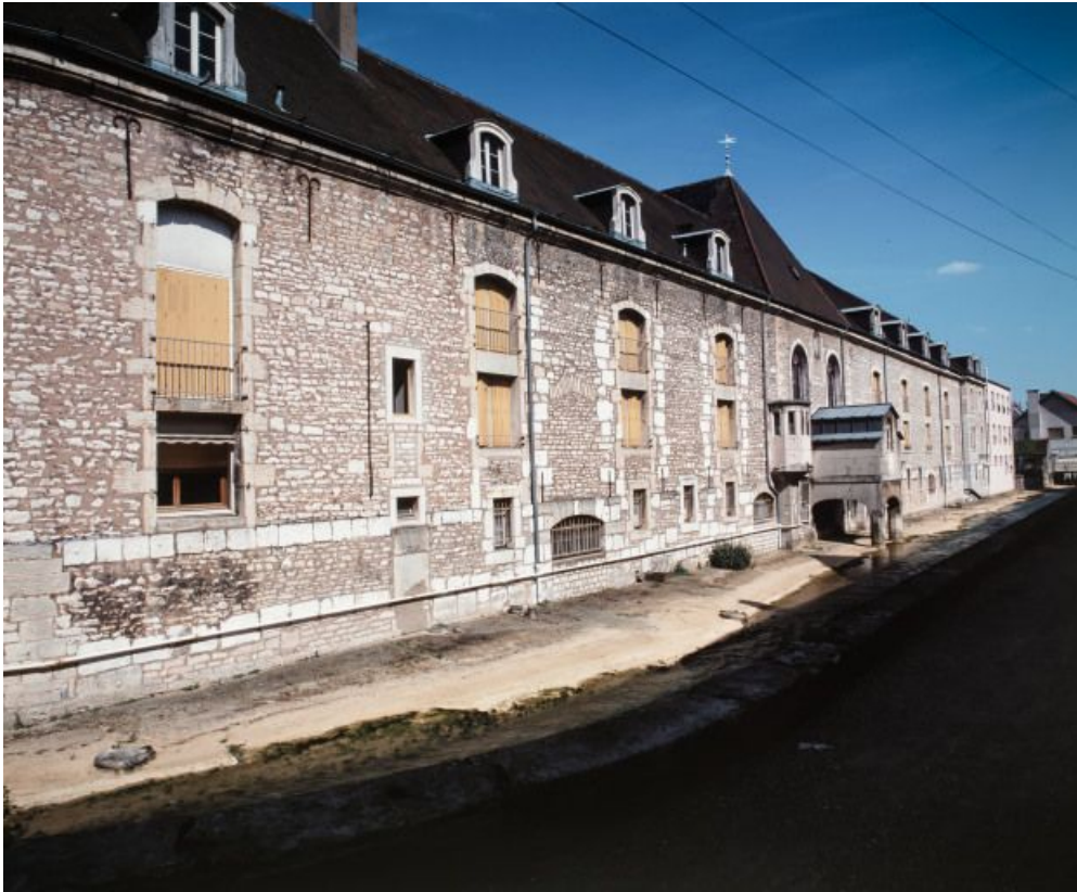
Façade postérieure des salles de malades, sur le Meuzin.