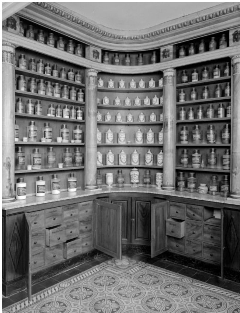
Bâtiment dit de l'administration : pharmacie, angle antérieur droit, vue d'ensemble avec portes des placards ouvertes et tiroirs à plantes médicinales.