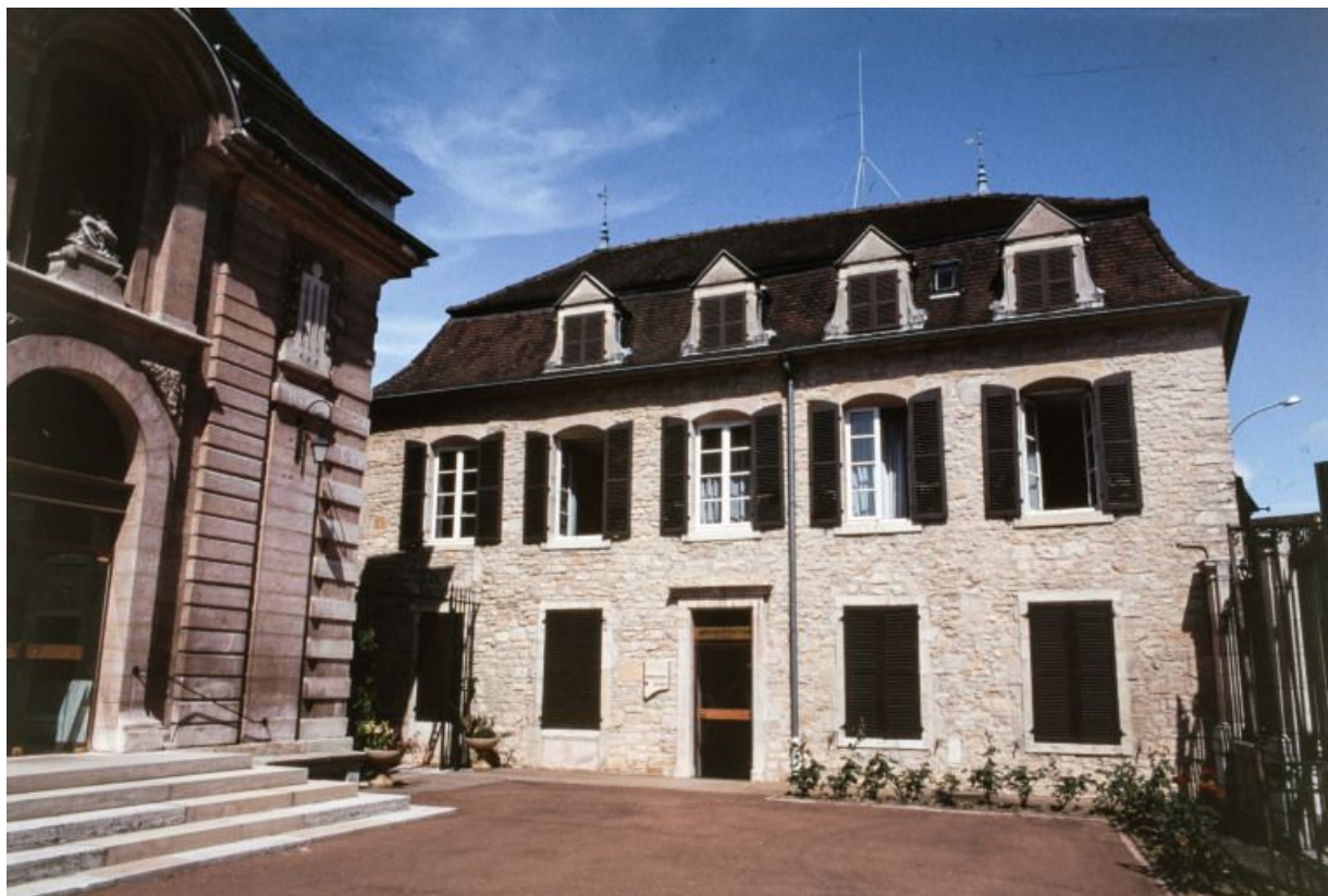
Bâtiment dit de l'administration : élévation antérieure.