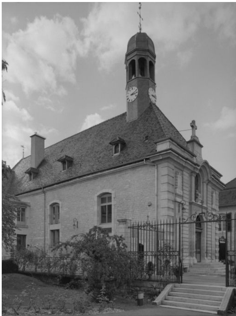
Elévations antérieure et gauche de la salle Saint-Laurent.