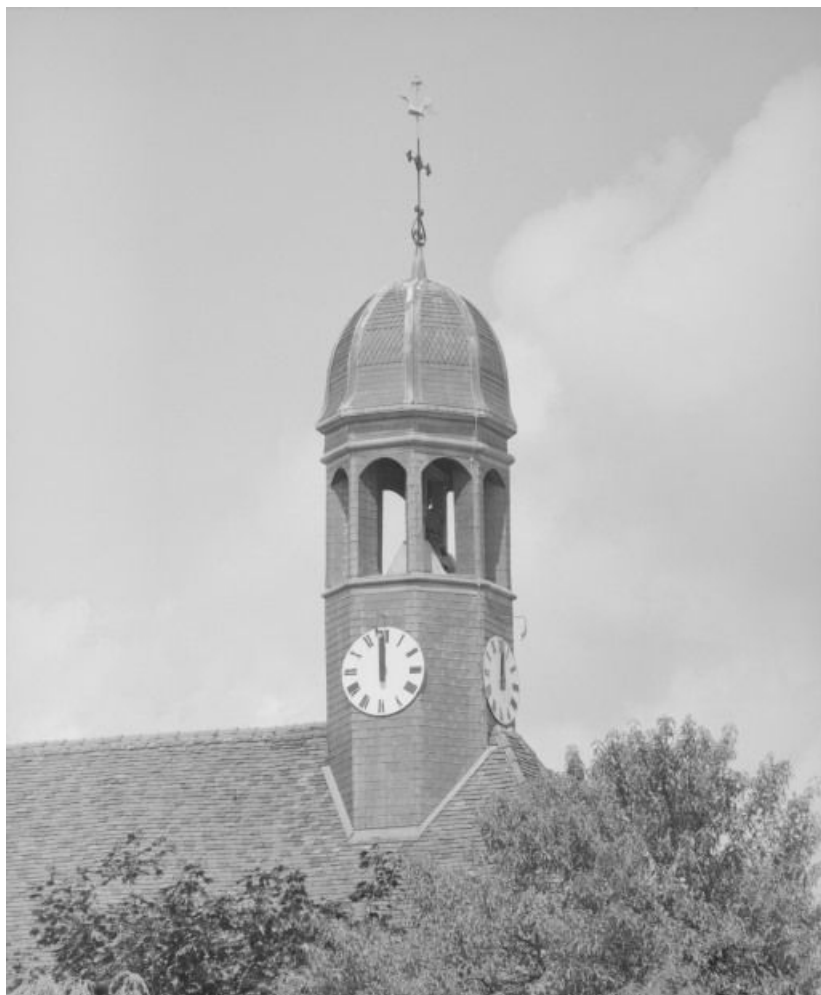
Salle Saint-Laurent, détail : campanile.