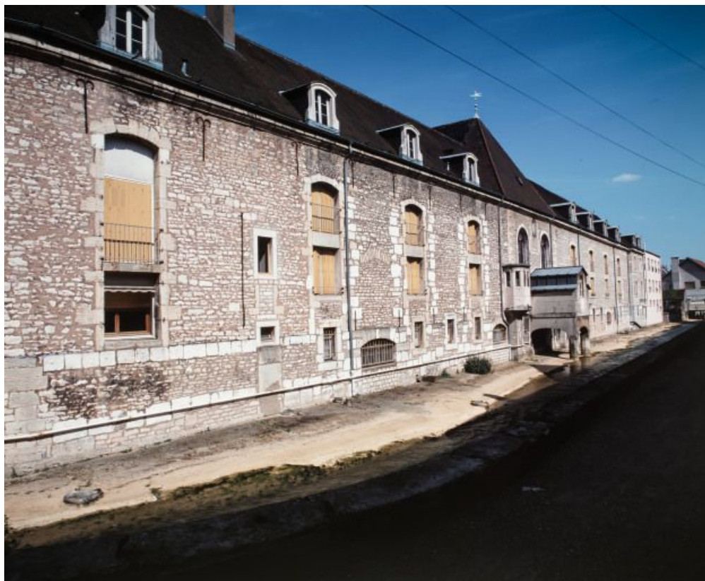
Façade postérieure des salles de malades, sur le Meuzin.