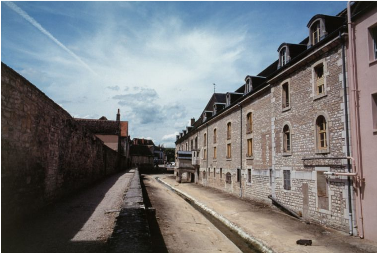
Elévation sur le Meuzin : vue d'ensemble.