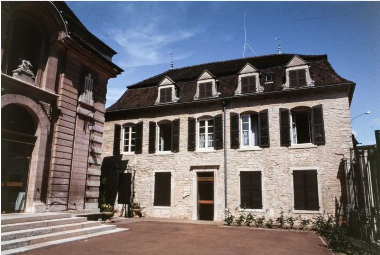
Bâtiment dit de l'administration : élévation antérieure.