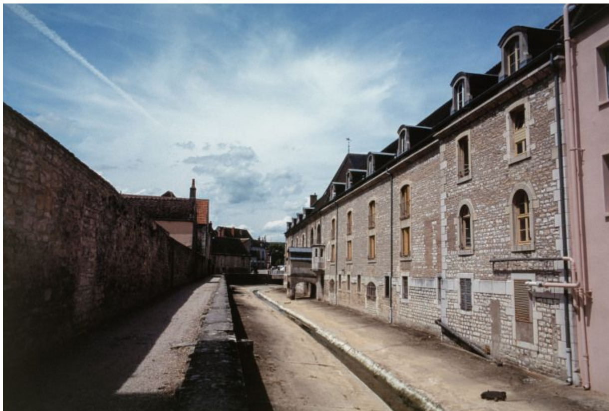
Élévation sur le Meuzin : vue d'ensemble.