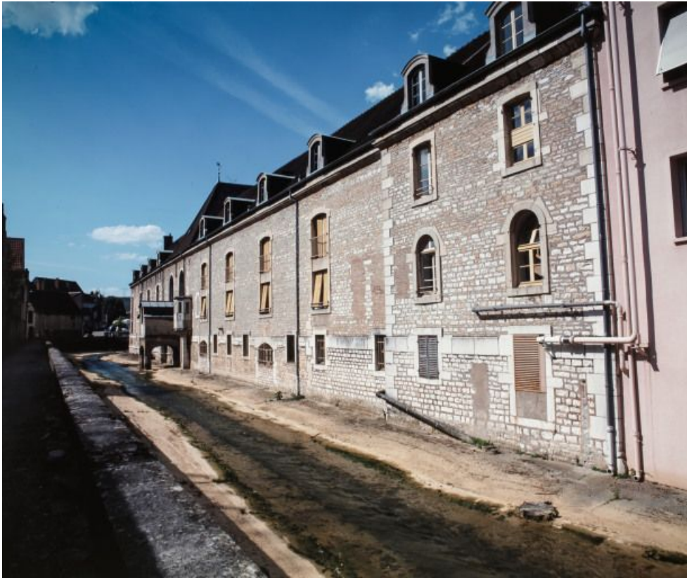
Façade postérieure des salles de malades, sur le Meuzin.