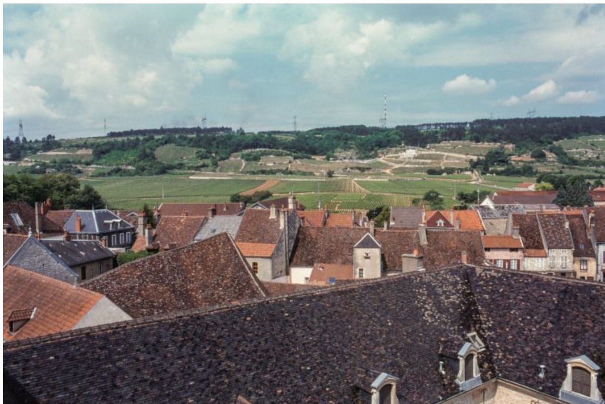
Vue depuis les toits sur la commune et les côtes.