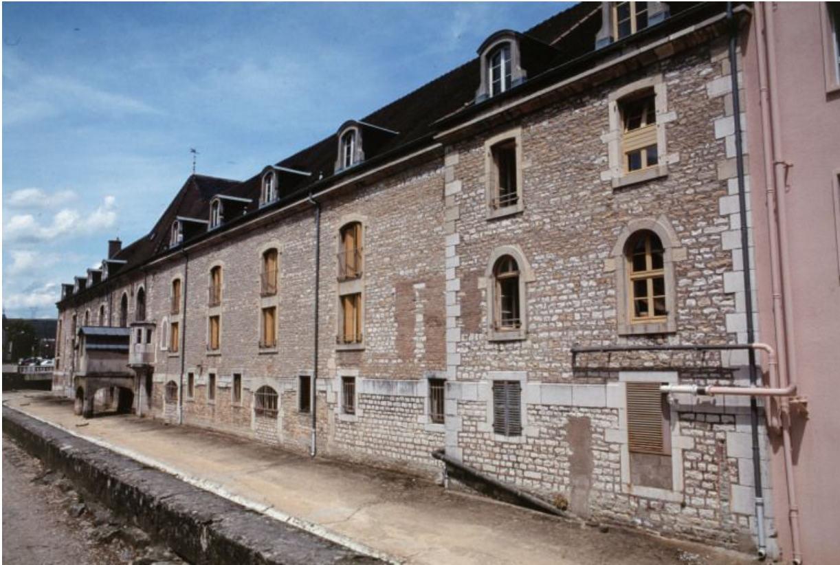
Élévation sur le Meuzin : vue d'ensemble.