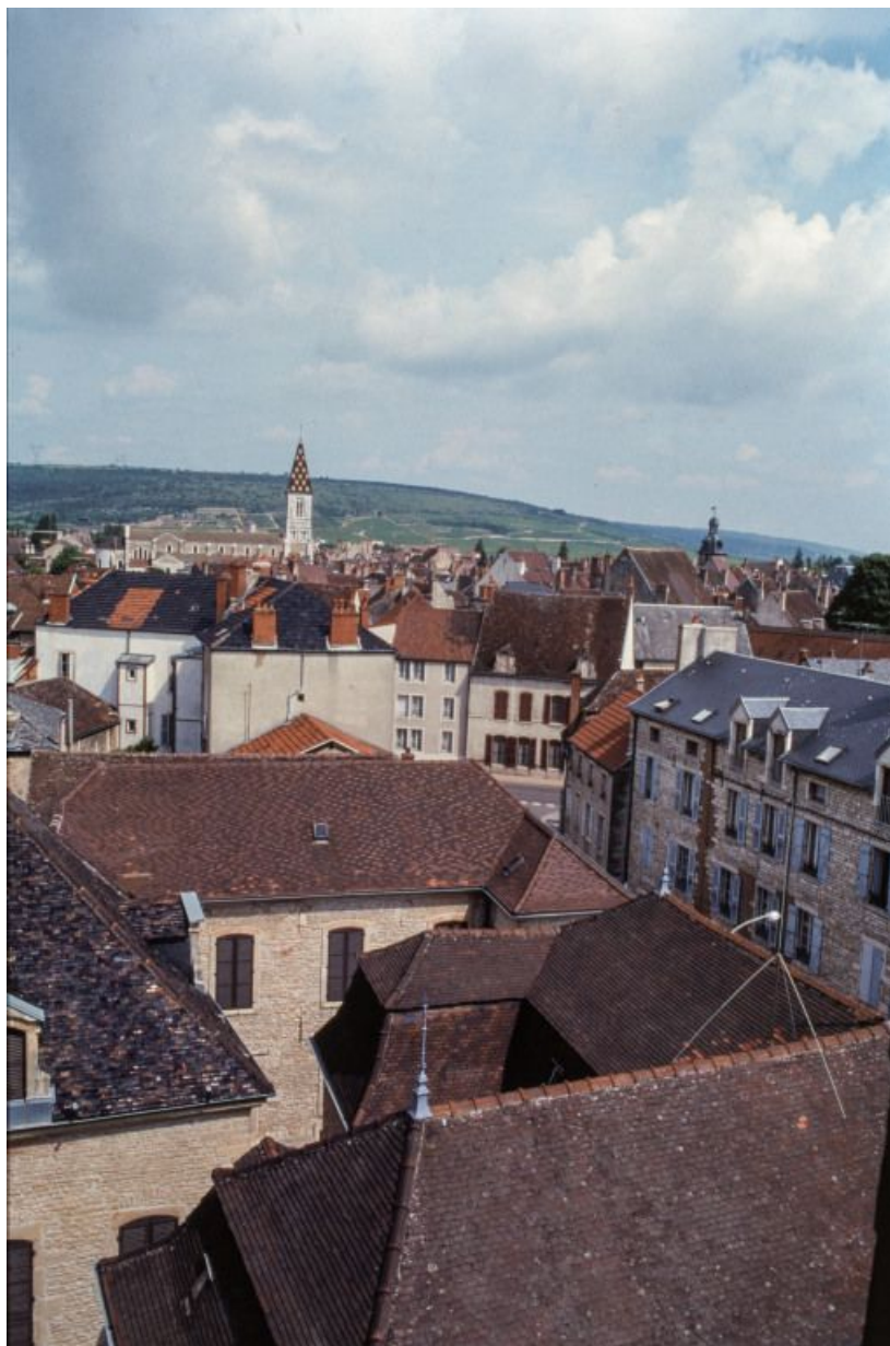
Vue depuis les toits sur la commune et les côtes.