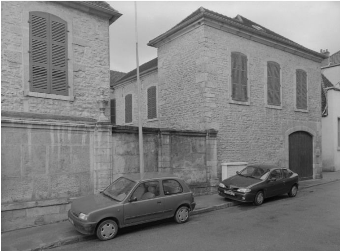
Bâtiment de la cuverie : élévation sur la rue.