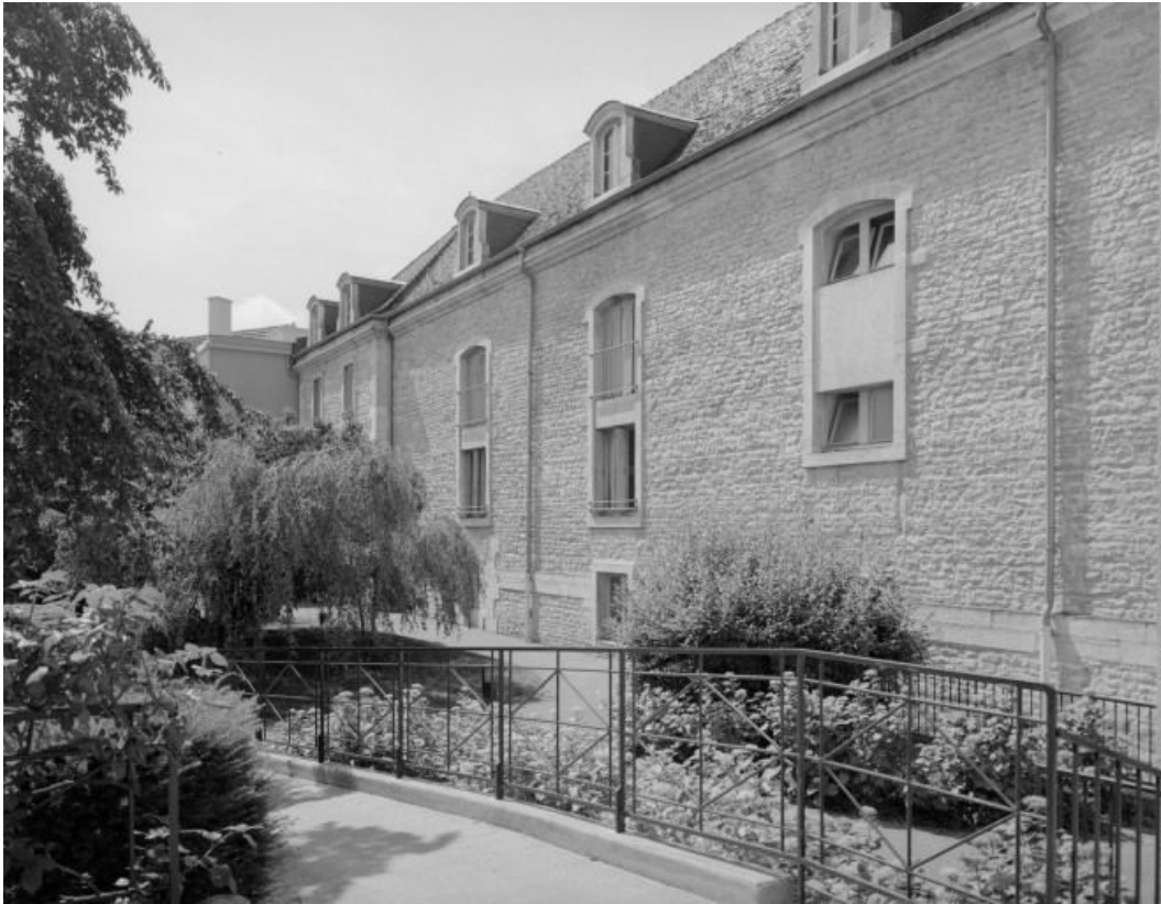
Salles Saint-Joseph et Saint-Etienne : élévation sur le jardin.