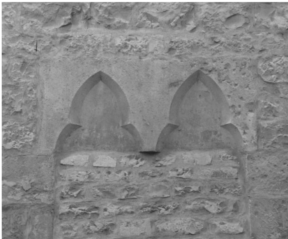
Bâtiment dit de l'administration : vestiges de baies jumelées murées (élévation droite sur la rue). 21, Nuits-Saint-Georges Henri-Challand