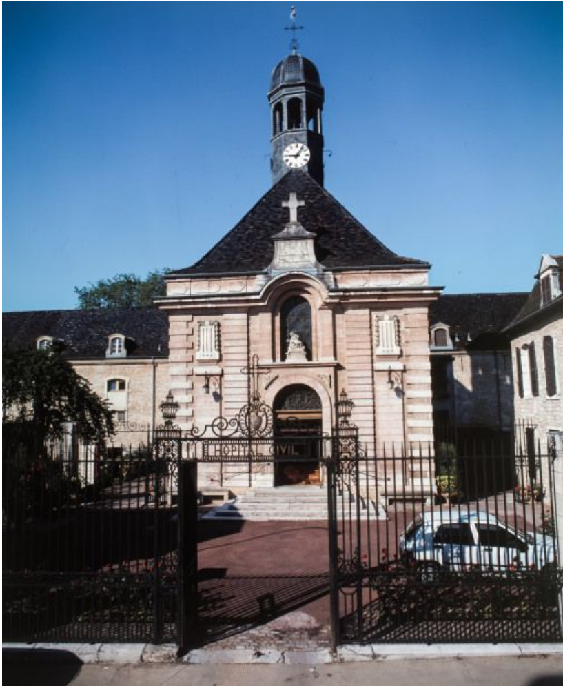
Ancienne salle Saint-Laurent.