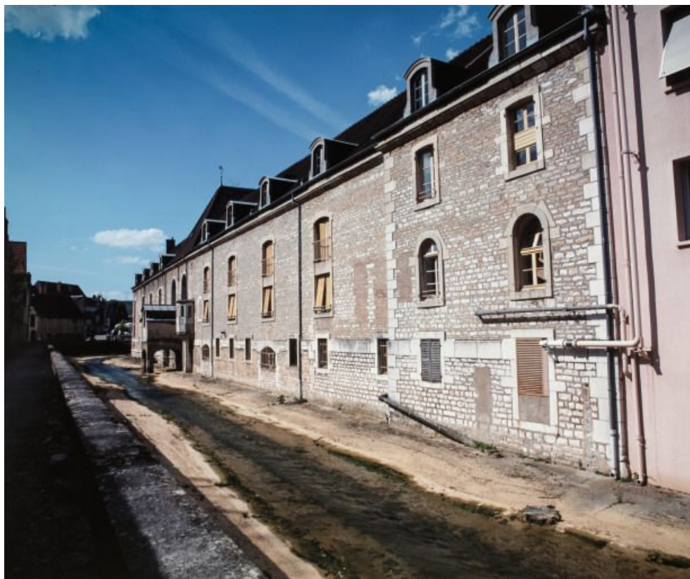
Façade postérieure des salles de malades, sur le Meuzin.