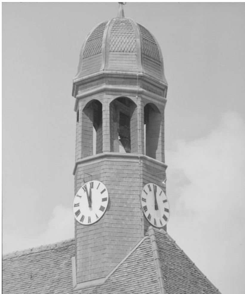
Salle Saint-Laurent, détail : campanile.