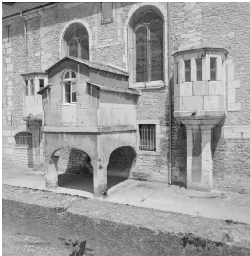
Élévation sur le Meuzin, détail : sacristie et latrines.