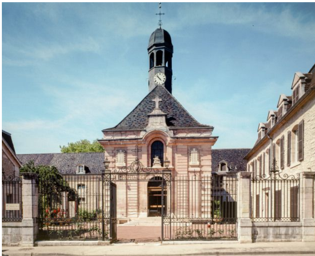
Élévation antérieure de la salle Saint-Laurent, grille d'entrée et bâtiment dit de l'administration. 21, Nuits-Saint-Georges Henri-Challand