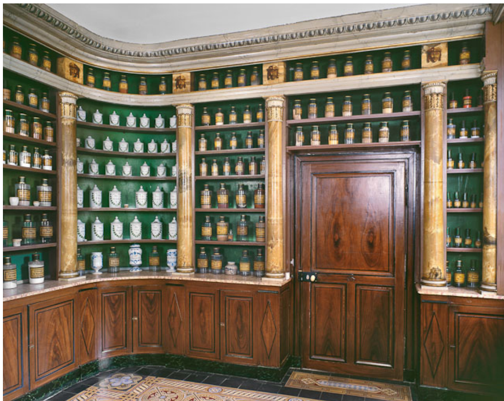
Bâtiment dit de l'administration : pharmacie, mur antérieur et porte d'entrée. 21, Nuits-Saint-Georges Henri-Challand