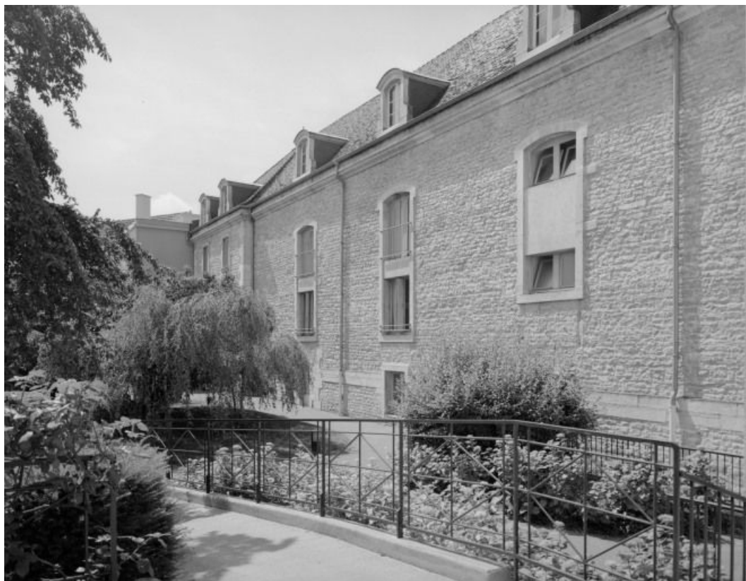
Salles Saint-Joseph et Saint-Etienne : élévation sur le jardin.