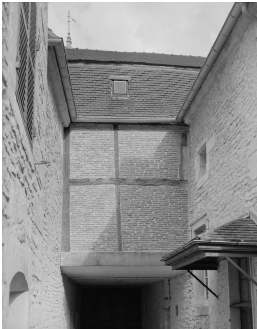
Bâtiment dit de l'administration : passage couvert.