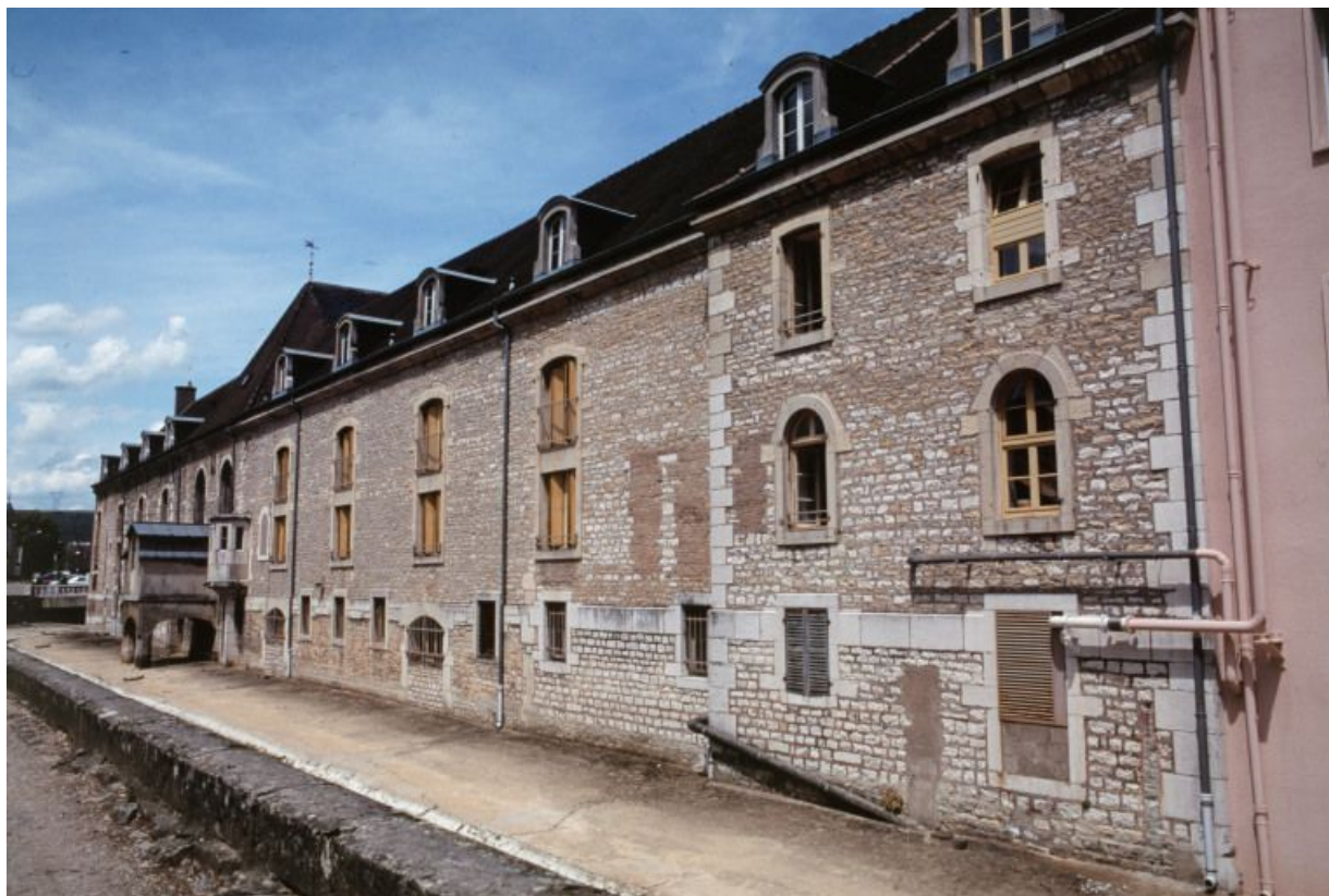
Élévation sur le Meuzin : vue d'ensemble.