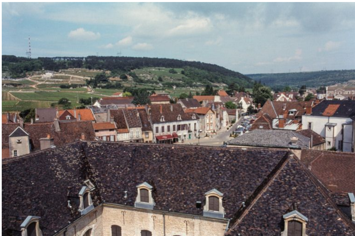
Vue depuis les toits sur la commune et les côtes.