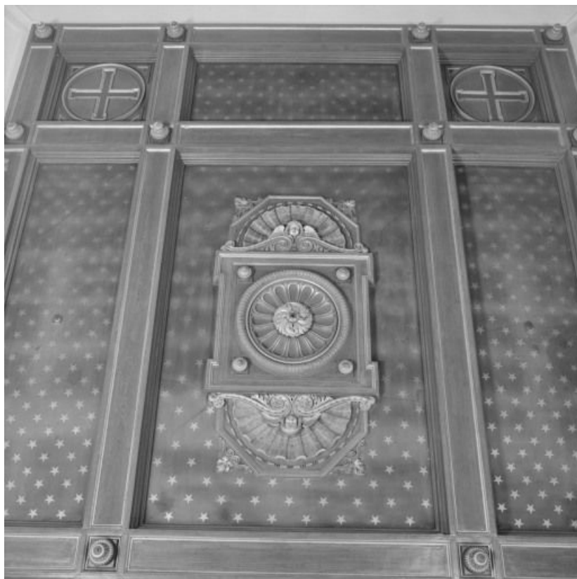
Intérieur de la chapelle : plafond à caissons.