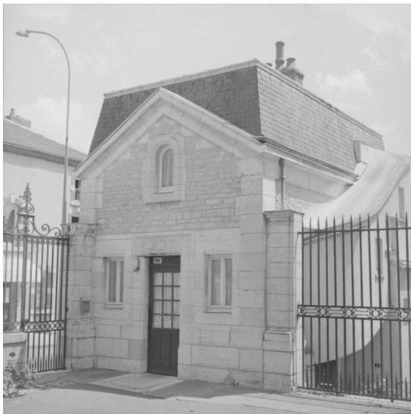
Loge de concierge : élévation sur la cour d'entrée.