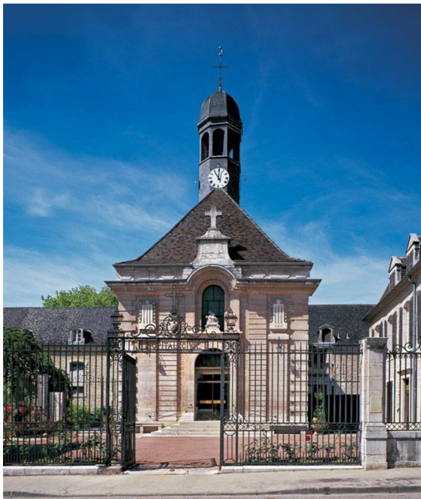
Façade antérieure de la salle Saint-Laurent et grille d'entrée.