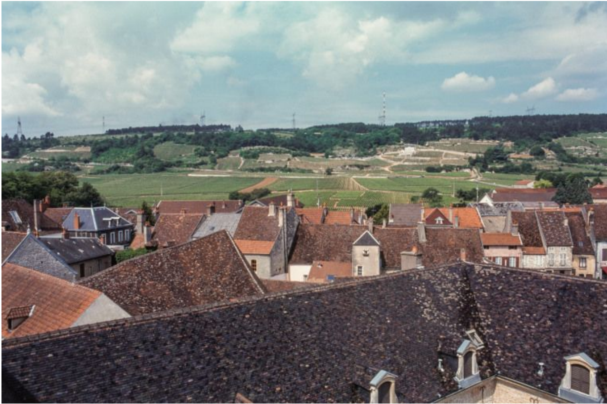
Vue depuis les toits sur la commune et les côtes.