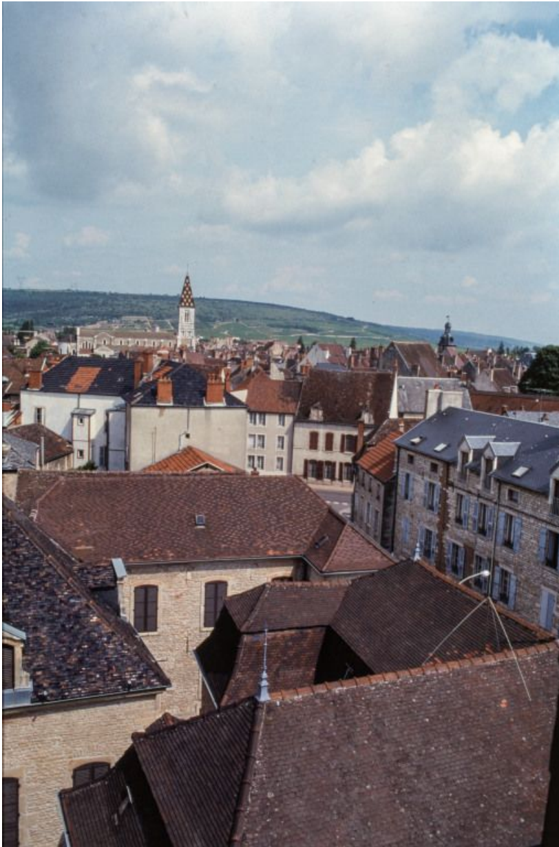
Vue depuis les toits sur la commune et les côtes.