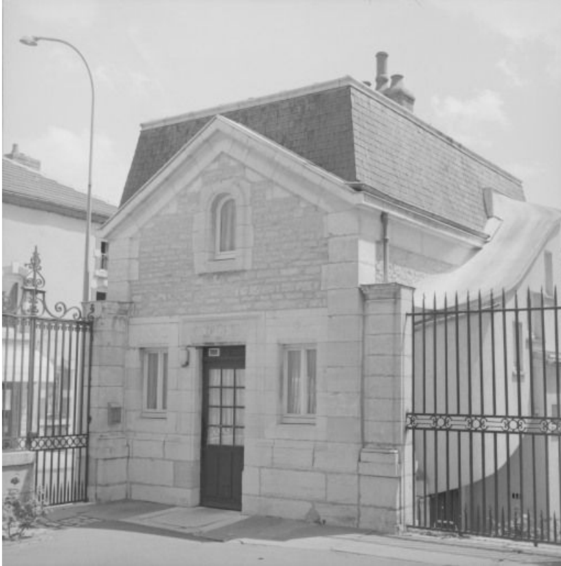
Loge de concierge : élévation sur la cour d'entrée.