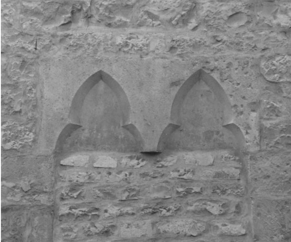
Bâtiment dit de l'administration : vestiges de baies jumelées murées (élévation droite sur la rue). 21, Nuits-Saint-Georges Henri-Challand