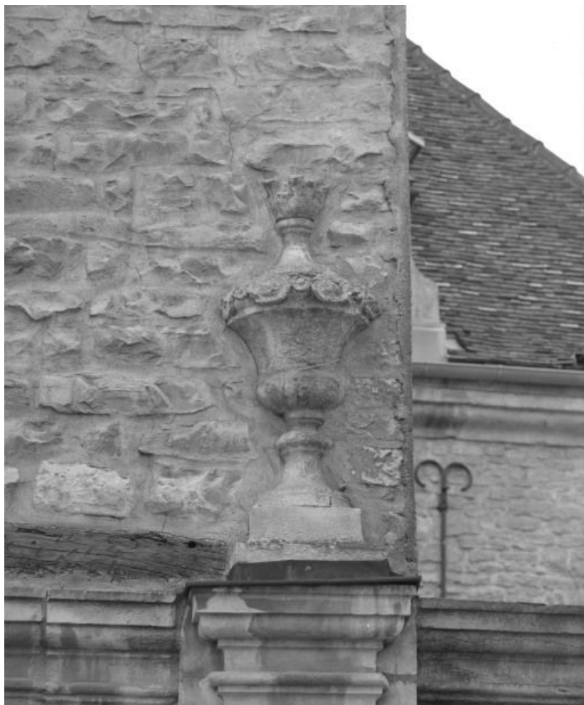
Bâtiment dit de l'administration : vase en pierre de l'ancien mur de clôture de l'hôpital. 21, Nuits-Saint-Georges Henri-Challand