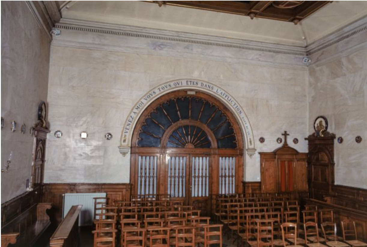
Intérieur de la chapelle : mur postérieur. 21, Nuits-Saint-Georges Henri-Challand