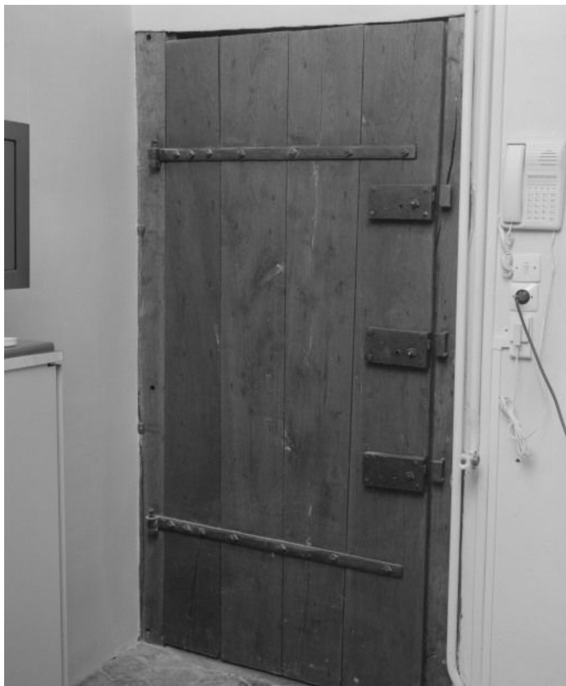
Bâtiment dit de l'administration : salle des archives, porte d'entrée (face intérieure). 21, Nuits-Saint-Georges Henri-Challand