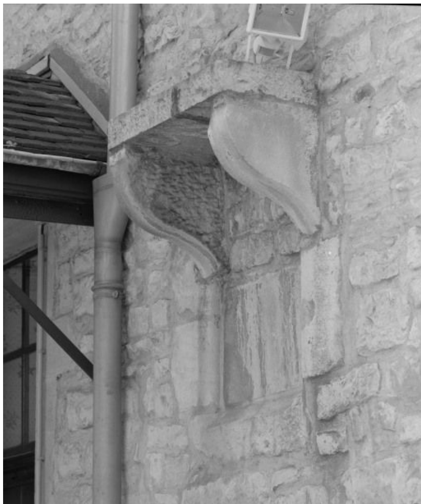
Bâtiment dit de l'administration, détail : consoles encore en place dans le mur postérieur. 21, Nuits-Saint-Georges Henri-Challand