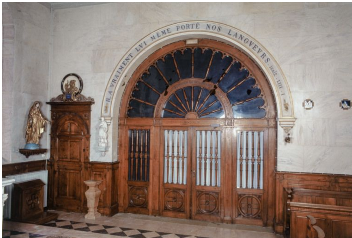
Intérieur de la chapelle : mur droit.