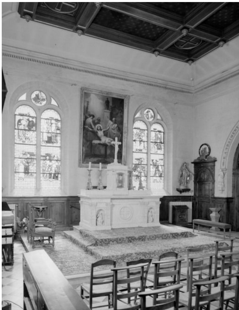
Intérieur de la chapelle : autel et mur postérieur.