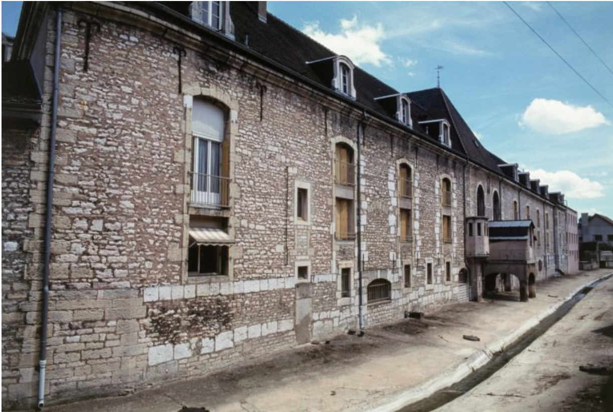
Elévation sur le Meuzin : vue d'ensemble.