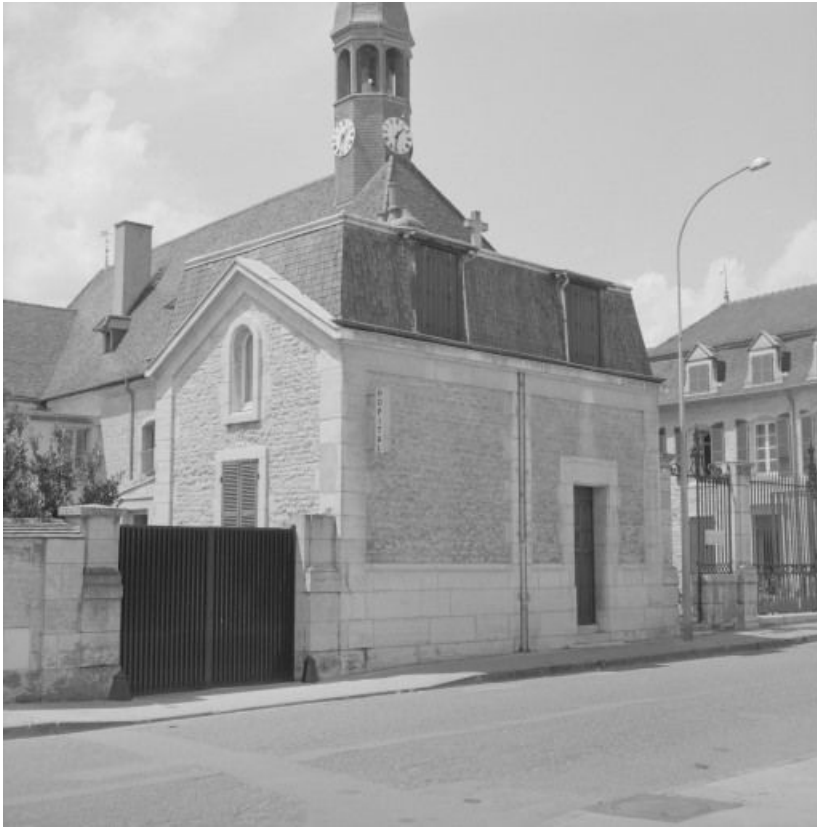
Loge de concierge : élévation sur la rue. 21, Nuits-Saint-Georges Henri-Challand