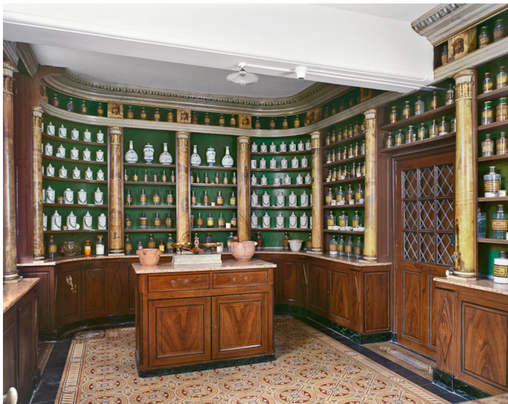
Bâtiment dit de l'administration : pharmacie vue depuis l'entrée.