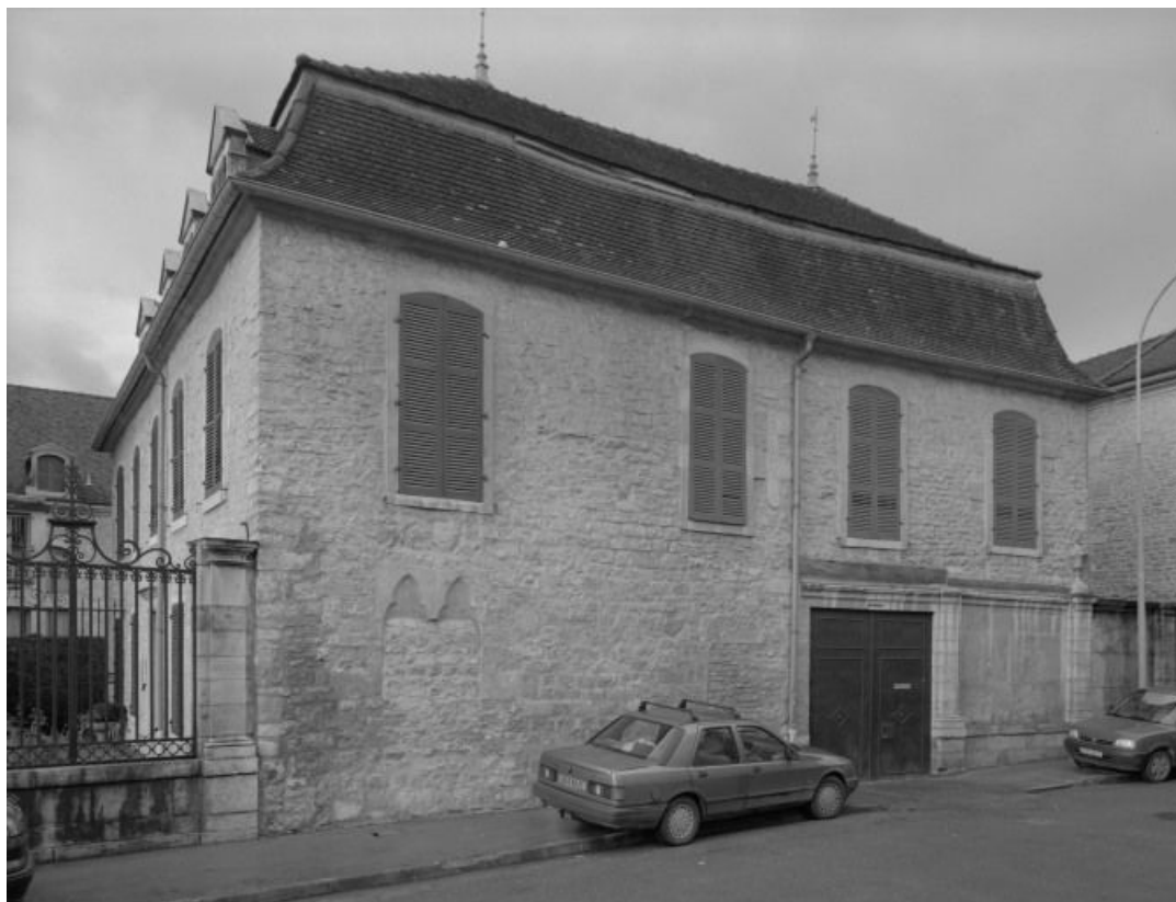
Bâtiment dit de l'administration : élévation droite sur la rue.