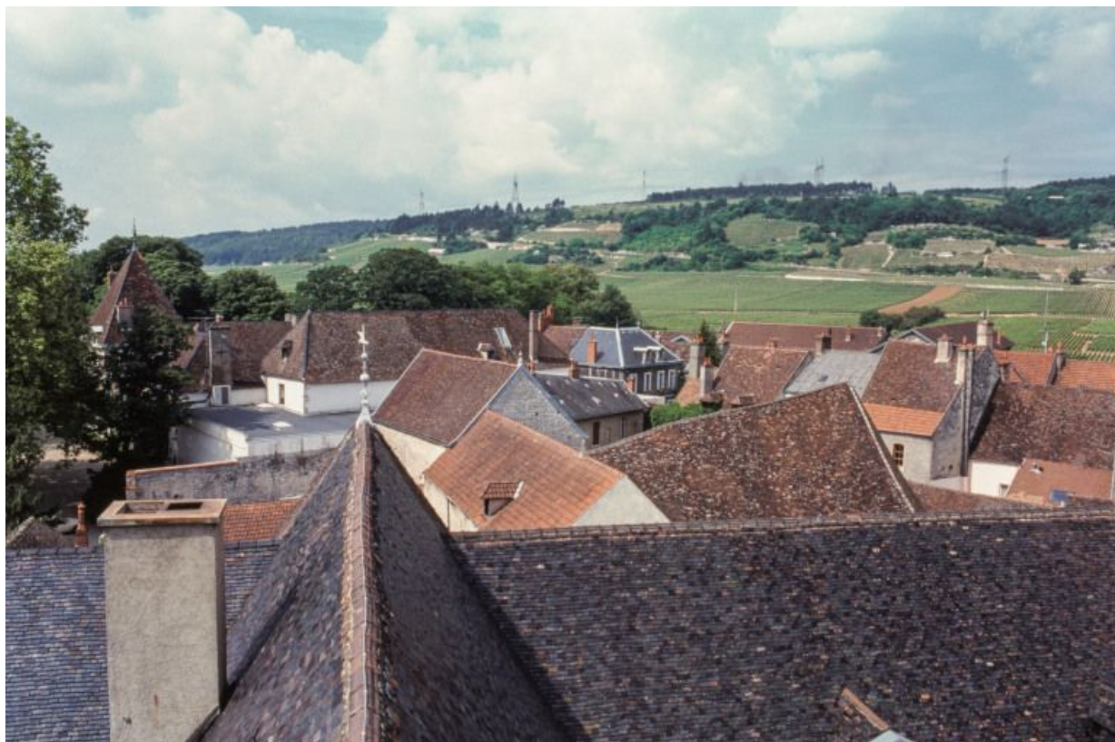
Vue depuis les toits sur la commune et les côtes.