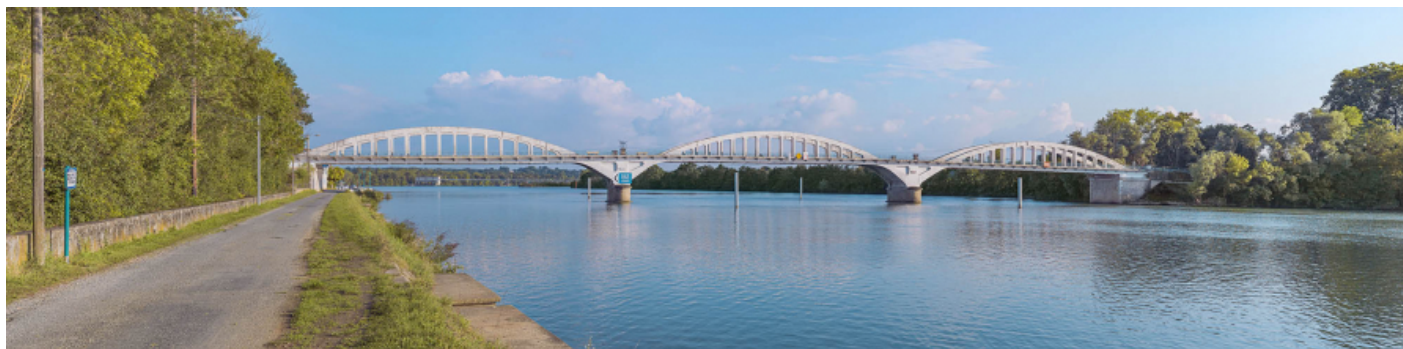
Le pont de Thoissey, vu d'amont depuis la rive gauche. En arrière-plan, le barrage de Dracé.

01, Thoissey route départementale 7, lieudit : PK 63,37