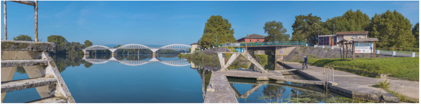
Le pont de Thoissey et le pont sur la Chalaronne, vus d'aval, depuis la rive gauche.

01, Thoissey route départementale 7, lieu-dit : PK 63,37