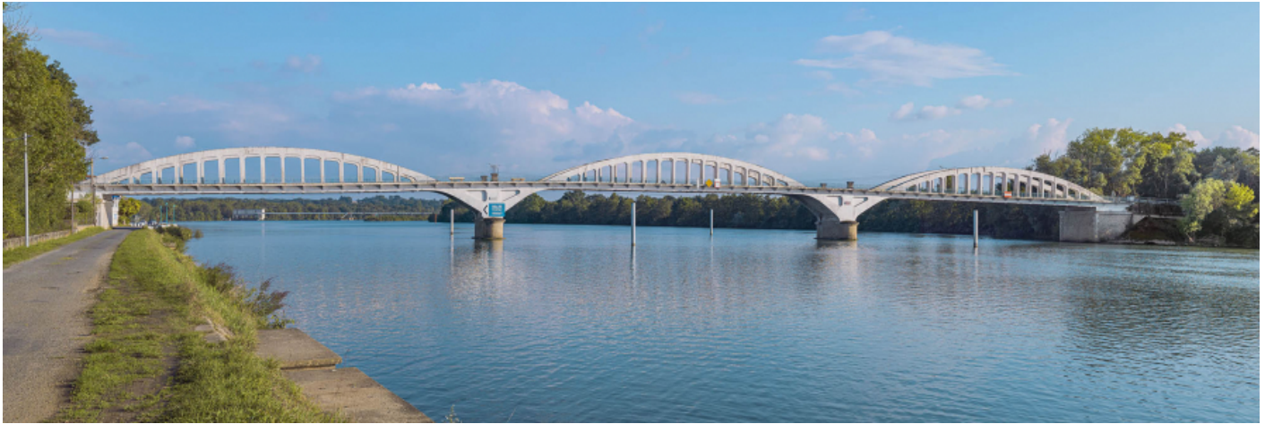
Le pont de Thoissey, vu d'amont depuis la rive gauche. En arrière-plan, le barrage de Dracé. 01, Thoissey route départementale 7, lieu-dit : PK 63,37