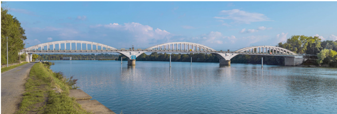
Le pont de Thoissey, vu d'amont depuis la rive gauche. En arrière-plan, le barrage de Dracé.

01, Thoissey route départementale 7, lieu-dit : PK 63,37