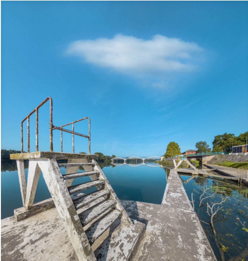
Le pont de Thoissey et le pont sur la Chalaronne, vus d'aval, depuis la rive gauche. 01, Thoissey route départementale 7, lieudit : PK 63,37