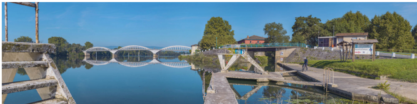
Le pont de Thoissey et le pont sur la Chalaronne, vus d'aval, depuis la rive gauche.

01, Thoissey route départementale 7, lieu-dit : PK 63,37