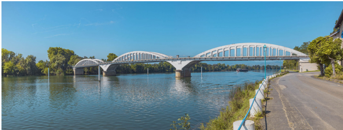
Le pont de Thoissey, vu d'aval, depuis la rive gauche.

01, Thoissey route départementale 7, lieudit : PK 63,37