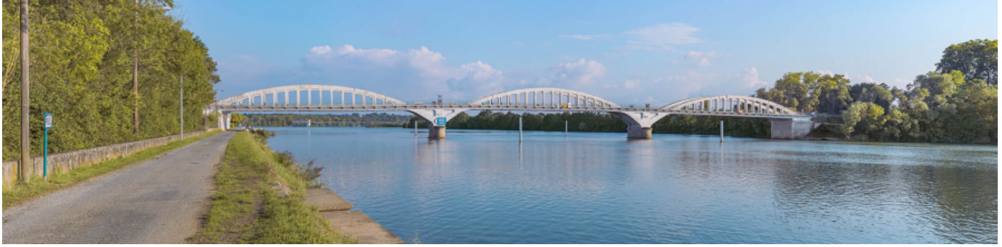
Le pont de Thoissey, vu d'amont depuis la rive gauche. En arrière-plan, le barrage de Dracé. 01, Thoissey route départementale 7, lieudit : PK 63,37