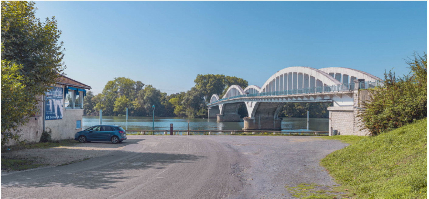
Le pont de Thoissey, vu d'aval, rive gauche.

01, Thoissey route départementale 7, lieudit : PK 63,37