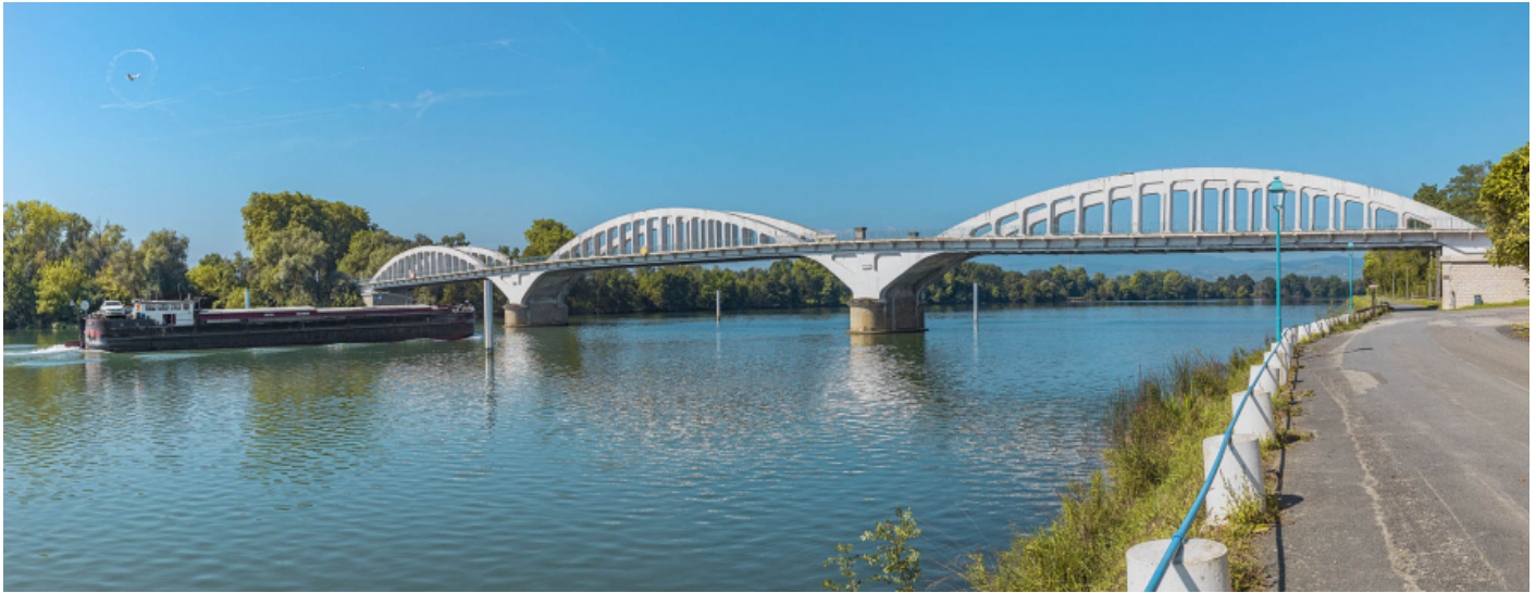
Le pont de Thoissey, vu d'aval, depuis la rive gauche.

01, Thoissey route départementale 7, lieudit : PK 63,37