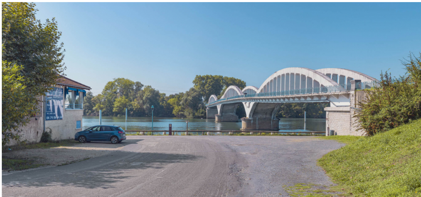
Le pont de Thoissey, vu d'aval, rive gauche.

01, Thoissey route départementale 7, lieudit : PK 63,37