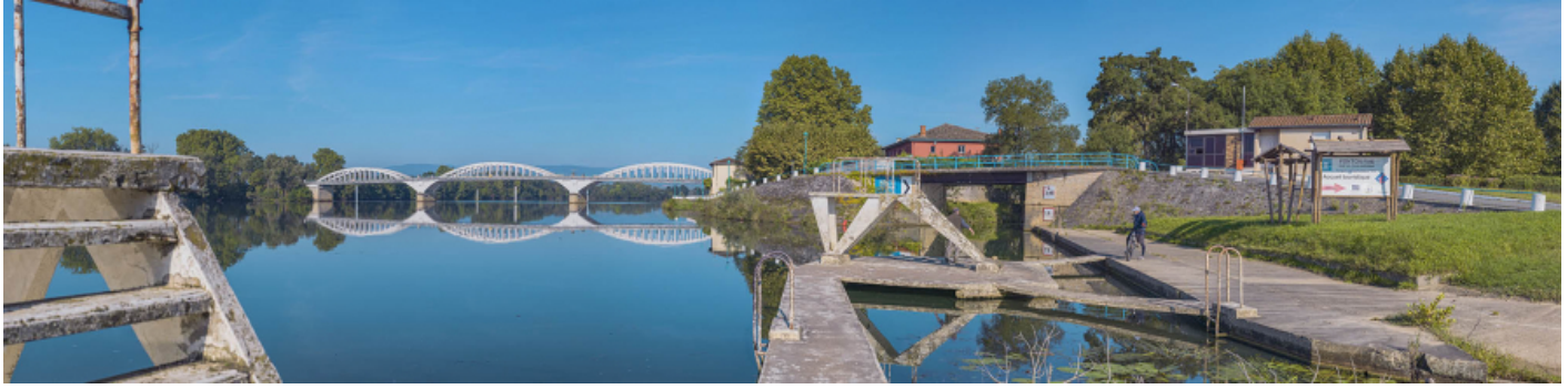
Le pont de Thoissey et le pont sur la Chalaronne, vus d'aval, depuis la rive gauche.

01, Thoissey route départementale 7, lieu-dit : PK 63,37