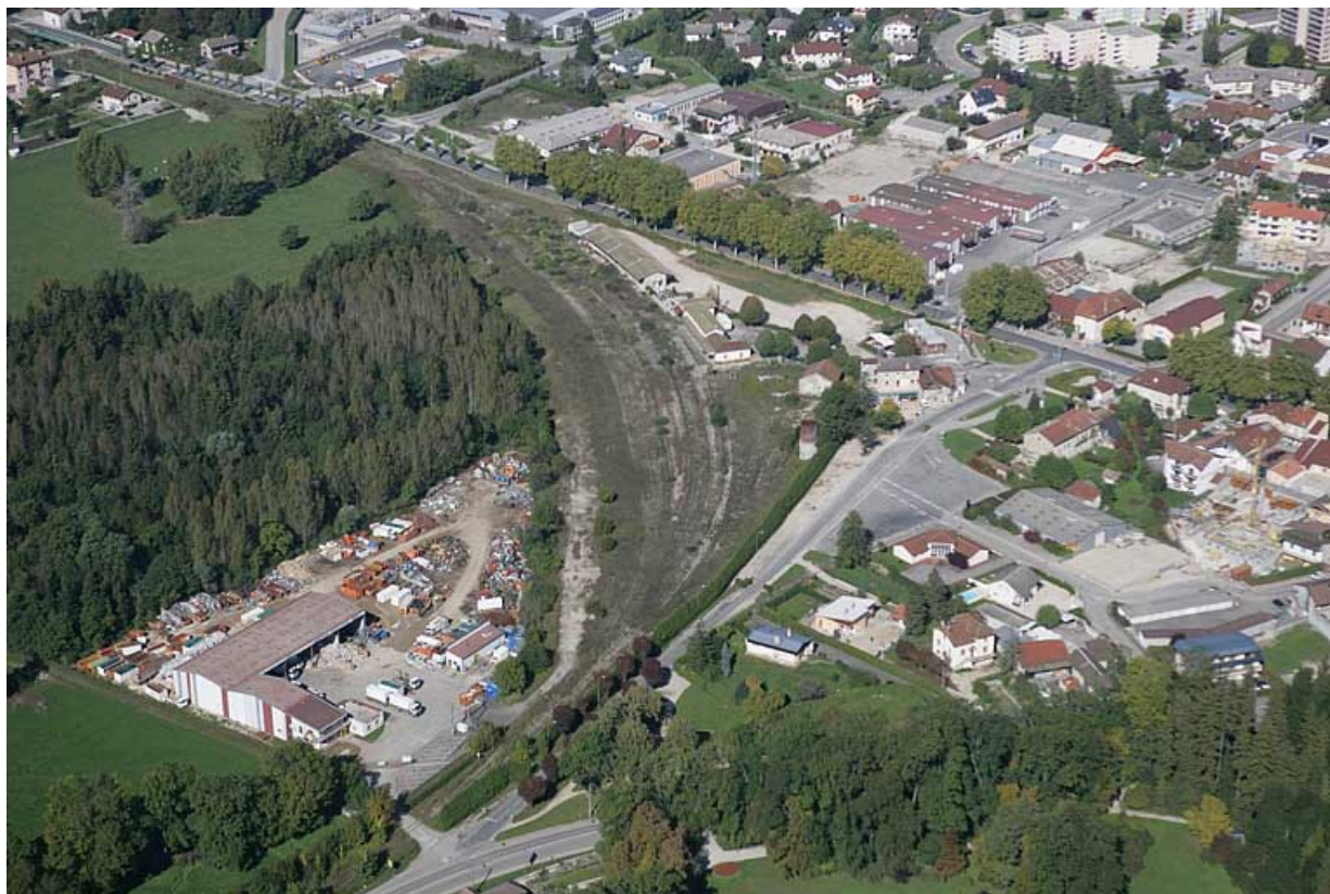
Vue aérienne du site de la gare, depuis le sud-est.