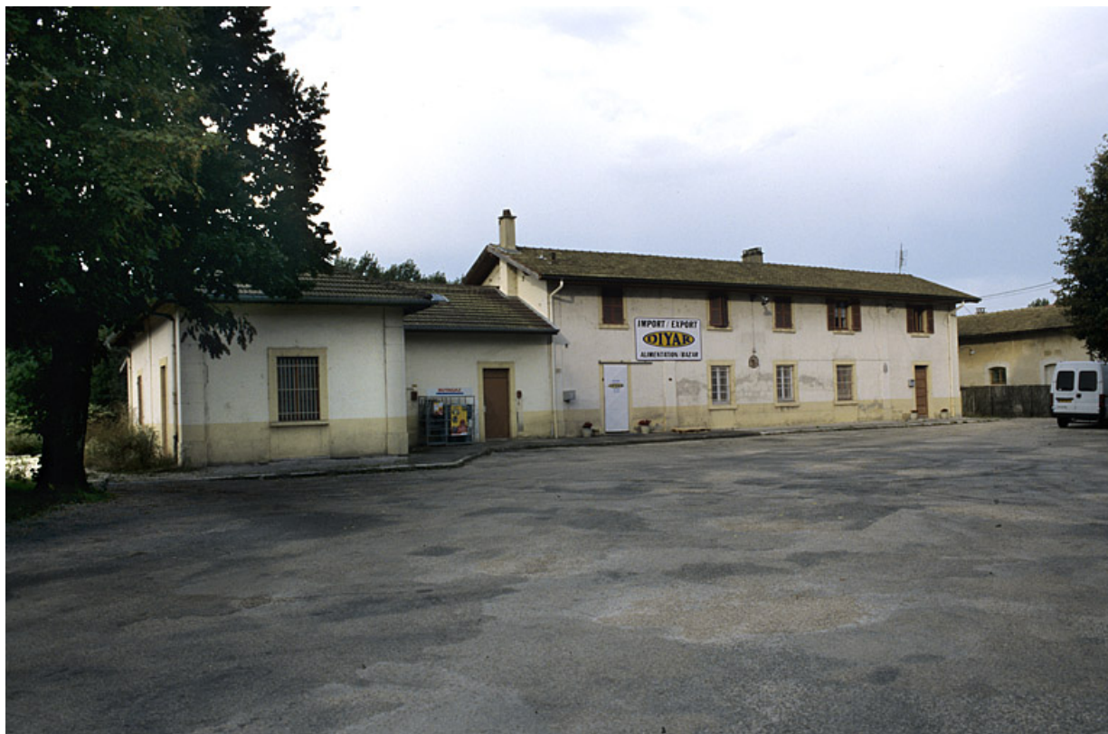
Bâtiment des voyageurs : façade antérieure, de trois quarts gauche.