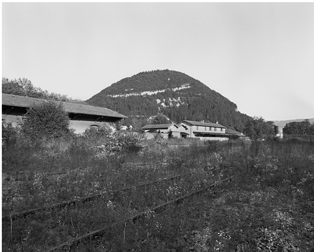
Vue d'ensemble de l'entrepôt et du site, depuis l'ouest.