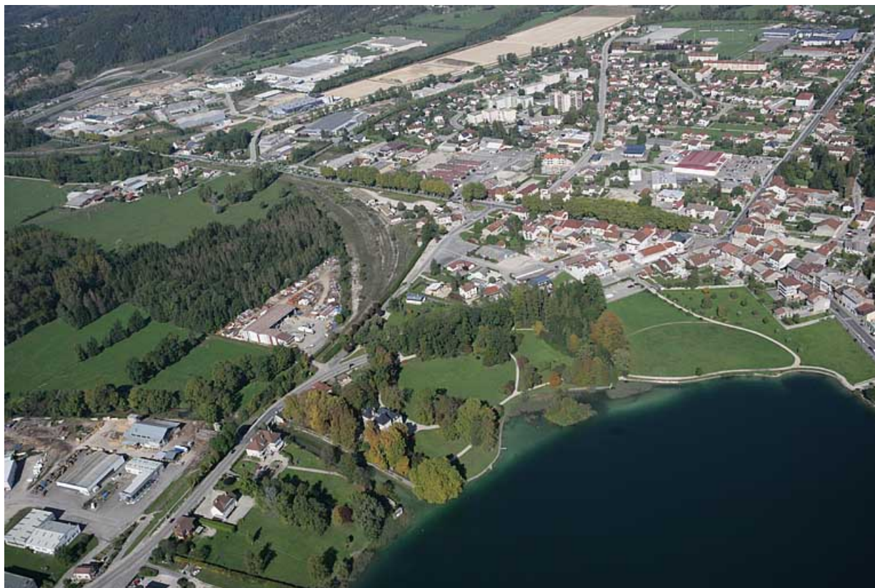
Vue aérienne rapprochée du quartier de la gare, depuis le sud-est.