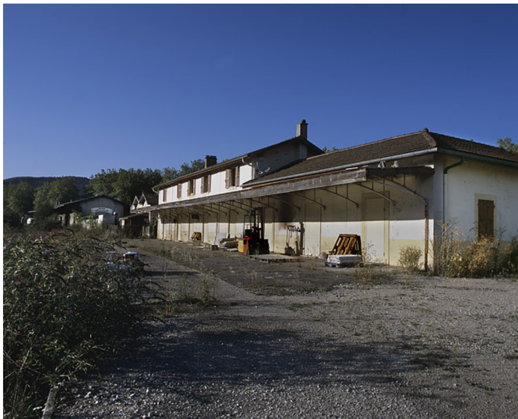
Bâtiment des voyageurs : façade postérieure, de trois quarts droite.