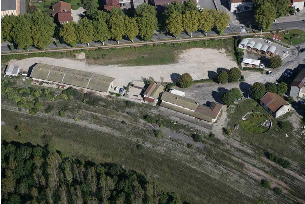
Vue aérienne des bâtiments, depuis le sud-ouest.