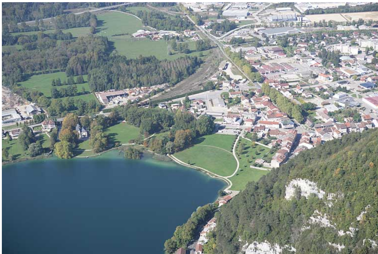
Vue aérienne du quartier de la gare, depuis l'est.