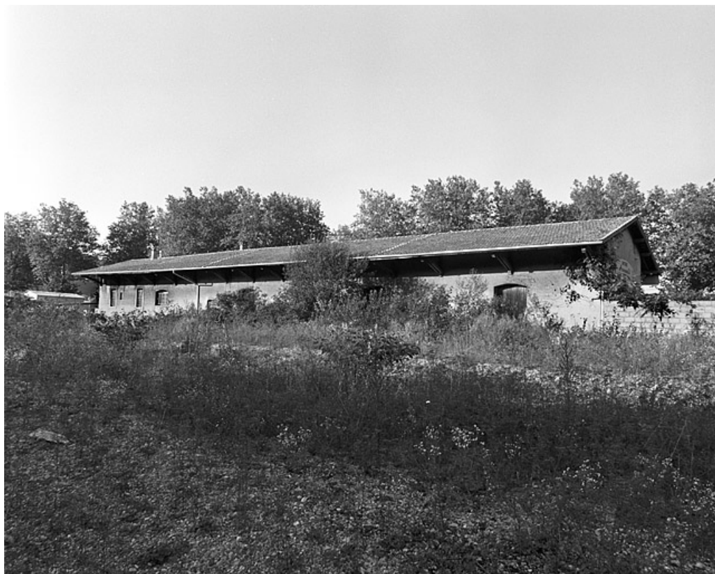
Entrepôt : façade postérieure (côté voies), de trois quarts droite.