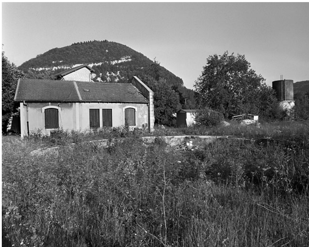
Foyer des roulants (cantine et logement), à l'arrière de la fosse du pont tournant. Bâtiment détruit fin 2005 - début 2006. 01, Montréal-la-Cluse place de la Gare