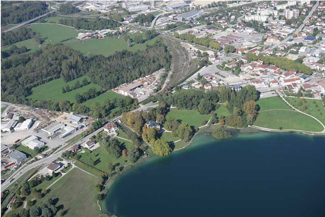
Vue aérienne rapprochée du quartier de la gare, depuis le sud-est.