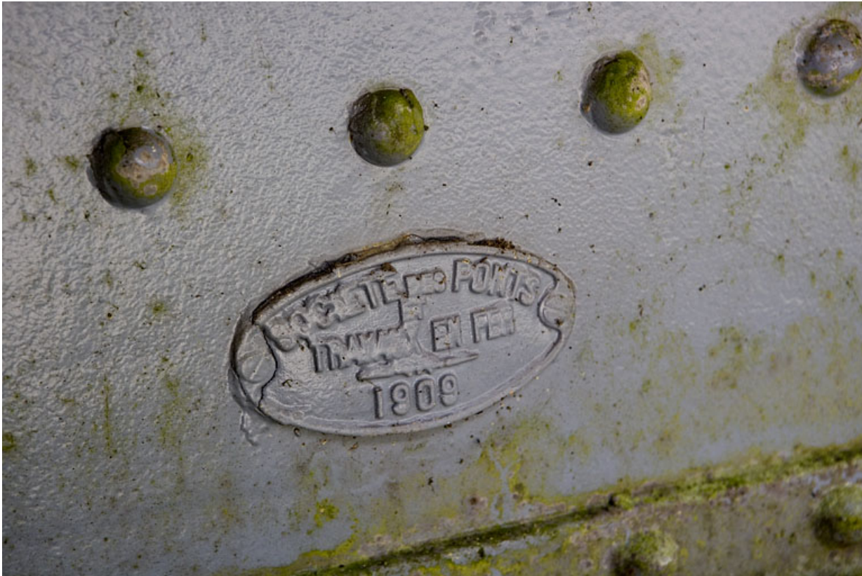
Pont : plaque du constructeur.

01, Montréal-la-Cluse V.C. 1, lieudit : Damon le Moulin