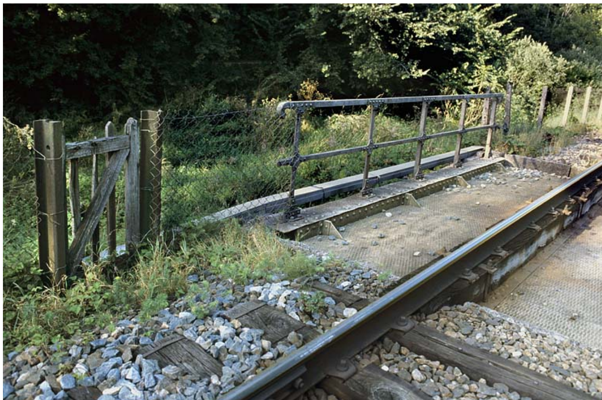
Vue d'ensemble, depuis la voie côté La Cluse (sud-ouest).

01, Montréal-la-Cluse V.C. 1, lieudit : Damon le Moulin