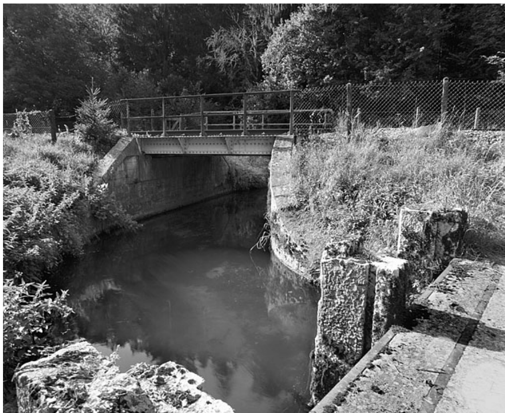
Vue d'ensemble, depuis le système de vannage à l'est.

01, Montréal-la-Cluse V.C. 1, lieudit : Damon le Moulin