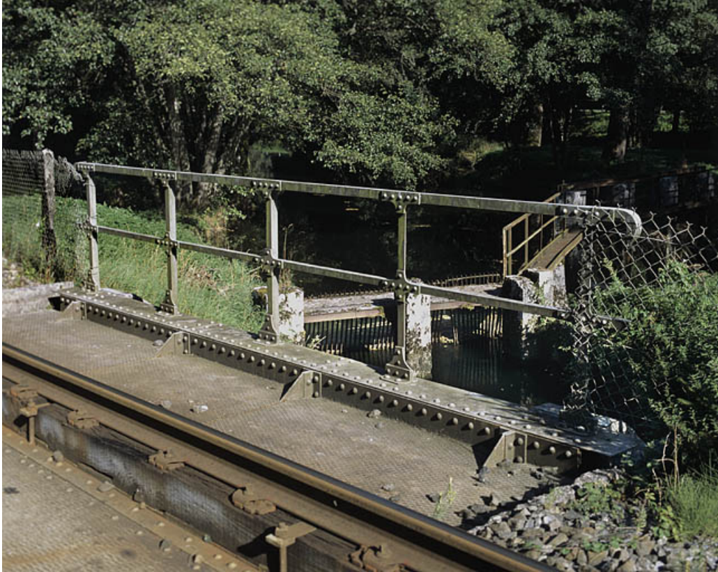
Pont : garde-corps. À l'arrière-plan, prise d'eau et vannage.

01, Montréal-la-Cluse V.C. 1, lieudit : Damon le Moulin