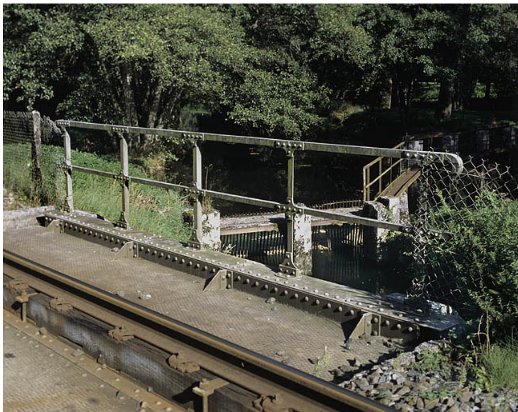
Pont : garde-corps. À l'arrière-plan, prise d'eau et vannage.

01, Montréal-la-Cluse V.C. 1, lieudit : Damon le Moulin