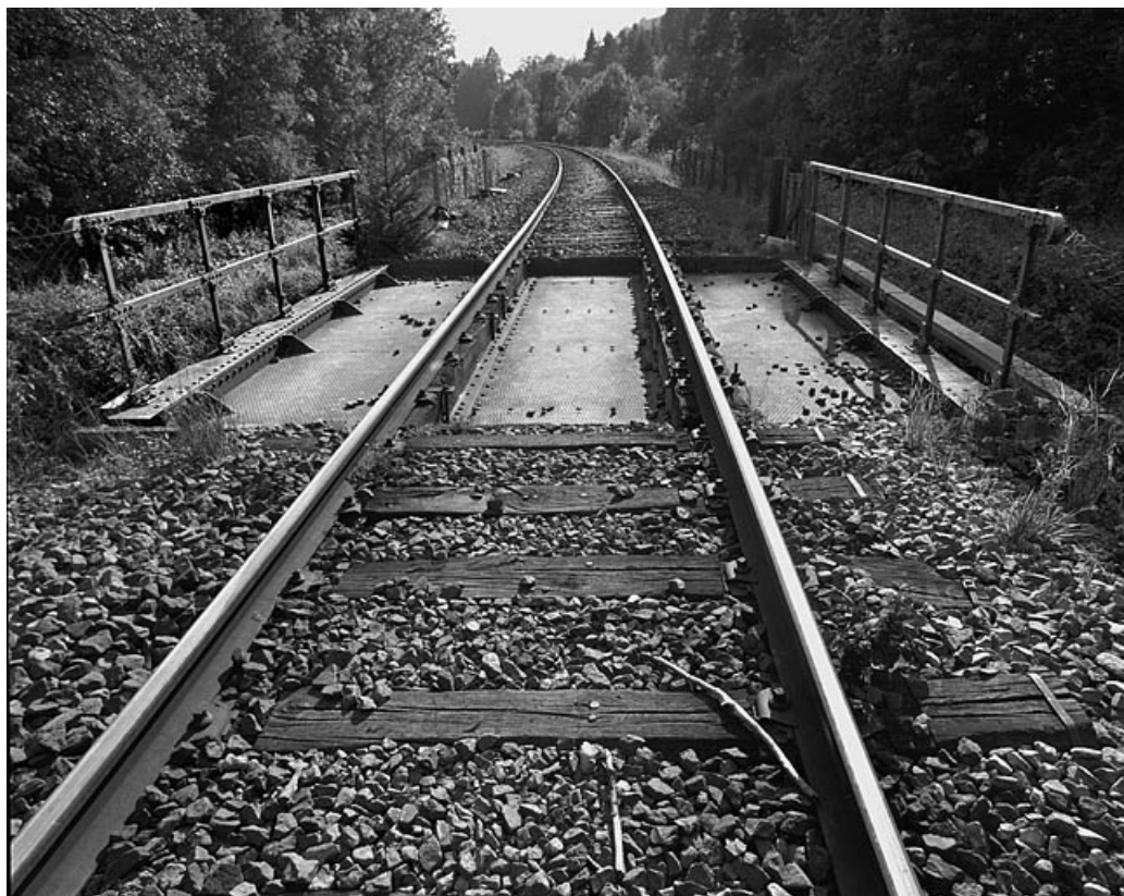
Vue d'ensemble, depuis la voie côté Andelot-en-Montagne (nord-est).

01, Montréal-la-Cluse V.C. 1, lieudit : Damon le Moulin