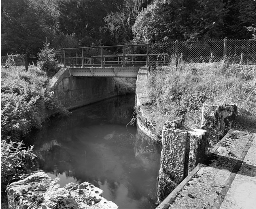
Vue d'ensemble, depuis le système de vannage à l'est.

01, Montréal-la-Cluse V.C. 1, lieudit : Damon le Moulin