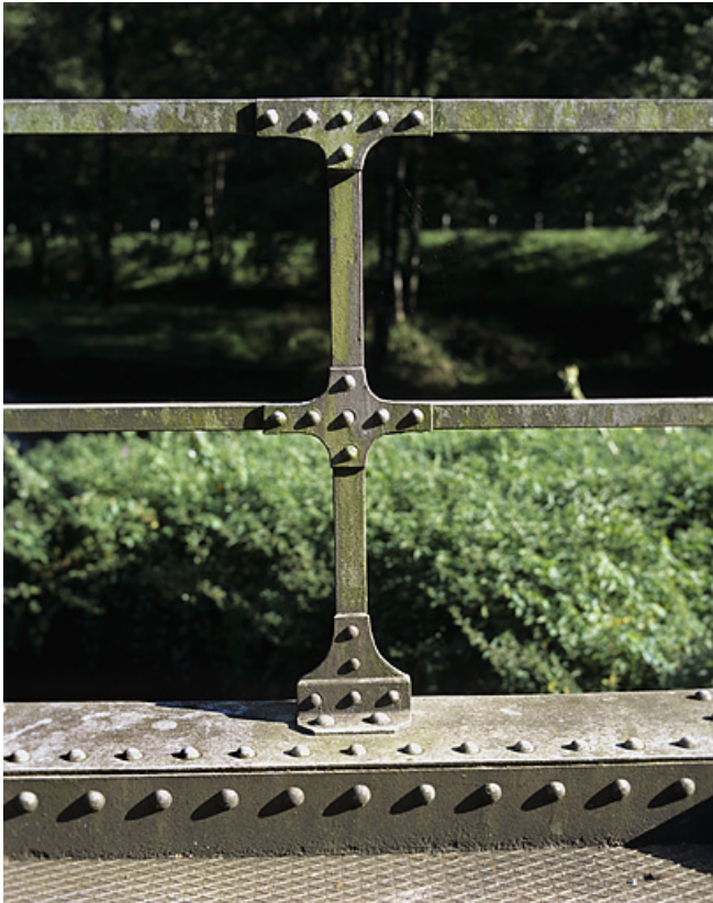
Pont : détail du garde-corps.

01, Montréal-la-Cluse V.C. 1, lieudit : Damon le Moulin