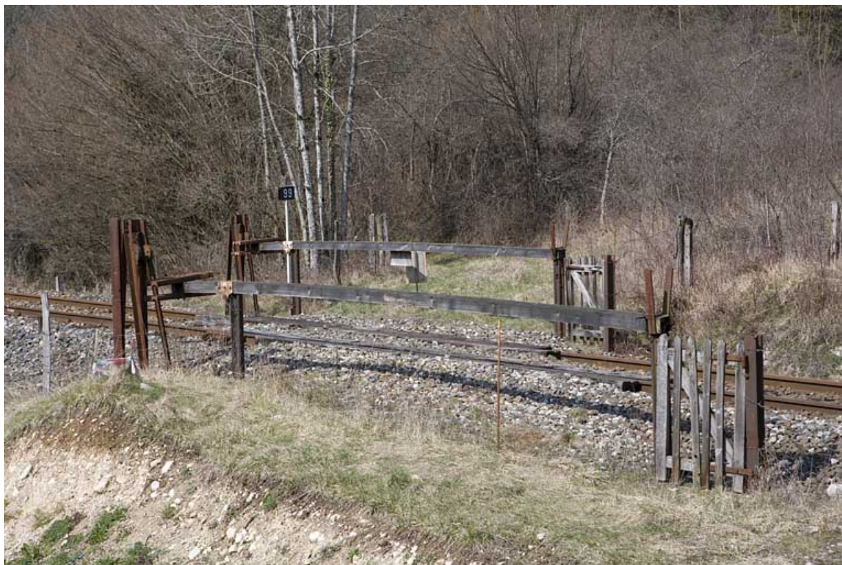
Passage à niveau n° 99, depuis le côté Andelot-en-Montagne.

01, Montréal-la-Cluse rue du Martinet, lieudit : le Martinet