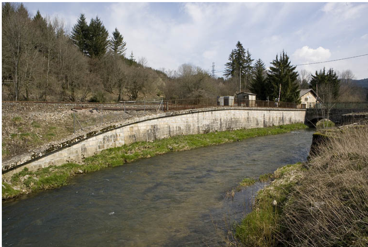
Passage à niveau n° 100 et mur de soutènement, depuis la rive droite de l'Ange à l'ouest.

01, Montréal-la-Cluse rue du Martinet, lieudit : le Martinet