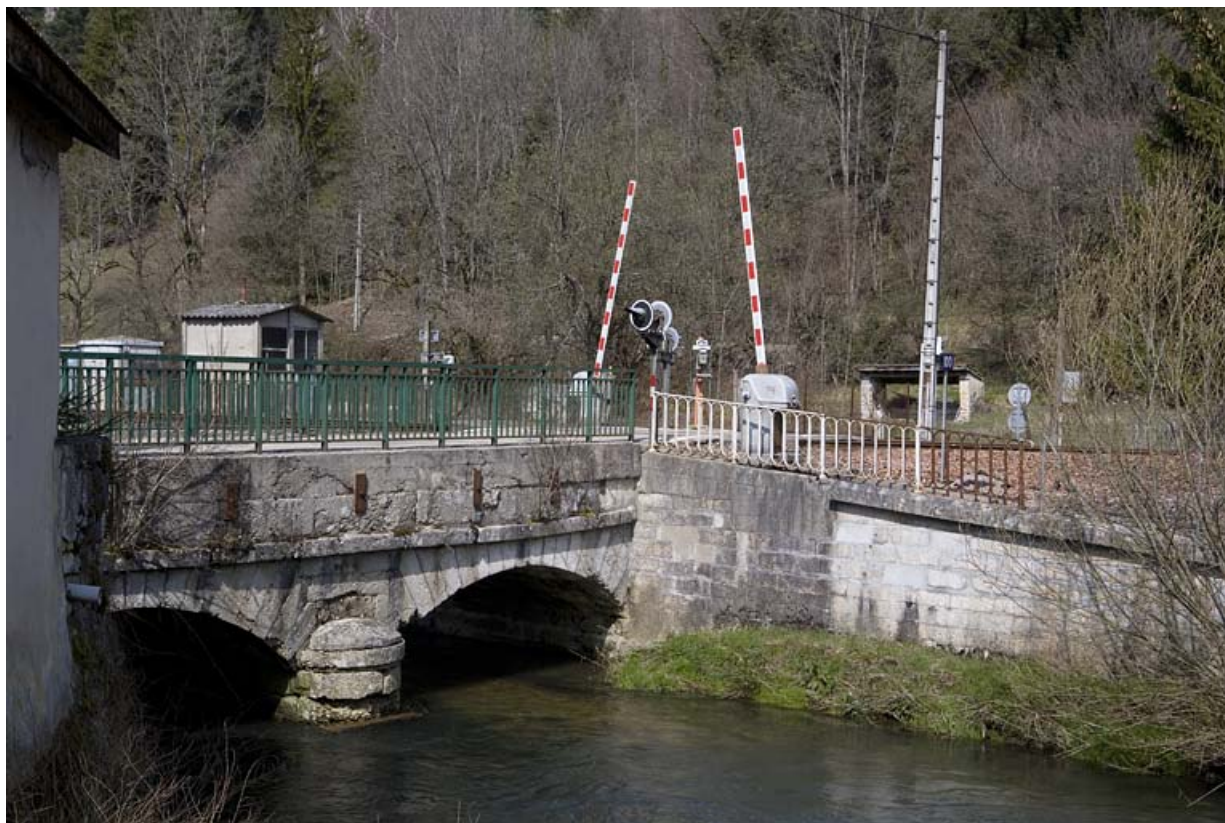
Passage à niveau n° 100, depuis la rive droite de l'Ange à l'est.

01, Montréal-la-Cluse rue du Martinet, lieudit : le Martinet