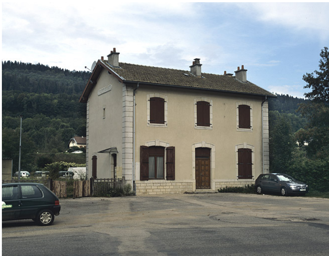
Façade antérieure, de trois quarts gauche.