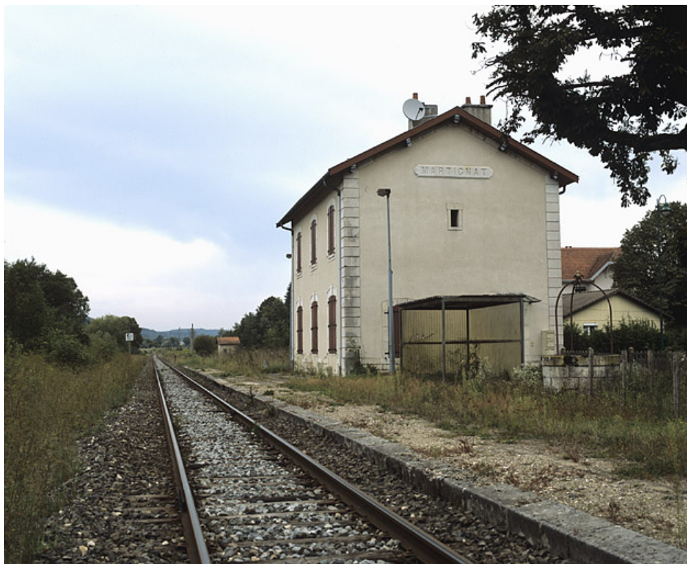
Façade postérieure, vue en enfilade depuis le côté La Cluse (sud-ouest).