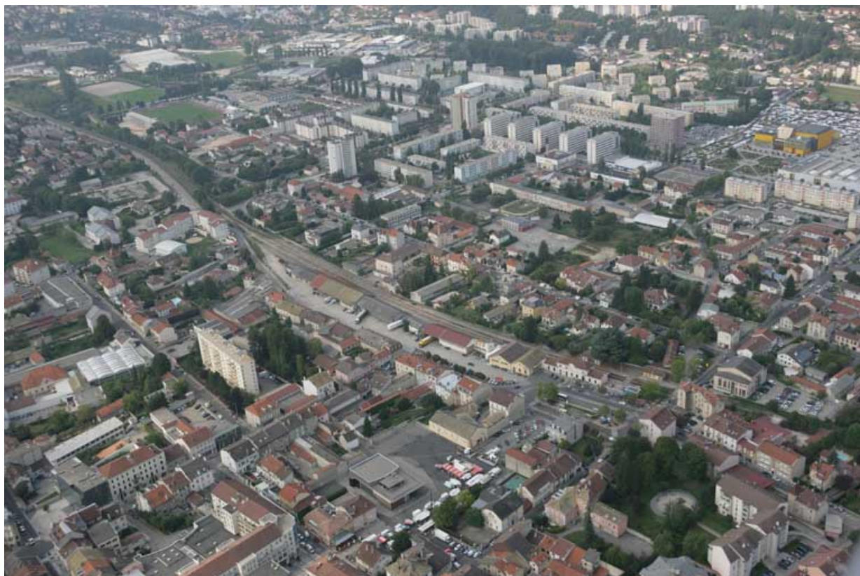
Vue aérienne du site, depuis le nord-est.