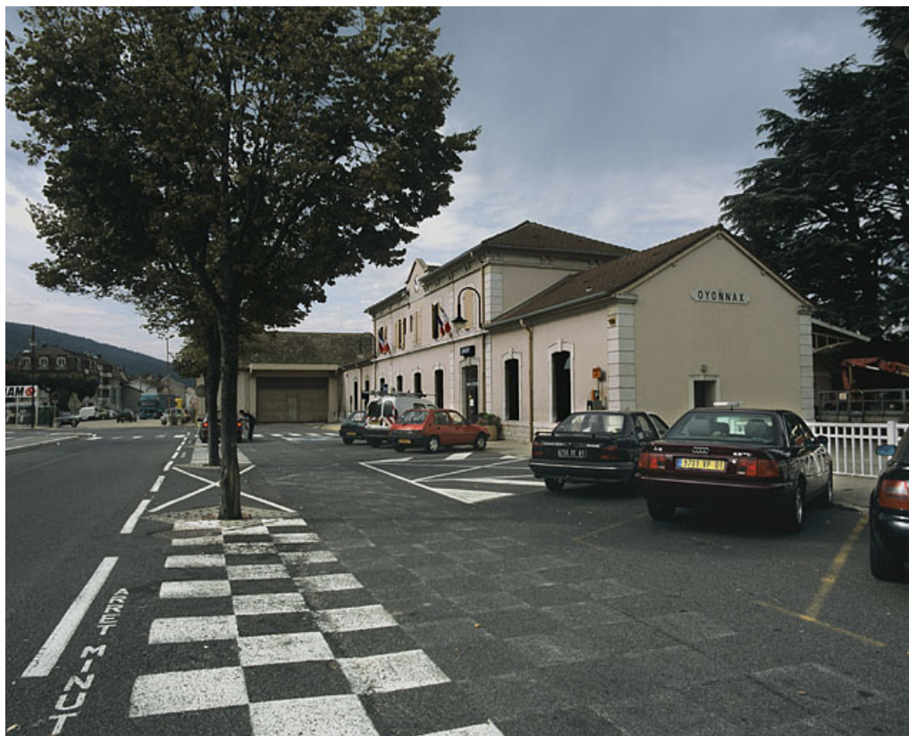
Vue d'ensemble, depuis le nord-est (côté Andelot-en-Montagne).