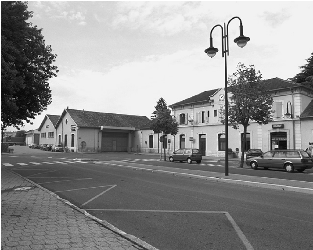
Entrepôts et cour, depuis le nord-est.