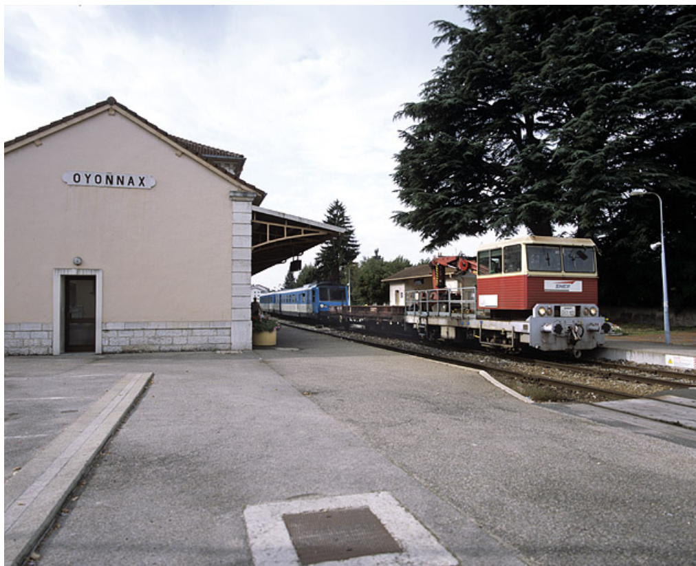
Bâtiment des voyageurs : extrémité nord, avec autorail RGP 1 (X 2733) et draineuse. 01, Oyonnax place Vaillant Couturier