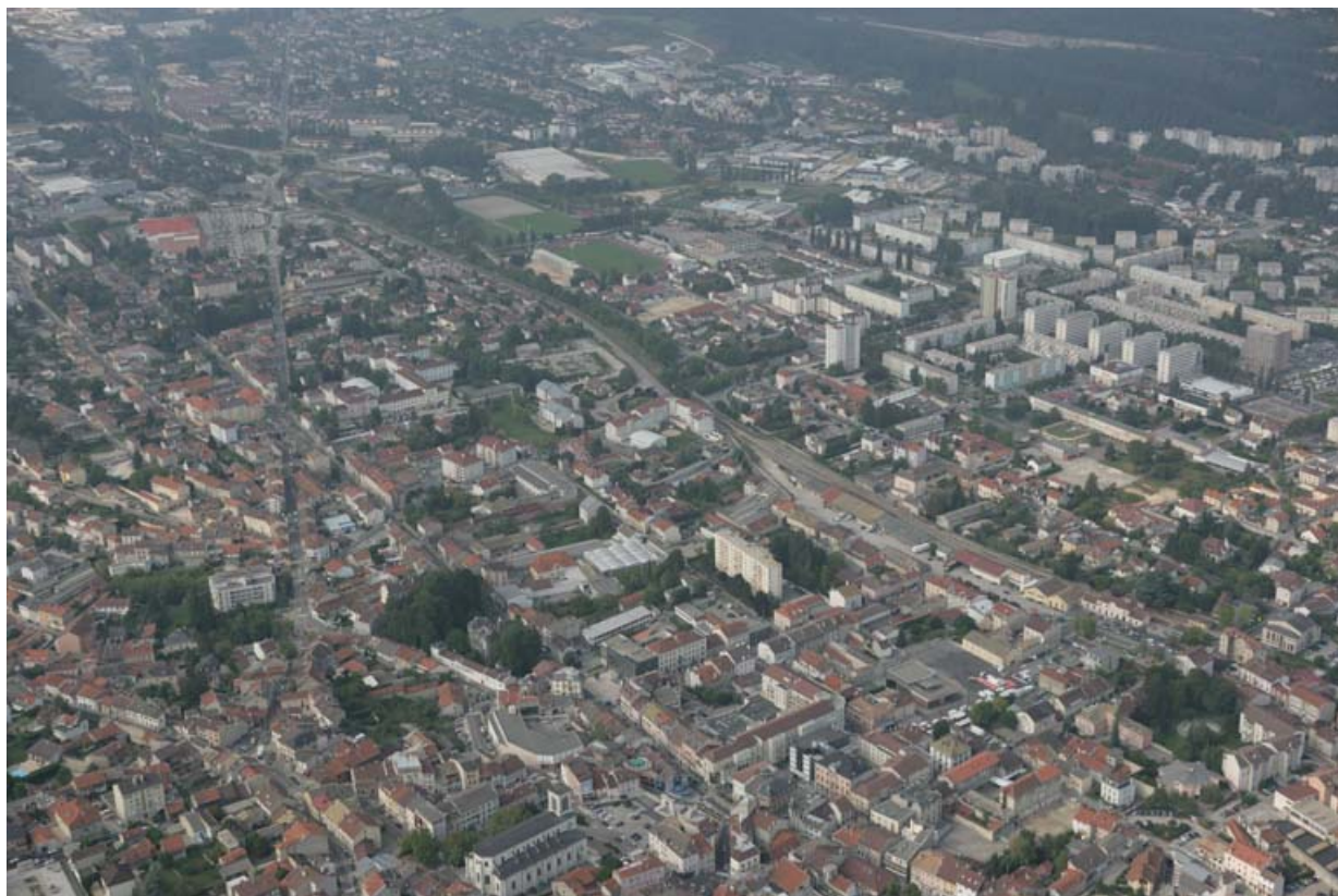
Vue aérienne du quartier de la gare, depuis l'est.