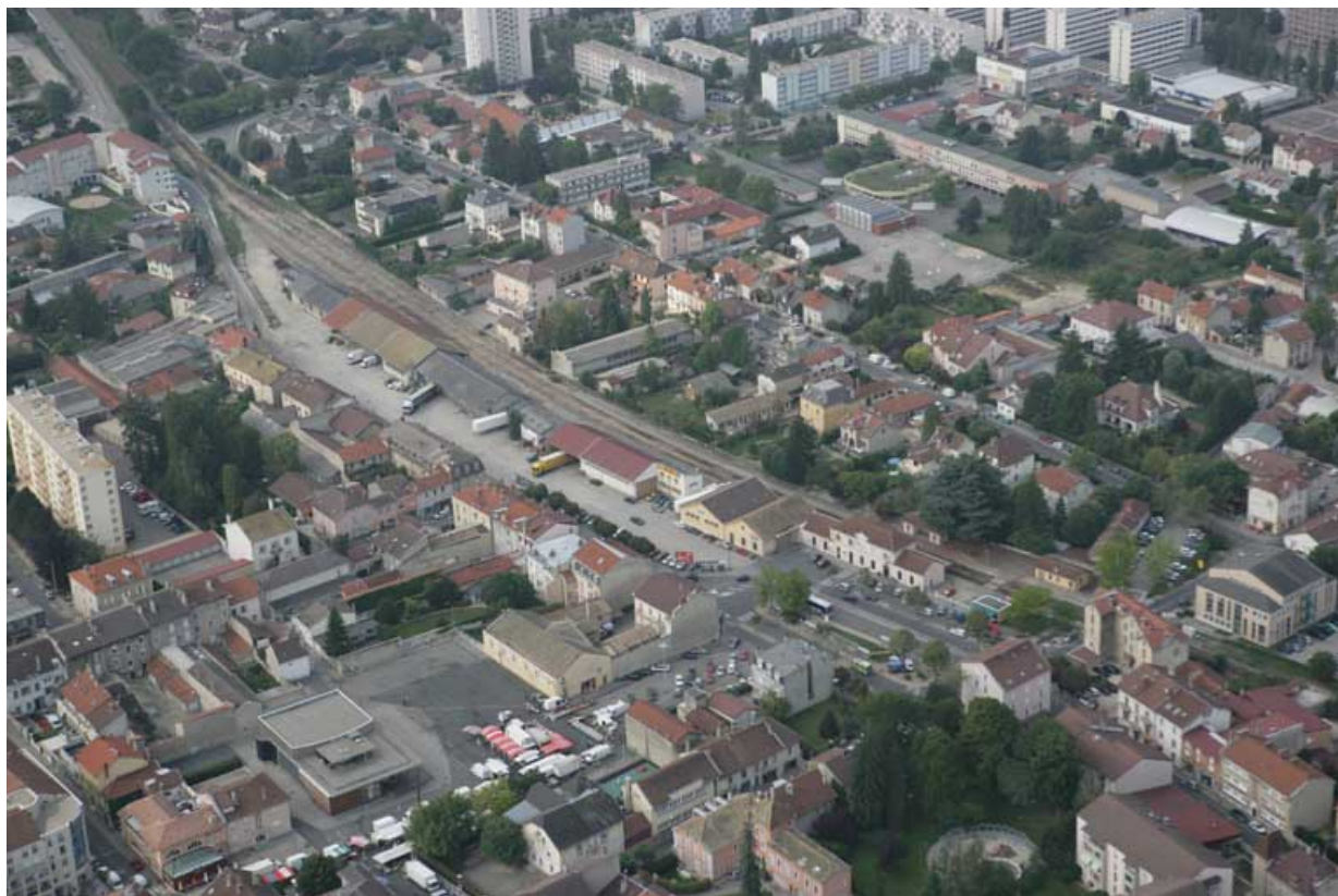
Vue aérienne rapprochée du site, depuis le nord-est.