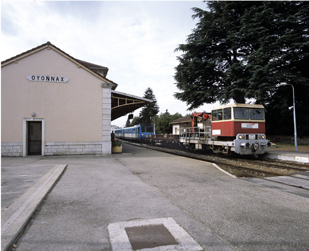
Bâtiment des voyageurs : extrémité nord, avec autorail RGP 1 (X 2733) et draisine. 01, Oyonnax place Vaillant Couturier