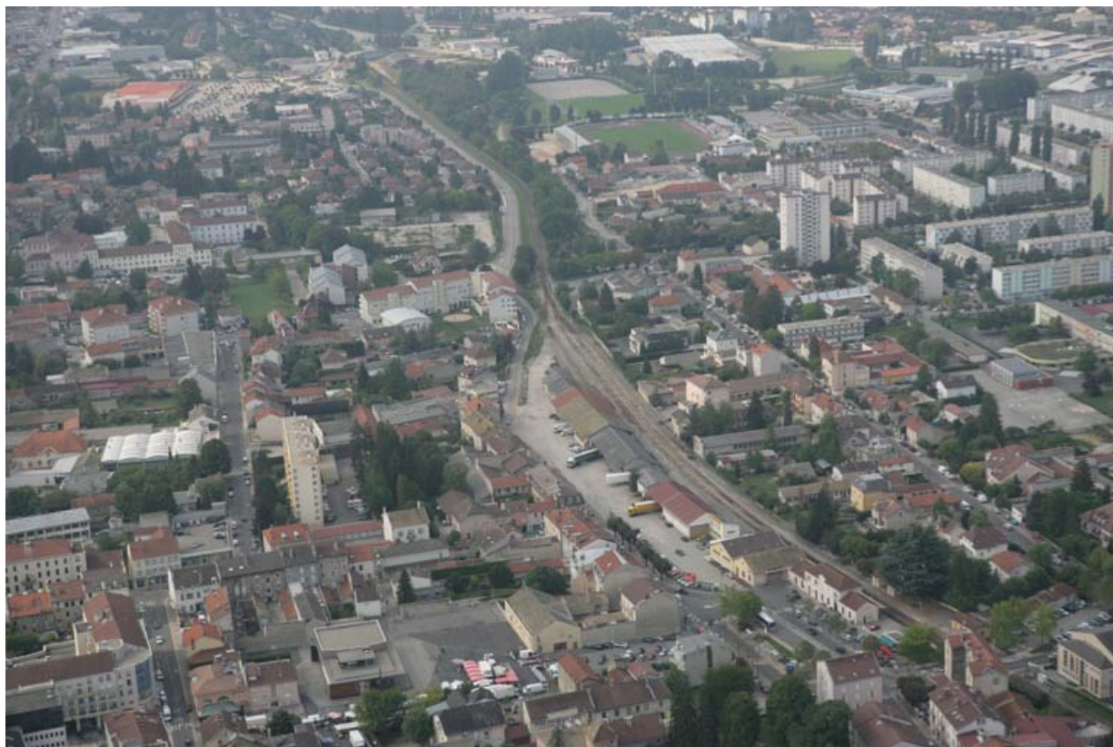
Vue aérienne du site, depuis le nord.