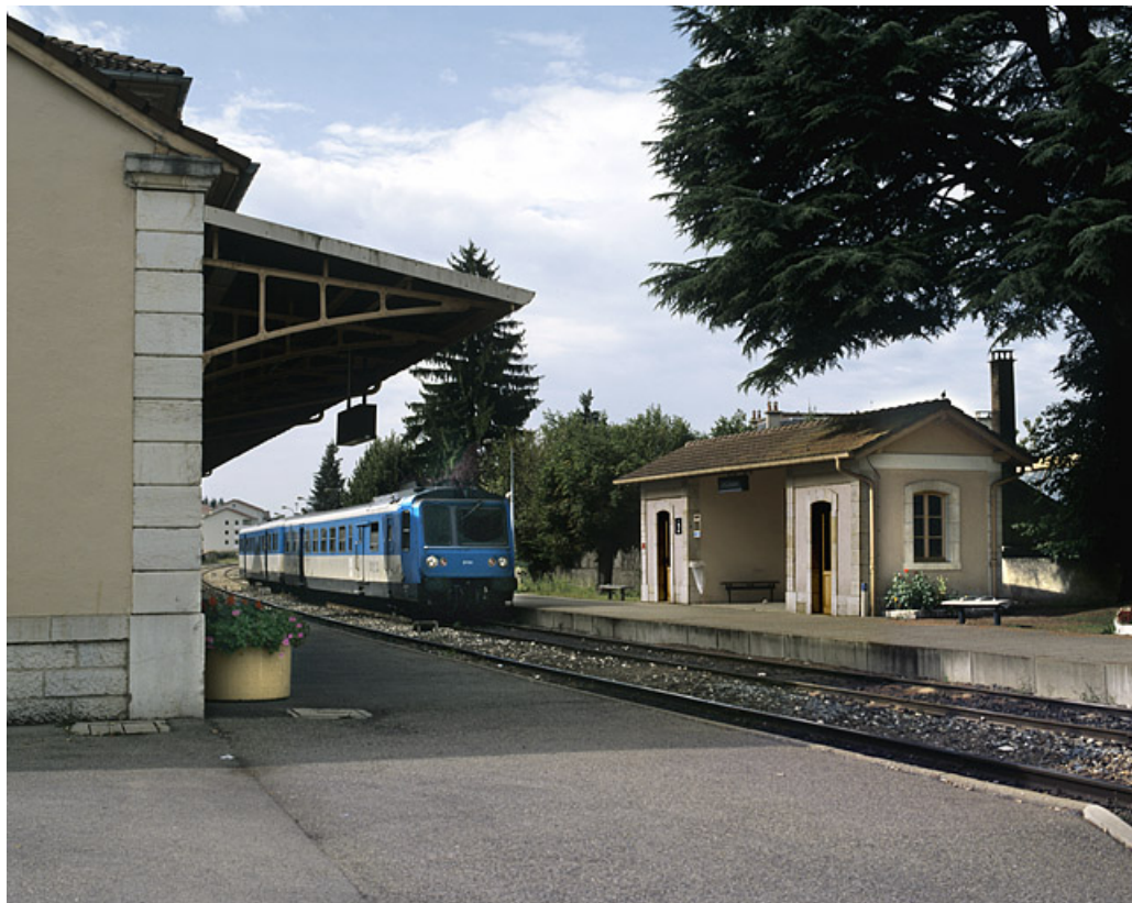
Abri de voyageurs - lampisterie et autorail RGP 1 (X 2733).