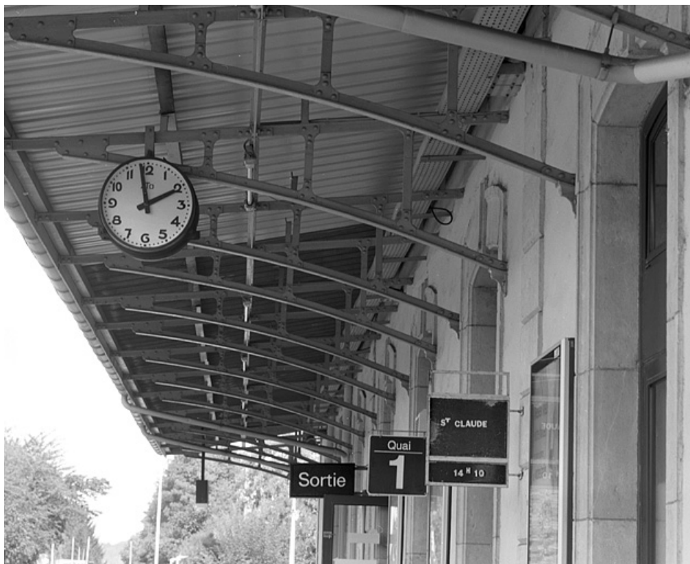
Bâtiment des voyageurs : consoles métalliques de l'auvent et horloge.