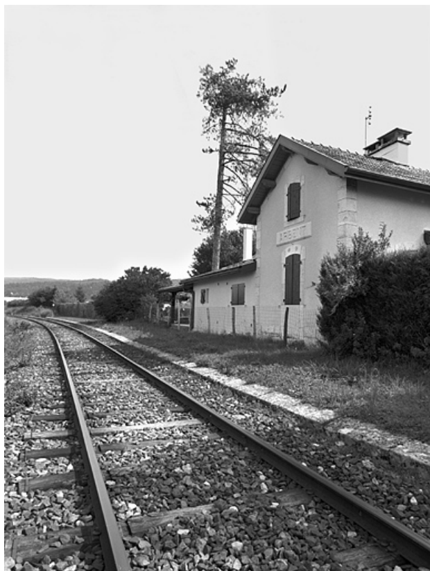
Façade postérieure (côté voie), de trois quarts droite (depuis le côté La Cluse). 01, Arbent, 11 rue de la Gare