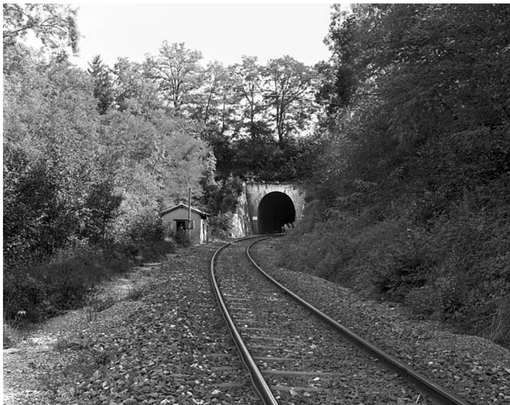
Tunnel d'Arbent 2 : vue d'ensemble de la tête côté Andelot-en-Montagne (ouest).

01, Arbent rue du Point B, lieudit : la Queue du Lac