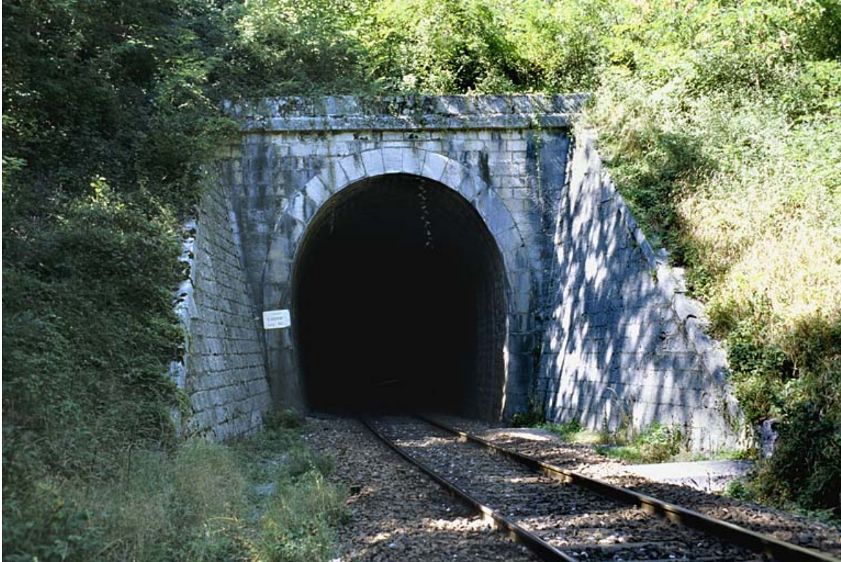
Tunnel d'Arbent 1 : tête côté La Cluse (sud-est).

01, Arbent rue du Point B, lieudit : la Queue du Lac