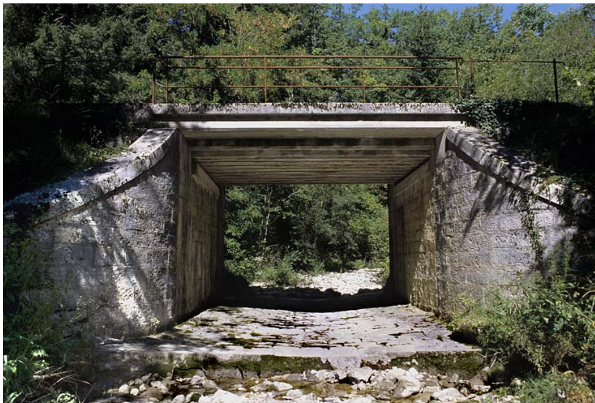
Pont : vue d'ensemble depuis le lit du Merdanson, en aval.

01, Arbent rue du Point B, lieudit : la Queue du Lac