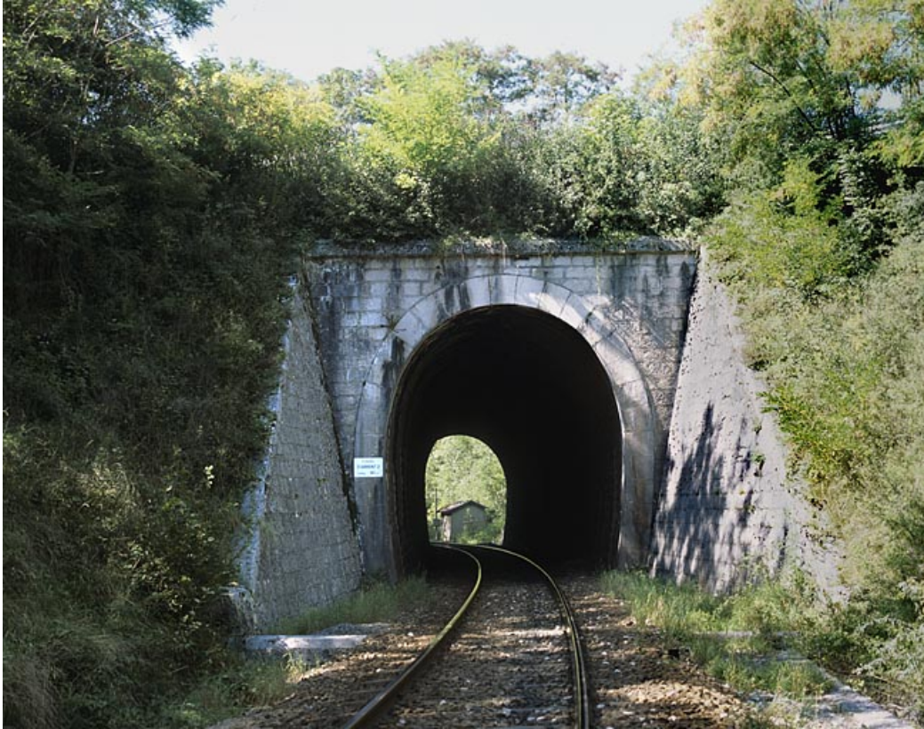
Tunnel d'Arbent 2 : tête côté La Cluse (est).

01, Arbent rue du Point B, lieudit : la Queue du Lac