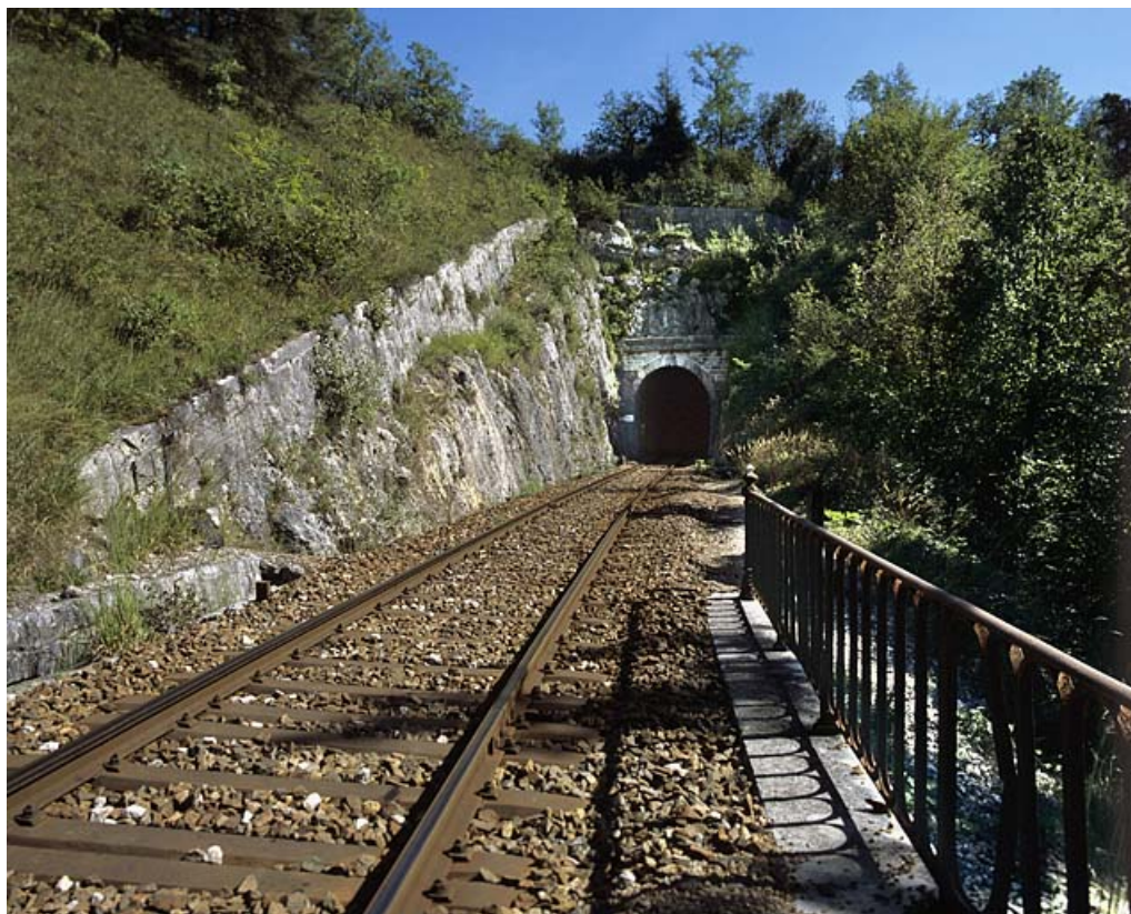
Tunnel d'Arbent 1 : vue d'ensemble de la tête côté Andelot-en-Montagne (nord-ouest).

01, Arbent rue du Point B, lieudit : la Queue du Lac