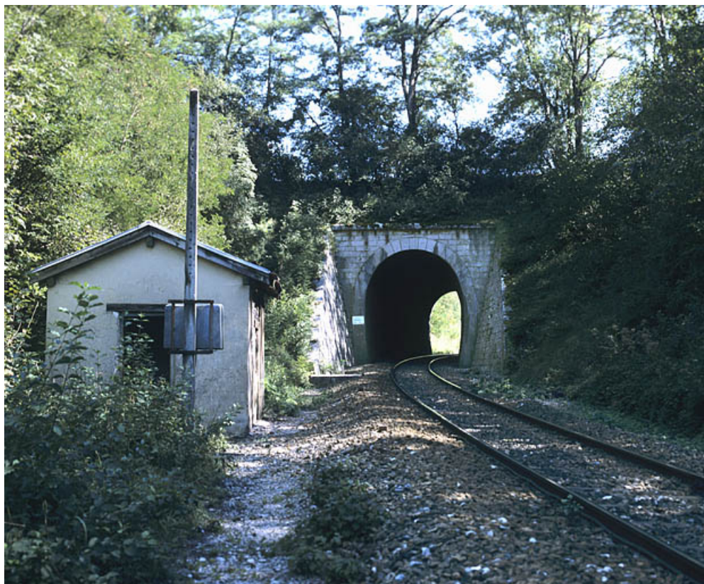
Tunnel d'Arbent 2 : tête côté Andelot-en-Montagne (ouest).

01, Arbent rue du Point B, lieudit : la Queue du Lac