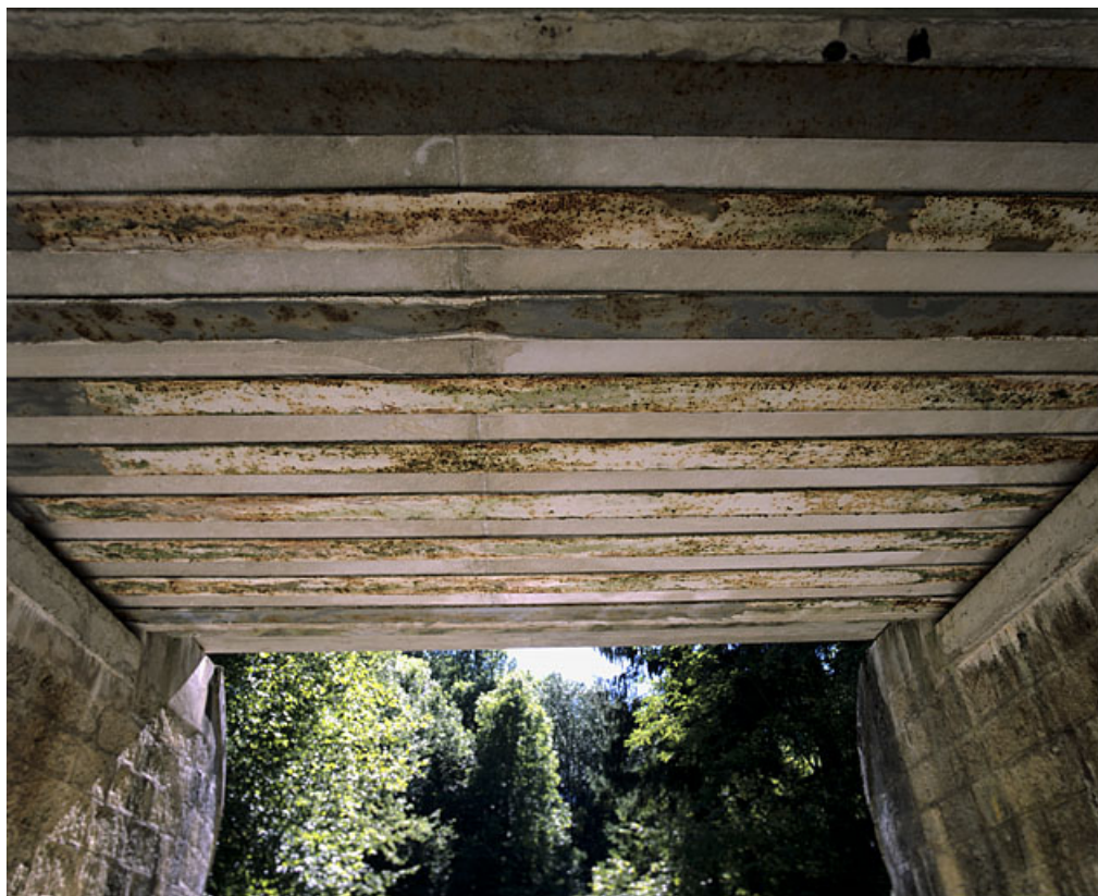
Pont : poutrelles en face inférieure du tablier.

01, Arbent rue du Point B, lieudit : la Queue du Lac