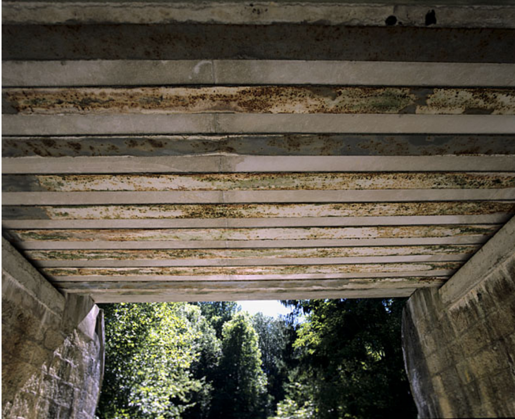
Pont : poutrelles en face inférieure du tablier.

01, Arbent rue du Point B, lieudit : la Queue du Lac