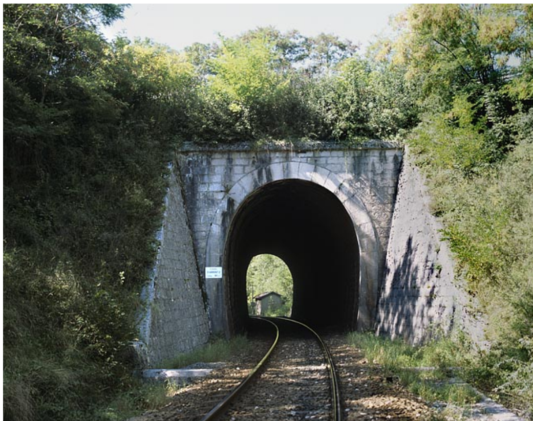
Tunnel d'Arbent 2 : tête côté La Cluse (est).

01, Arbent rue du Point B, lieudit : la Queue du Lac