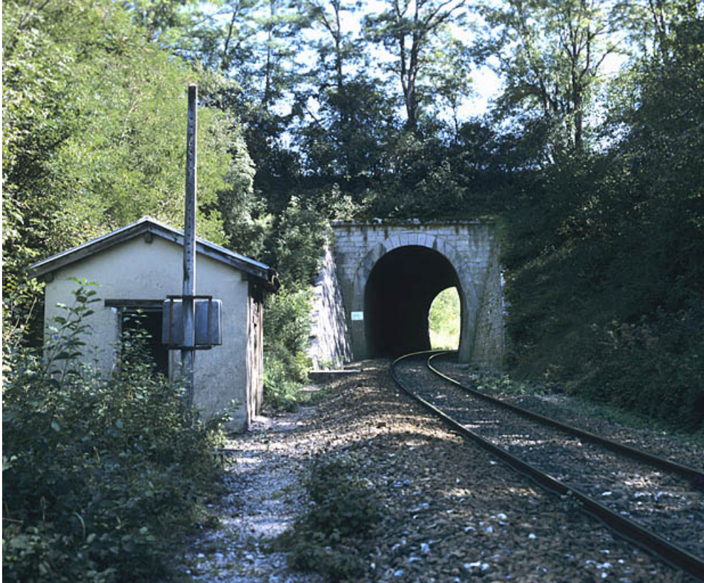
Tunnel d'Arbent 2 : tête côté Andelot-en-Montagne (ouest).

01, Arbent rue du Point B, lieudit : la Queue du Lac