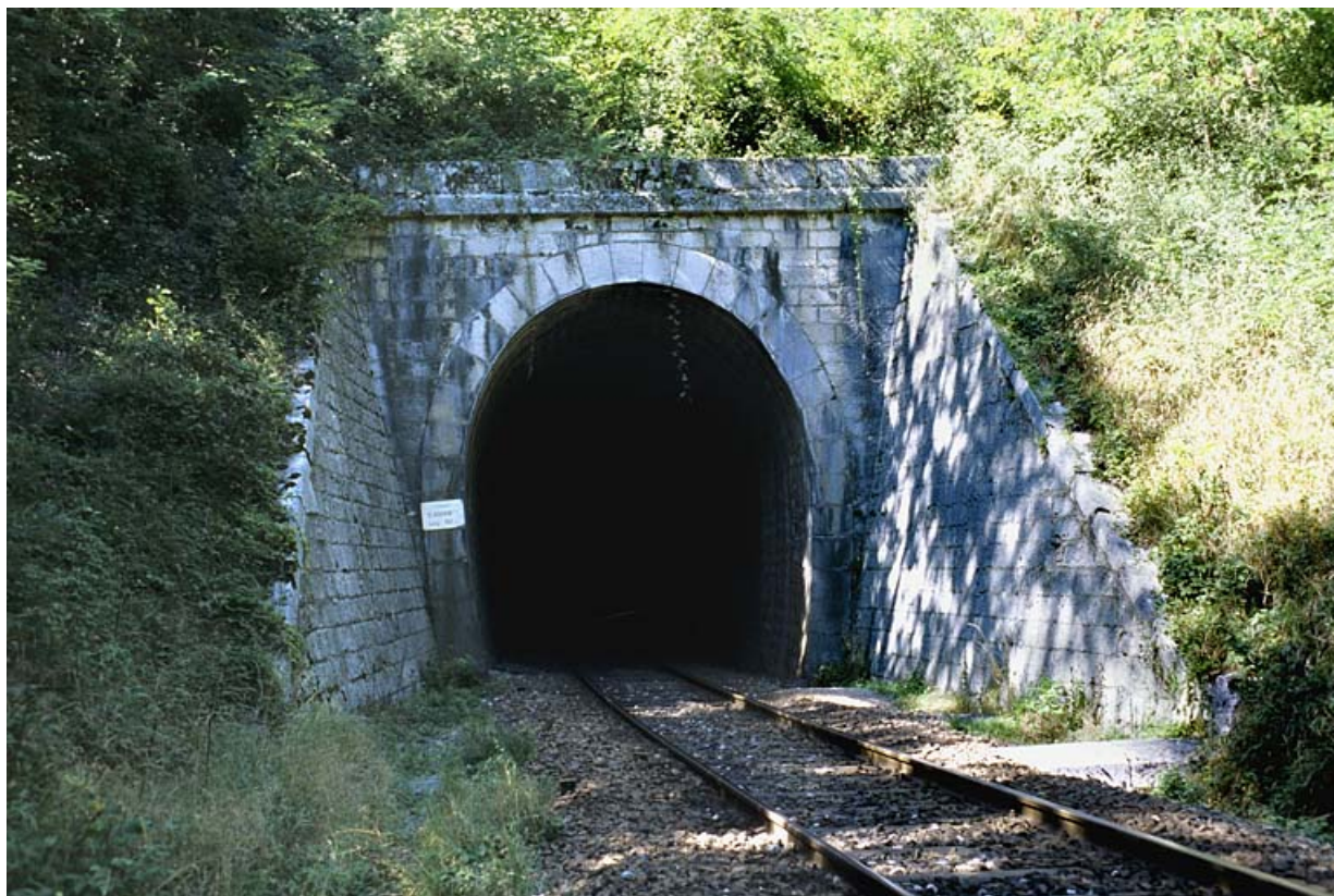
Tunnel d'Arbent 1 : tête côté La Cluse (sud-est). 01, Arbent rue du Point B, lieudit : la Queue du Lac