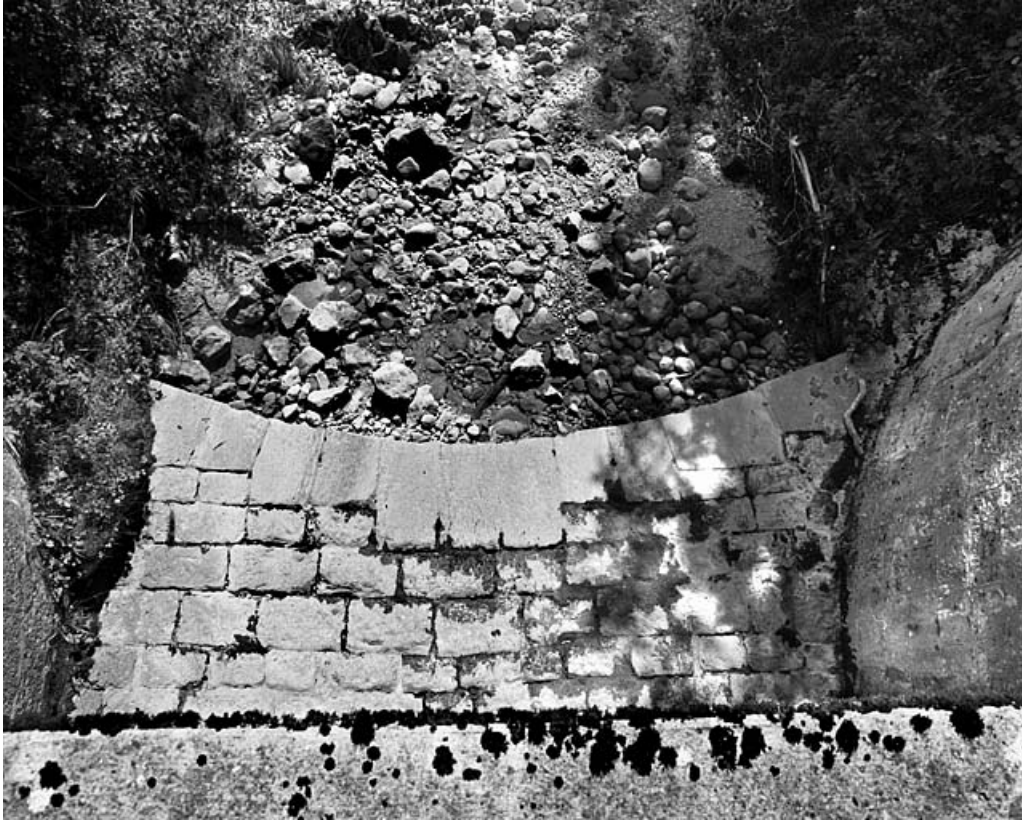
Pont : vue plongeante sur le radier aval.

01, Arbent rue du Point B, lieudit : la Queue du Lac