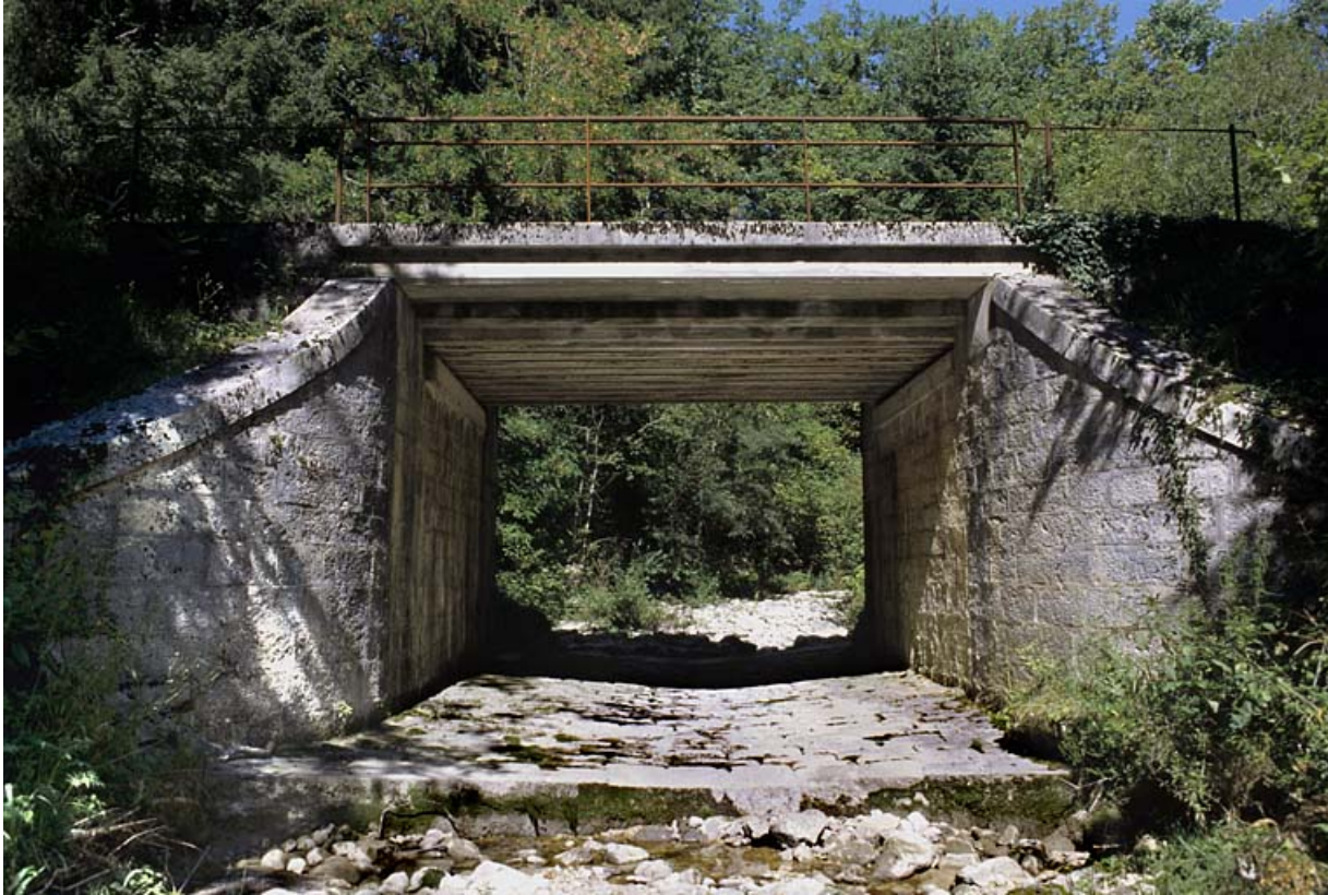
Pont : vue d'ensemble depuis le lit du Merdanson, en aval.

01, Arbent rue du Point B, lieudit : la Queue du Lac