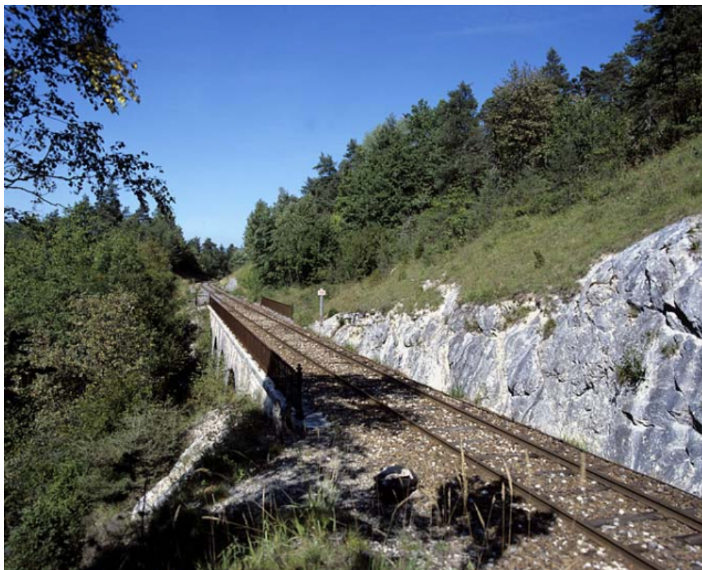
Vue d'ensemble, depuis le côté La Cluse (sud-est).