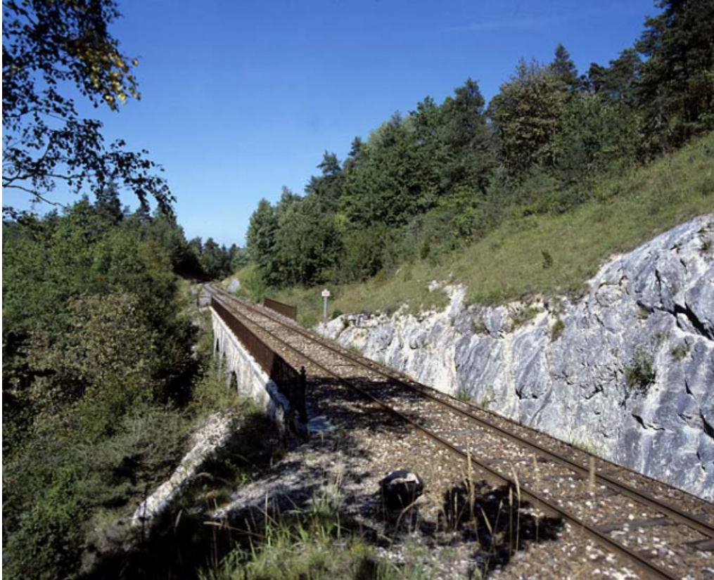
Vue d'ensemble, depuis le côté La Cluse (sud-est). 01, Arbent, lieudit : en Montagne