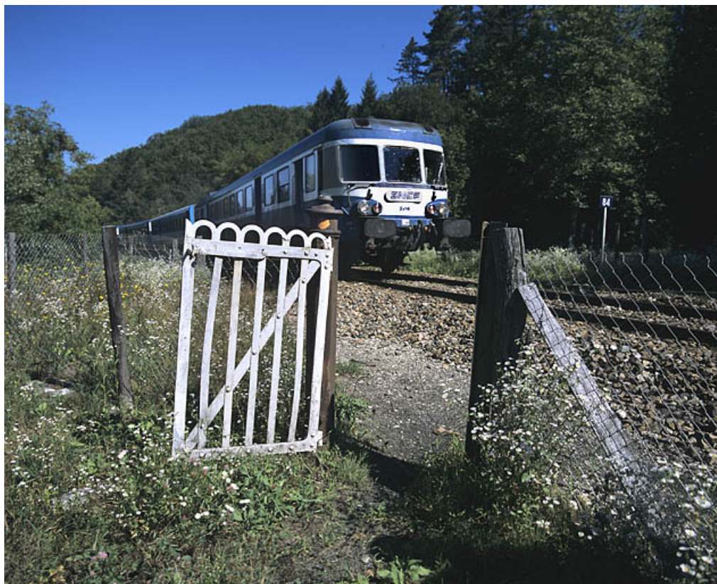
Portillon pour piétons, côté gauche de la voie, avec autorail X 2800.