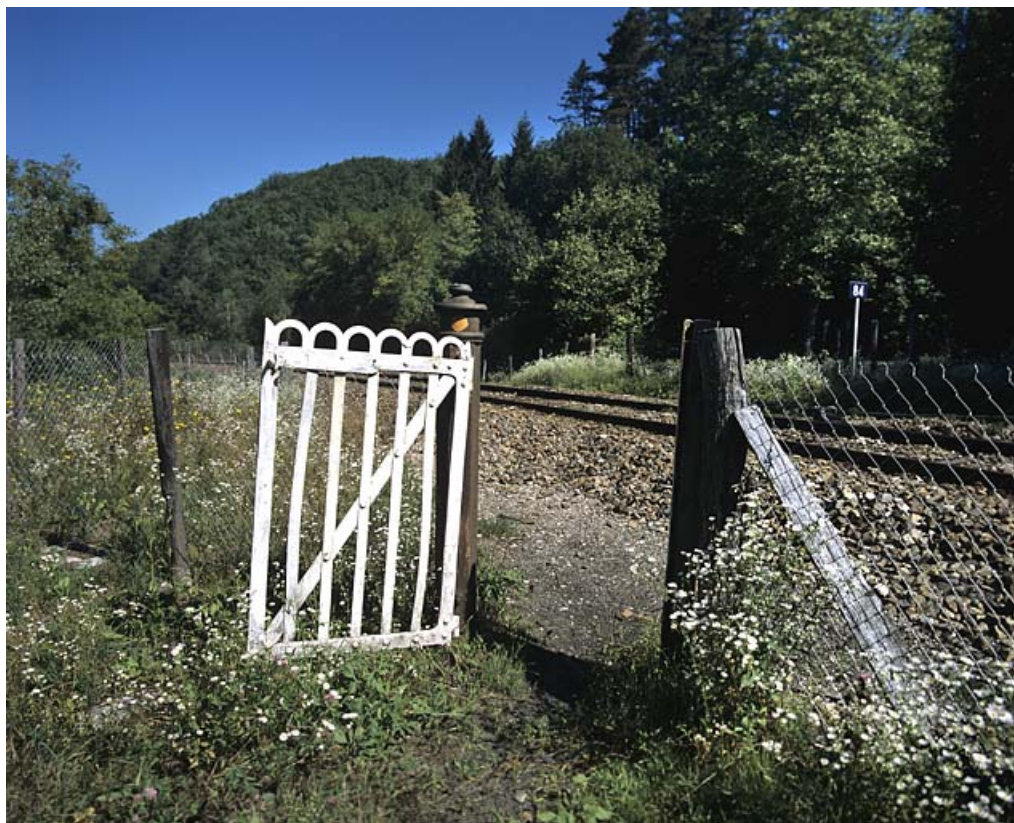
Portillon pour piétons, côté gauche de la voie.