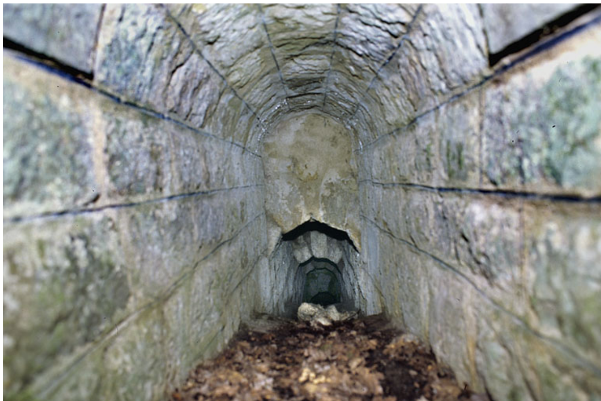
Voûte appareillée en rouleaux à ressauts, depuis l'amont.