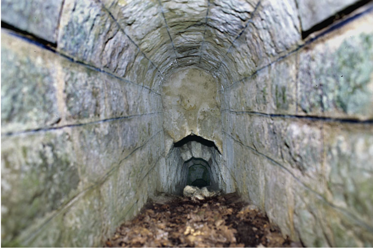
Voûte appareillée en rouleaux à ressauts, depuis l'amont.