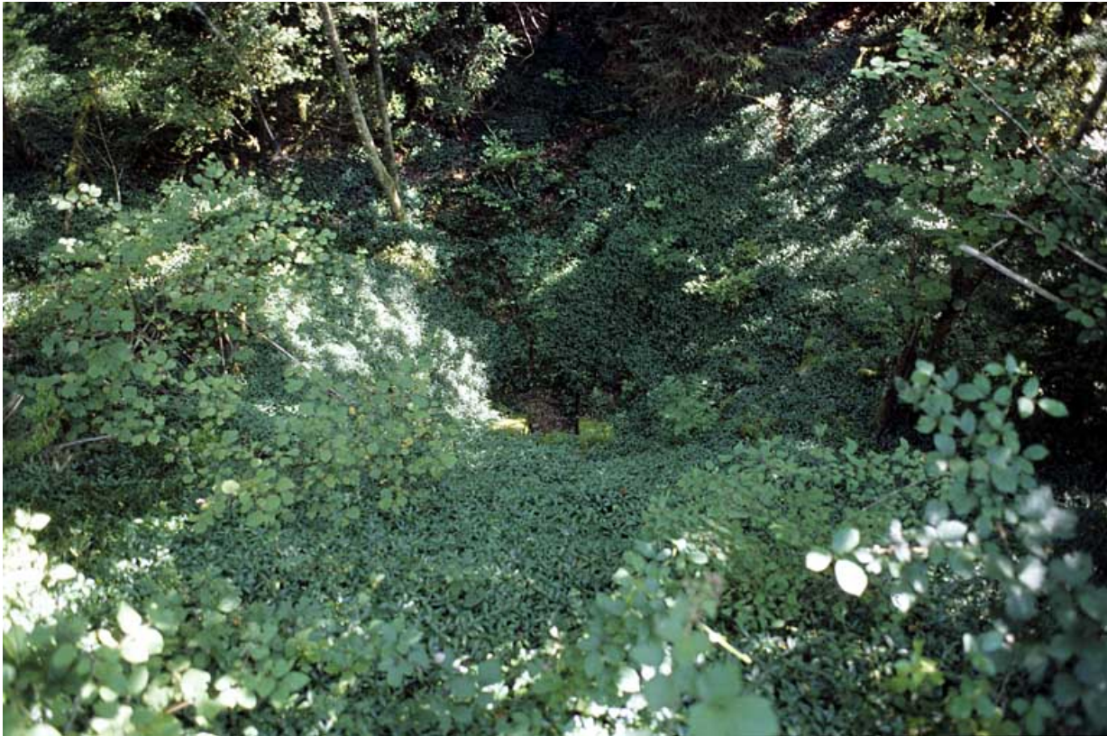
Vue d'ensemble plongeante sur la tête amont (est), depuis la voie. 01, Arbent, lieudit : aux Prés de Voye