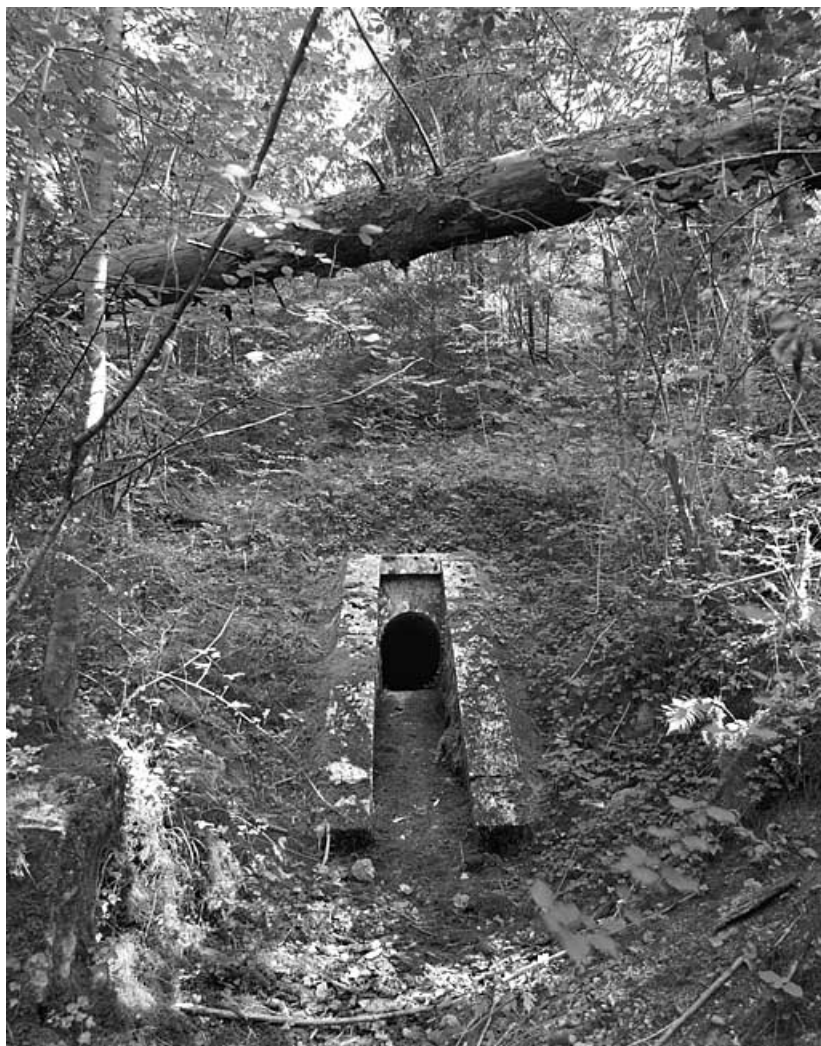
Vue d'ensemble de la tête aval (ouest).