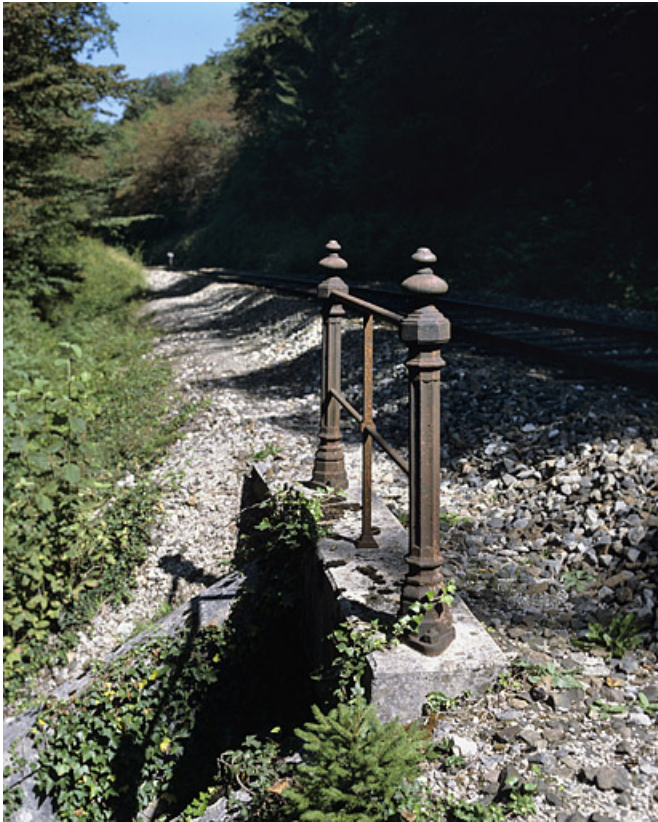
Garde-corps surmontant la tête occidentale.