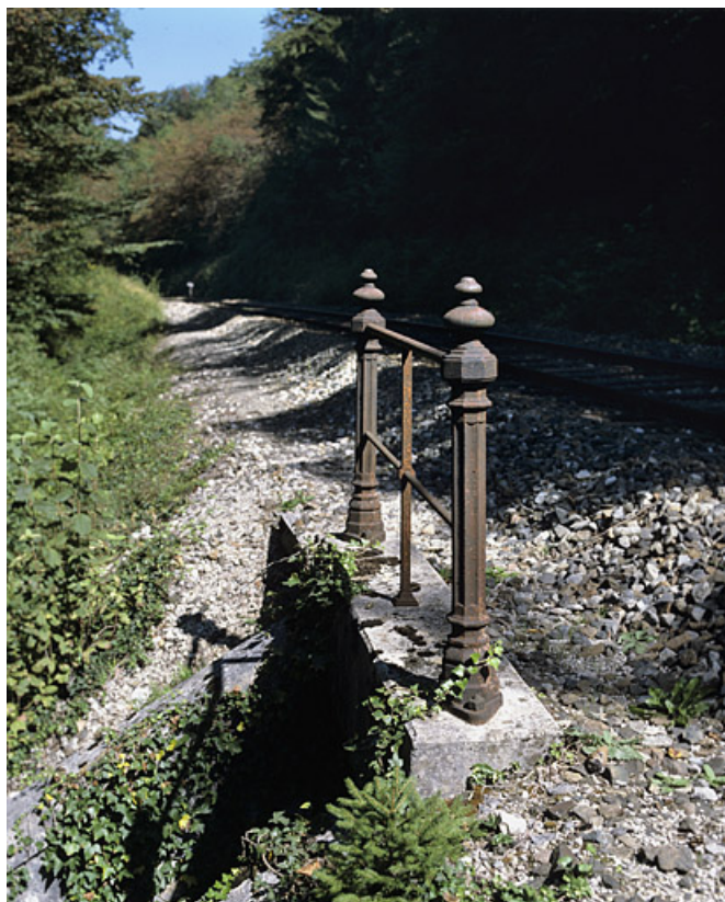
Garde-corps surmontant la tête occidentale.