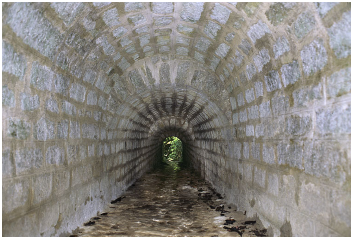
Voûte appareillée en rouleaux à ressauts, depuis l'amont.