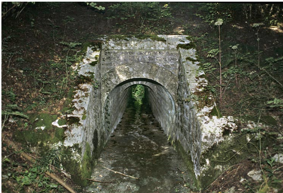
Tête amont (avec éclairage au flash).