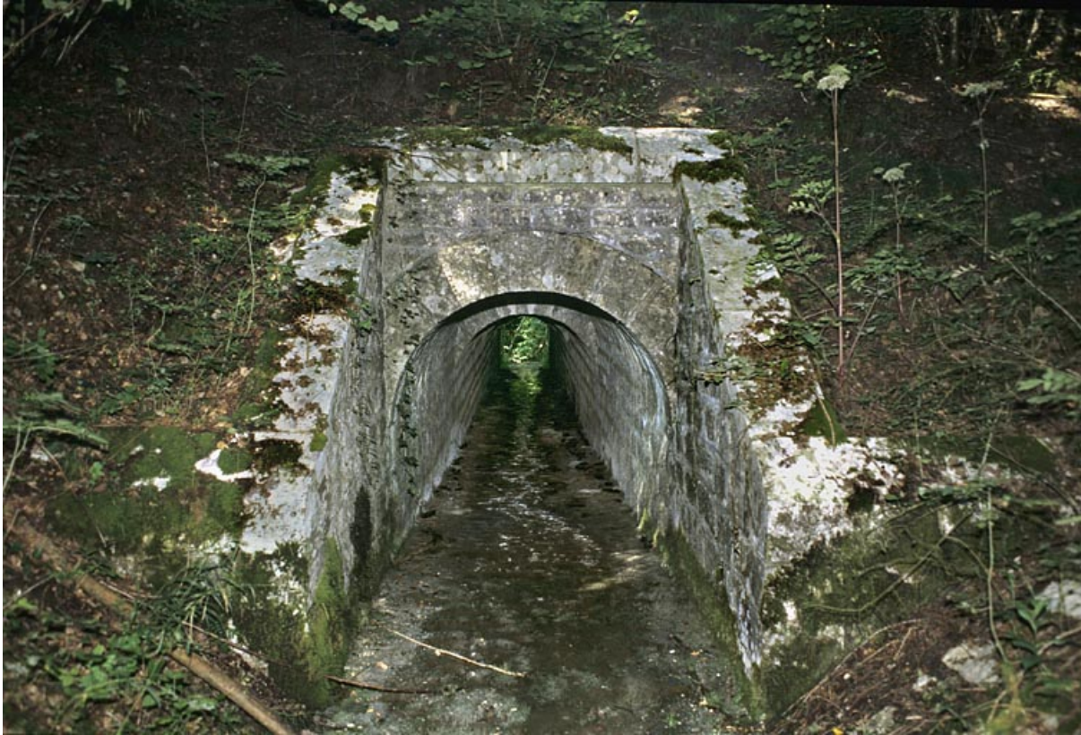
Tête amont (avec éclairage au flash).