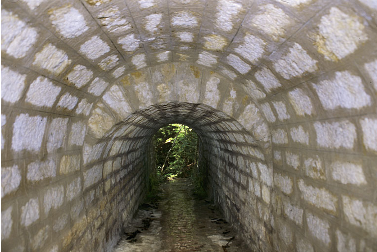
Voûte appareillée en rouleaux à ressauts, depuis l'amont.