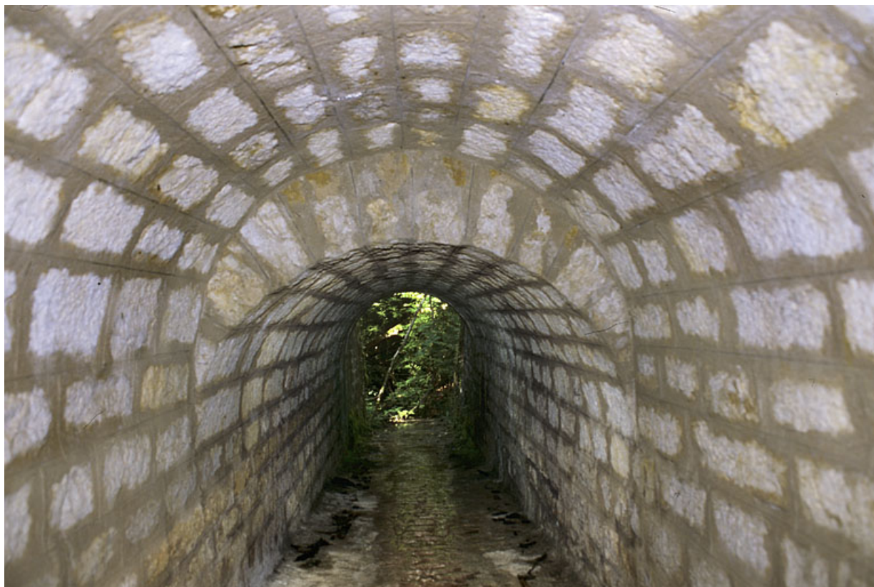
Voûte appareillée en rouleaux à ressauts, depuis l'amont.