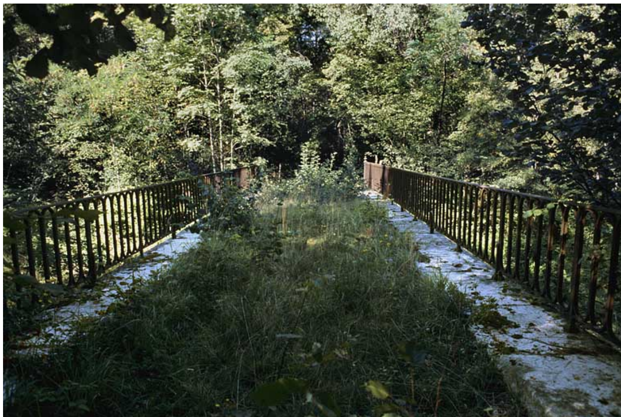
Tablier, depuis l'extrémité ouest.