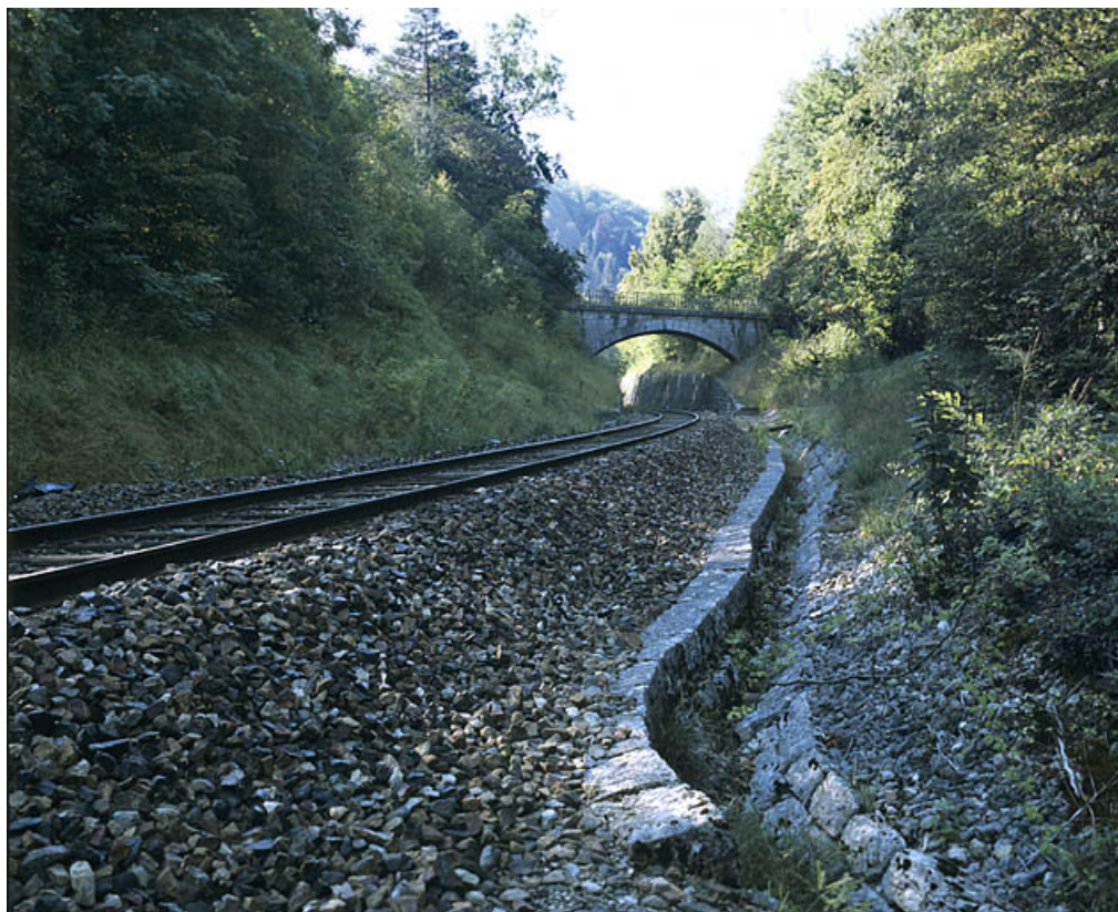
Vue d'ensemble, depuis le côté Andelot-en-Montagne (nord).