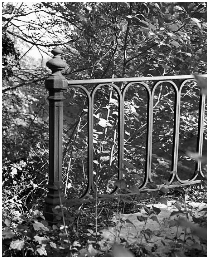
Garde-corps : détail d'un potelet.