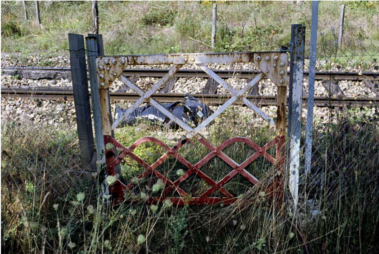
Portillon pour piétons, côté droit de la voie.