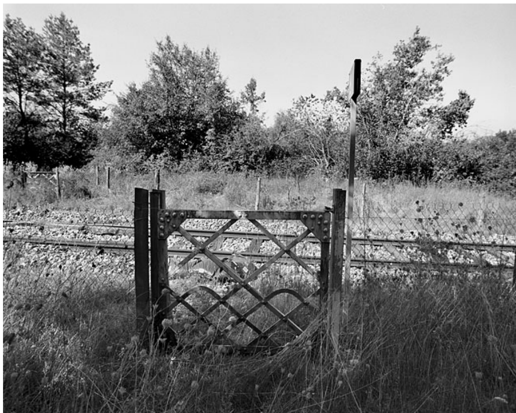
Portillon pour piétons, côté droit de la voie : vue d'ensemble.