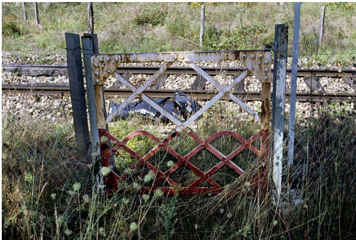
Portillon pour piétons, côté droit de la voie.