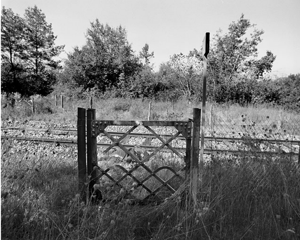
Portillon pour piétons, côté droit de la voie : vue d'ensemble.