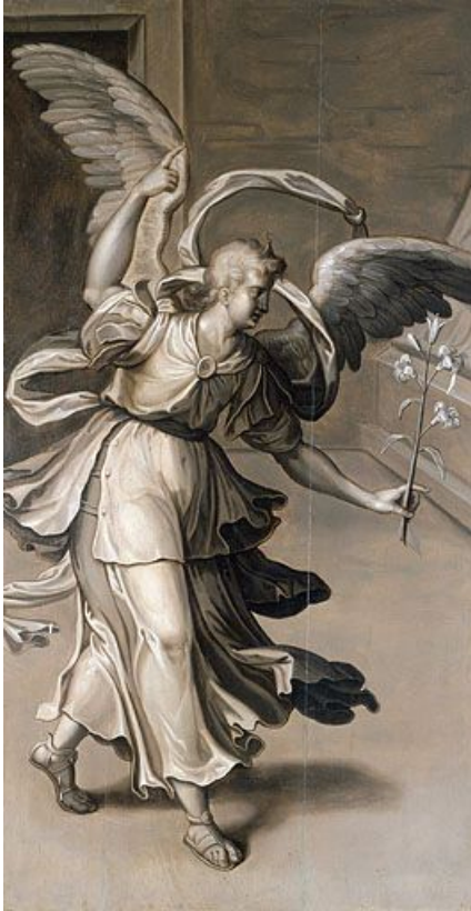
Revers du volet gauche : Ange de l'Annonciation.