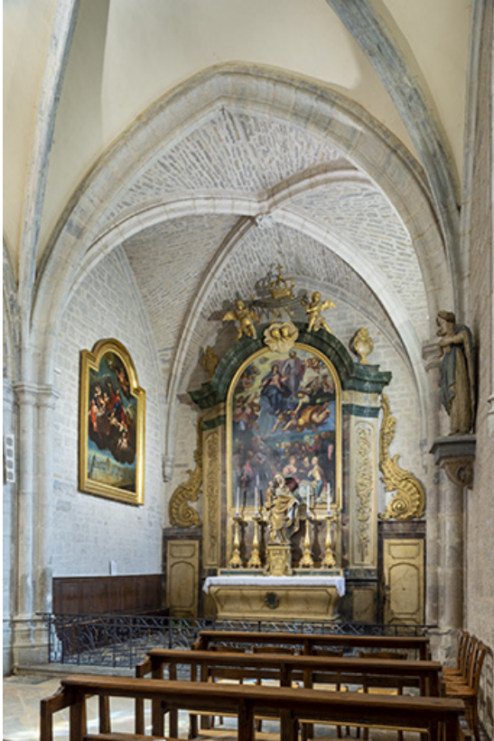
Chapelle du fondateur.