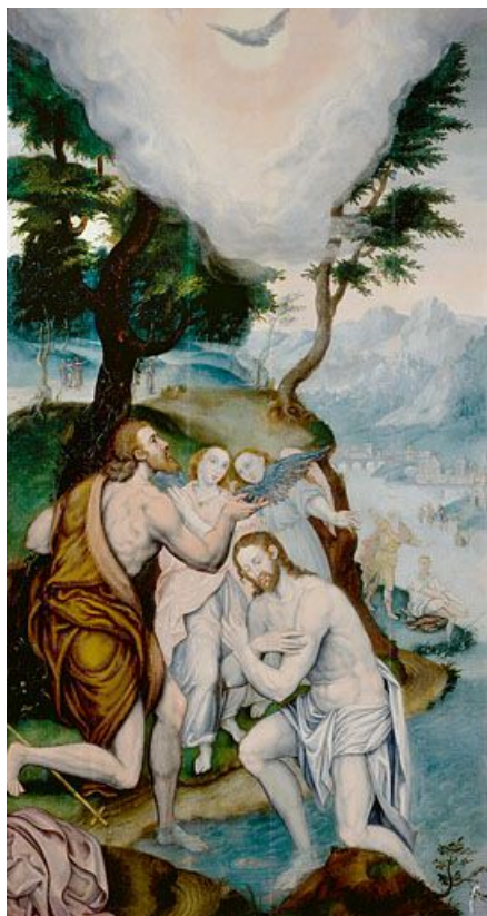
Panneau 1 recto : le Baptême du Christ.