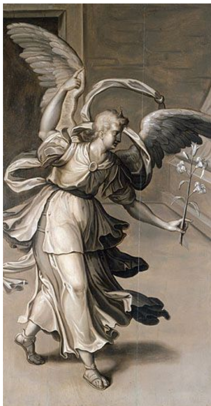
Revers du volet gauche : Ange de l'Annonciation.