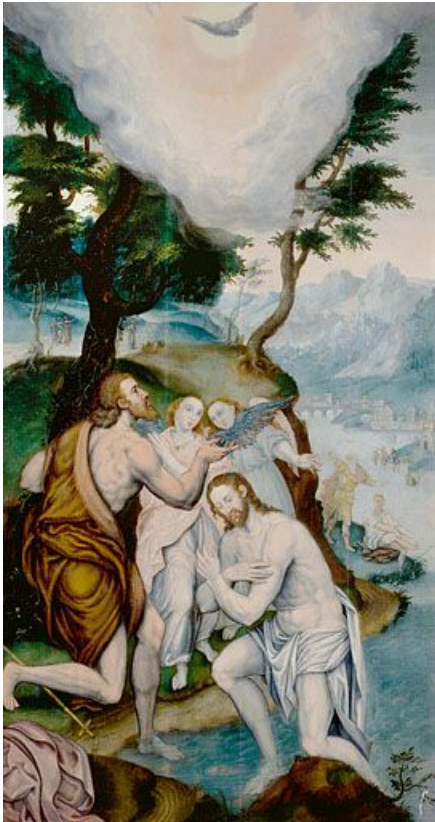
Panneau 1 recto : le Baptême du Christ.