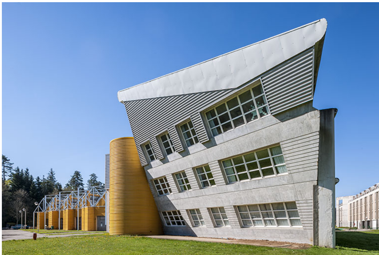
Champagnole, lycée Paul-Emile Victor : atelier.