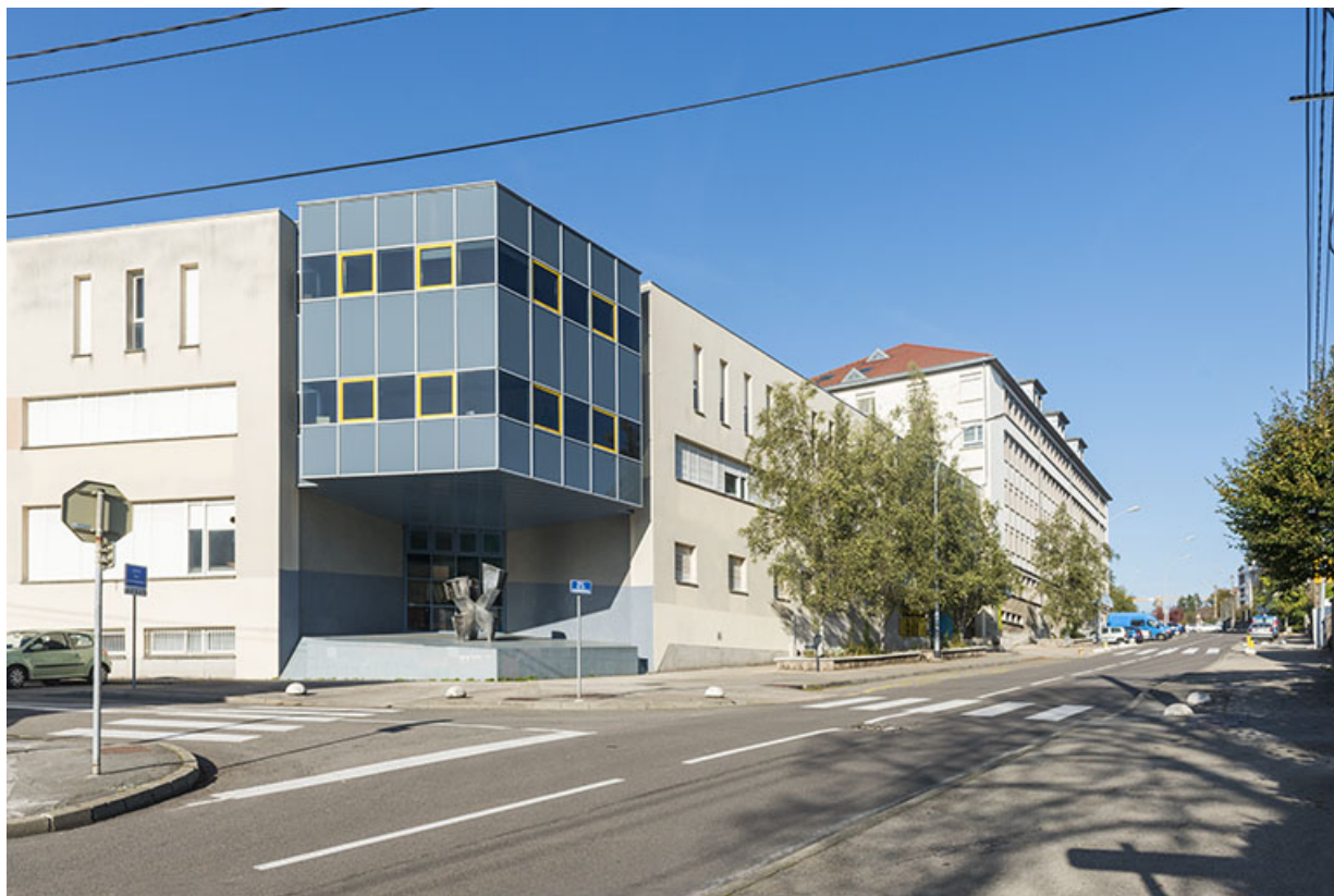
Besançon, lycée Montjoux : bâtiments le long de l'avenue du commandant Marceau.