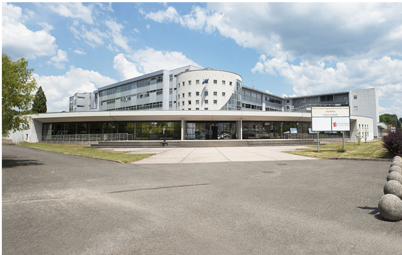
Lure, lycée Georges Colomb : place-parvis et façade de l'entrée.