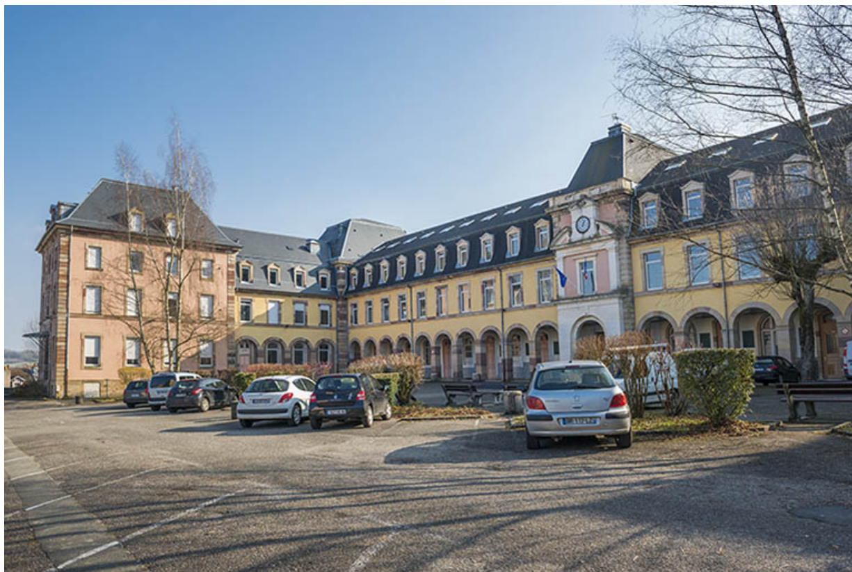
Belfort, lycée Condorcet : cour d'honneur.