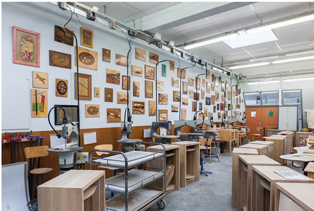
Moirans-en-Montagne, cité scolaire Pierre Vernotte : atelier de marqueterie.