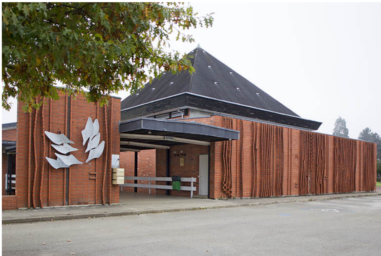
Montmorot, lycée Edgar Faure : entrée principale.