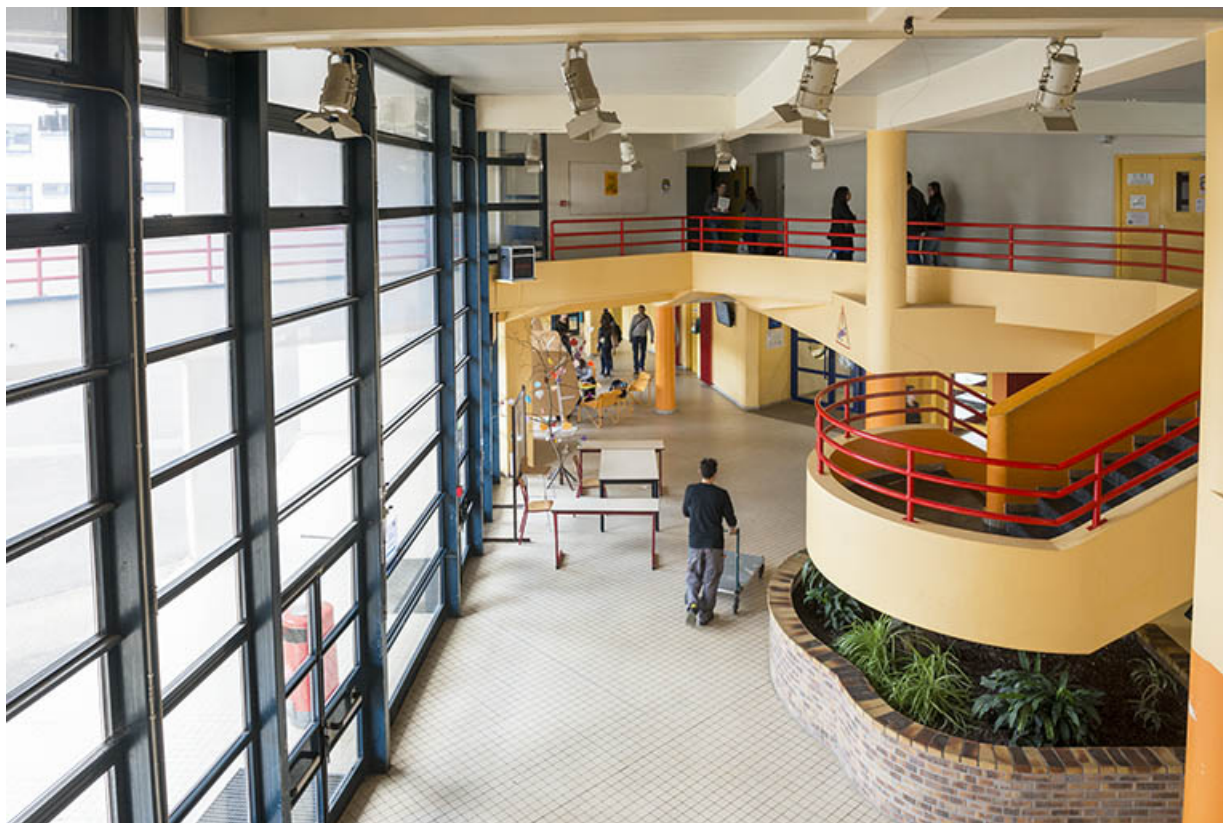
Héricourt, lycée Louis Aragon : vue sur le hall d'entrée.