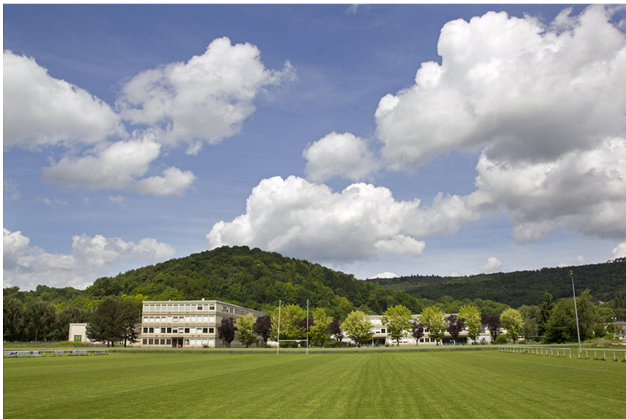
Baume-les-Dames, lycée professionnel Jouffroy d'Abbans : vue depuis le sud.