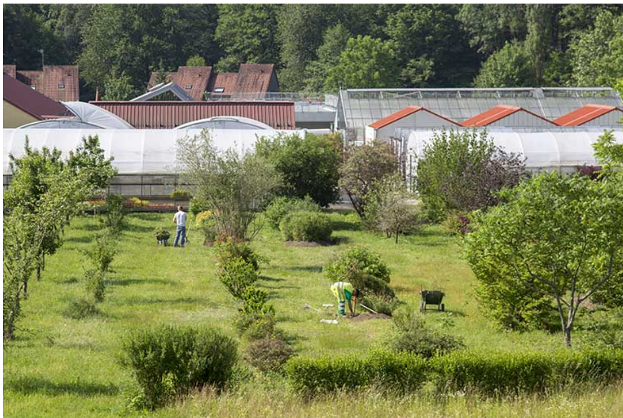
Valdoie : lycée Lucien Quelet : vue du site d'exploitation.