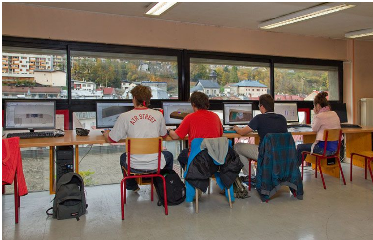
Bâtiment B, atelier de microtechniques : conception assistée par ordinateur.