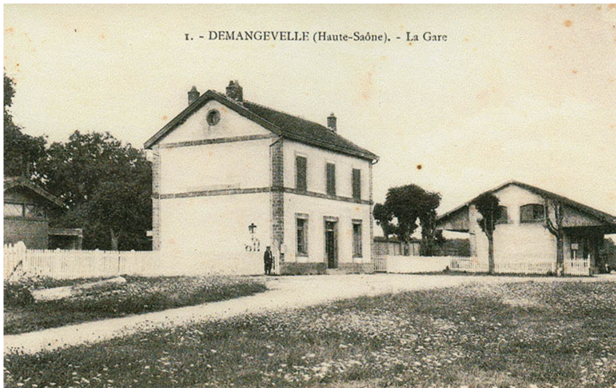
Demangevelle. La gare et la halle à marchandises. Carte postale.