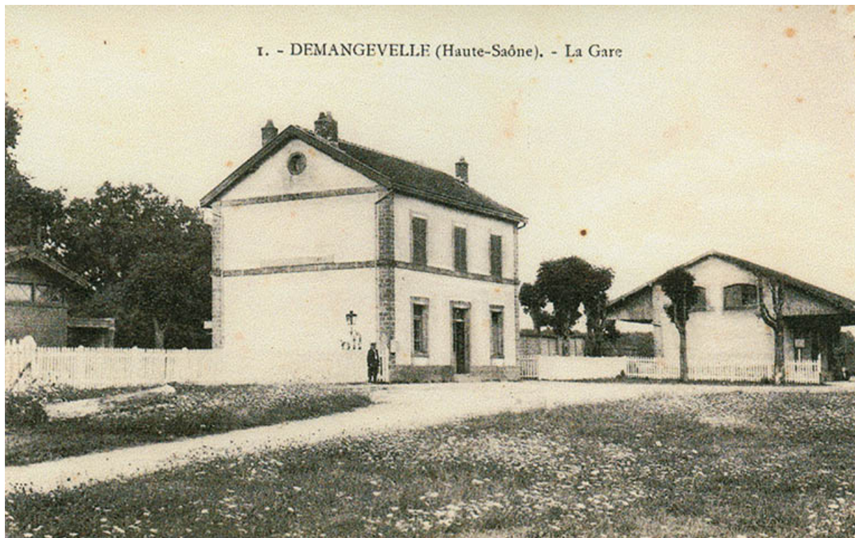
Demangevelle. La gare et la halle à marchandises. Carte postale.