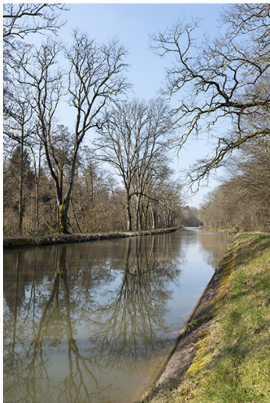
Le canal entre Pont-du-Bois et Selles (70).