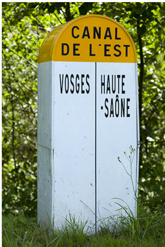
Borne indiquant la frontière des deux départements.