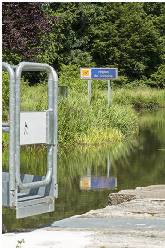
Arrivée du canal en Lorraine.