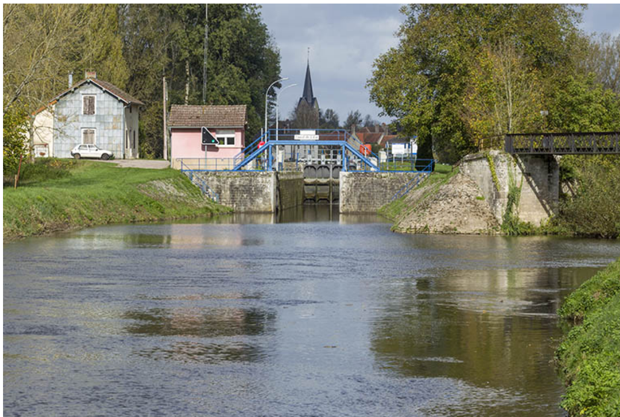
Depuis l'aval du site d'écluse n°46, la confluence du canal et du Coney, le poste de commande et la maison d'éclusier; Corre (70).