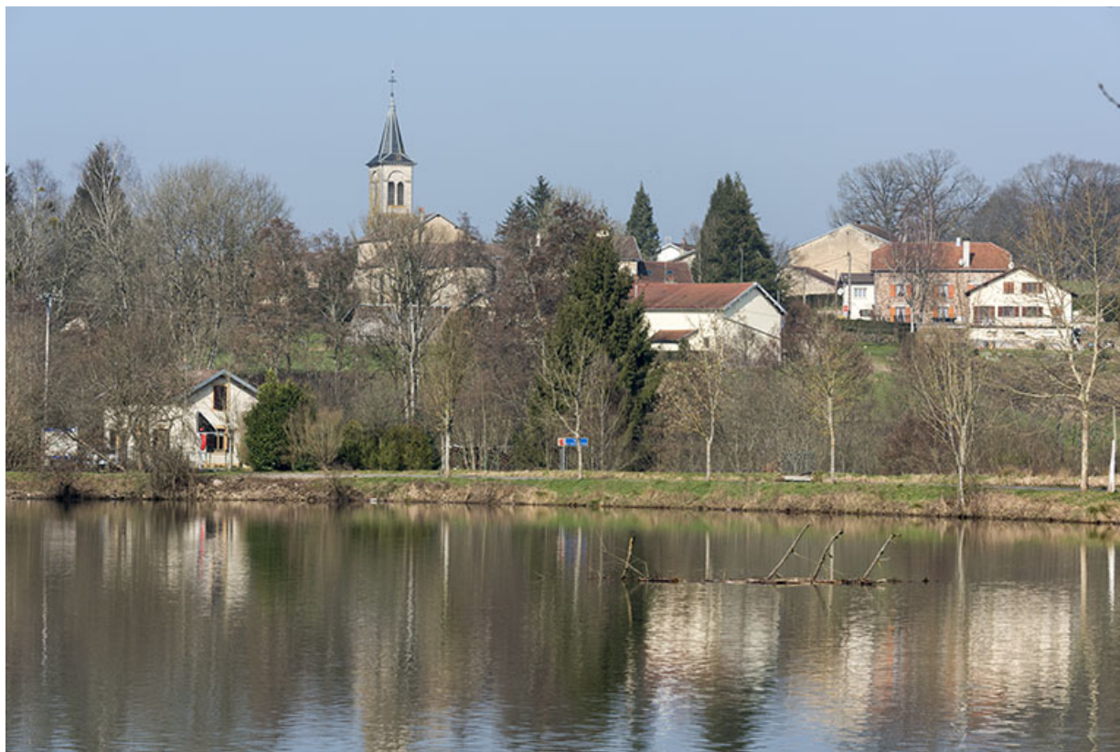
Ambiéwillers, première commune de Haute-Saône en amont sur le canal de l'Est.