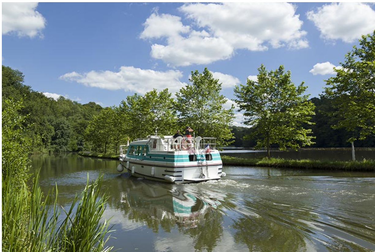
Le canal, vers Ambiévillers (70).