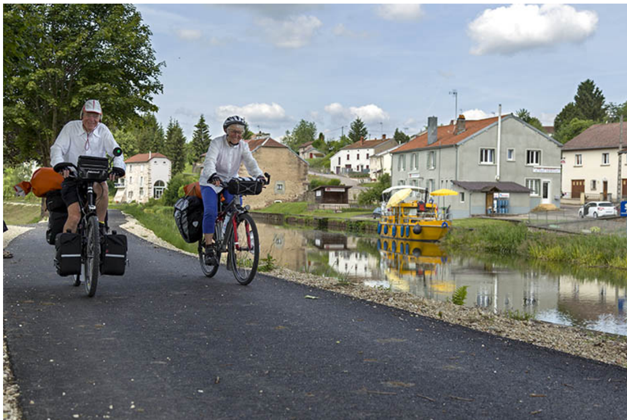
cyclistes empruntant la véloroute le long du canal, Selles (70).