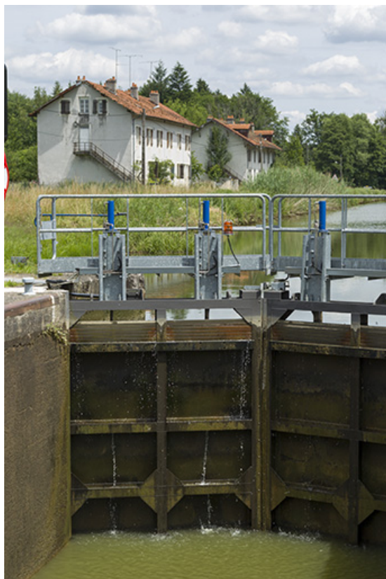
Ecluse n°44 : détail intérieur de la porte amont fermée et vue sur les cités, Demangevelle (70).