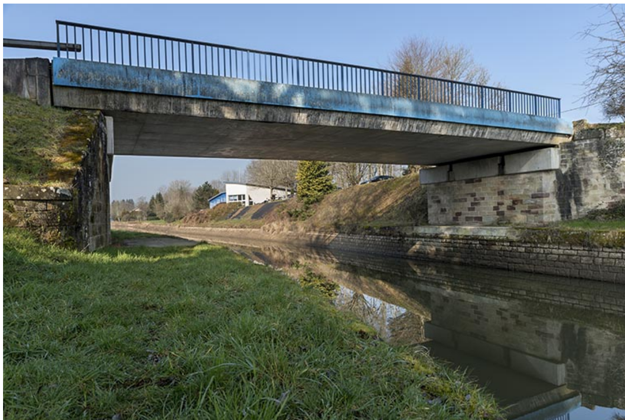
Pont routier enjambeant le canal, Pont-du-Bois (70).