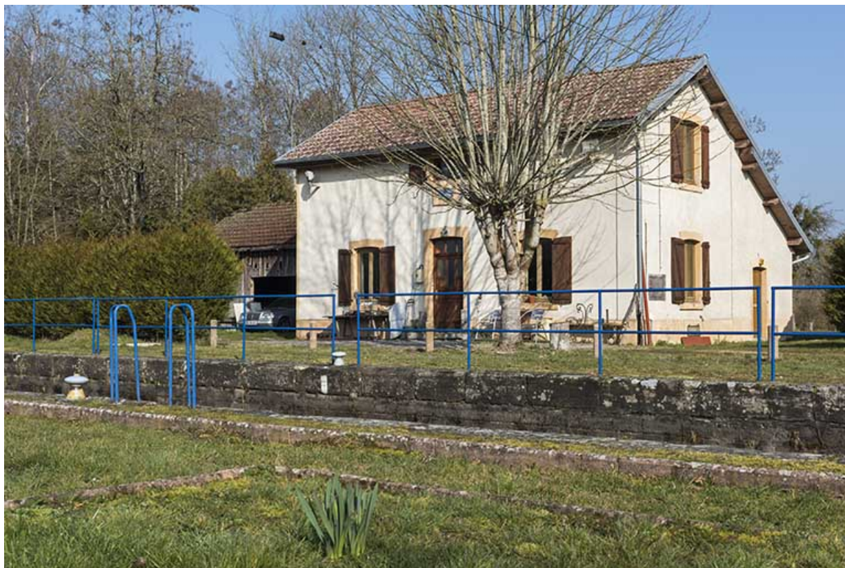
Maison d'éclusier de Pont-du-Bois (70).