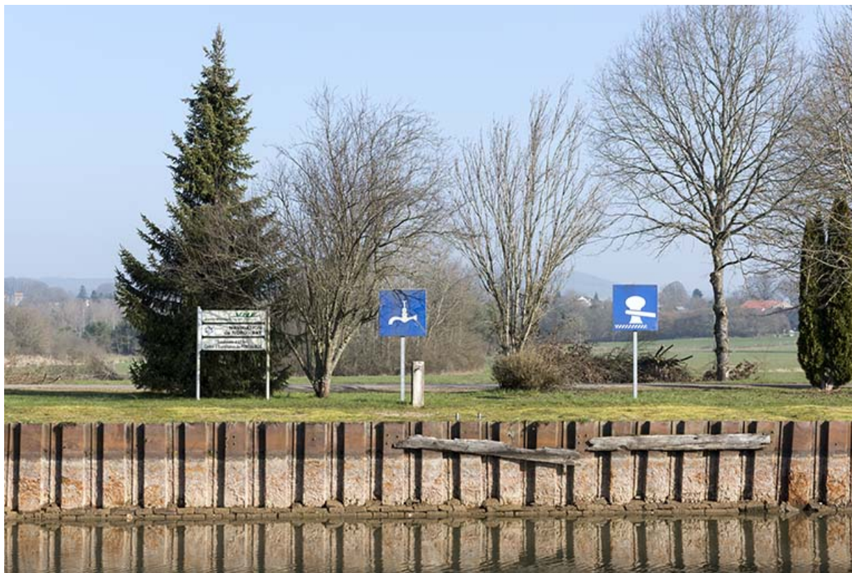
Détail des palplanches le long de la berge.