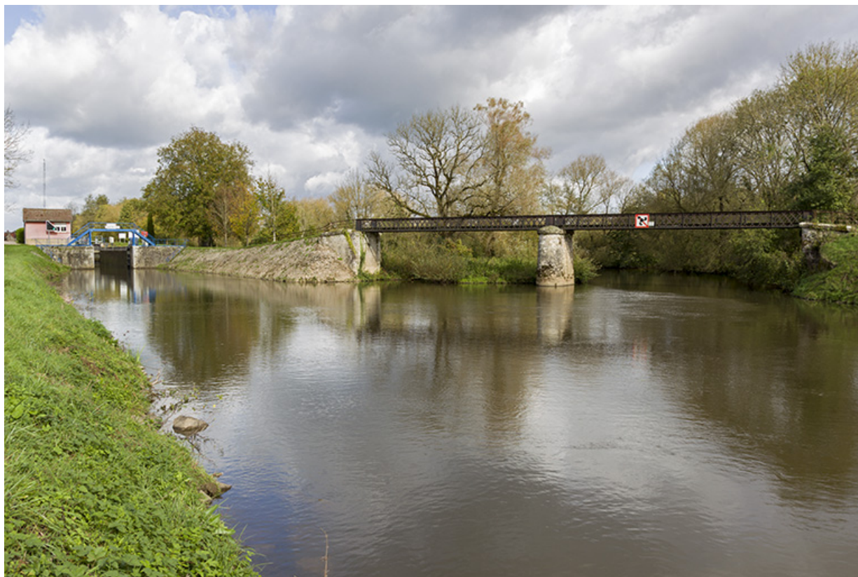
En amont de la confluence avec la Saône, la confluence du Coney et du canal, site d'écluse et passerelle sur le Coney, depuis le sud.