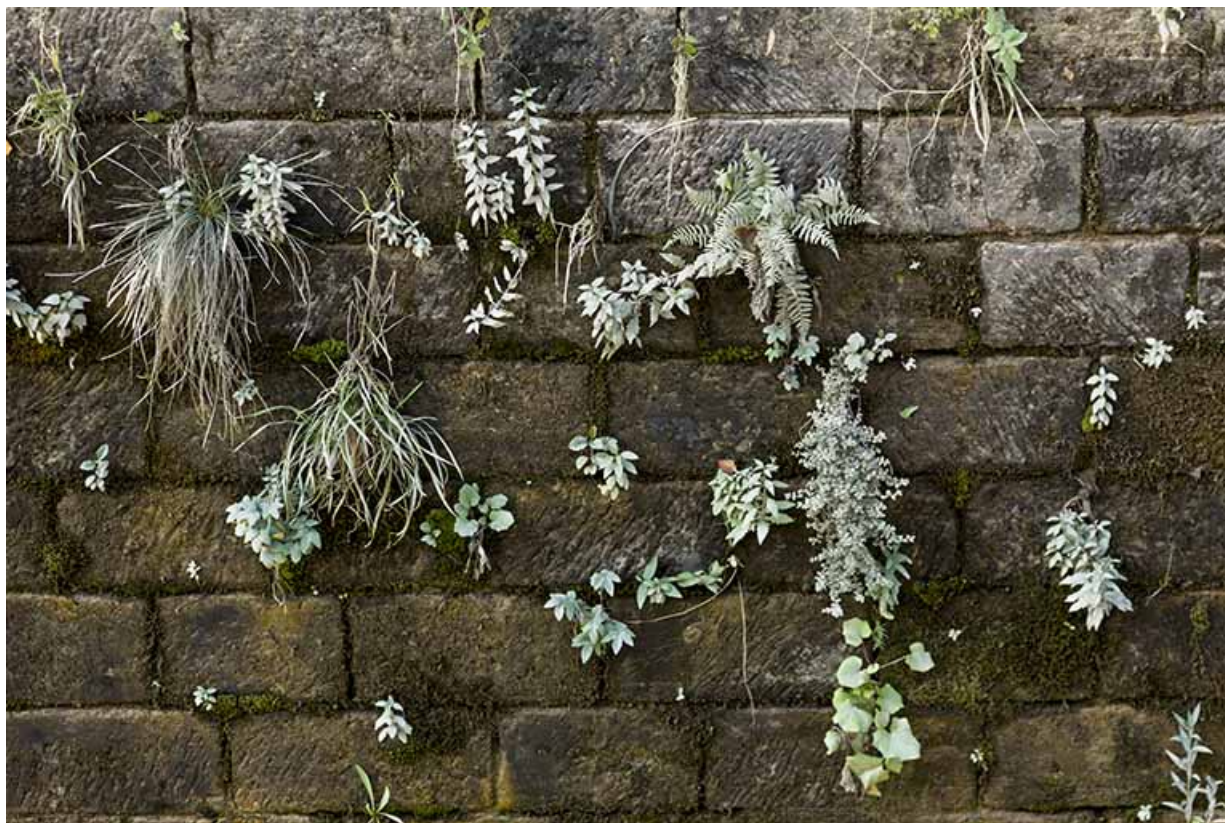
Détail sur la maçonnerie d'une écluse.