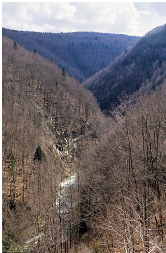
La vallée de la Bienne, depuis le viaduc de la Culée et l'entrée du tunnel de la Gouille aux Cerfs (Lézat).