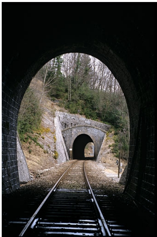
Tunnel de Sous la Côte : tête côté La Cluse (sud), depuis le tunnel des Frettes.