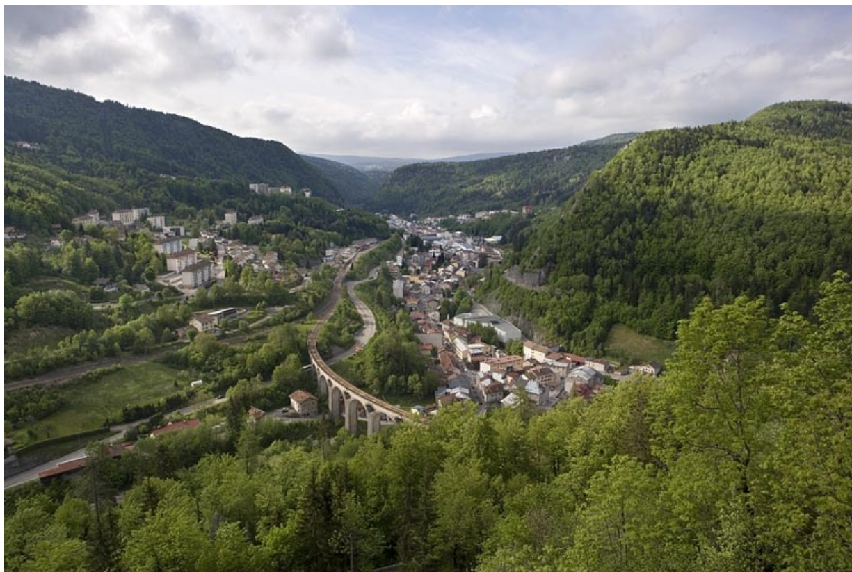
Au premier plan, le viaduc de Paul Séjourné.