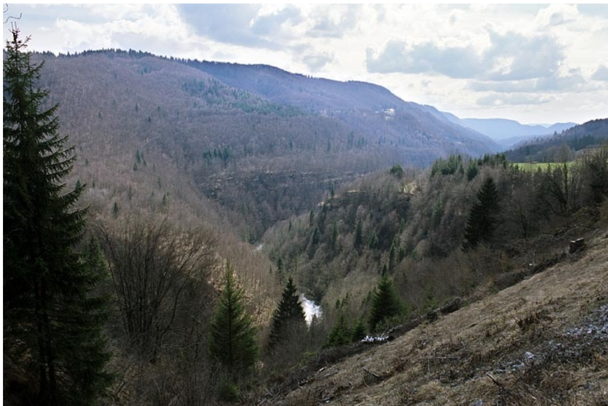
La vallée de la Bienne, depuis la sortie (côté La Cluse) du tunnel de la Gouille aux Cerfs (Lézat).