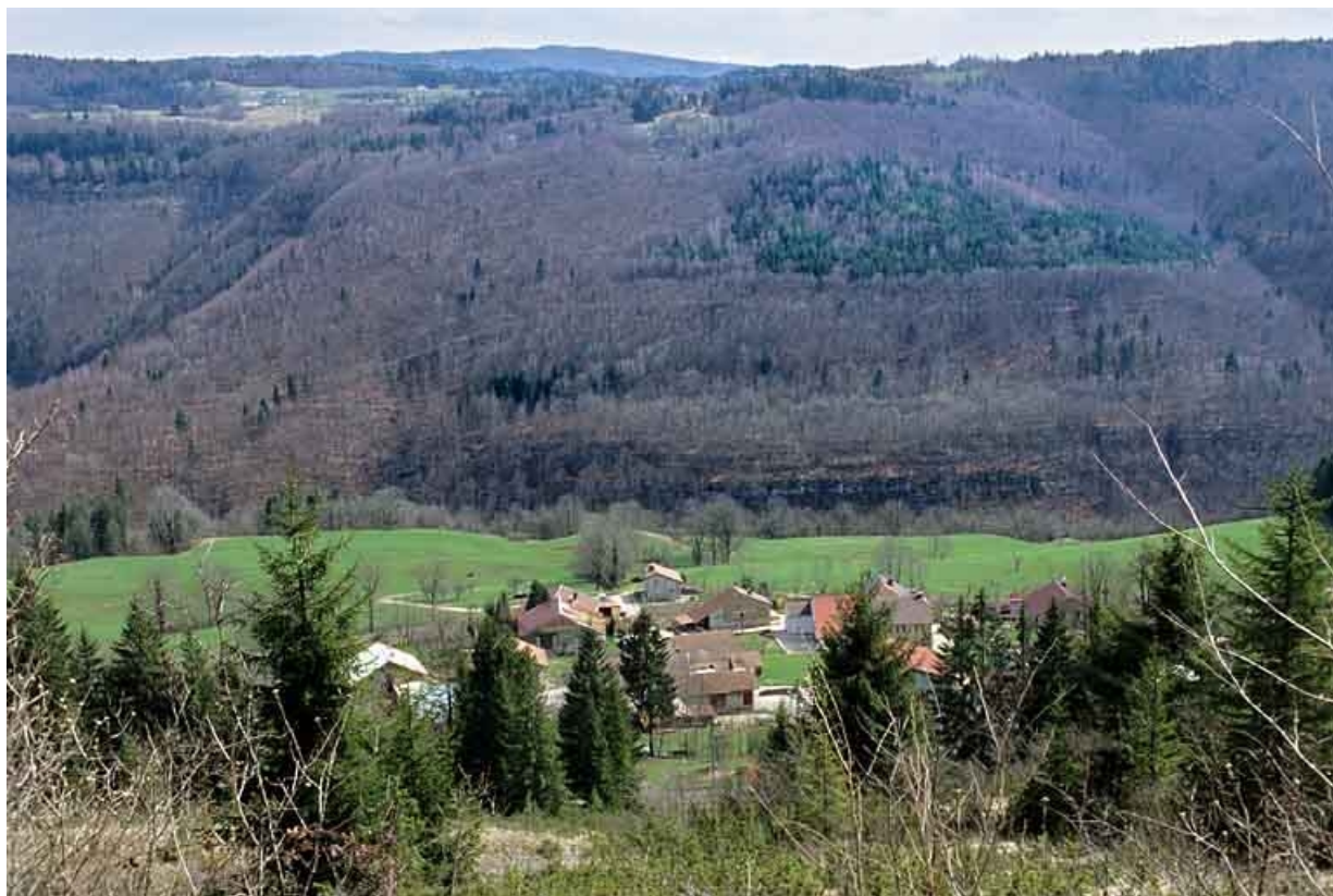
Vue d'ensemble de la vallée de la Bienne sur la commune de Lézat.