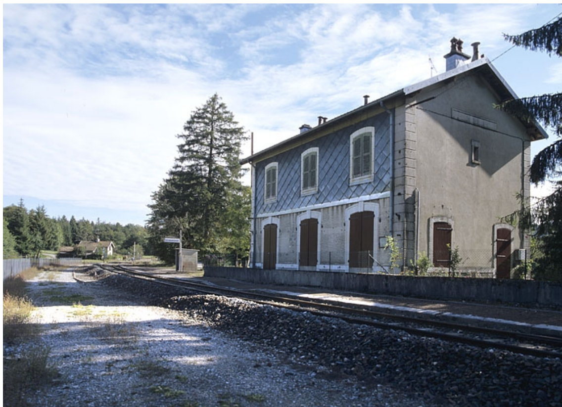
Façade postérieure du bâtiment des voyageurs (côté voie), de trois quarts droite.