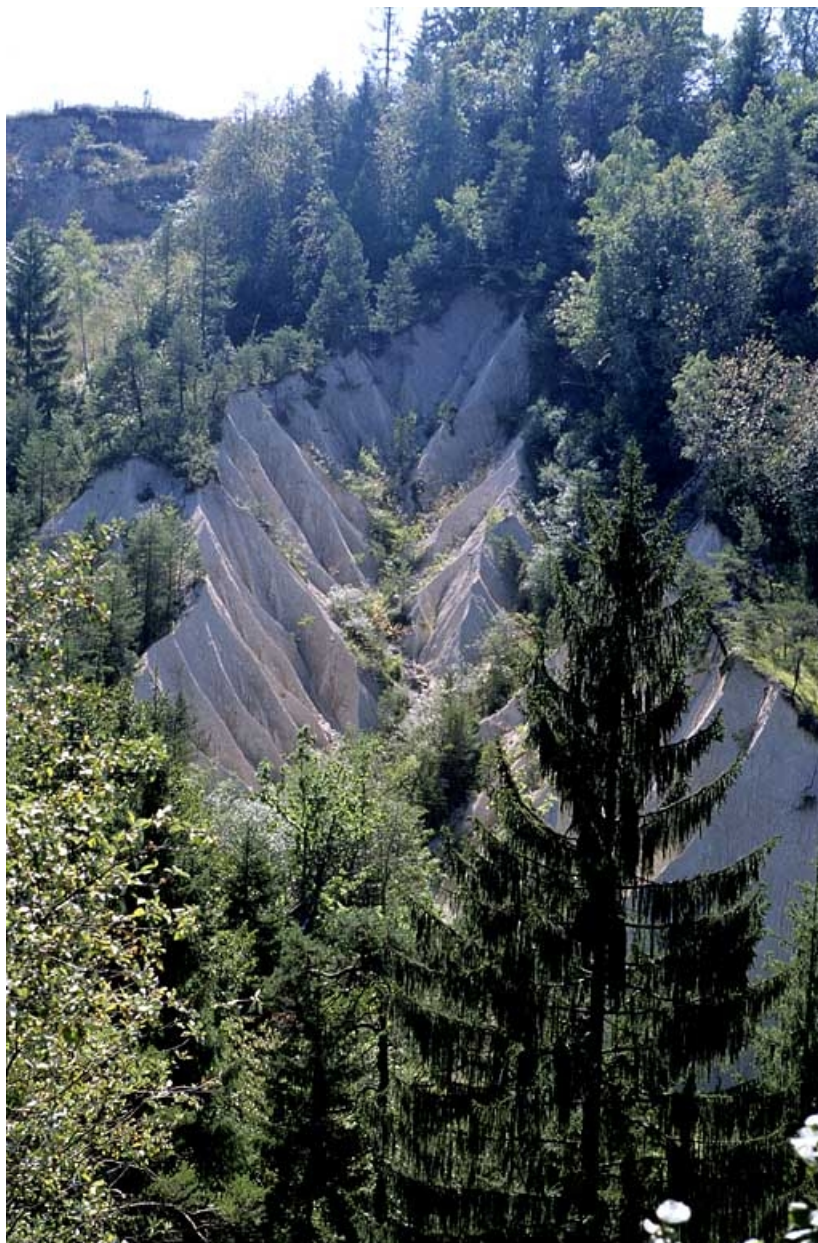
Ravinement au lieu-dit Truchebenate (Arbent), face à la voie, de l'autre côté du vallon du Merdanson.