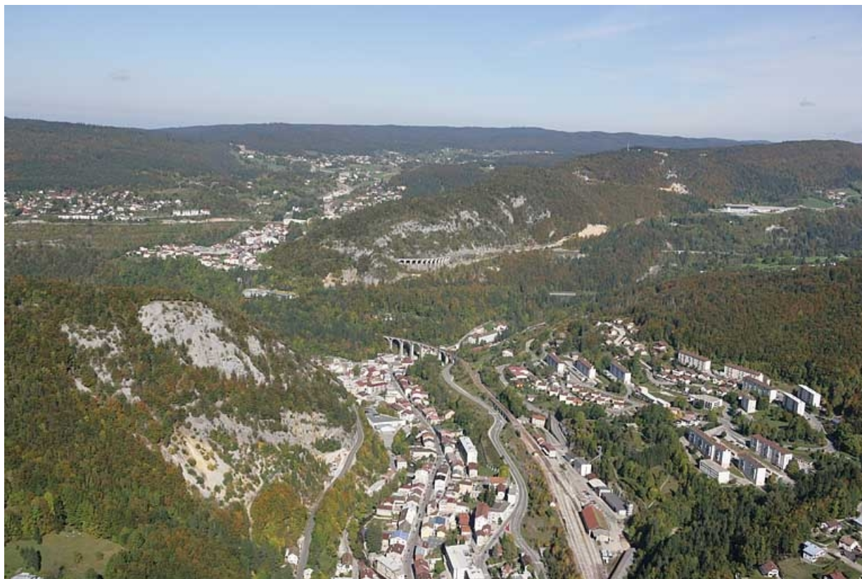
Au premier plan, la ville de Morez ; à l'arrière-plan à gauche, celle de Morbier.