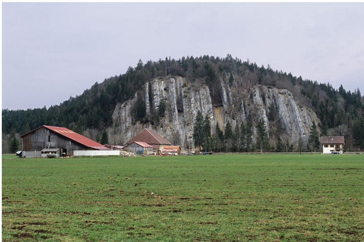
Le paysage entre Champagnole et Saint-Laurent-en-Grandvaux : le massif rocheux du Rachet, au Cernois (commune d'Entre-deux-Monts), dans la vallée de la Lemme. Ce relief, à l'extrémité de la Haute Joux, laisse voir des couches de calcaire du Jurassique supérieur presque verticales.