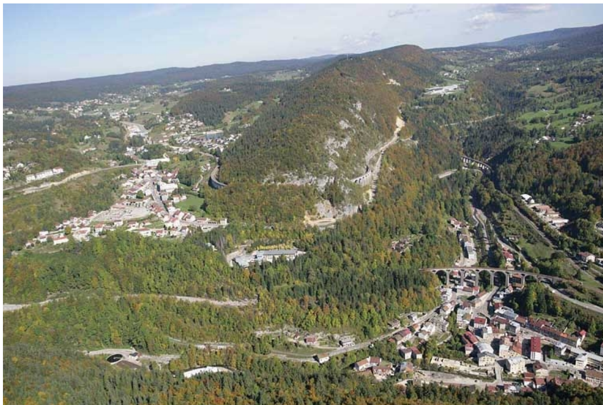
Vue aérienne du relief de la zone de Morbier - Morez, depuis le sud-ouest. À gauche, la ville de Morbier ; à droite, la vallée de l'Evalude, barrée au premier plan par le viaduc de Paul Séjourné.