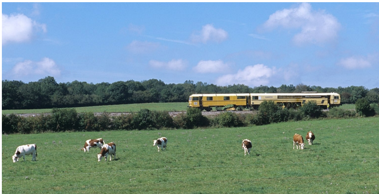
La voie entre Andelot-en-Montagne et Champagnole. Train de meulage, sur la commune du Pasquier.