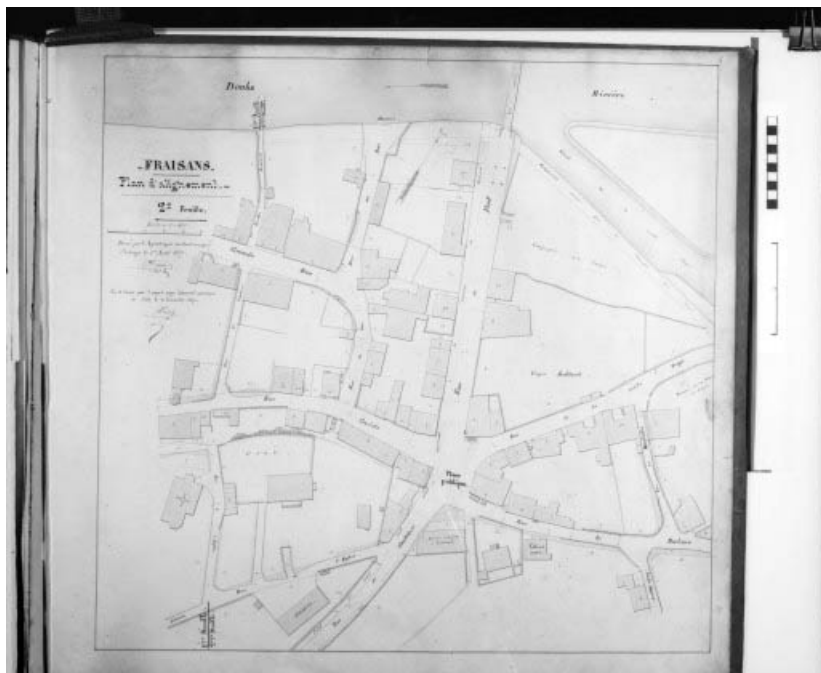
Fraisans. Plan d'alignement. 2e feuille.