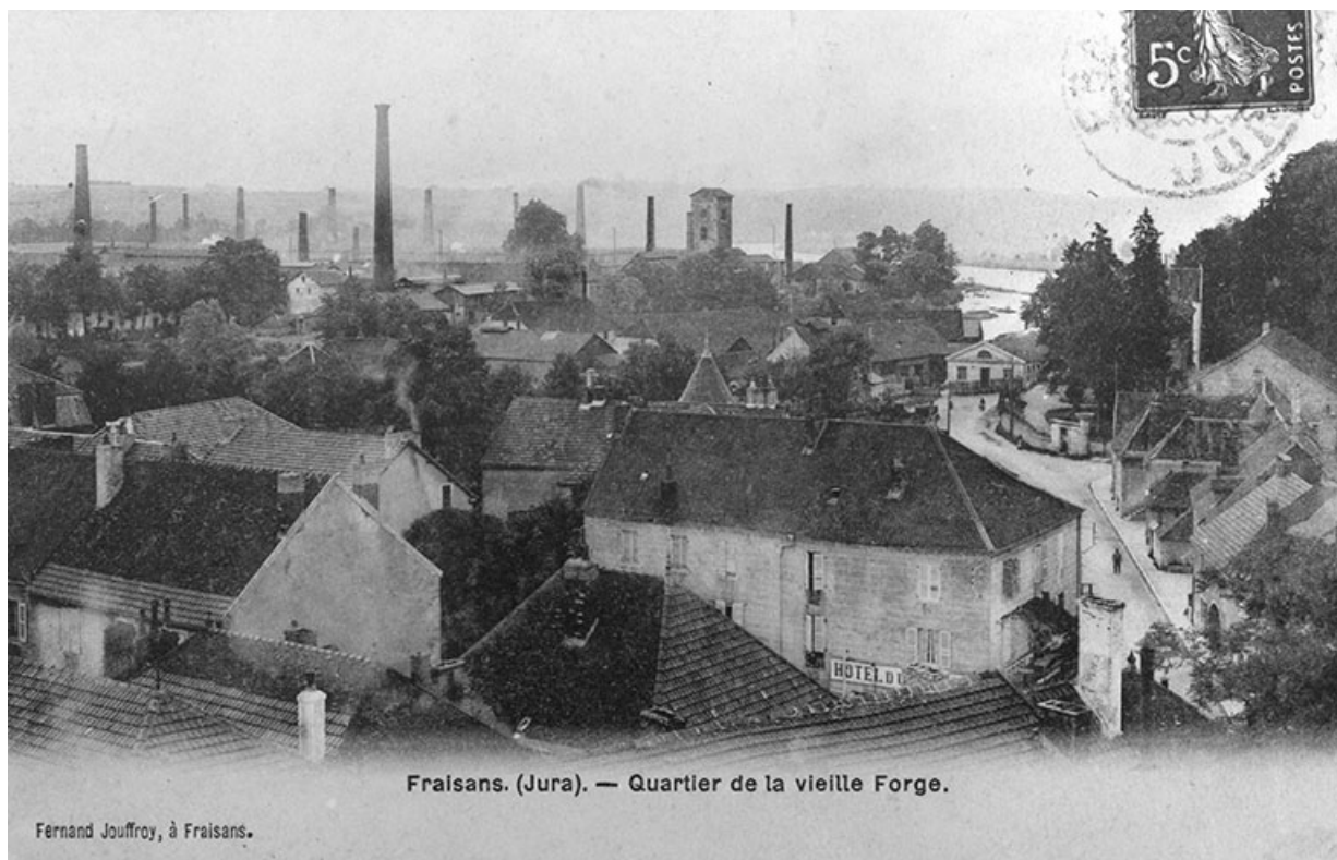
Fraisans. (Jura). — Quartier de la vieille Forge.