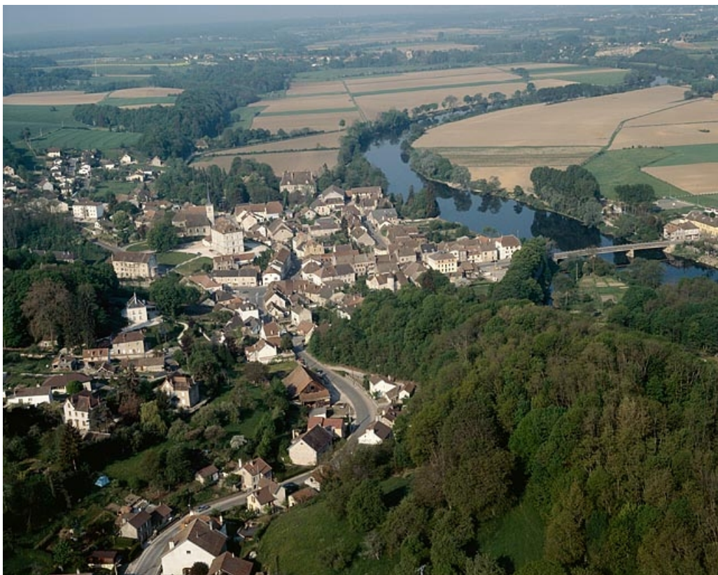
Le village vu du nord-est, photographie aérienne.