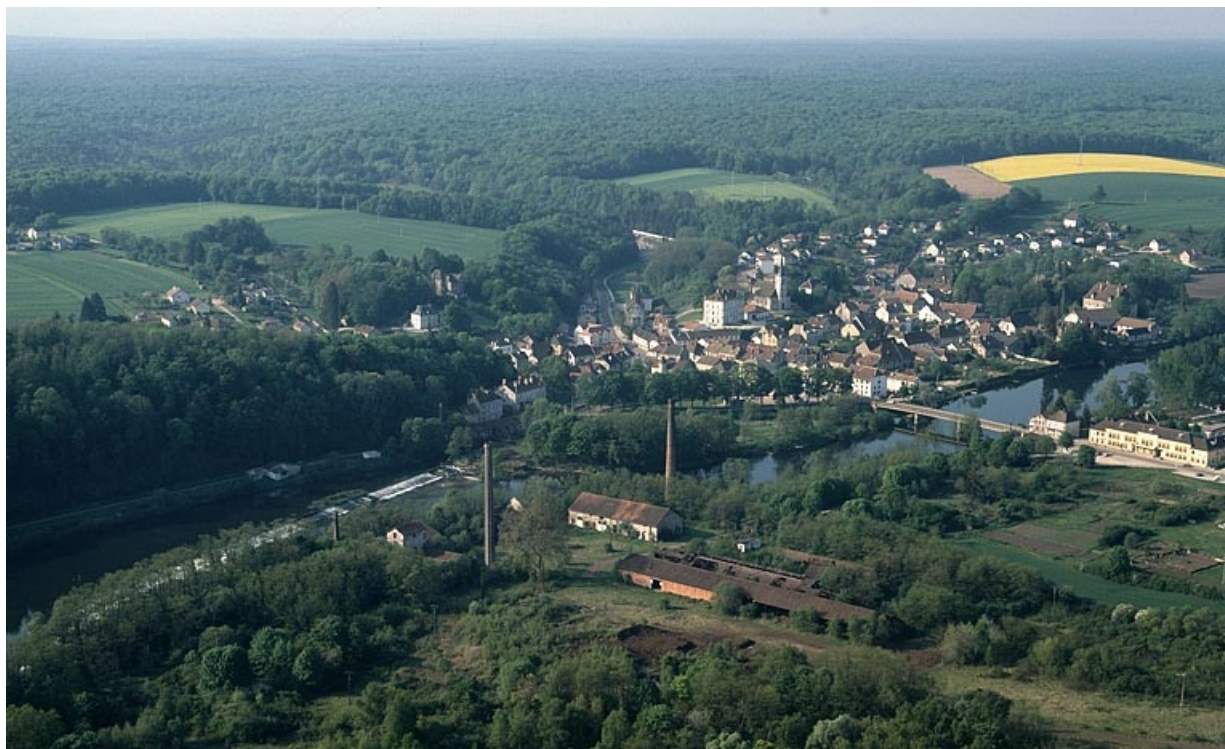
Vue d'ensemble du village et du site industriel depuis le nord (vue rapprochée), photographie aérienne. 39, Fraisans rue de la Gare