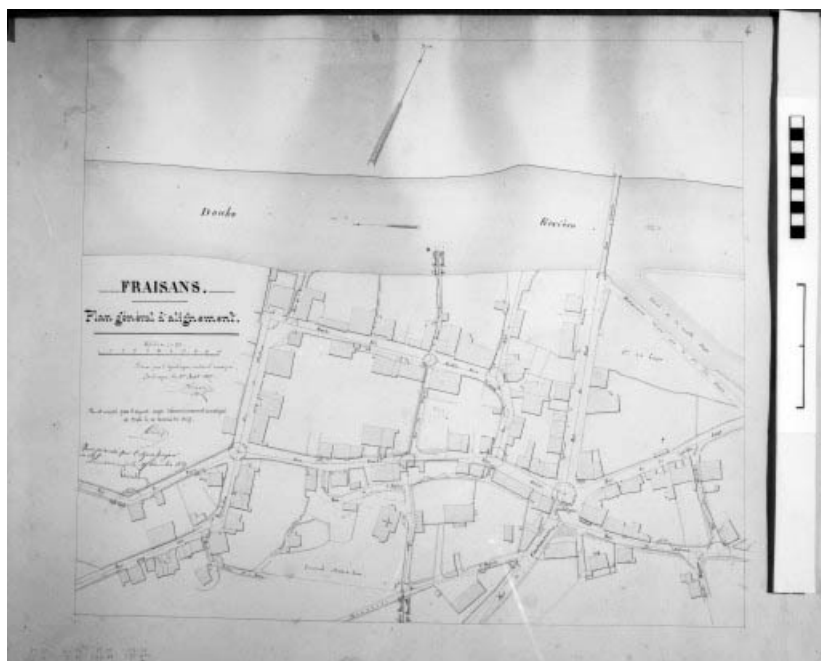
Fraisans. Plan général d'alignement.