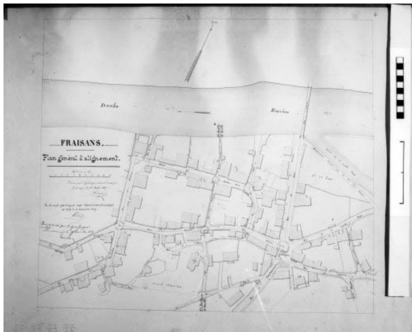
Fraisans. Plan général d'alignement.