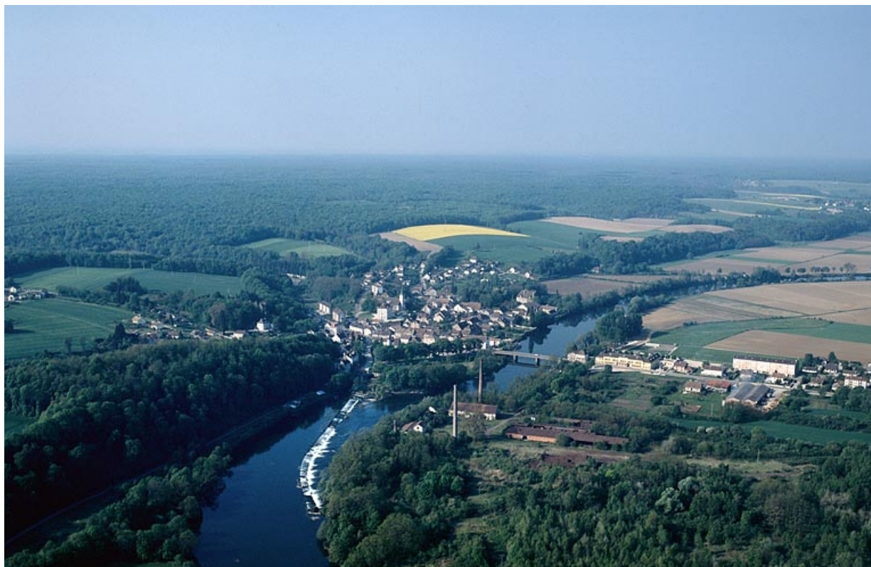
Vue d'ensemble du village et du site industriel depuis le nord, photographie aérienne. 39, Fraisans rue de la Gare