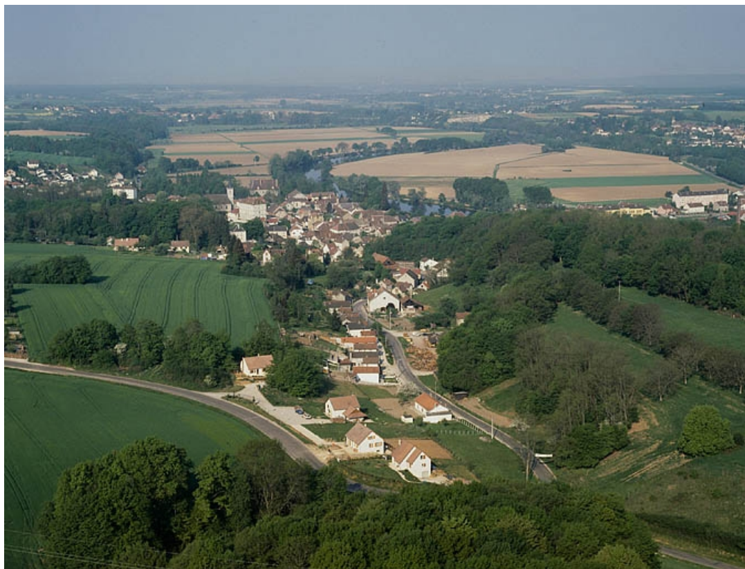
Cité ouvrière des Madiottes et village vus depuis l'est, photographie aérienne. 39, Fraisans rue de la Gare