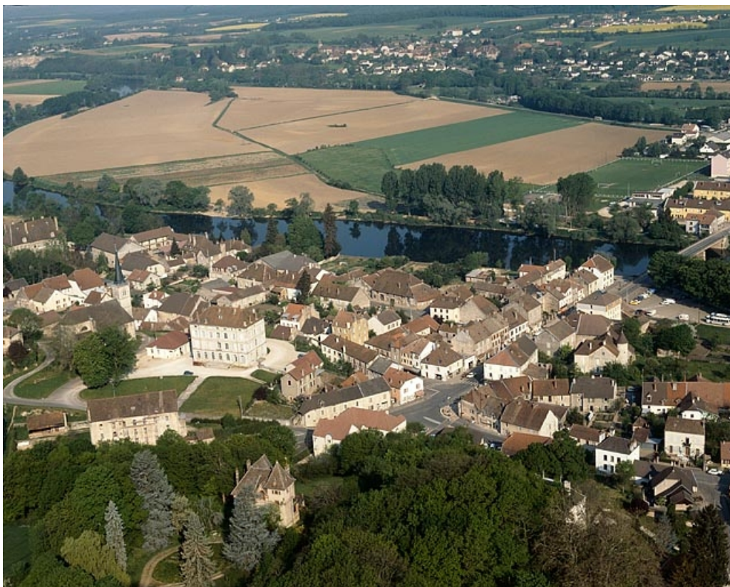
Le centre du village, photographie aérienne.