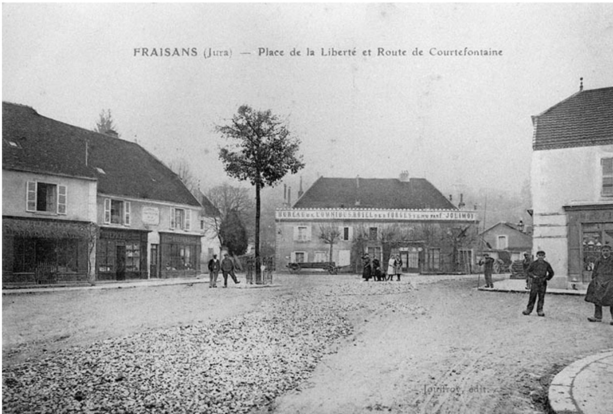
Fraisans (Jura) - Place de la Liberté et Route de Courtefontaine.