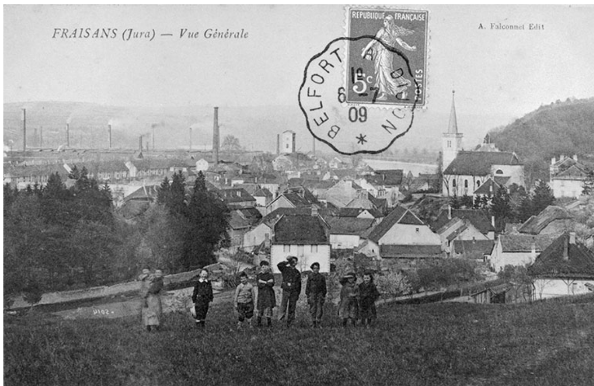
Fraisans (Jura) - Vue générale.