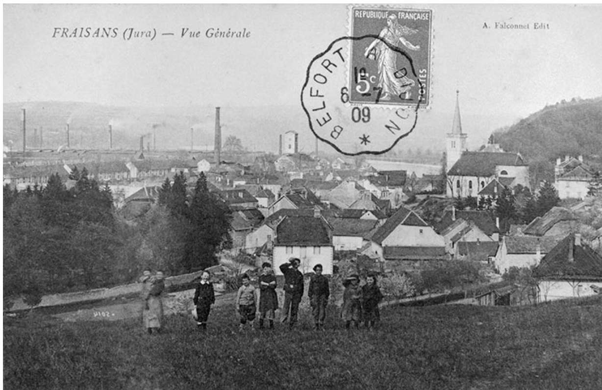
Fraisans (Jura) - Vue générale.