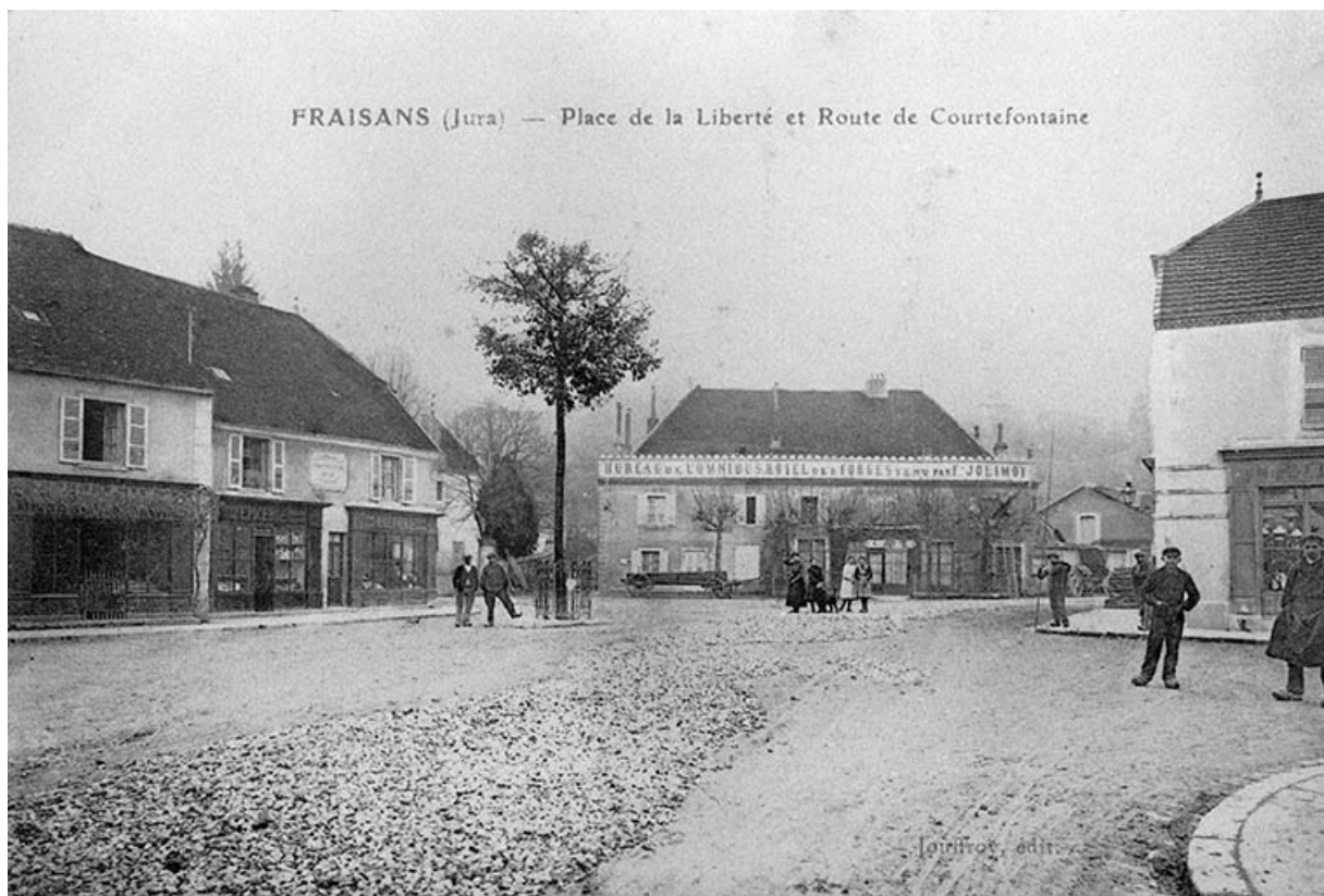
Fraisans (Jura) - Place de la Liberté et Route de Courtefontaine.