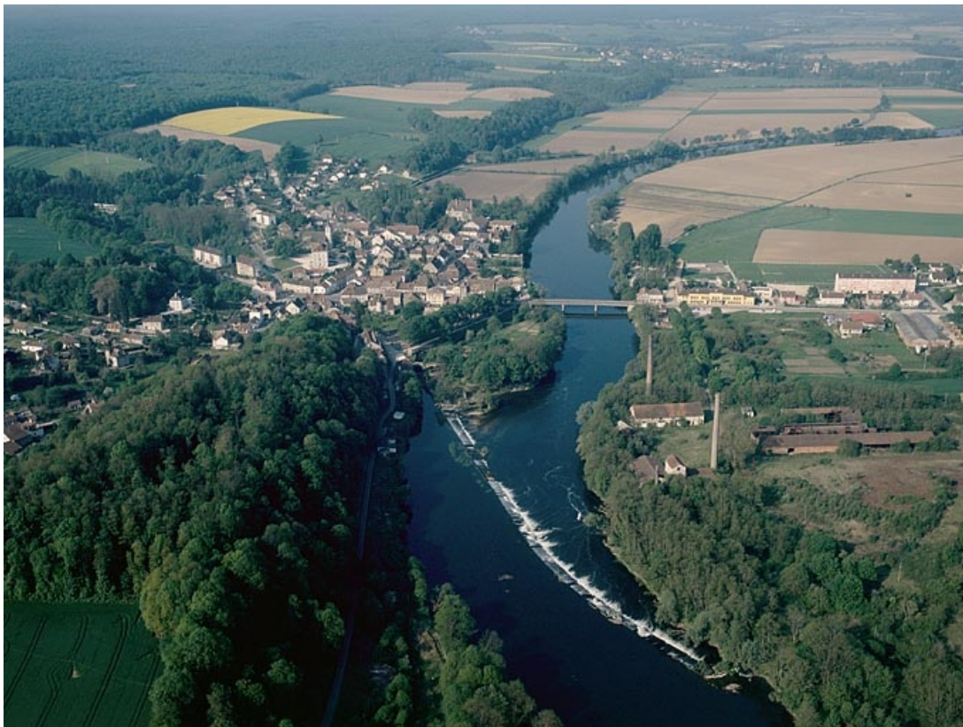
Vue d'ensemble du village et du site industriel depuis le nord-est, photographie aérienne. 39, Fraisans rue de la Gare