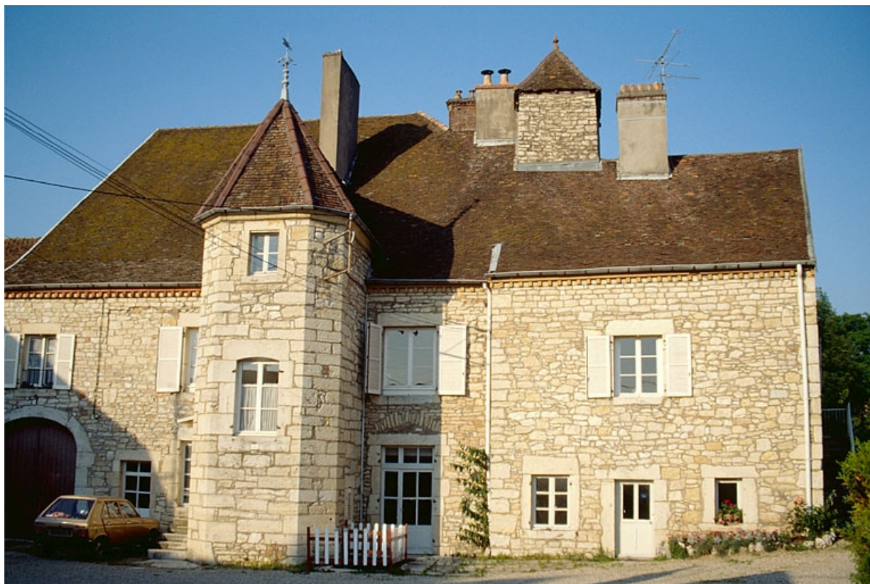
Façade antérieure du logement patronal et des écuries.

39, Dole, 38, 40, 42 rue Julien Feuvrier