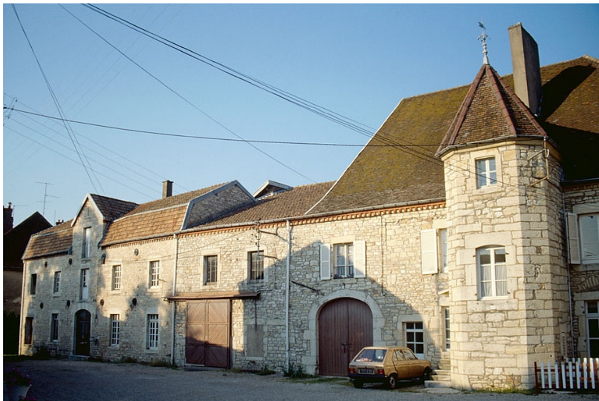
Façade antérieure des écuries et de l'atelier de fabrication.

39, Dole, 38, 40, 42 rue Julien Feuvrier