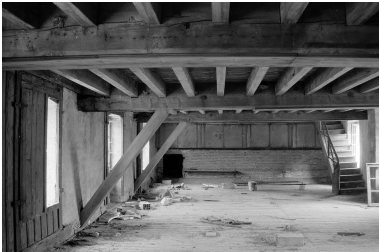
Atelier de fabrication : intérieur de la pièce de séchage du premier étage. Le fond de la pièce est fermé par le conduit d'amenée d'air chaud.

39, Dole, 38, 40, 42 rue Julien Feuvrier