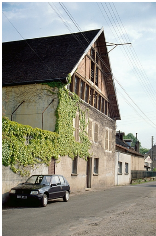
Façade antérieure de l'atelier de fabrication (J).