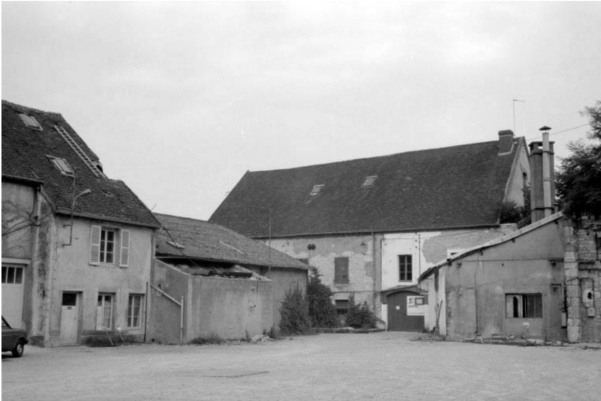
Ateliers de fabrication (H, J) et hangar.