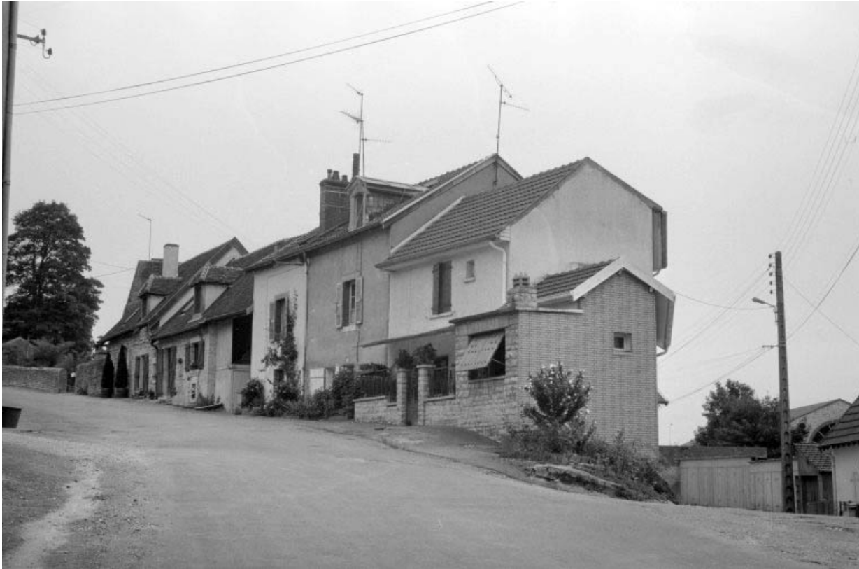
Logements d'ouvriers, depuis le nord.