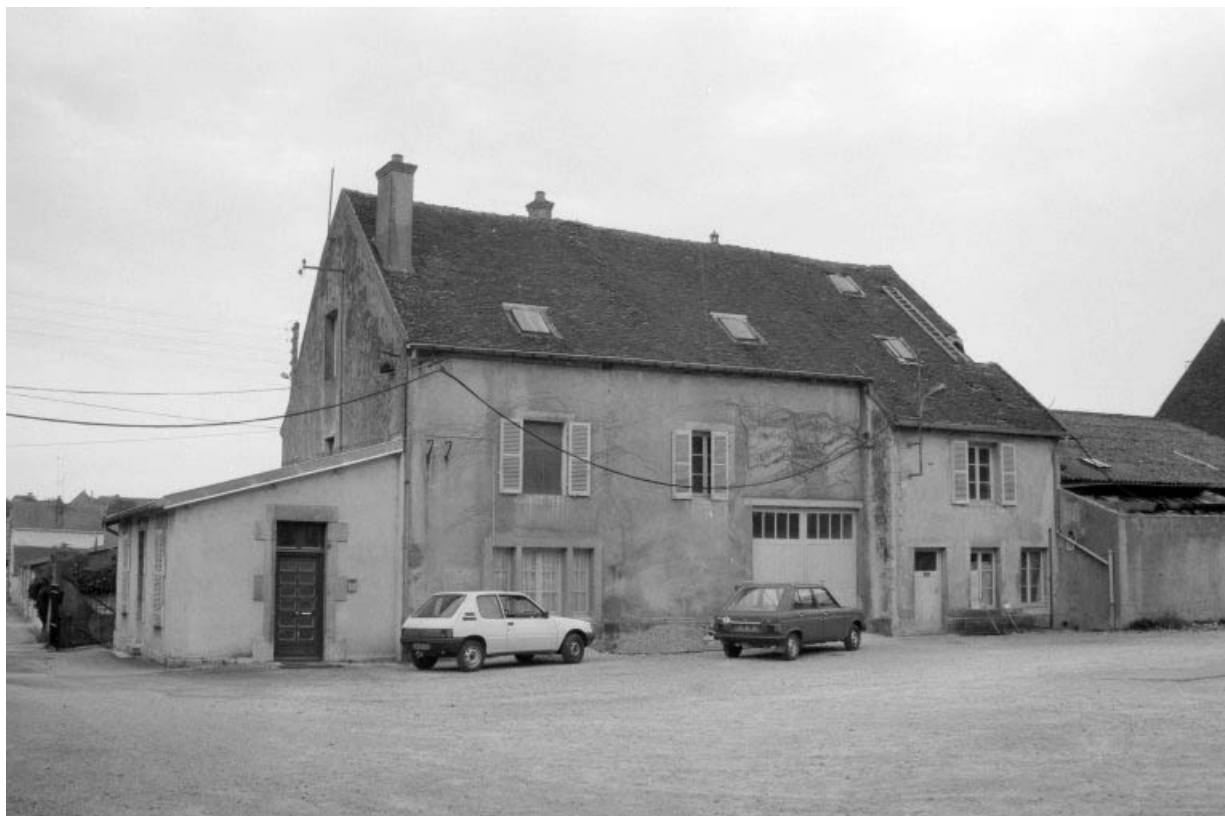
Façade postérieure du bureau-logement patronal.