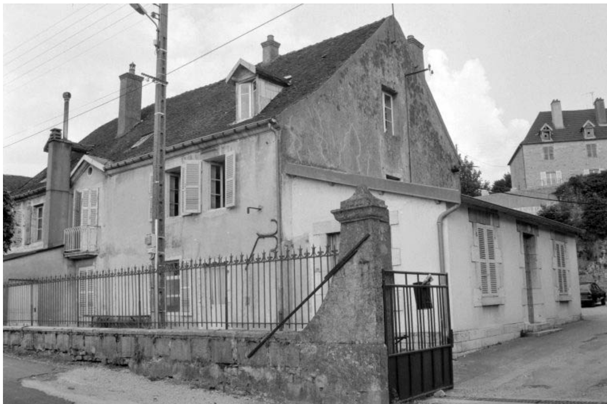
Bureau-logement patronal, vu de trois quarts droit.