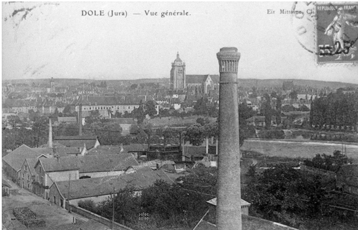
Dole (Jura) - Vue générale.