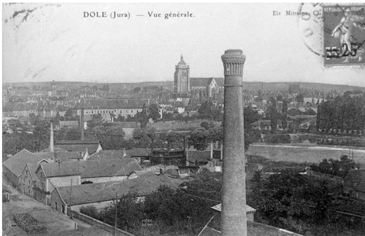
Dole (Jura) - Vue générale.