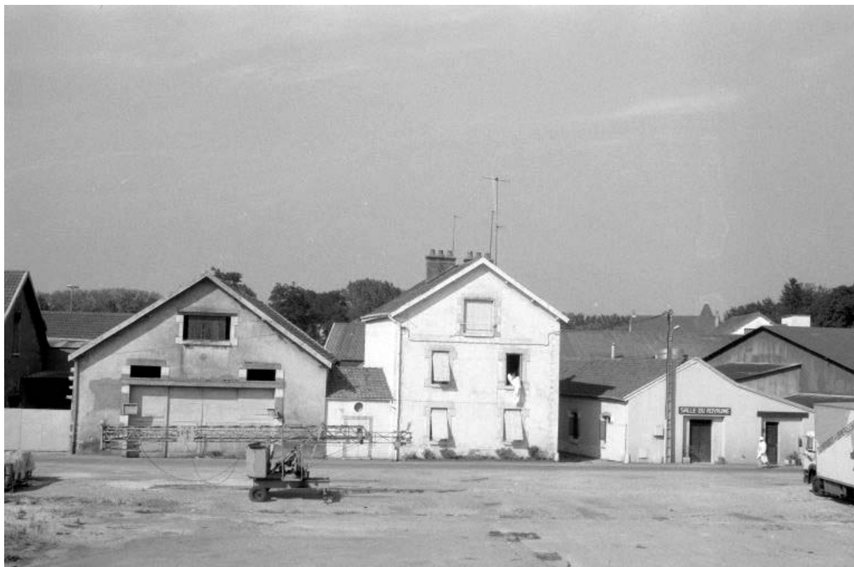
Façade antérieure des écuries et magasins industriels.