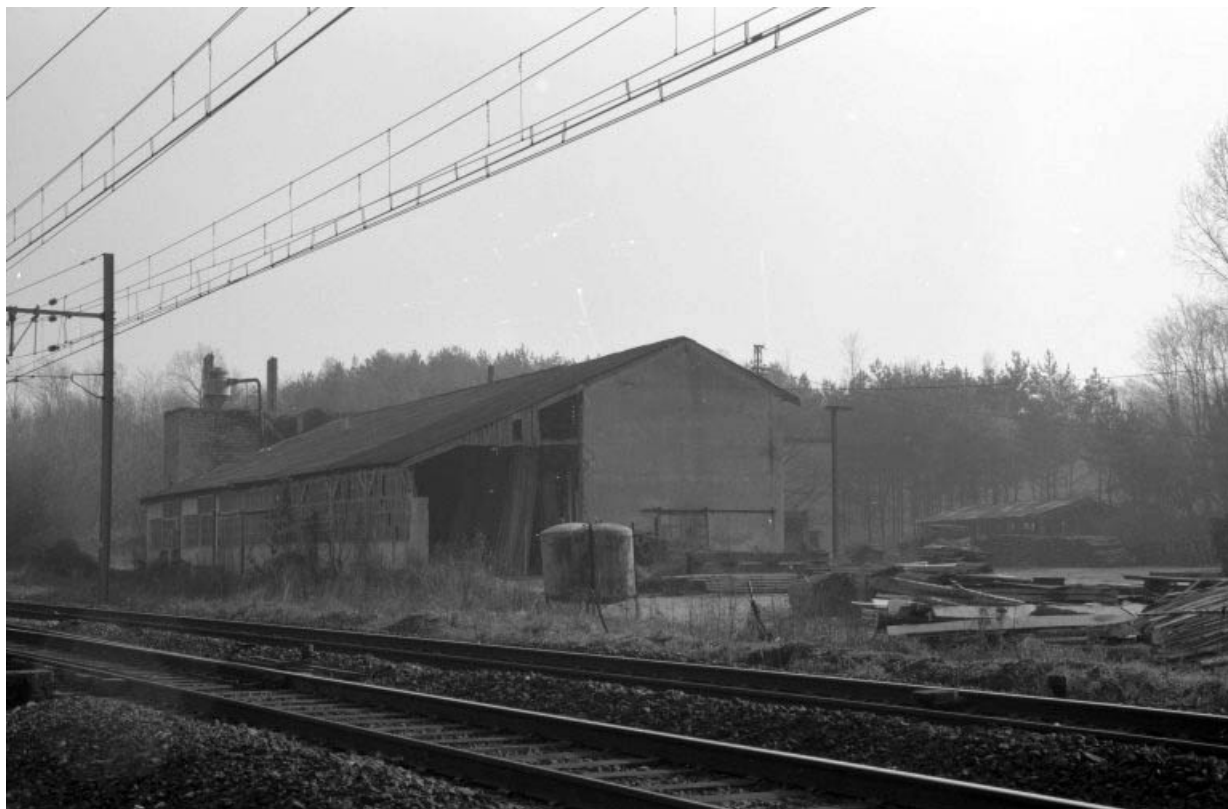
Menuiserie (M), depuis le nord-est. 39, Champvans, 36 avenue de la Gare