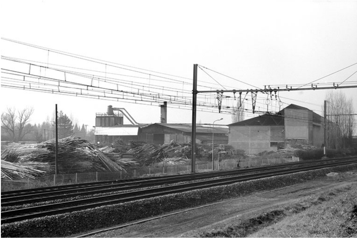
Etuves et atelier des scies, depuis l'est.