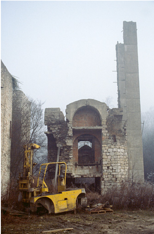
Vestiges du four à chaux.