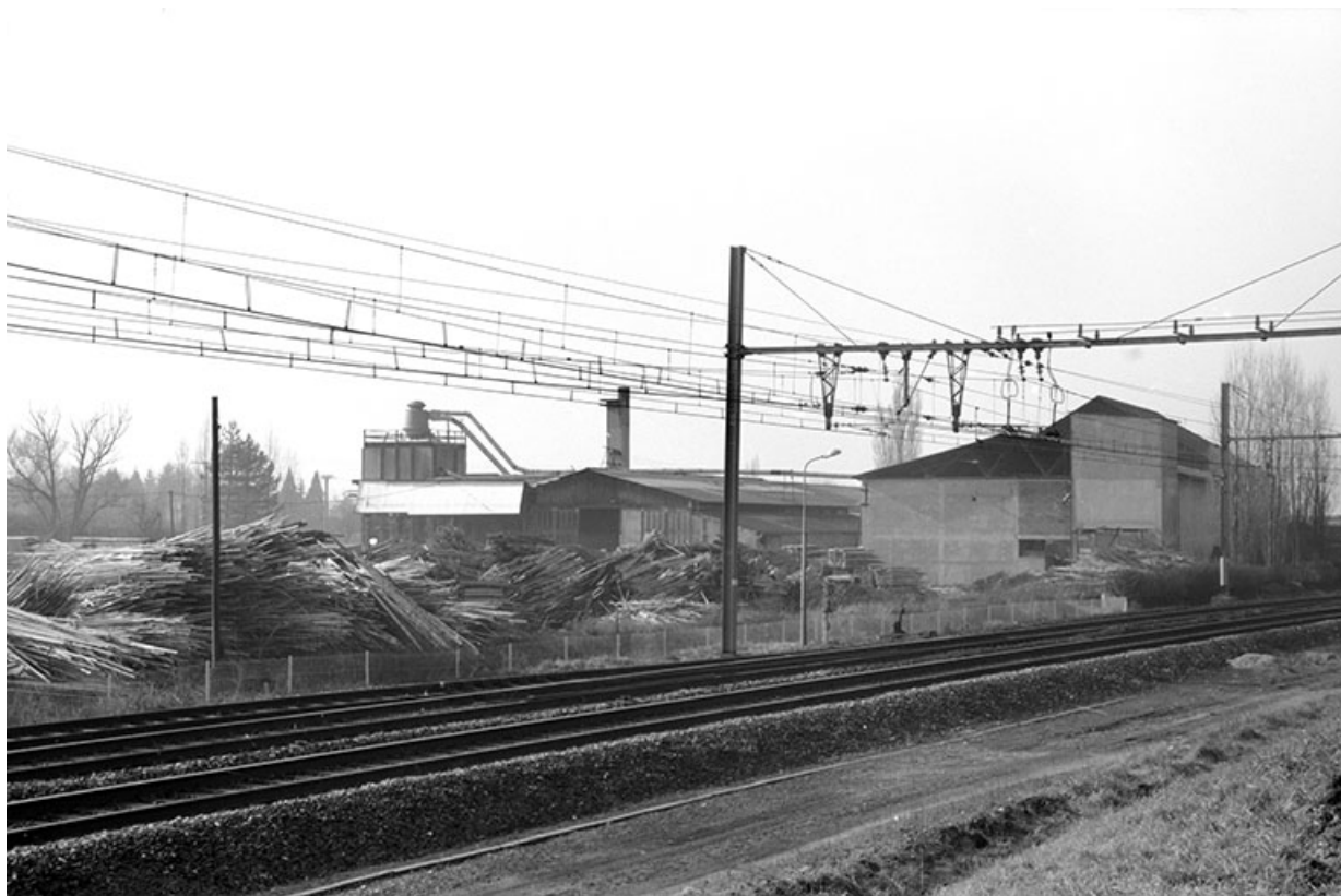
Etuves et atelier des scies, depuis l'est.