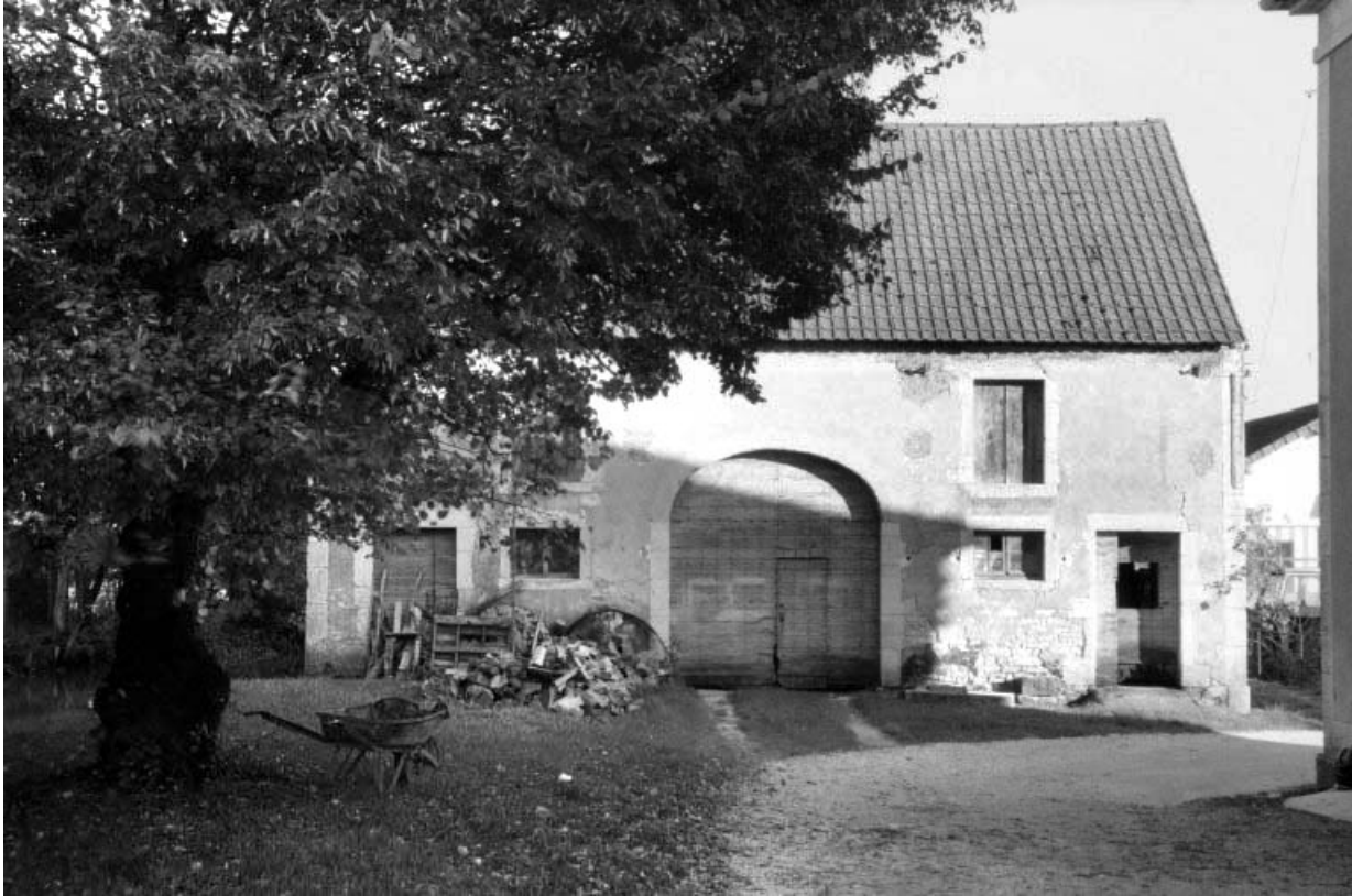
Façade antérieure de l'ancien battoir (D).