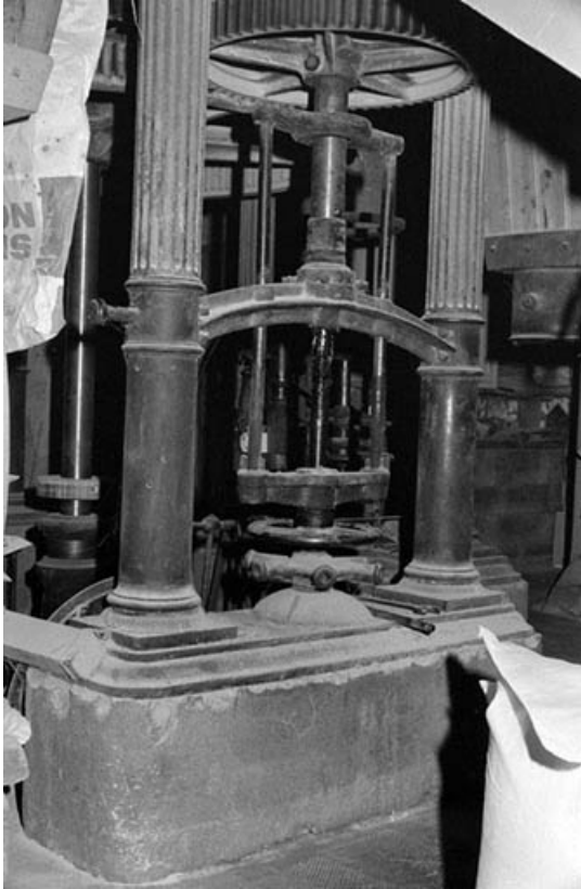
Beffroi : arbre moteur d'une paire de meules et système d'embrayage.