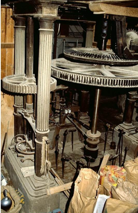
Beffroi : transmission et commandes d'admission d'eau de la turbine.