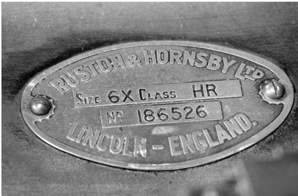
Moteur Ruston et Hornsby : plaque de constructeur.