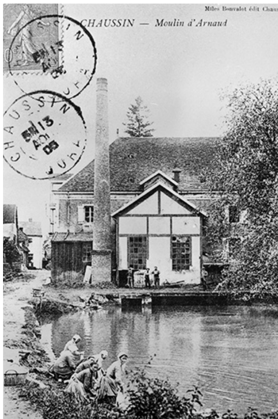
Chausain - Moulin d'Arnaud.