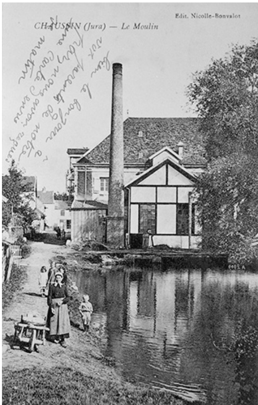
Chaussin (Jura) - Le Moulin.