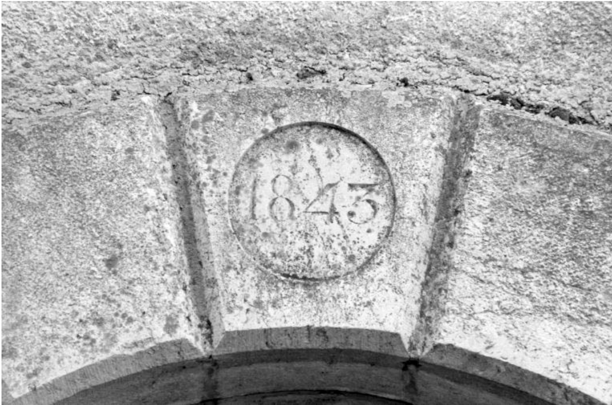
Porte centrale de la minoterie : date portée.