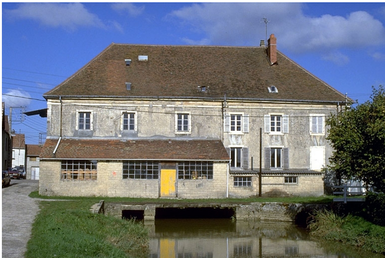
Façade postérieure de la minoterie.