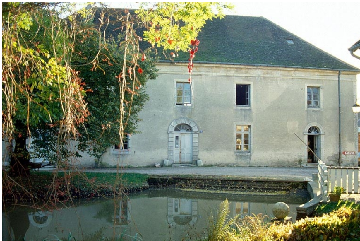
Façade antérieure de la minoterie.