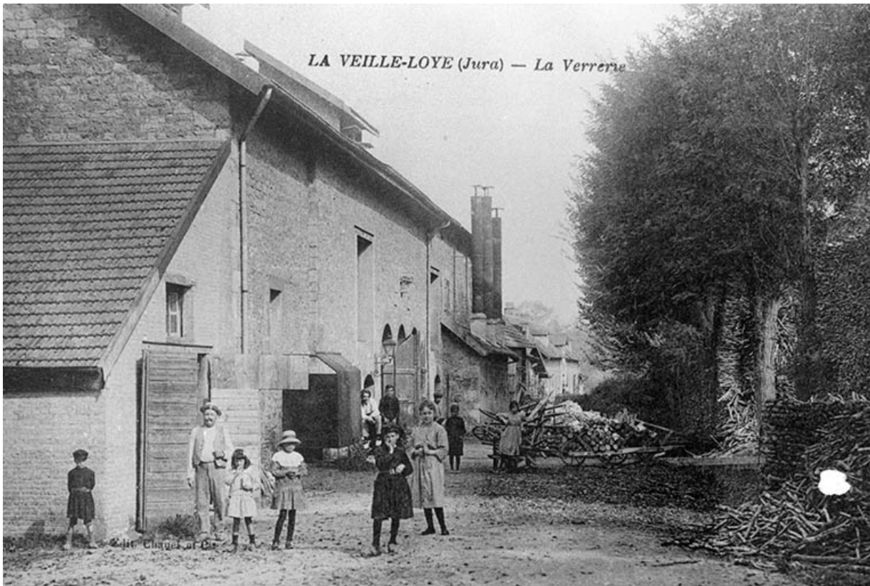
La Vieille-Loye (Jura) - La Verrerie. 39, La Vieille-Loye, lieudit : la Verrerie