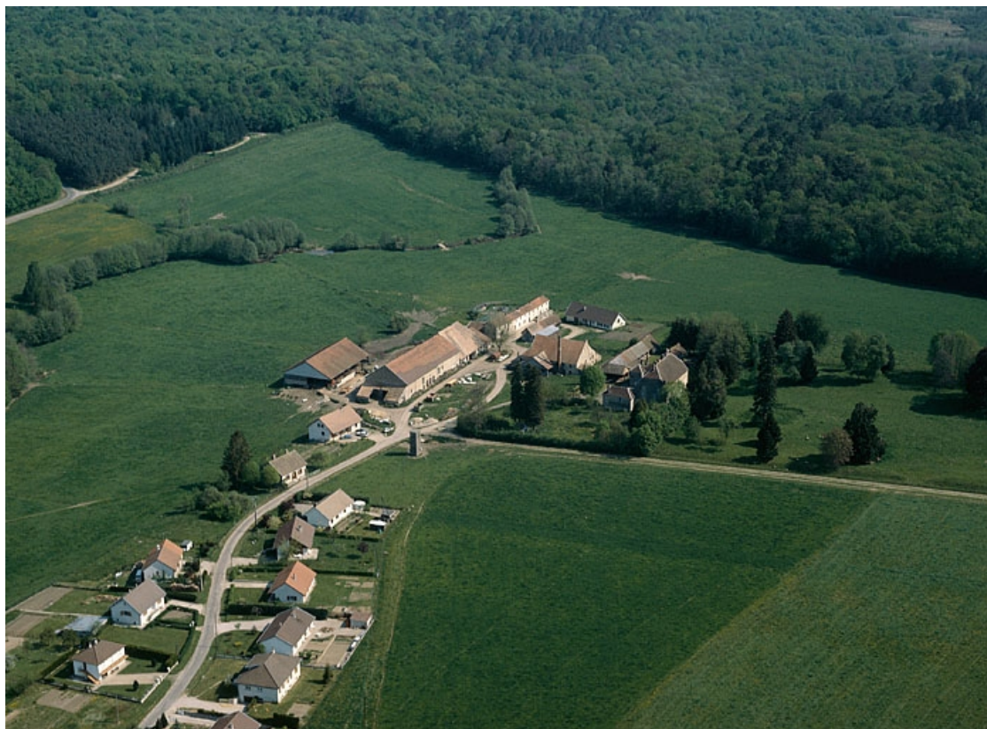
Vue aérienne depuis le sud-ouest.