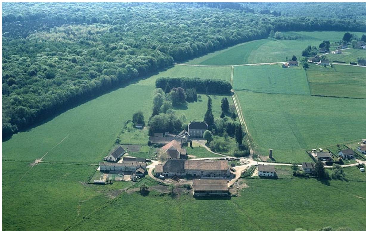
Vue aérienne depuis le nord-ouest.

39, La Vieille-Loye, lieudit : la Verrerie