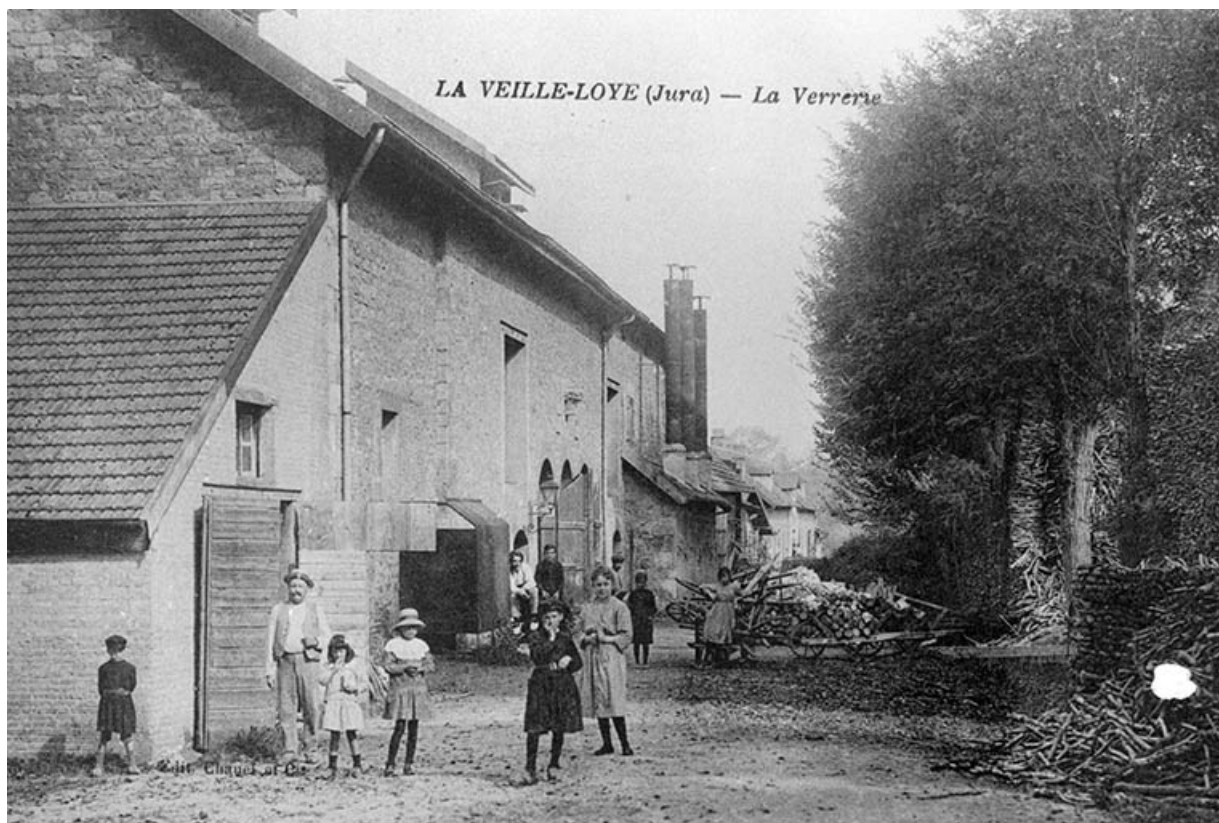
La Vieille-Loye (Jura) - La Verrerie. 39, La Vieille-Loye, lieudit : la Verrerie