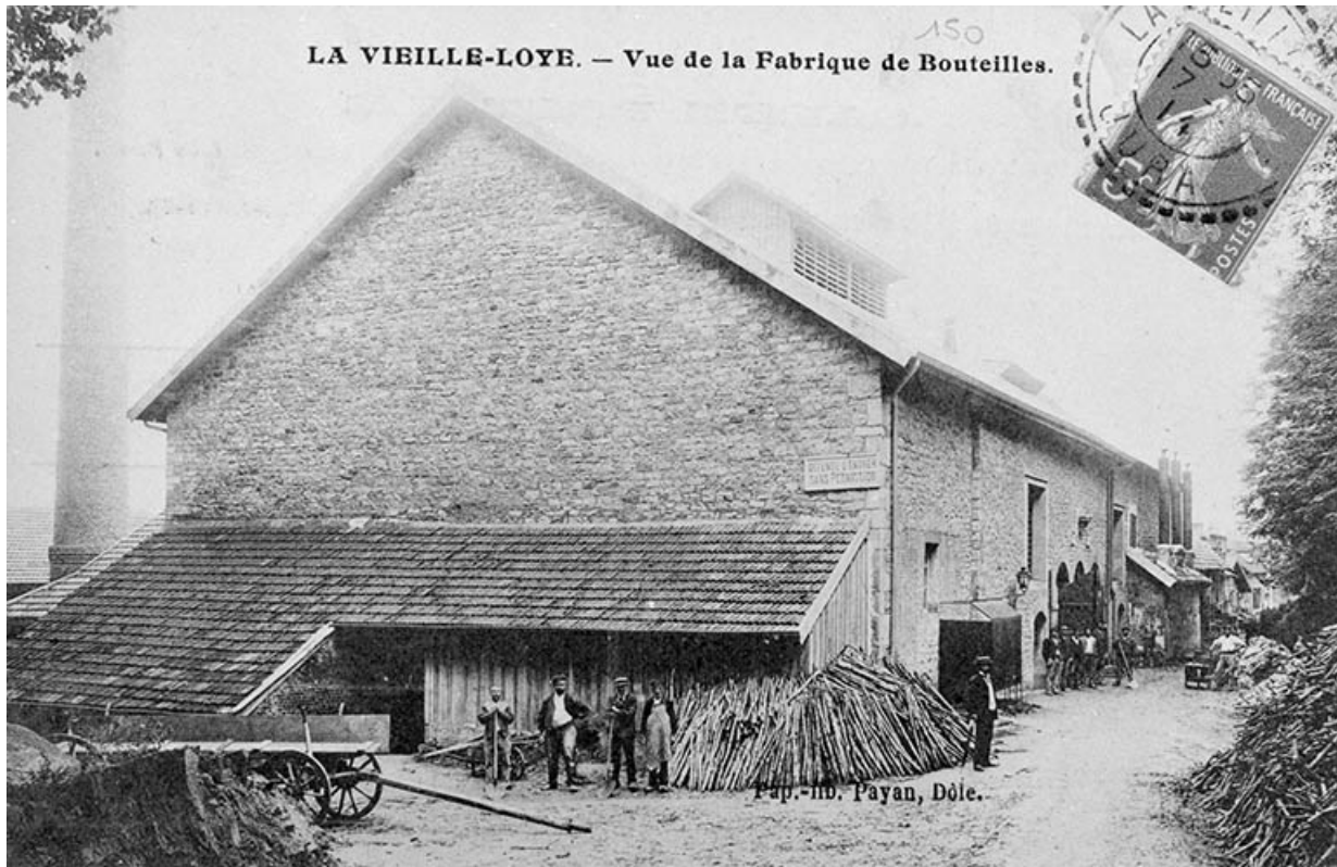
La Vieille-Loye. - Vue de la Fabrique de Bouteilles.

39, La Vieille-Loye, lieudit : la Verrerie