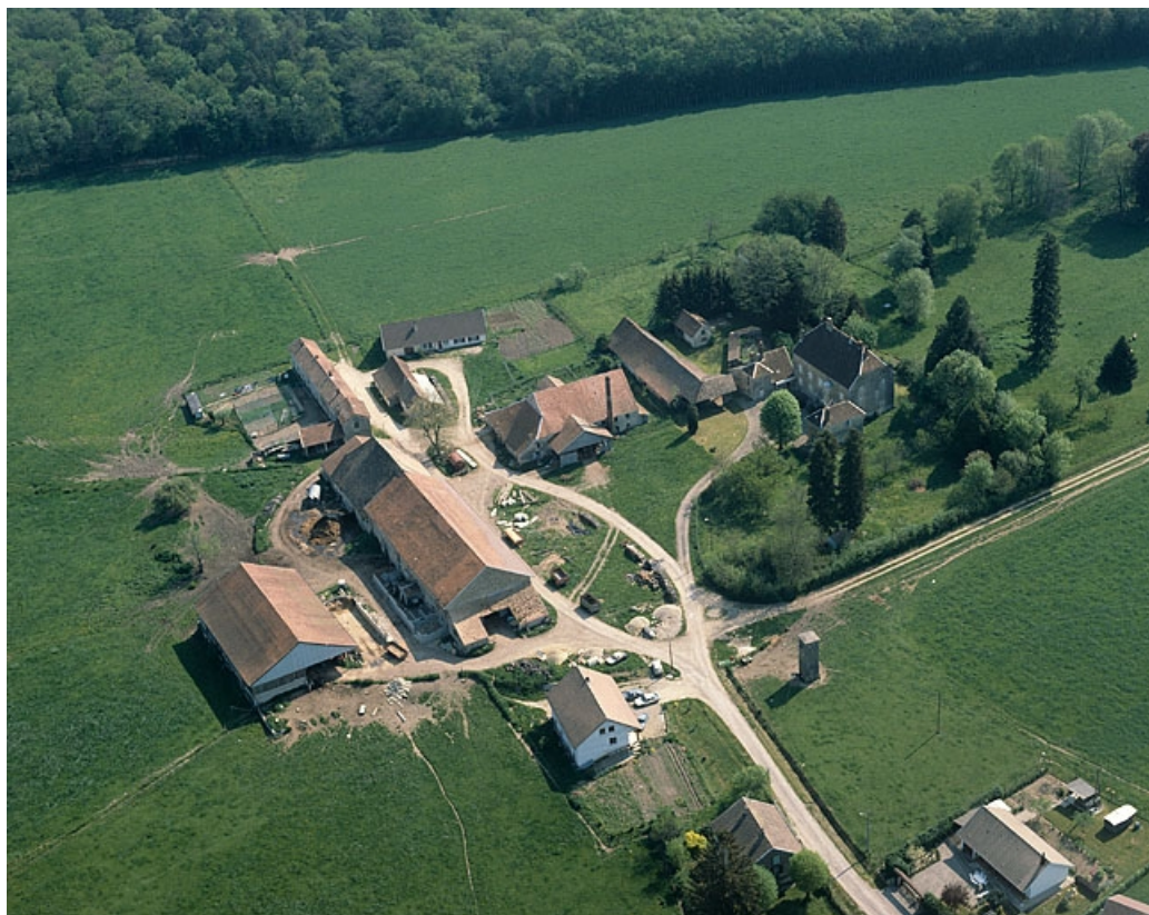
Vue aérienne depuis l'ouest.

39, La Vieille-Loye, lieudit : la Verrerie