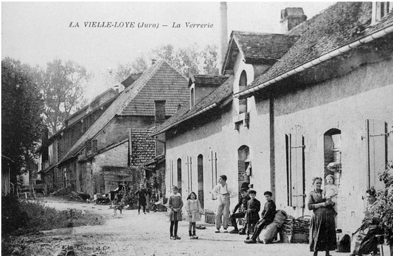
La Vieille-Loye (Jura) - La Verrerie, logement d'ouvriers (D). 39, La Vieille-Loye, lieudit : la Verrerie