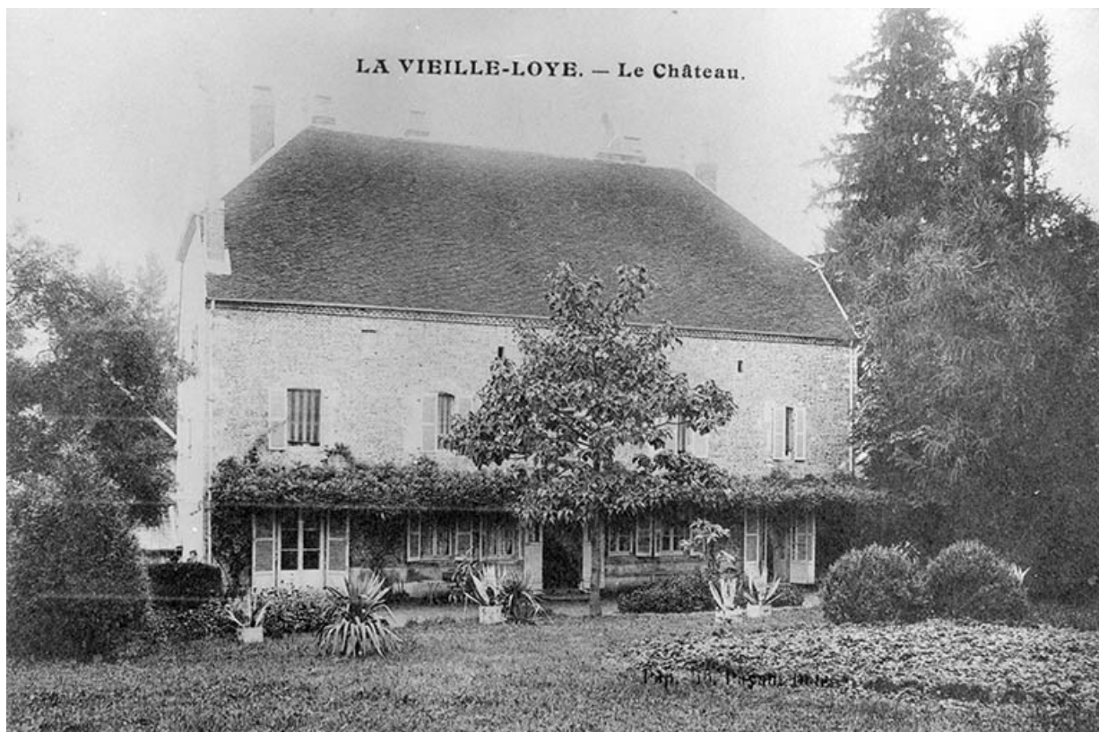
La Vieille-Loye. - Le Château.

39, La Vieille-Loye, lieudit : la Verrerie