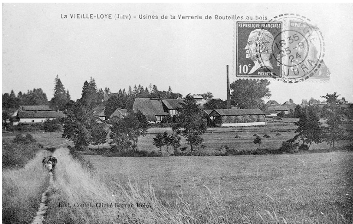
La Vieille-Loye (Jura) - Usine de la Verrerie de Bouteilles au bois. 39, La Vieille-Loye, lieudit : la Verrerie