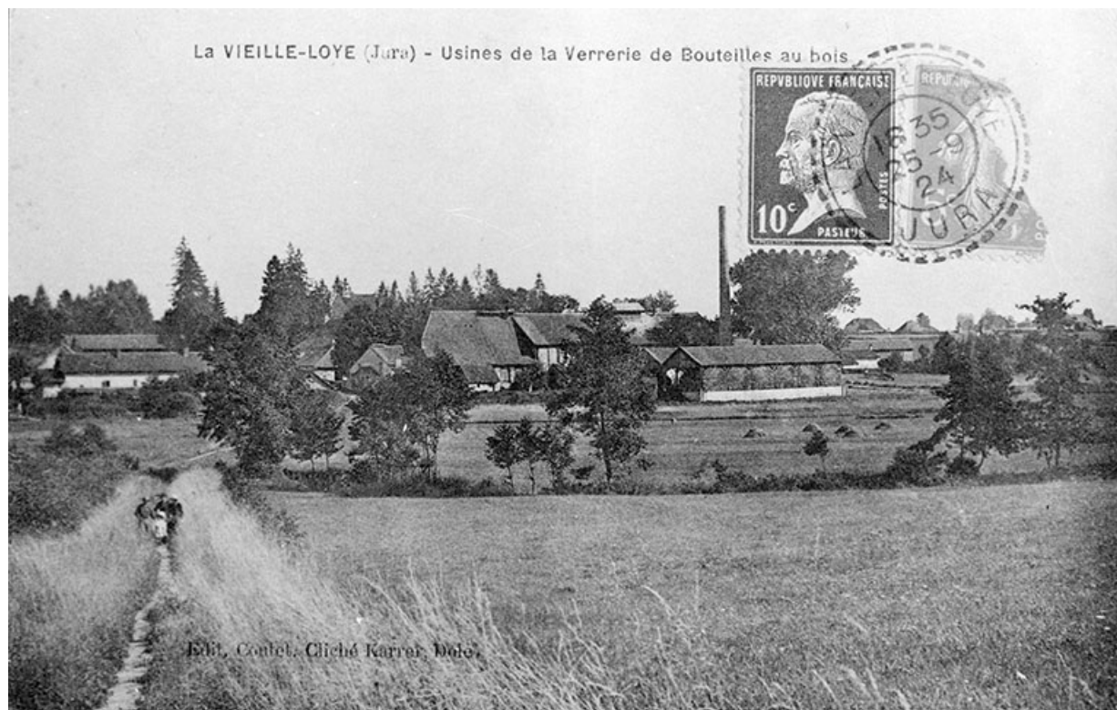
La Vieille-Loye (Jura) - Usine de la Verrerie de Bouteilles au bois. 39, La Vieille-Loye, lieudit : la Verrerie