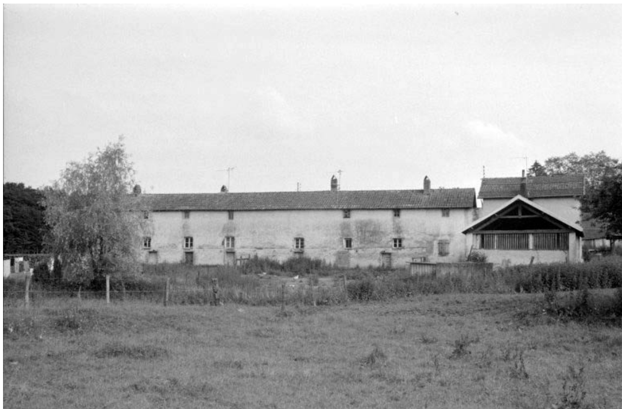
Façade postérieure des logements d'ouvriers (C) et (D).

39, La Vieille-Loye, lieudit : la Verrerie