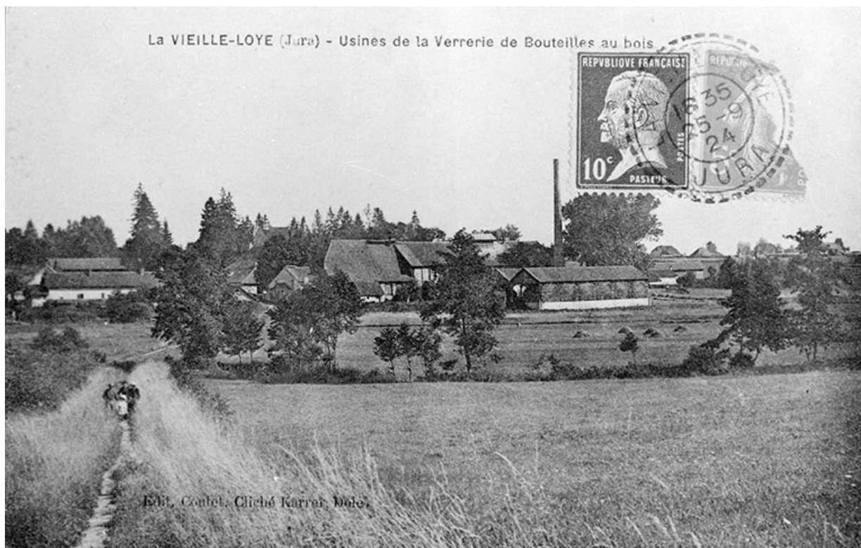
La Vieille-Loye (Jura) - Usine de la Verrerie de Bouteilles au bois. 39, La Vieille-Loye, lieudit : la Verrerie