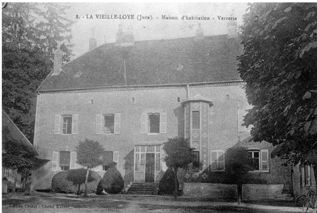
La Vieille-Loye (Jura). - Maison d'habitation - Verrerie.

39, La Vieille-Loye, lieudit : la Verrerie