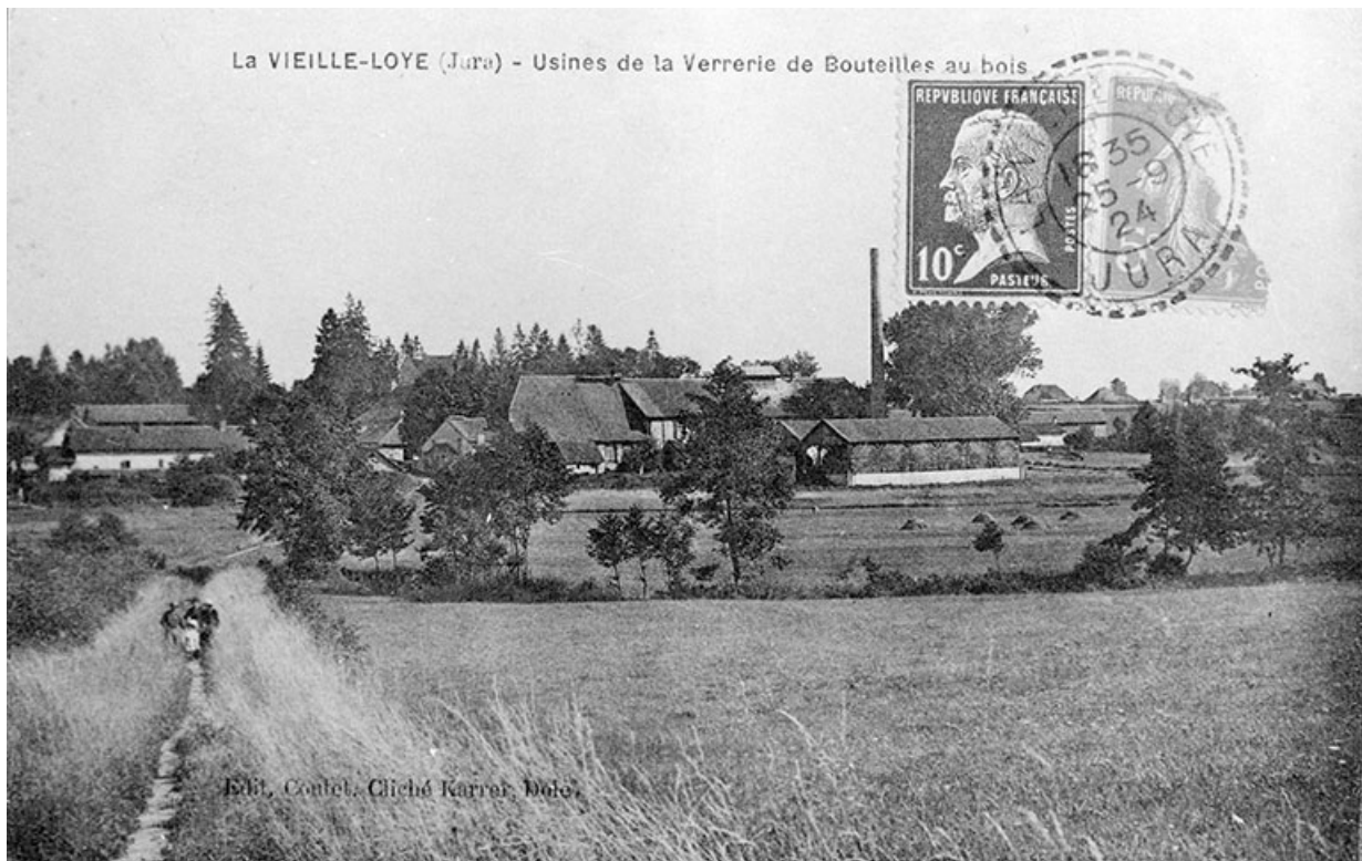
La Vieille-Loye (Jura) - Usine de la Verrerie de Bouteilles au bois. 39, La Vieille-Loye, lieudit : la Verrerie