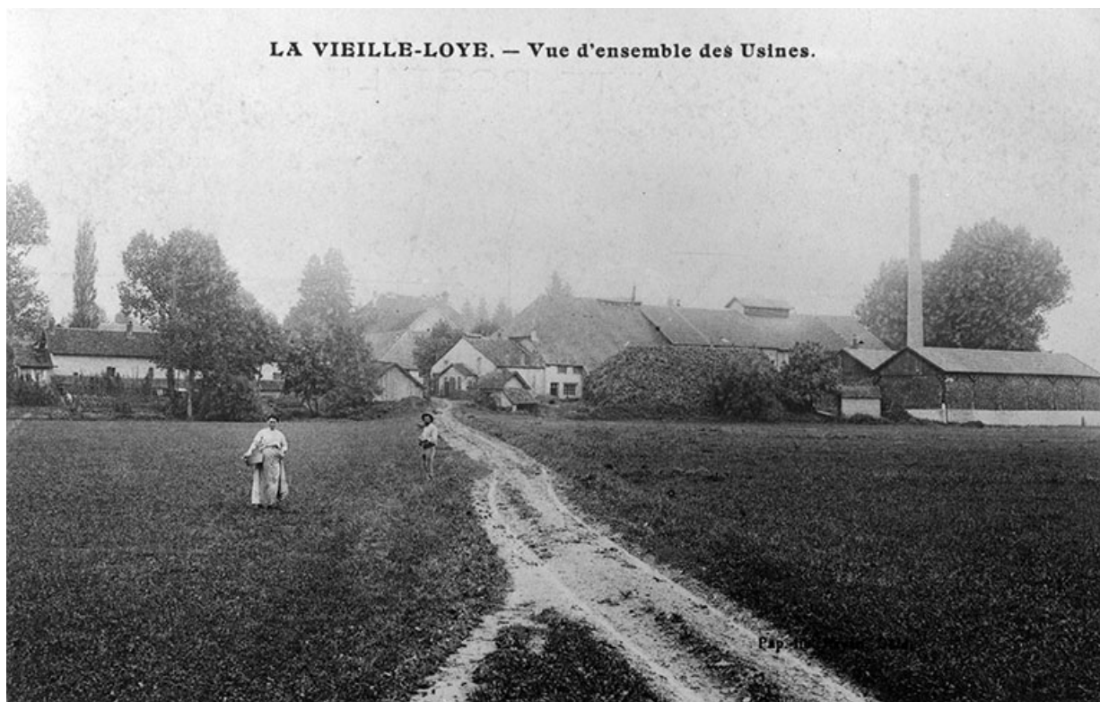
La Vieille-Loye. - Vue d'ensemble des Usines.

39, La Vieille-Loye, lieudit : la Verrerie