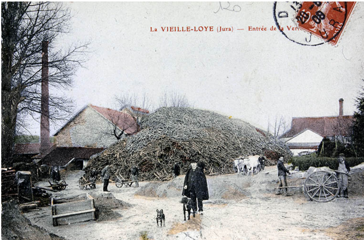
La Vieille-Loye (Jura) - Entrée de la Verrerie.