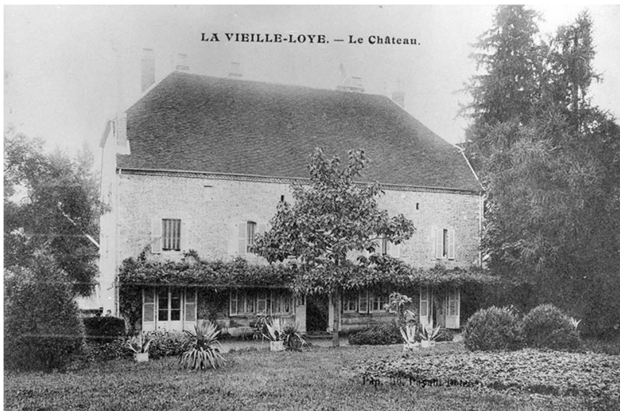
La Vieille-Loye. - Le Château.

39, La Vieille-Loye, lieudit : la Verrerie