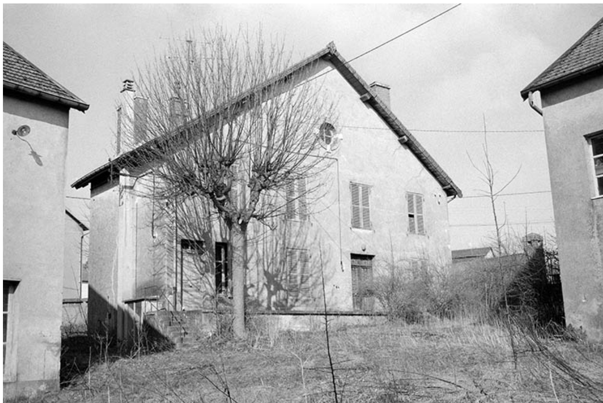
Façade antérieure du bureau vue de l'est.