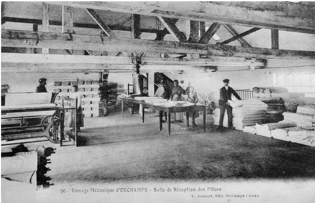
Tissage Mécanique d'Orchamps. Salle de Réception des Pièces.