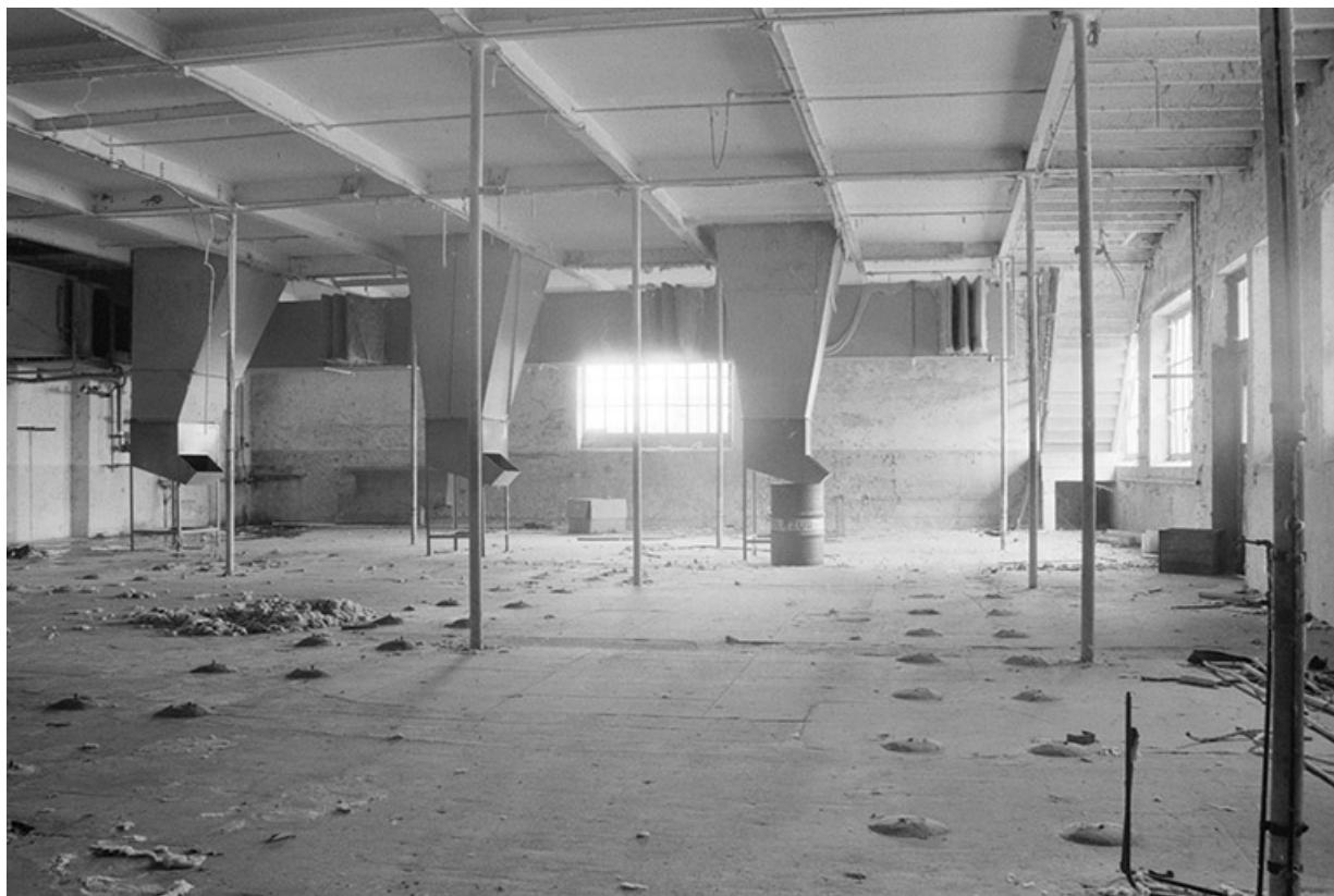
Atelier de bobinage (7). L'alimentation des bobinoirs en cannettes de filature s'effectuait depuis l'étage de comble par les trois conduits.