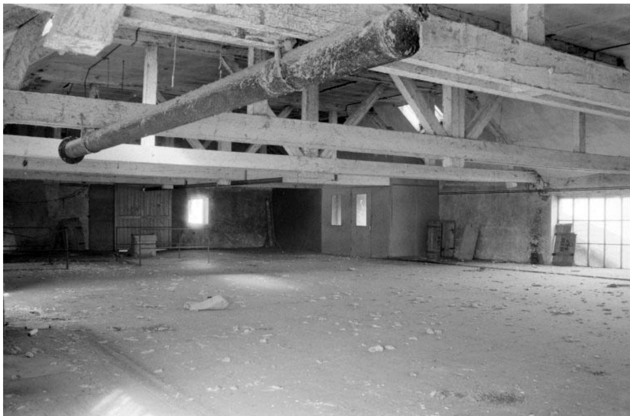
Ancienne salle de réception des pièces, surmontant le bobinage.