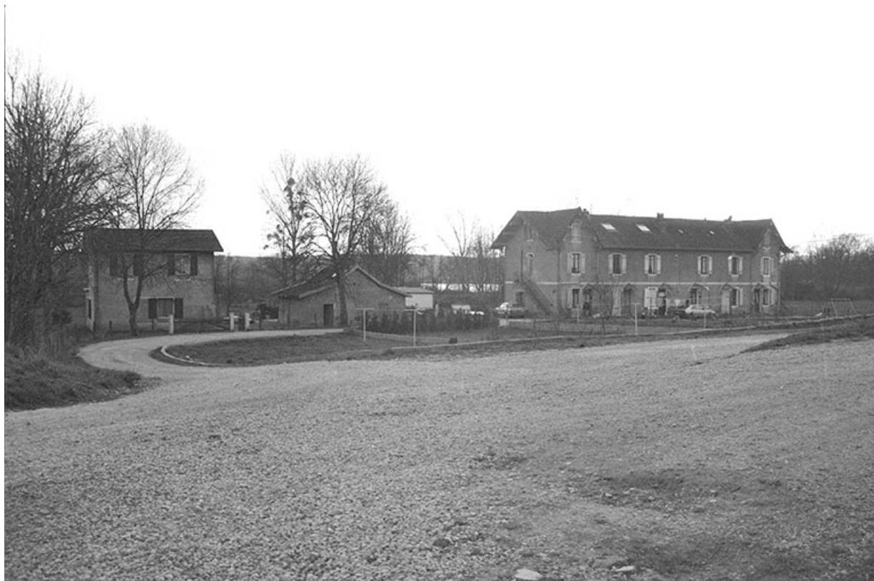
Vue d'ensemble des logements d'ouvriers, depuis le nord.