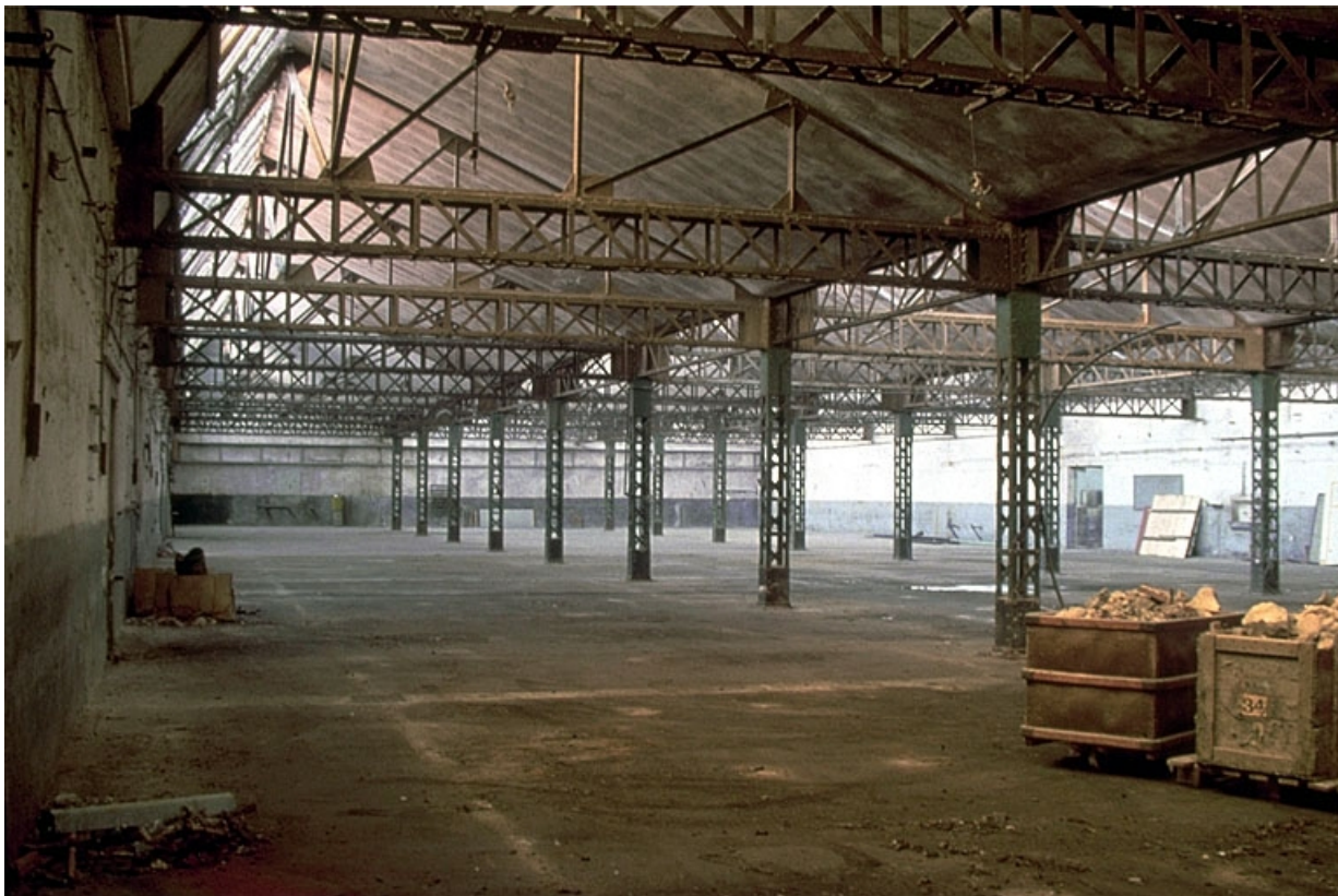
Atelier de fabrication (1), vu depuis l'angle nord-ouest.