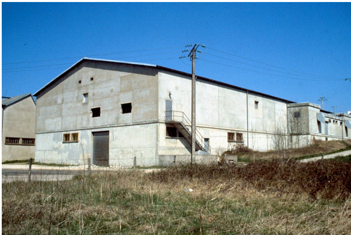
Façades postérieure et latérale gauche de la filature.