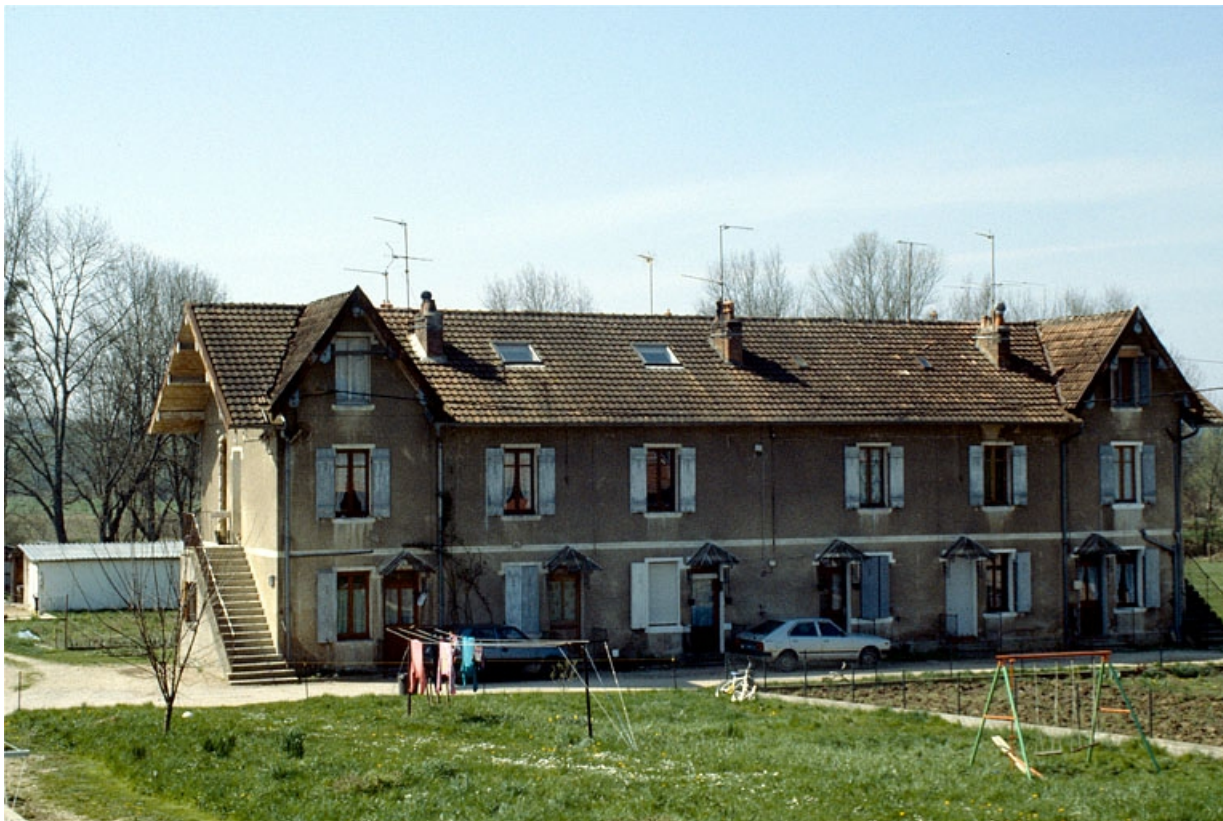
Façades antérieure et latérale gauche du logement d'ouvriers (22).