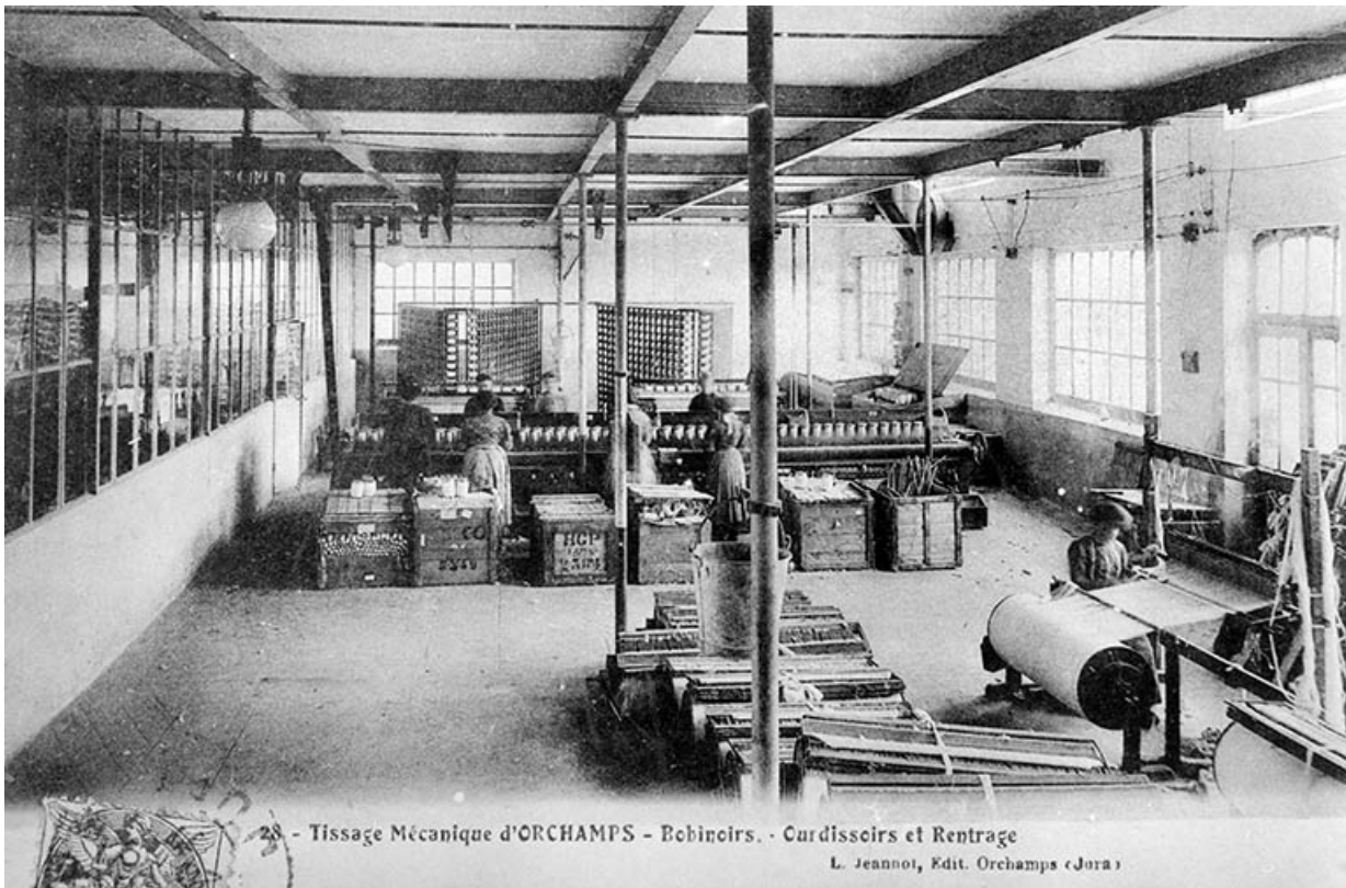
28 - Tissage Mécanique d'ORCHAMPS - Bobinoirs. - Ourdissoirs et Rentrage