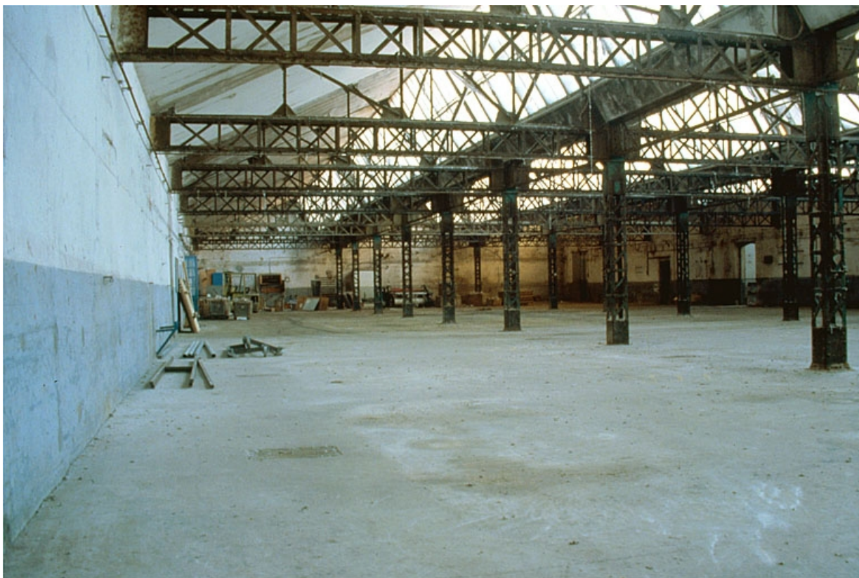
Atelier de fabrication (1), depuis l'angle sud-est.