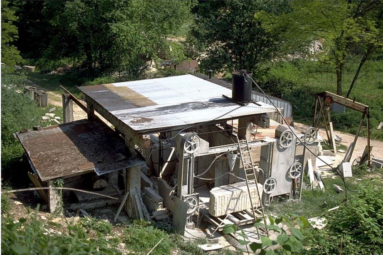
Au premier plan, la scie Perrot Aubertin.