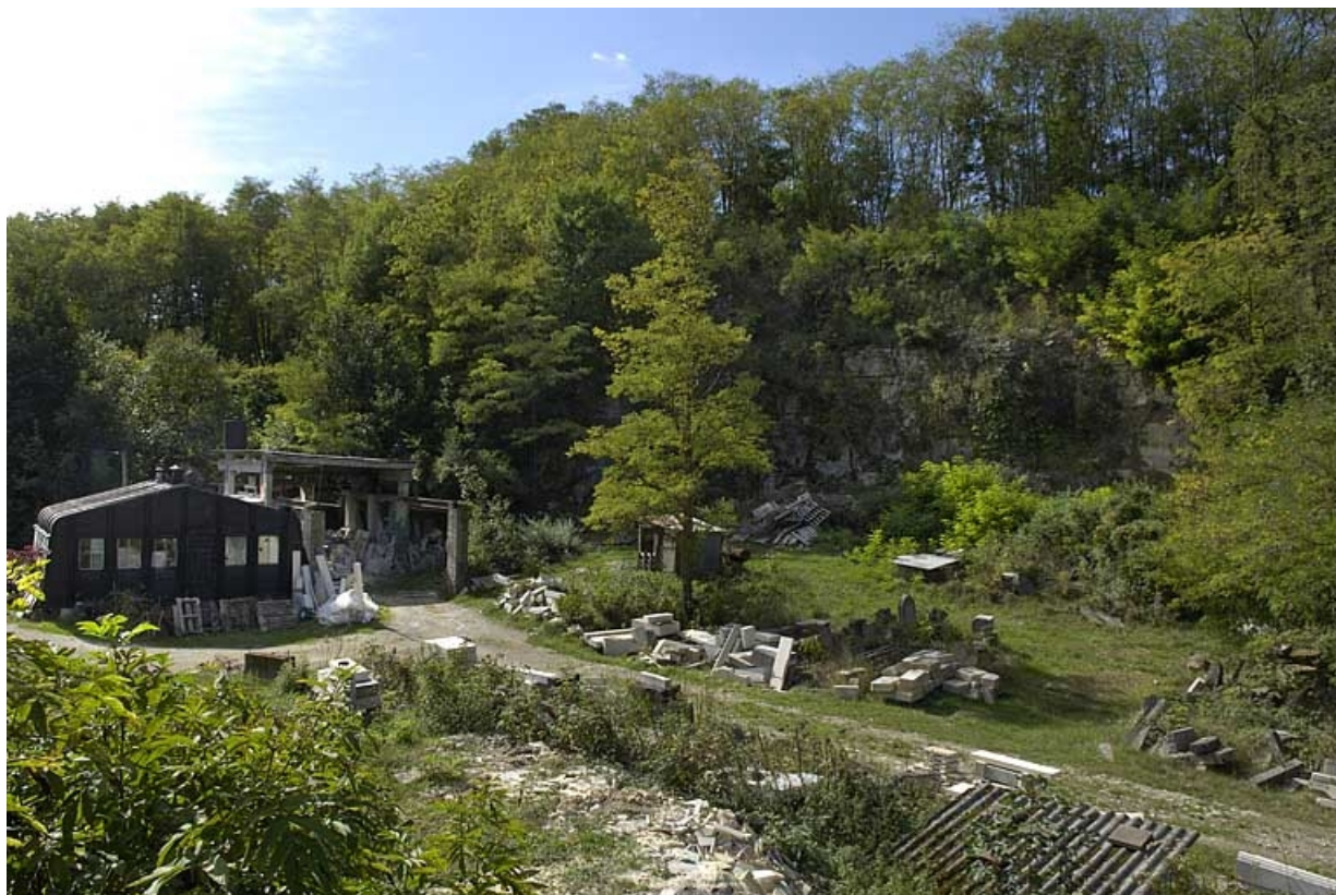
Vue d'ensemble de la carrière et de l'atelier du tailleur de pierre, depuis le nord-est.

39, Dole, 7 rue Xavier Joly, lieudit : les Perrières