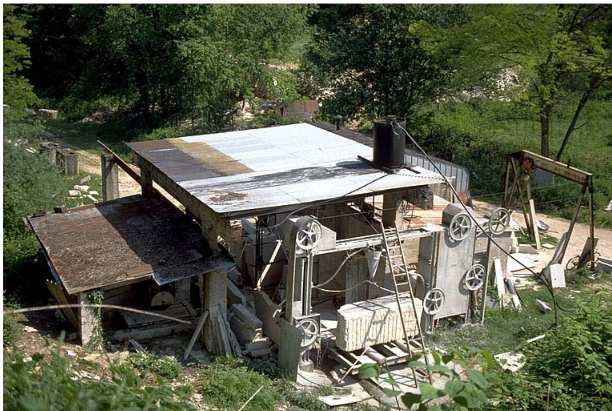
Au premier plan, la scie Perrot Aubertin.