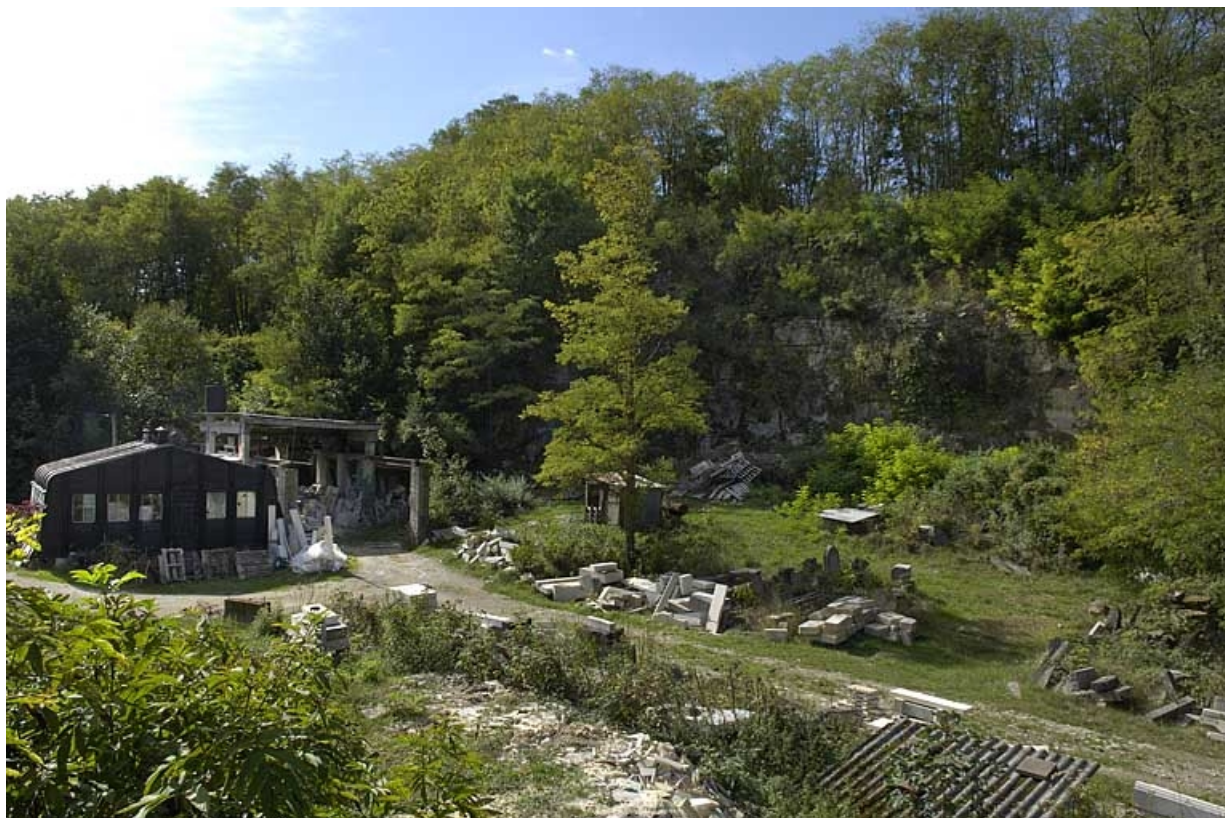
Vue d'ensemble de la carrière et de l'atelier du tailleur de pierre, depuis le nord-est.

39, Dole, 7 rue Xavier Joly, lieudit : les Perrières