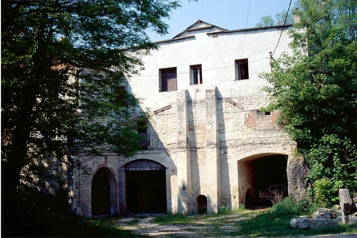
Base du four à chaux, depuis l'est.

39, Dole, 7 rue Xavier Joly, lieudit : les Perrières