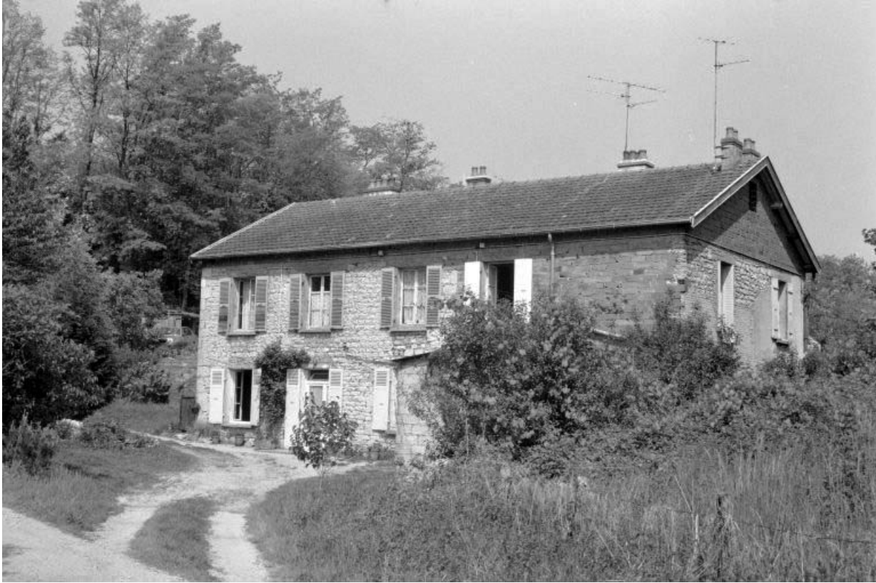
Maison (B) vue de trois quarts droit.

39, Dole, 7 rue Xavier Joly, lieudit : les Perrières