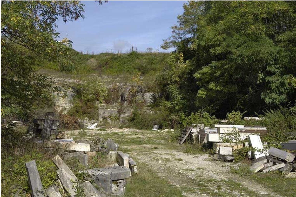
Vue d'ensemble du front de taille nord.

39, Dole, 7 rue Xavier Joly, lieudit : les Perrières