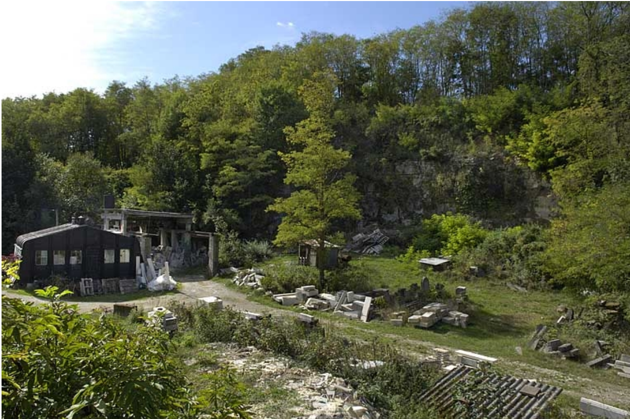
Vue d'ensemble de la carrière et de l'atelier du tailleur de pierre, depuis le nord-est.

39, Dole, 7 rue Xavier Joly, lieudit : les Perrières