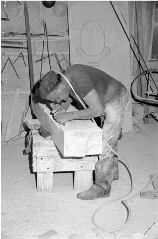
Taille de la pierre au burin pneumatique (J. Faccenda).

39, Dole, 7 rue Xavier Joly, lieudit : les Perrières