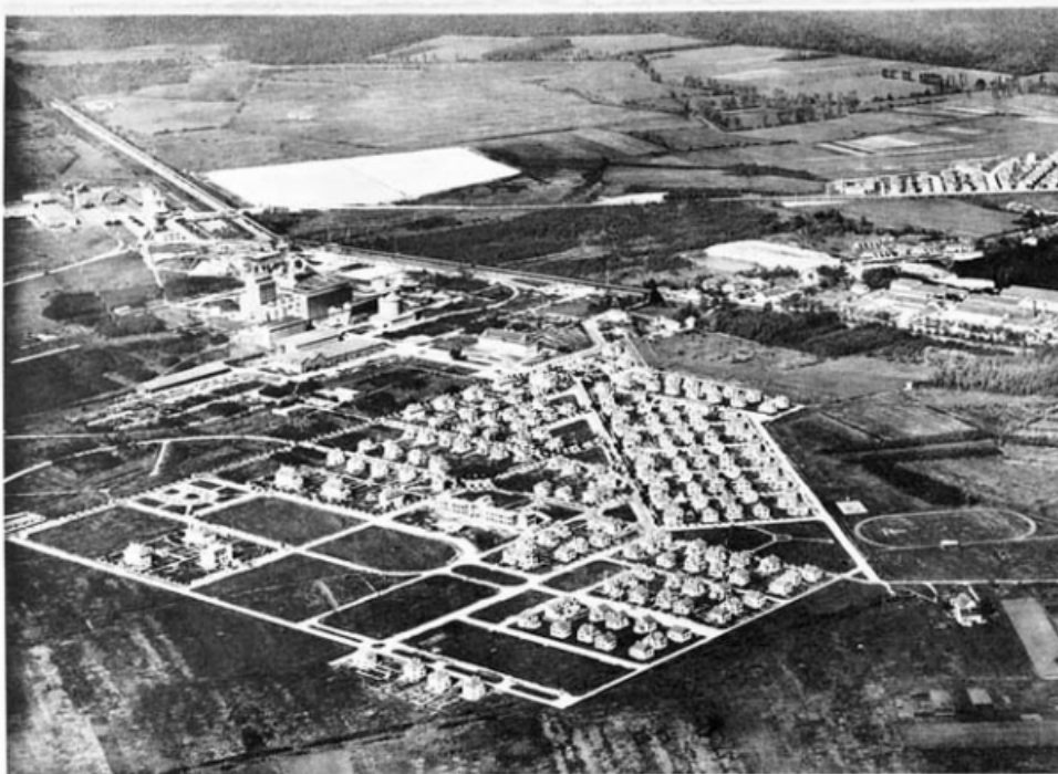
VUE D'ENSEMBLE DE L'USINE

Vue aérienne de l'usine et des cités ouvrières depuis le sud-est.