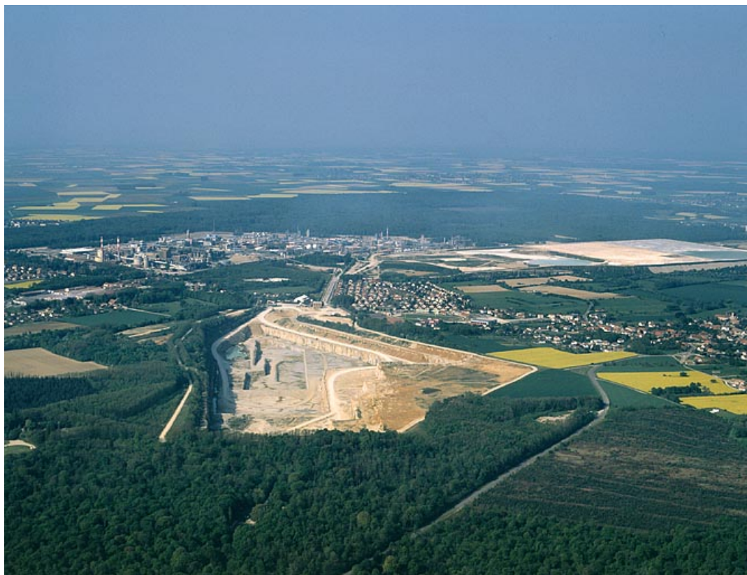
Vue d'ensemble depuis le nord-est, photographie aérienne. 39, Tavaux