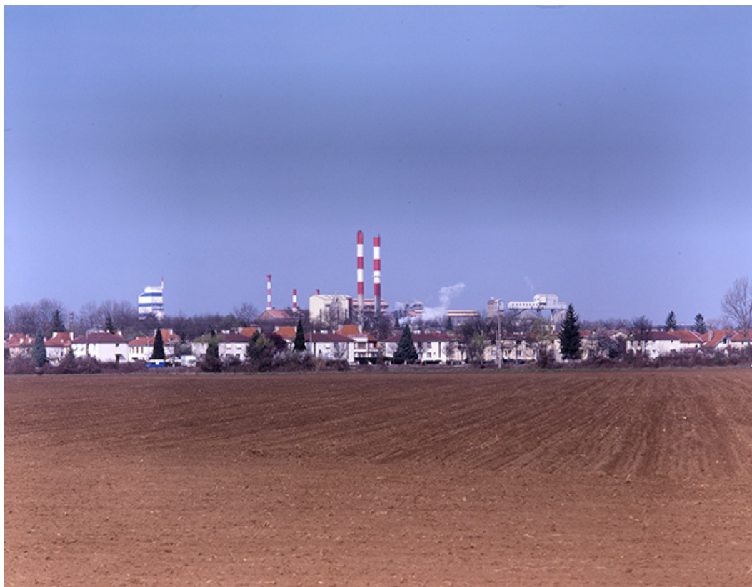
L'usine et la cité ouvrière de Tavaux vues du sud-est.