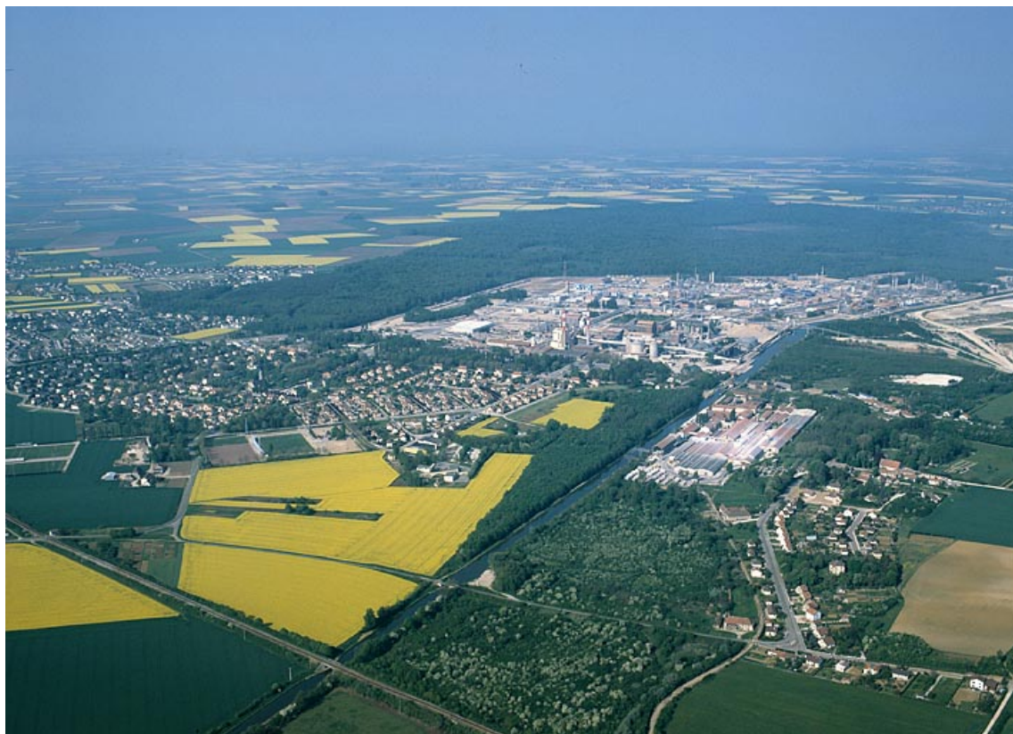
L'usine et la cité ouvrière de Tavaux vues du nord-est, photographie aérienne. 39, Tavaux