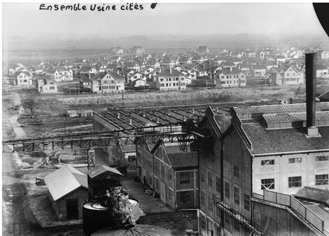
Vue d'ensemble : générateurs de vapeur et d'électricité et ateliers de réparation de l'usine en avant de la cité ouvrière de Tavaux. 39, Tavaux