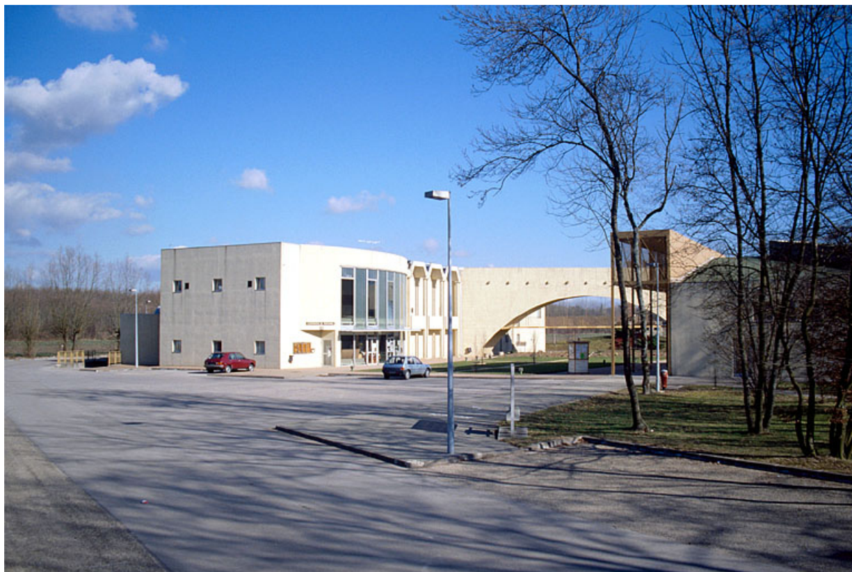
Local du comité d'entreprise : groupement d'achats et cour intérieure, vus du sud-ouest. 39, Tavaux