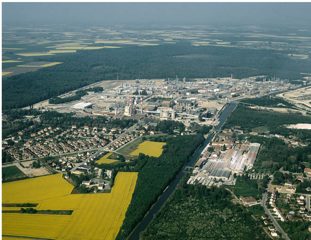
L'usine et la partie nord de la cité ouvrière de Tavaux, photographie aérienne. 39, Tavaux