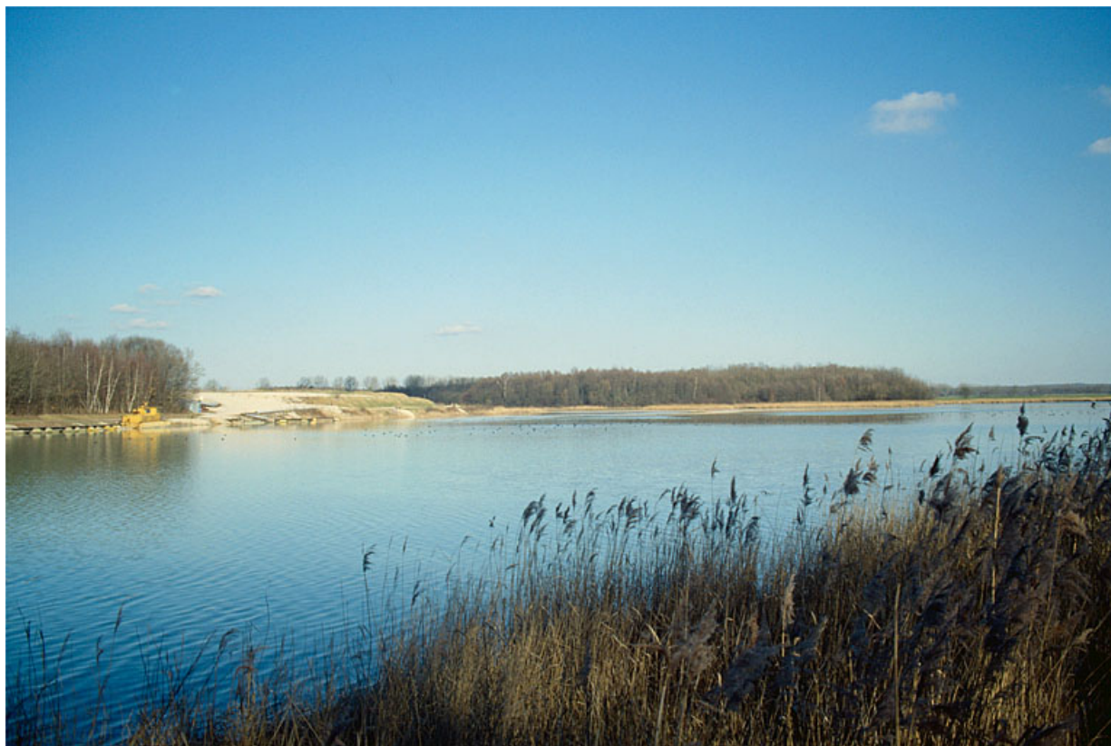
Etang de l'Aillon vu du sud-ouest.