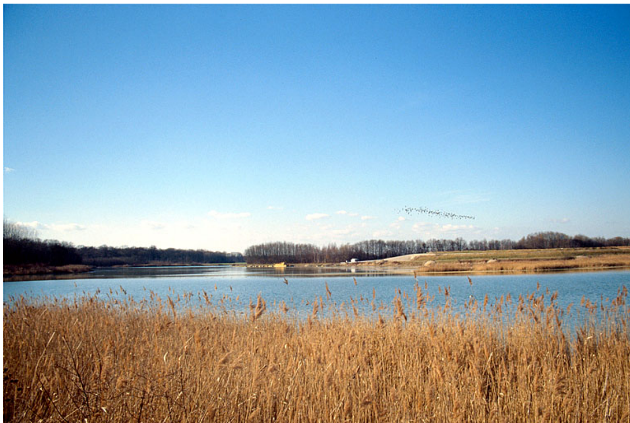
Etang de l'Aillon vu de l'est.