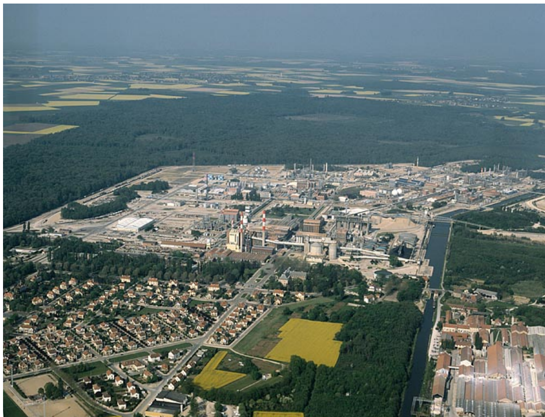
L'usine et la partie nord de la cité ouvrière de Tavaux (vue rapprochée), photographie aérienne. 39, Tavaux