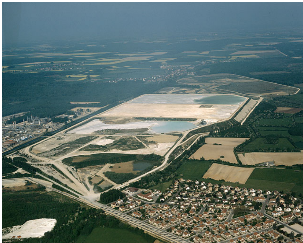
Les bassins de décantation et la cité ouvrière de Damparis vus de l'est, photographie aérienne. 39, Tavaux