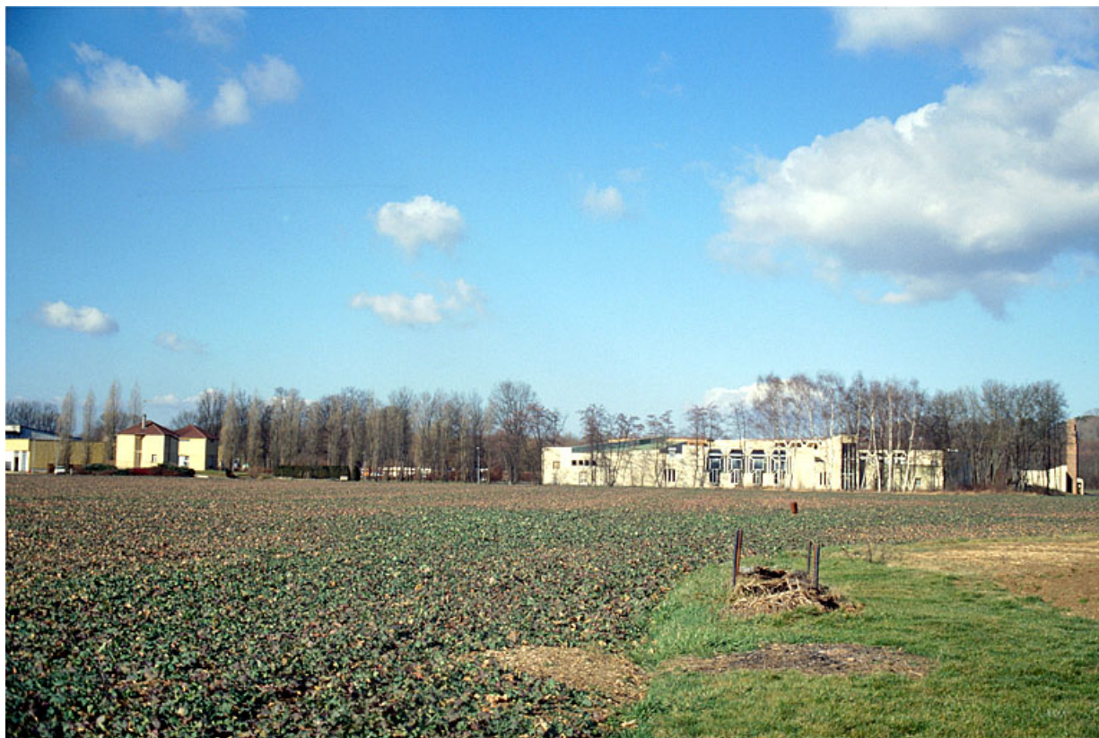
Local du comité d'entreprise : vue d'ensemble depuis l'est.