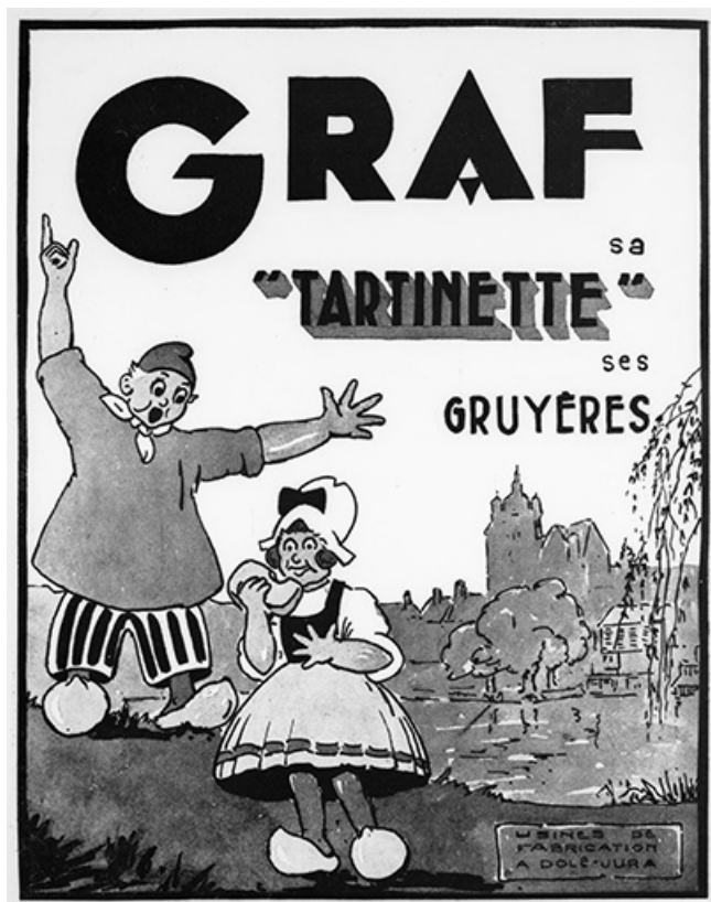
Graf. Sa "Tartinette". Ses gruyères [publicité]. 39, Dole, 15 rue Jules Machard