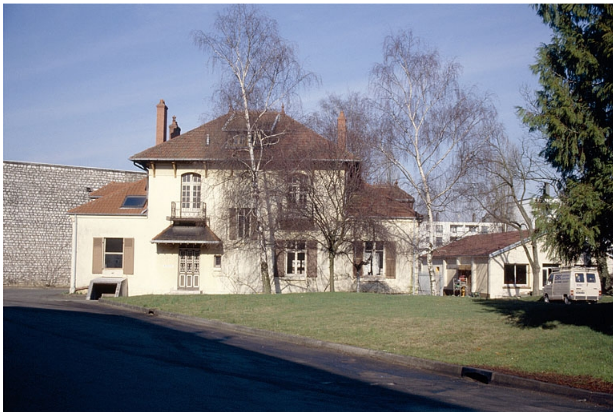
Ancien logement patronal (C), depuis la cour.