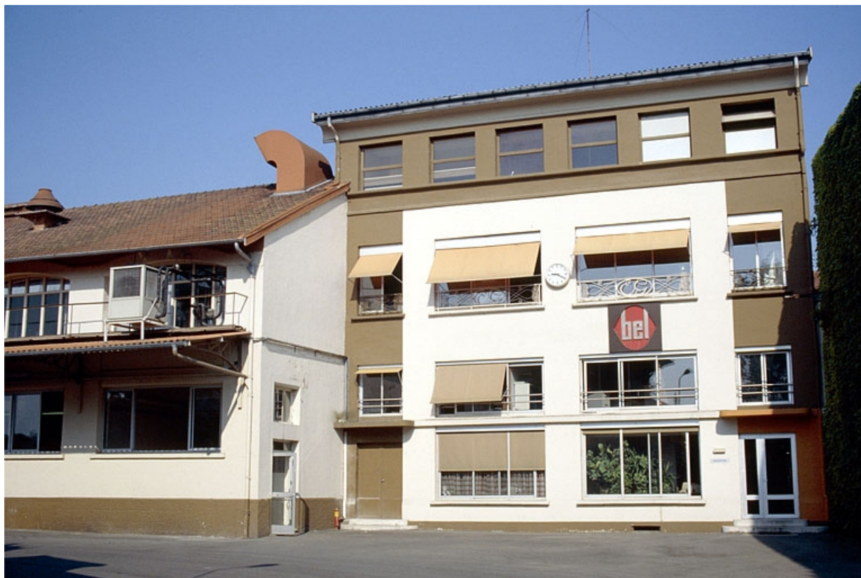
Façade antérieure des bureaux.