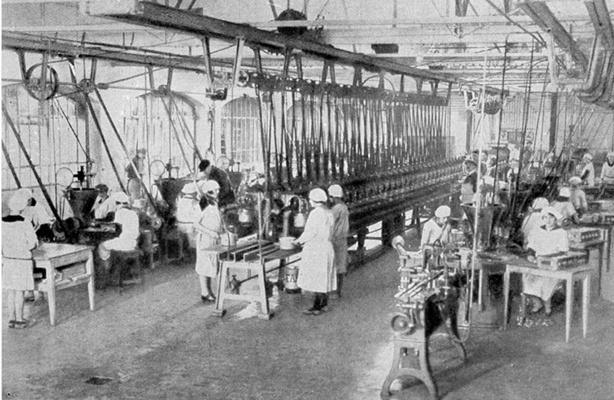
Intérieur d'un atelier de fabrication.