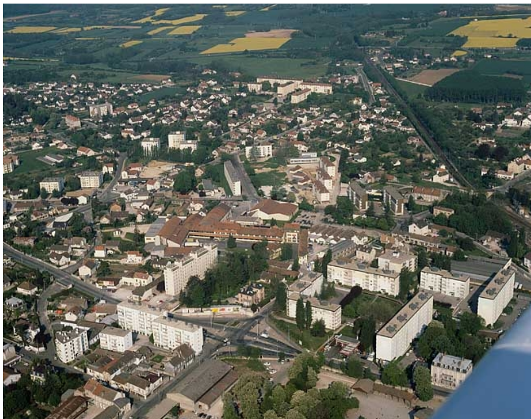
Vue aérienne depuis l'est.