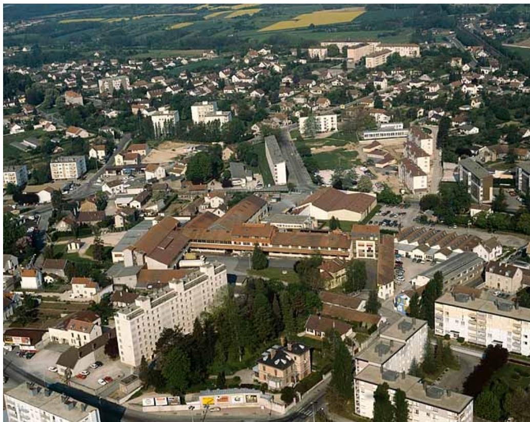
Vue aérienne depuis l'est (vue rapprochée).