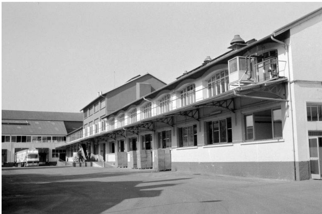
Atelier de fabrication (E, F, G), depuis l'est.