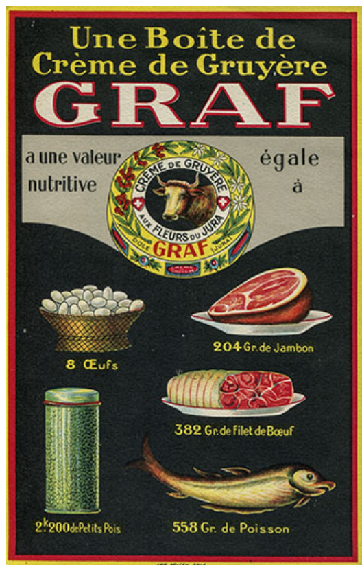
Plaque publicitaire, s.d. [vers 1925].