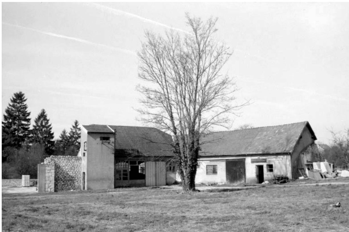
Fabrique d'aliment pour bétail : écuries et transformateur.