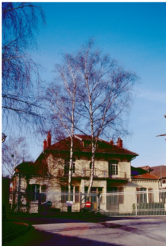
Ancien logement patronal (C), depuis la rue Mont Roland. 39, Dole, 15 rue Jules Machard