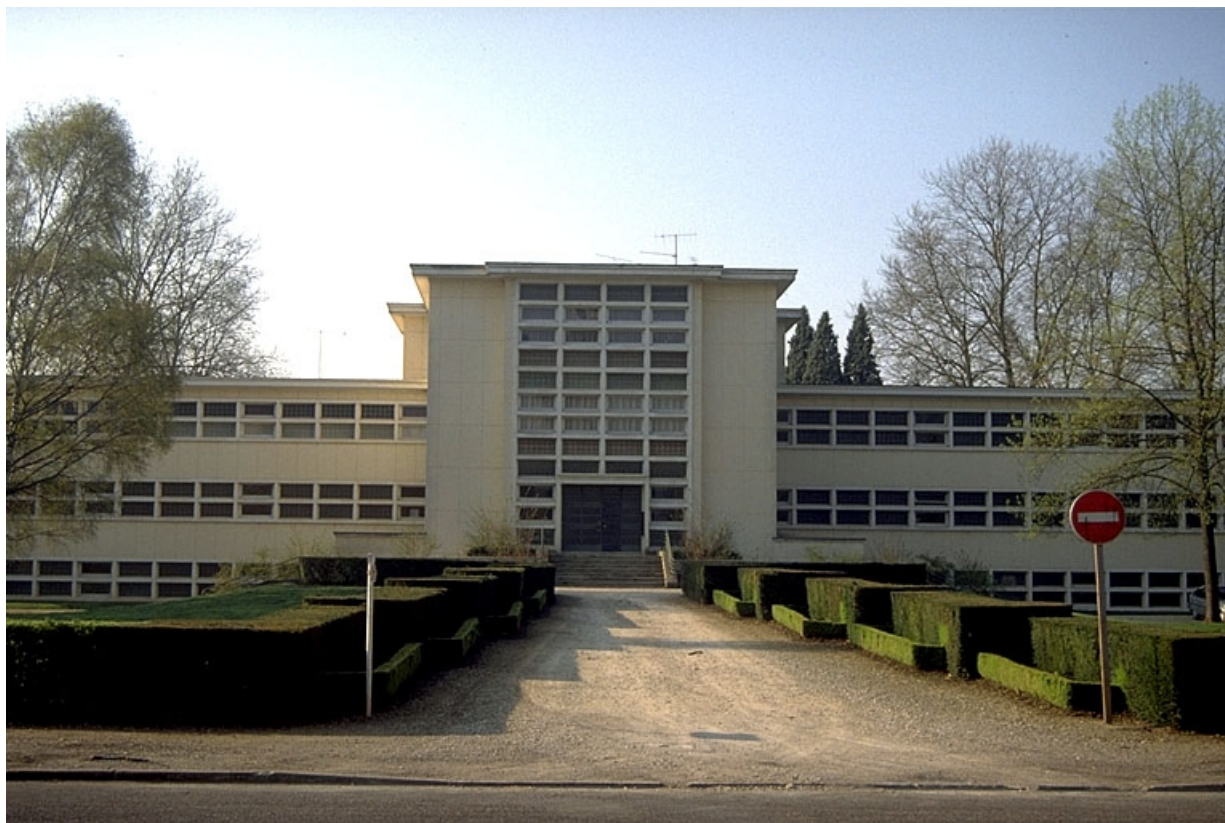
Façade antérieure, vue de face.