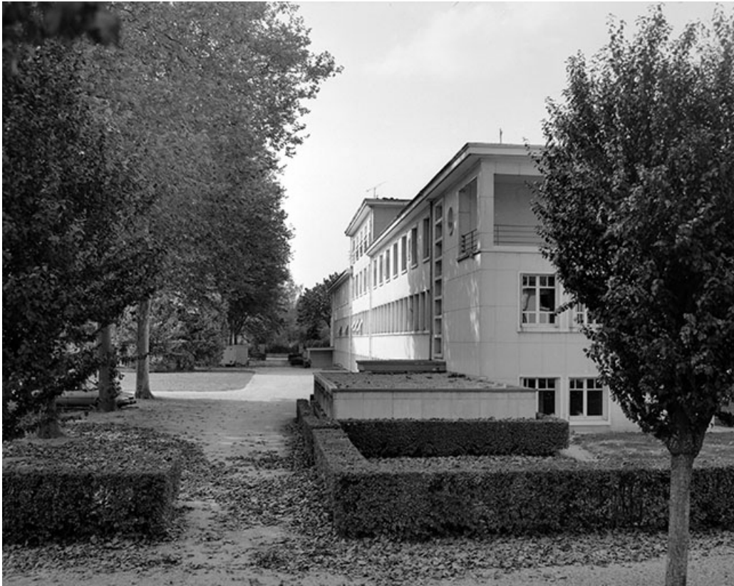
Façade postérieure, vue de trois quarts droit.