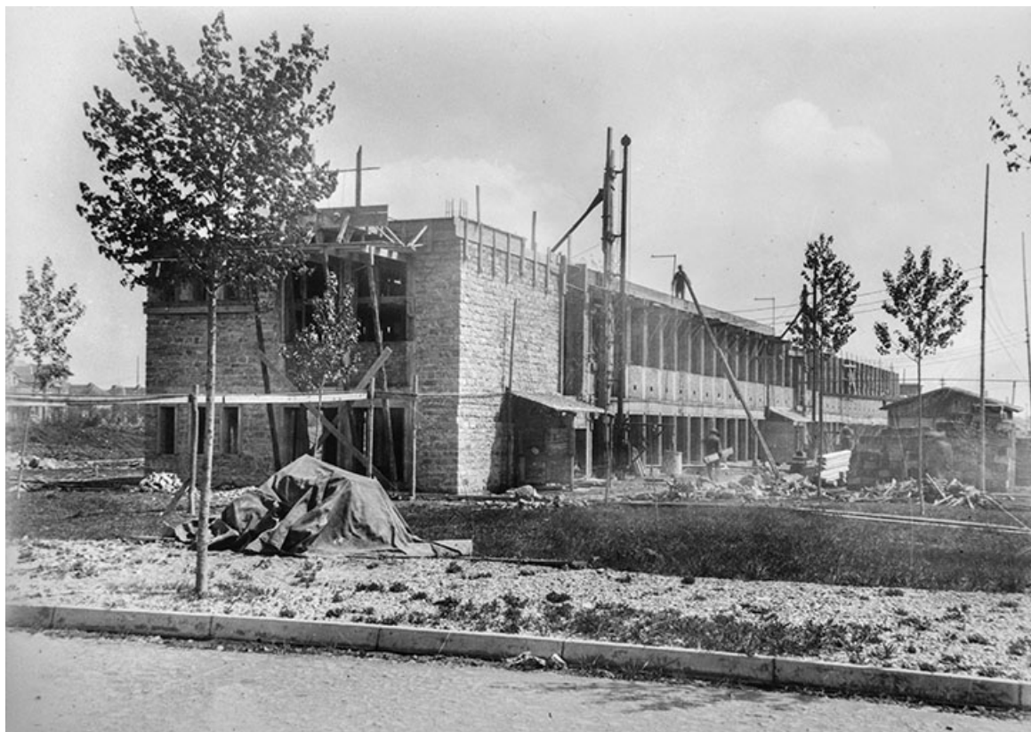
Travaux de construction de l'hôpital, façade postérieure et face gauche.