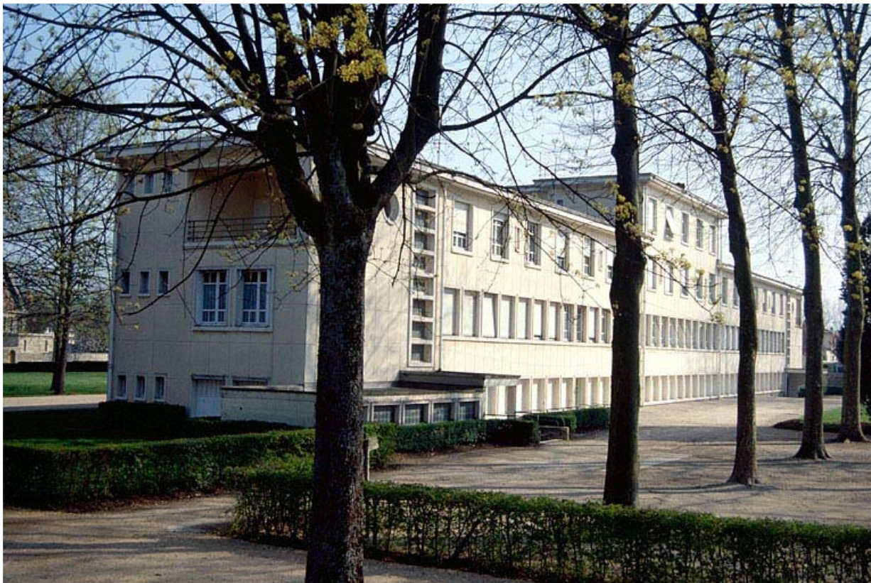
Façade postérieure et face droite.