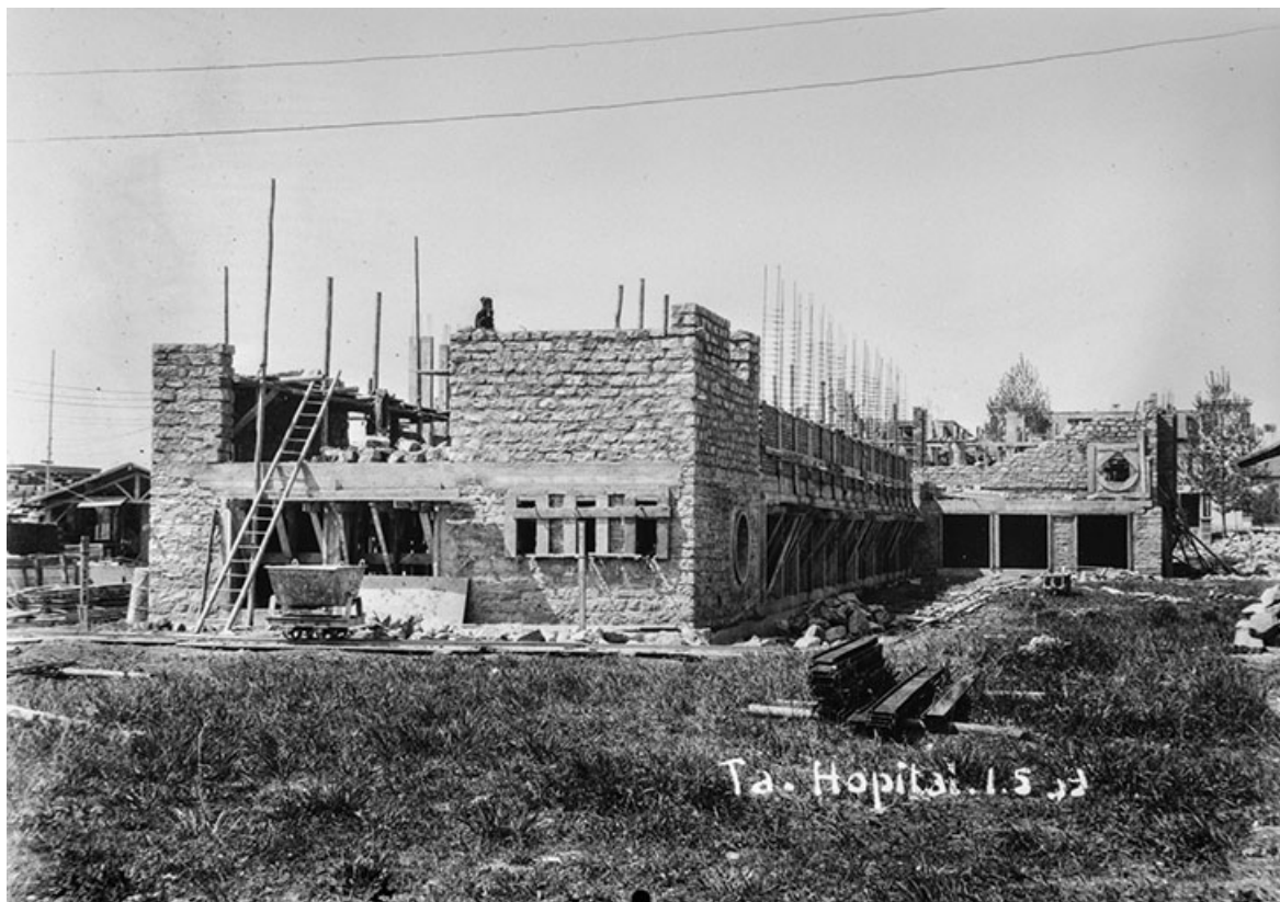
Travaux de construction de l'hôpital, façade antérieure et face gauche.