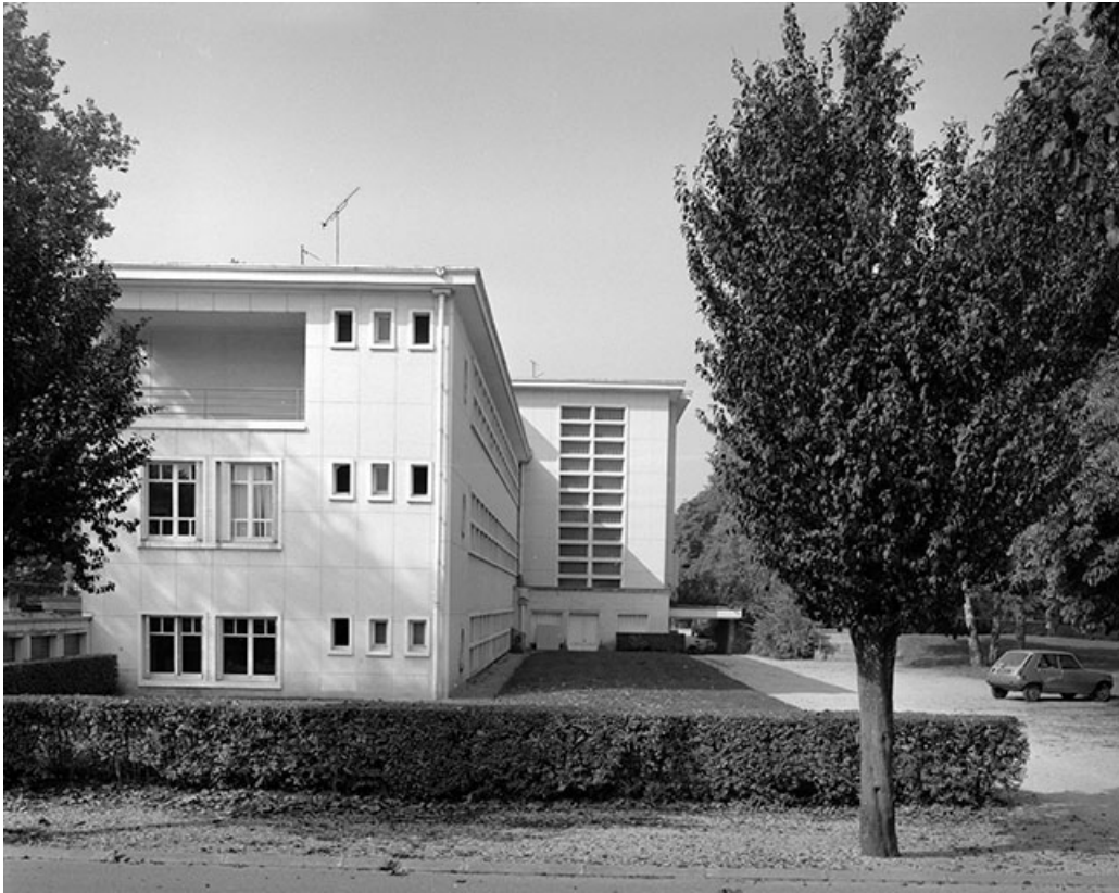
Façade postérieure, vue de trois quarts gauche.