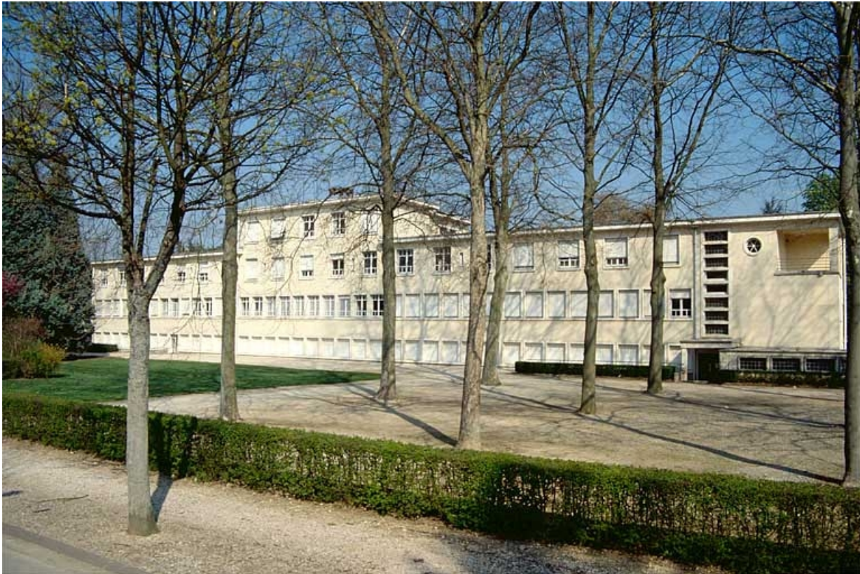
Façade postérieure, vue de trois-quarts depuis la droite.