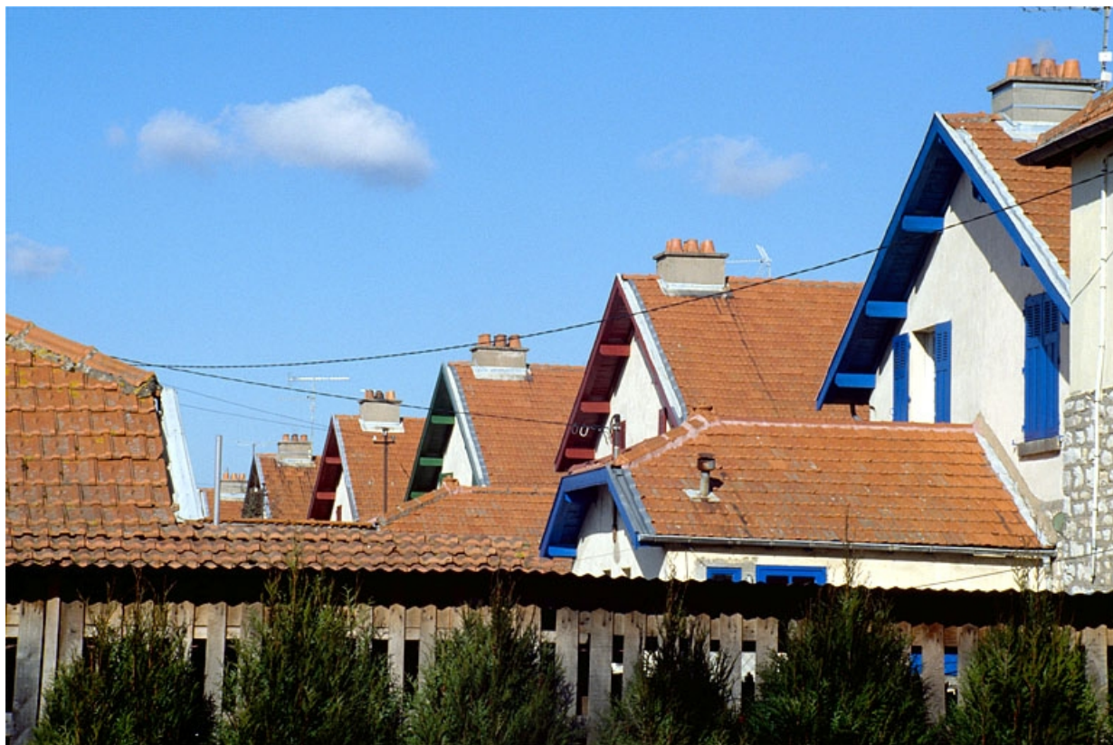
Façades postérieures des maisons de type 10A, rue de Belvoye, prises depuis la place Jeanne d'Arc.

39, Damparis, lieudit : Cité des Carrières