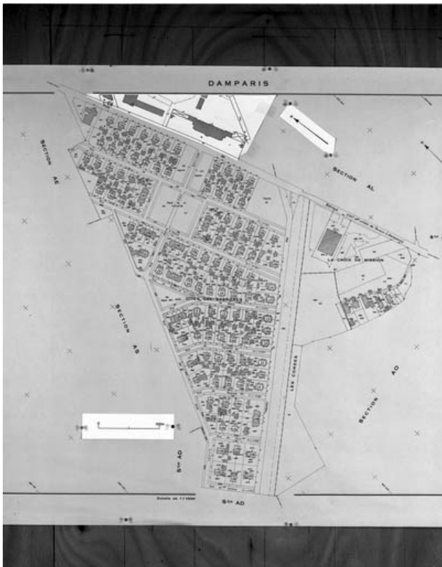
Plan de répartition des types de maisons. Montage de plans cadastraux, 1980, section AN et partie de la section AM. 39, Damparis, lieudit : Cité des Carrières