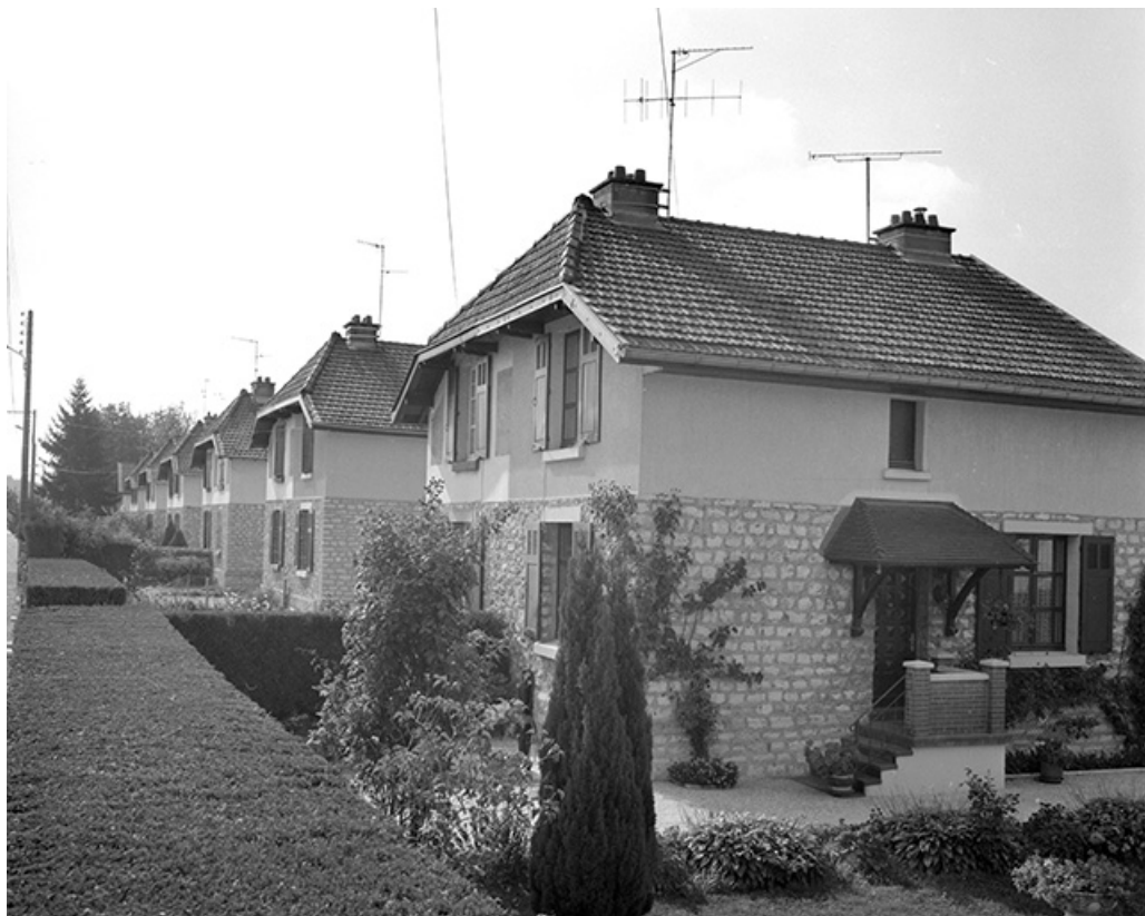
Maisons de type 10A, rue de Belvoie. 39, Damparis, lieudit : Cité des Carrières