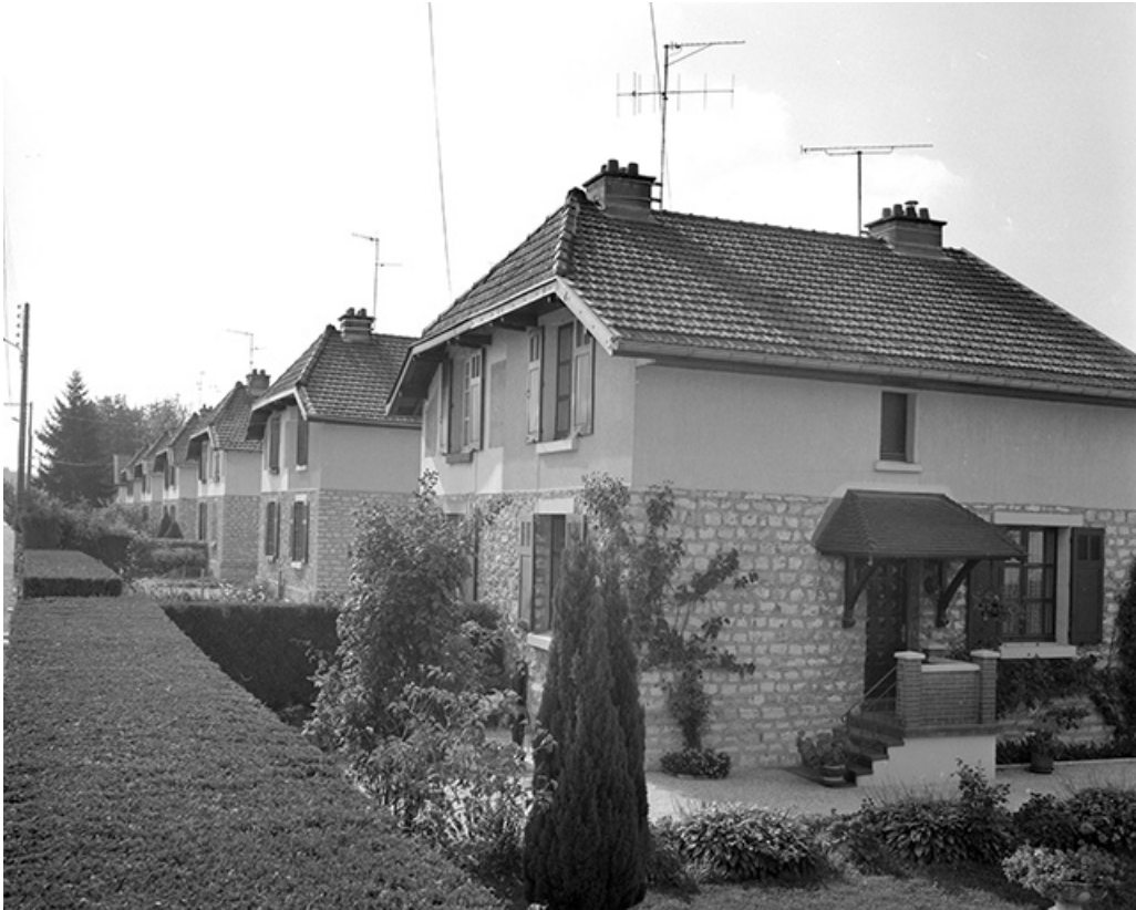
Maisons de type 10A, rue de Belvoie. 39, Damparis, lieudit : Cité des Carrières