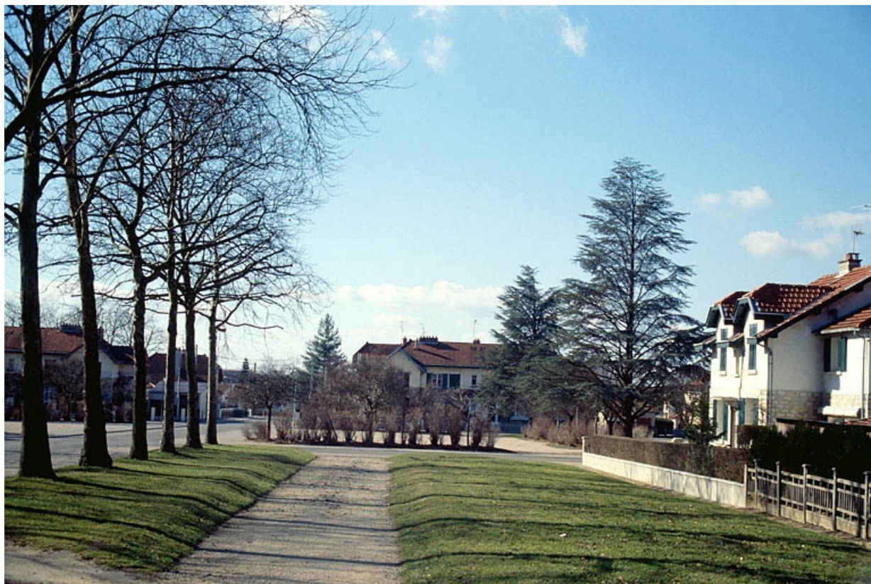
Vue du square Jeanne d'Arc.

39, Damparis, lieudit : Cité des Carrières