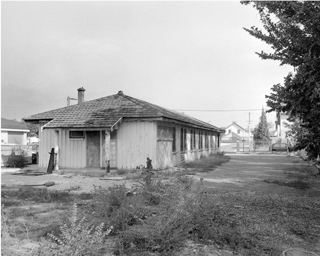
L'ancien dortoir, actuellement M.J.C., rue de Genève.

39, Damparis, lieudit : Cité des Carrières