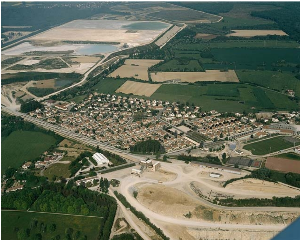
Vue aérienne depuis l'est.

39, Damparis, lieudit : Cité des Carrières