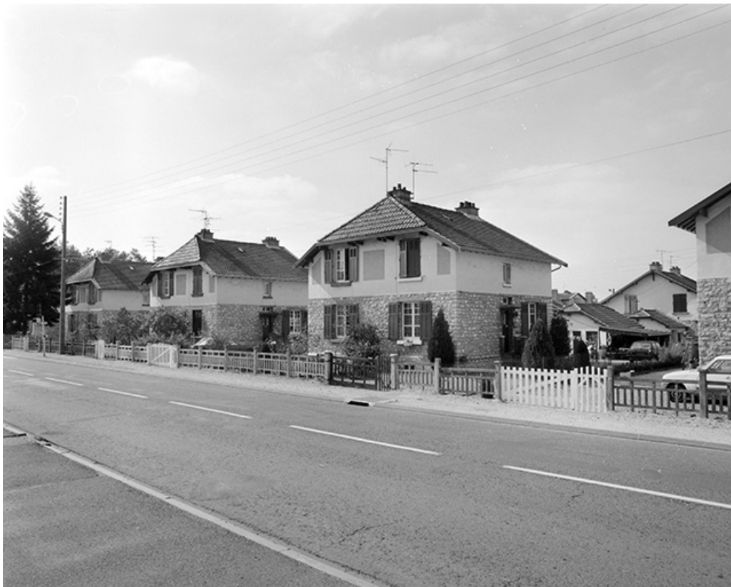
Rue de Belvoye, numéros 36 à 46.

39, Damparis, lieudit : Cité des Carrières