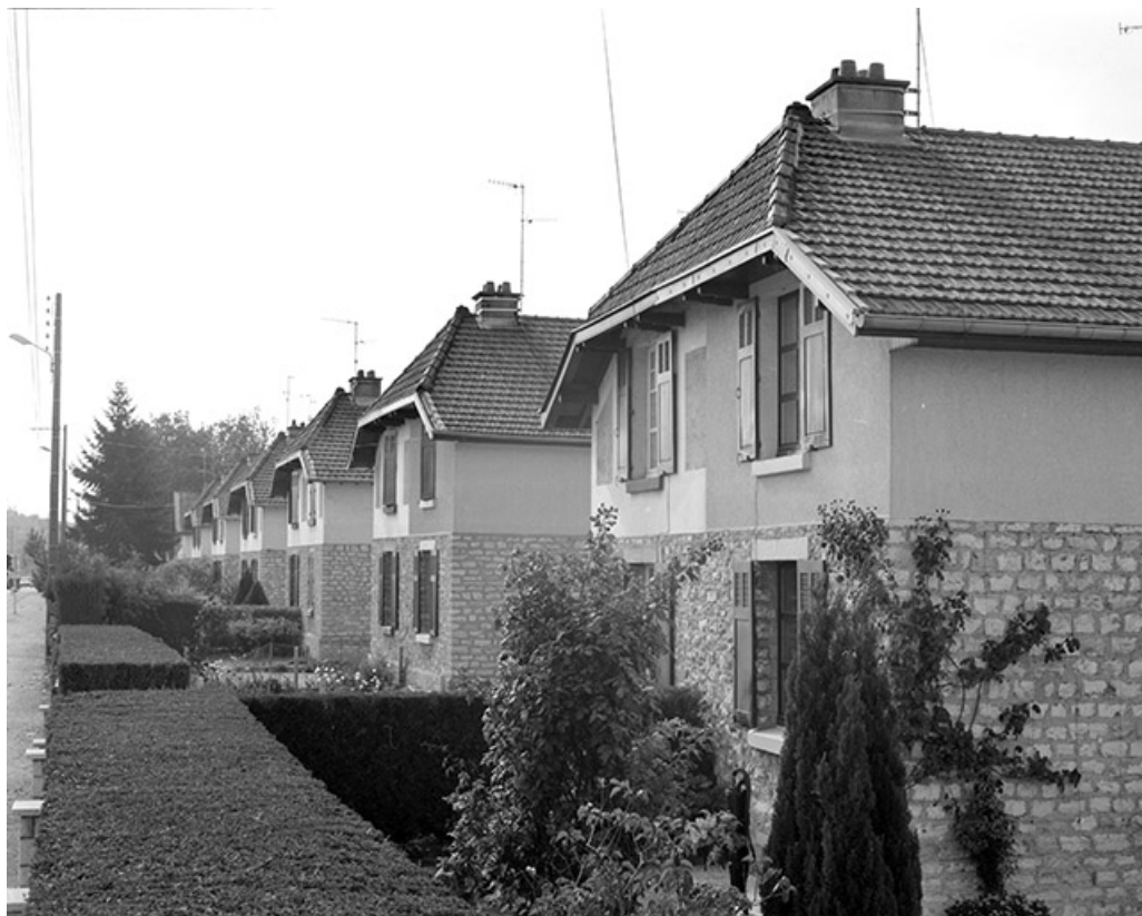
Maisons de type 10A, rue de Belvoye, façades antérieures.

39, Damparis, lieudit : Cité des Carrières