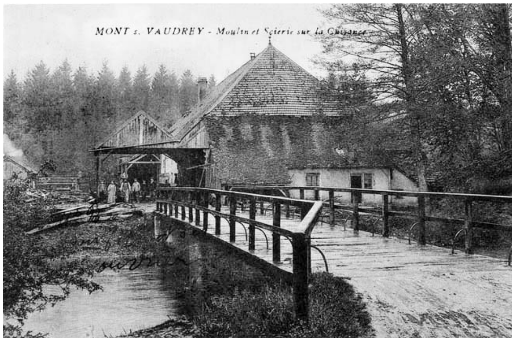
Mont s.- Vaudrey - Moulin et Scierie sur la Cuisance.