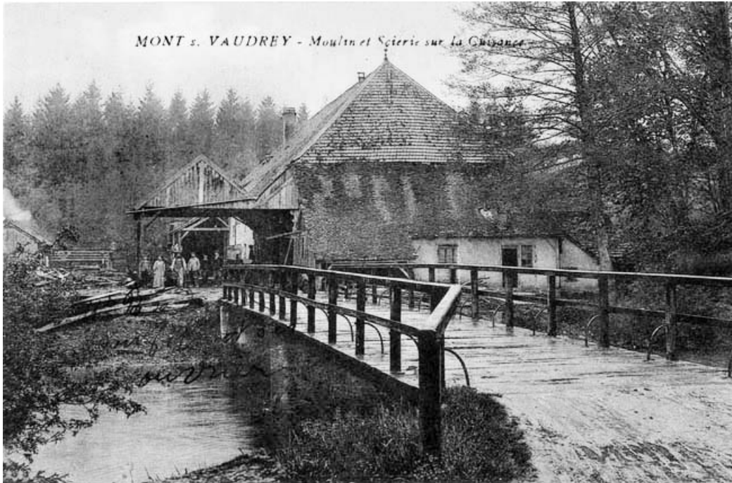
Mont s.- Vaudrey - Moulin et Scierie sur la Cuisance.