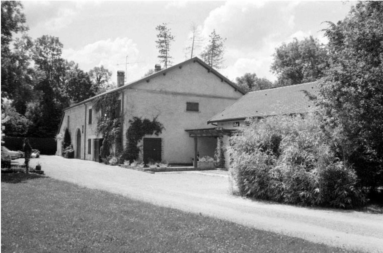
Vue d'ensemble, depuis l'entrée.