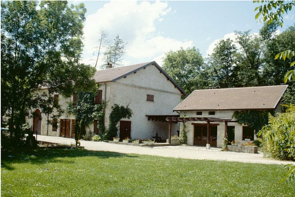
Logement patronal, bâtiment d'eau et ancienne scierie.