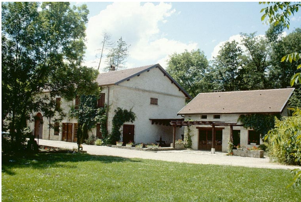
Logement patronal, bâtiment d'eau et ancienne scierie.