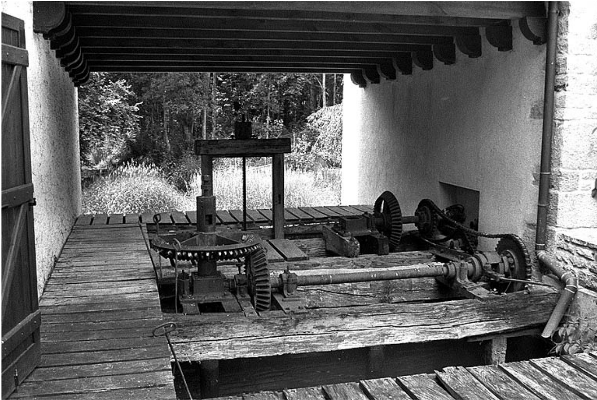
Systèmes d'admission d'eau et de transmission de la turbine.