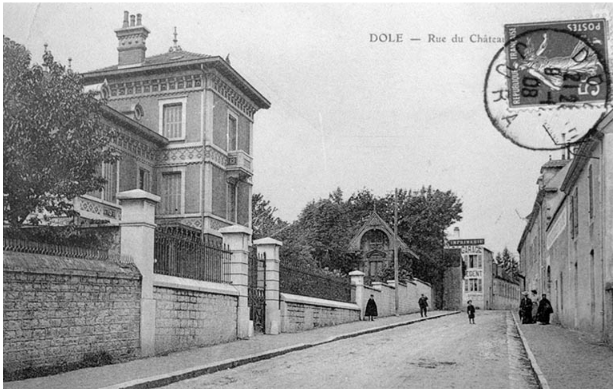
Dole - Rue du Château d'eau. 39, Dole, 80, 82 rue Mont Roland