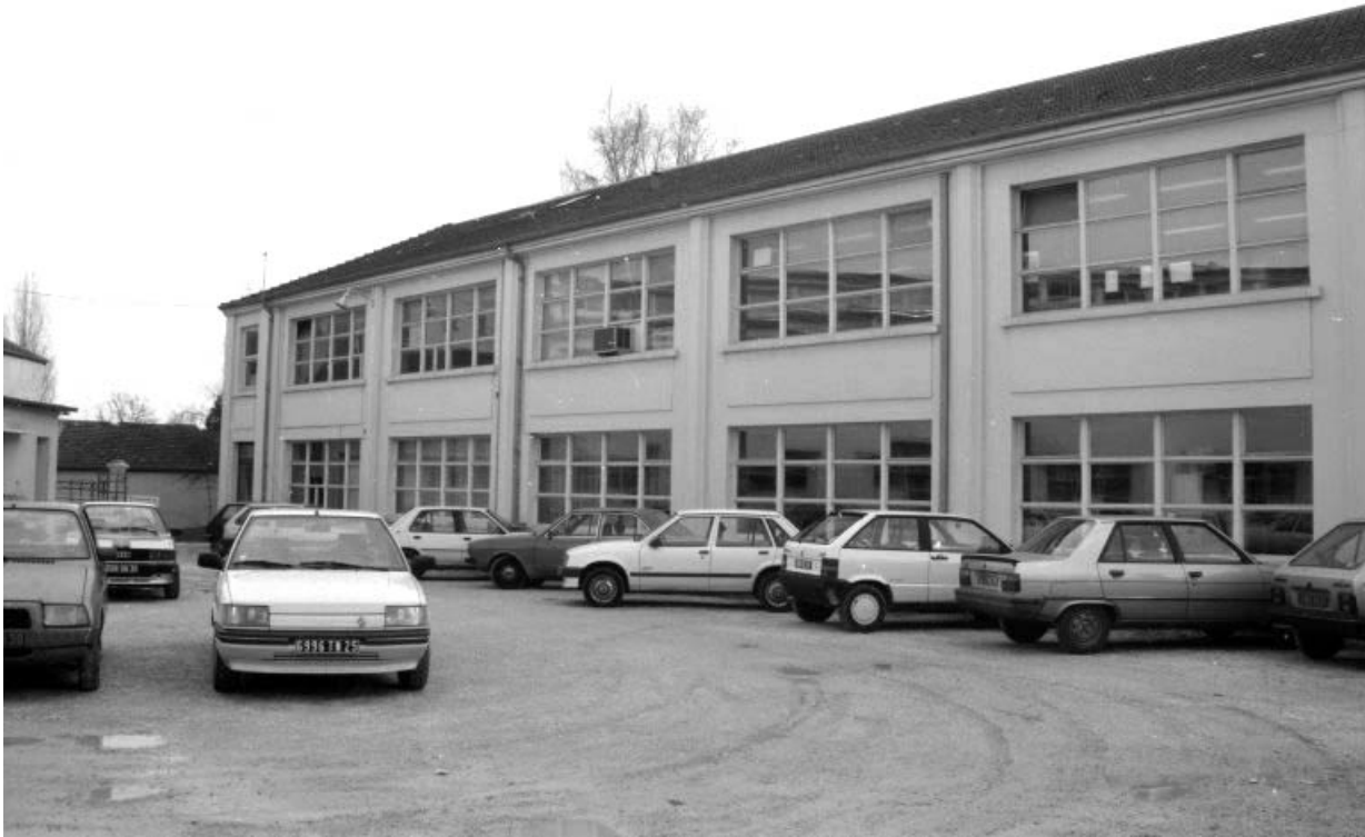
Bureau, bureau d'études et laboratoire.