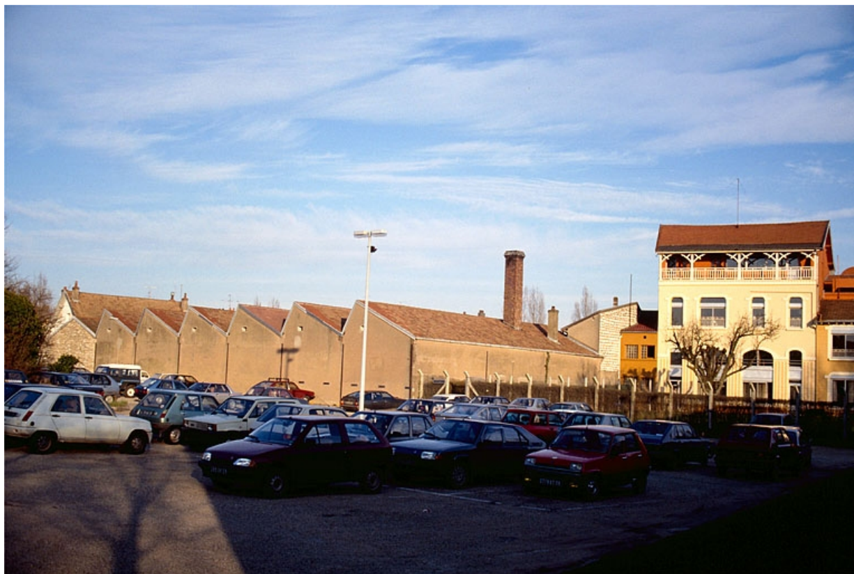
Vue d'ensemble, depuis l'ouest.