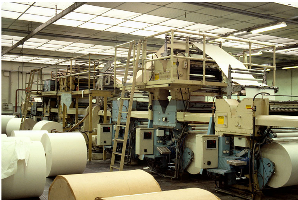
Atelier de fabrication : presse rotative Rockwell.