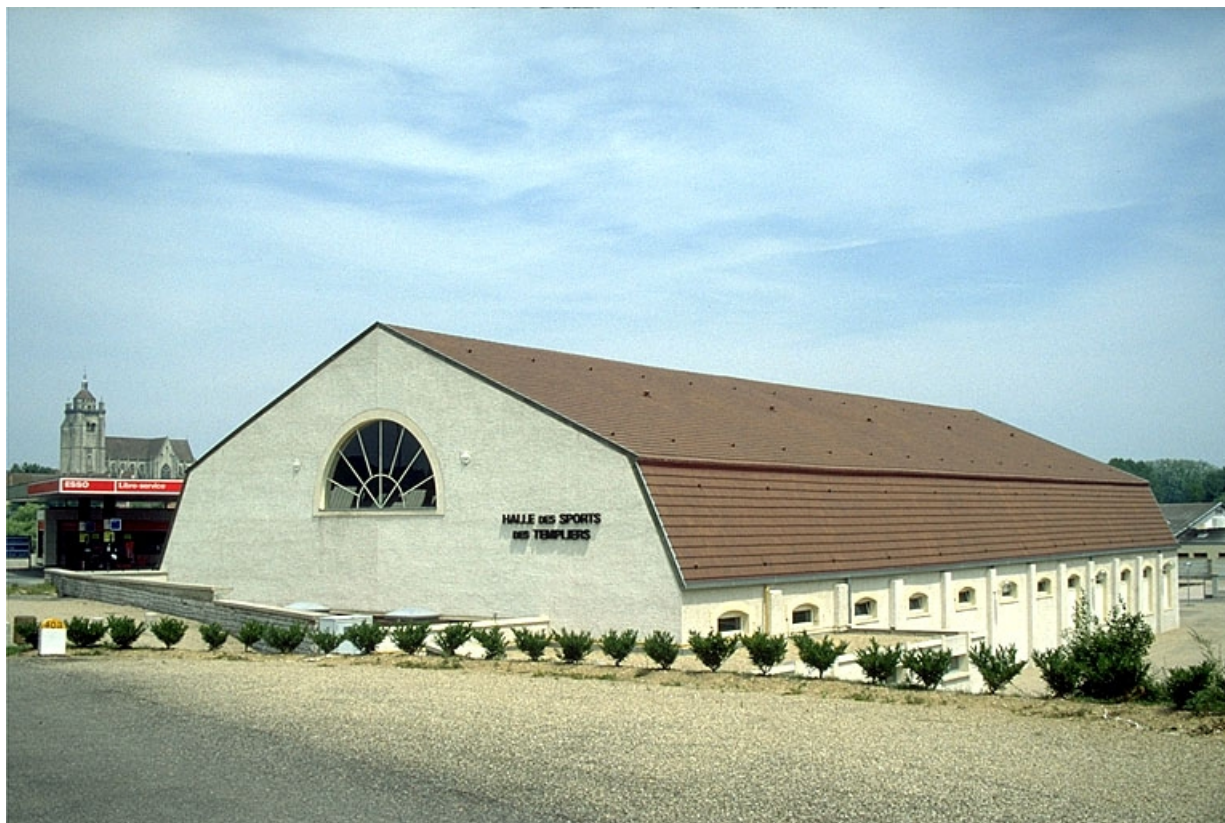
Vue d'ensemble du gymnase, depuis le sud-ouest.