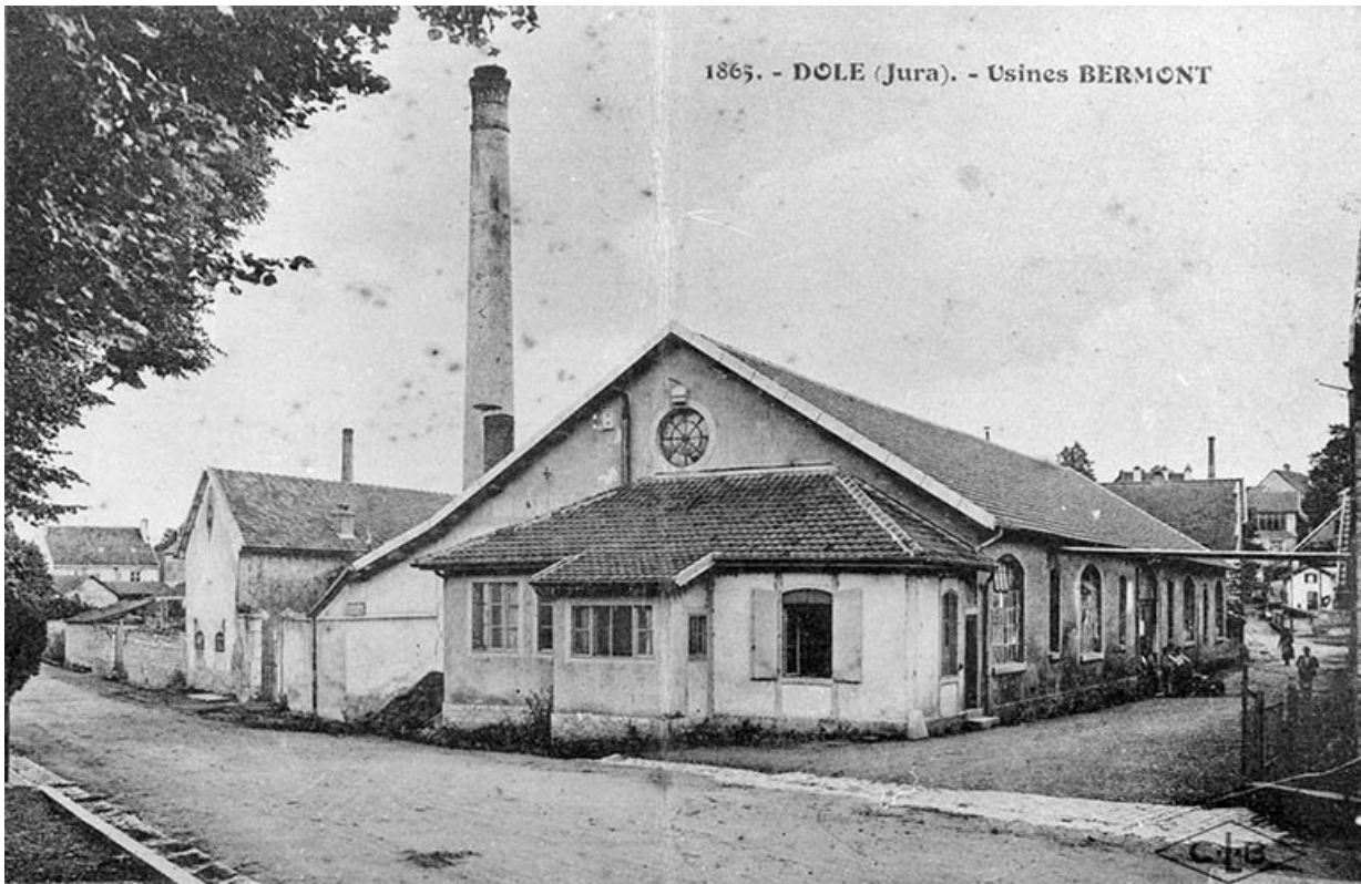
Dole (Jura). - Usines Bermond. 39, Dole, 17 rue des Templiers