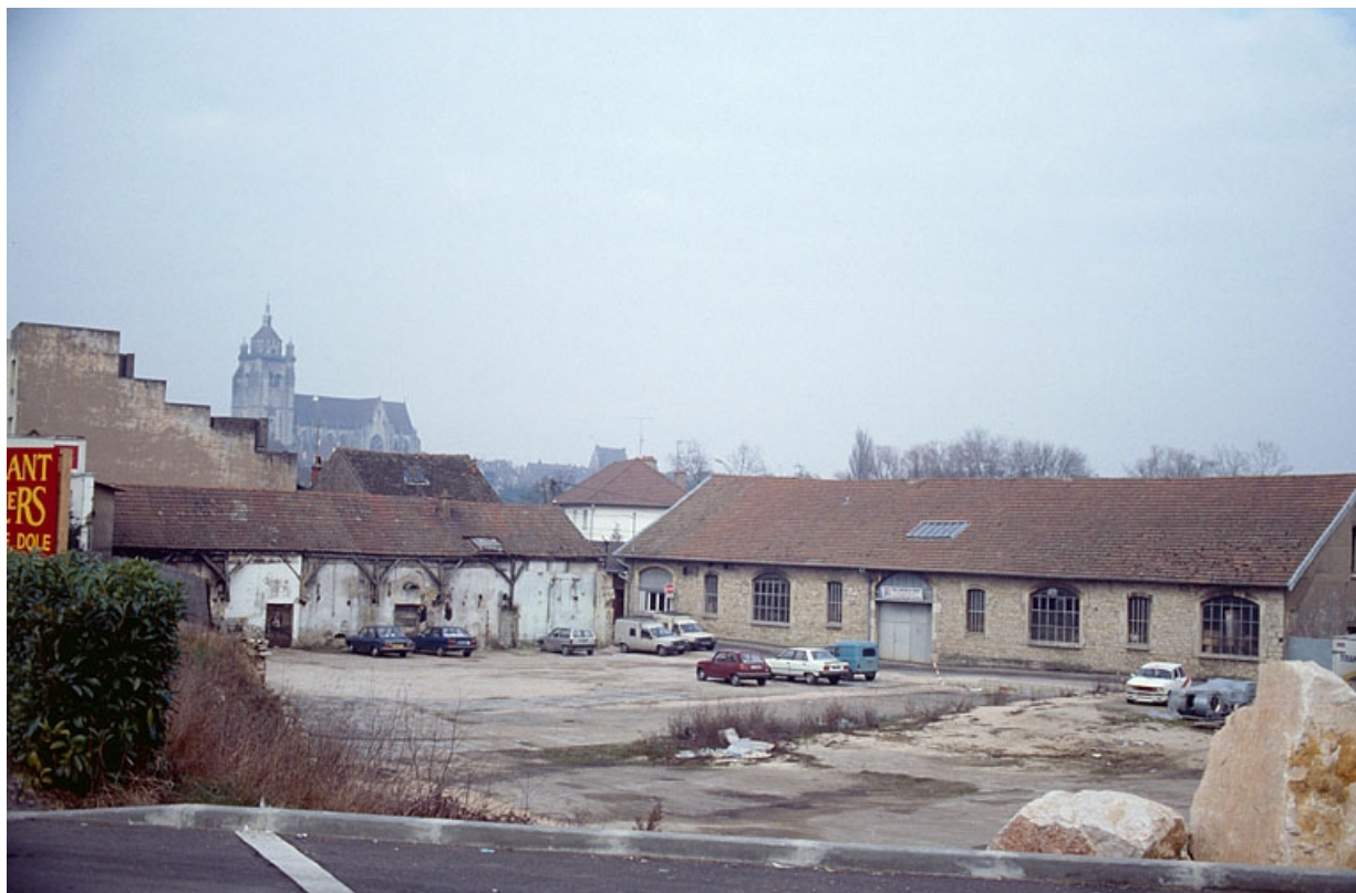
Vue d'ensemble depuis le sud-ouest en 1989.