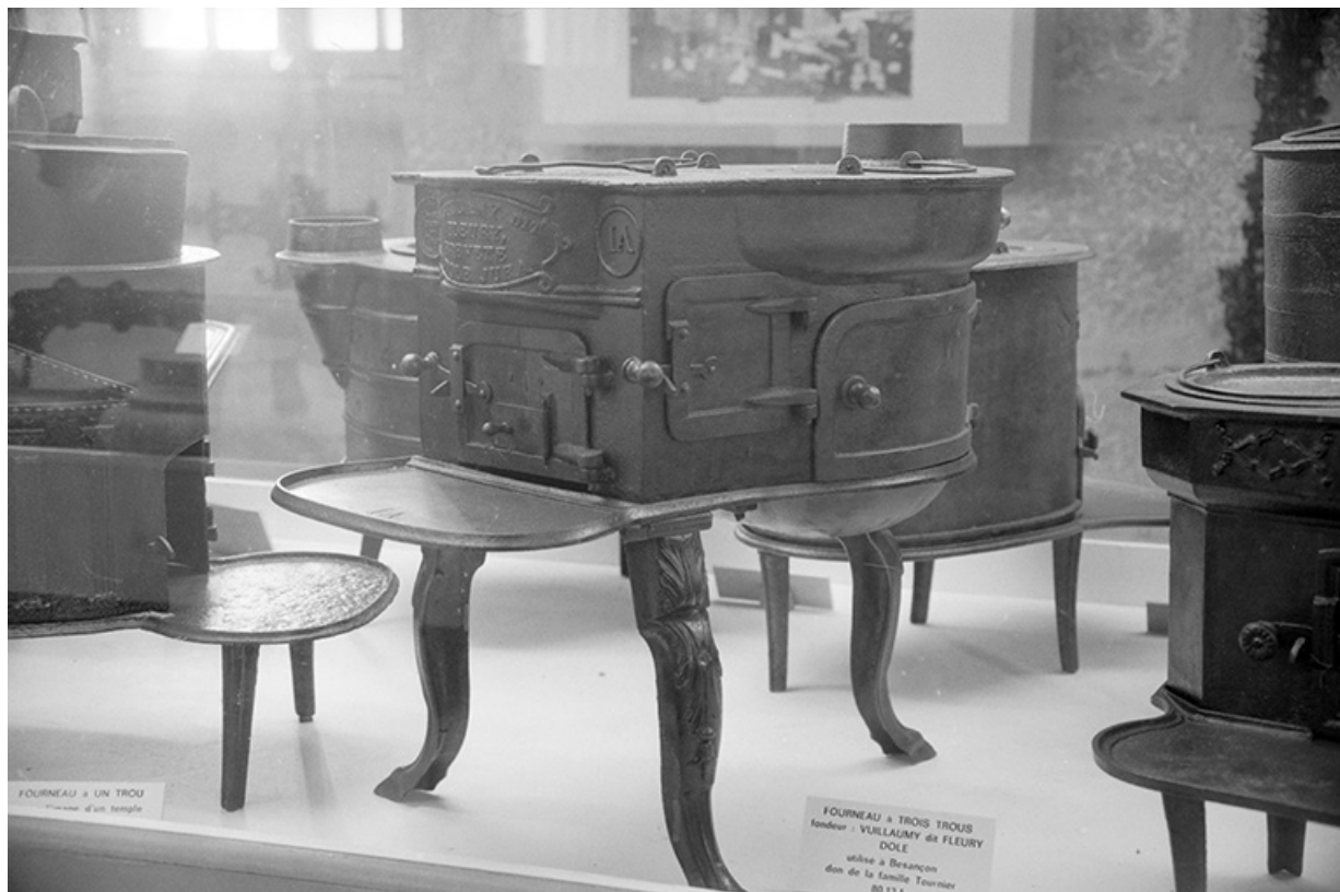
Cuisinière fabriquée par la fonderie Vuillamy-Fleury. 39, Dole, 17 rue des Templiers