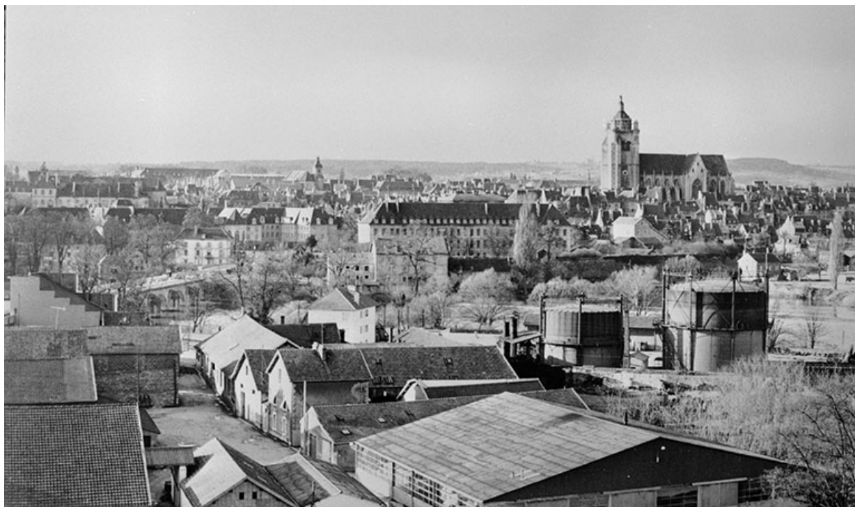
Vue d'ensemble depuis le sud, entre 1967 et 1971.