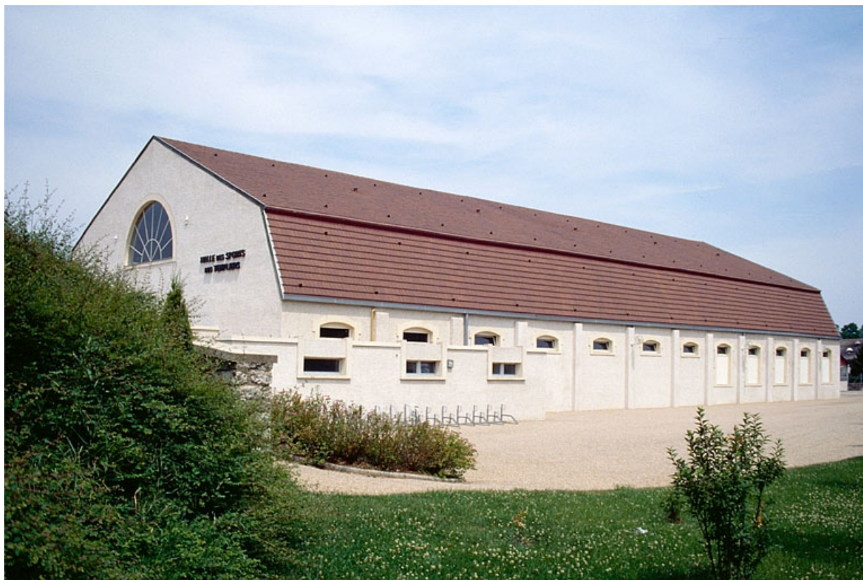
Façade latérale gauche du gymnase.