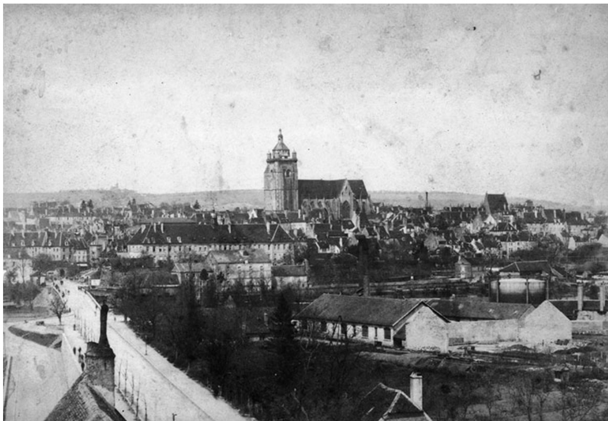
Vue d'ensemble de la fonderie depuis le sud.