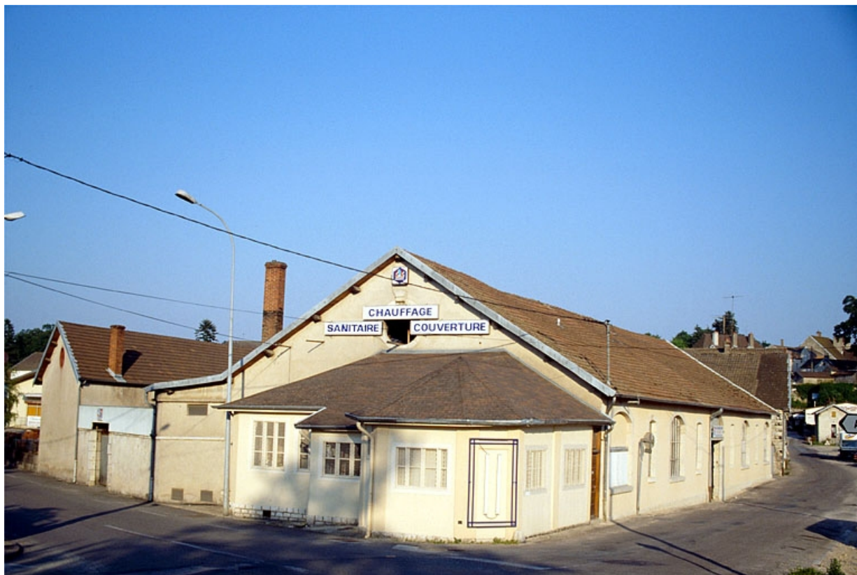
Vue d'ensemble du magasin de commerce, depuis l'ouest.