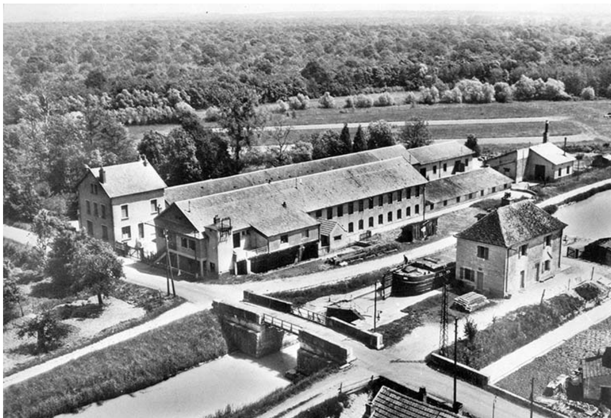
En avion au dessus de... Abergement-la-Ronce (Jura). Le Quartier du Canal et l'usine [vue aérienne]. 39, Abergement-la-Ronce, 3 route de Damparis