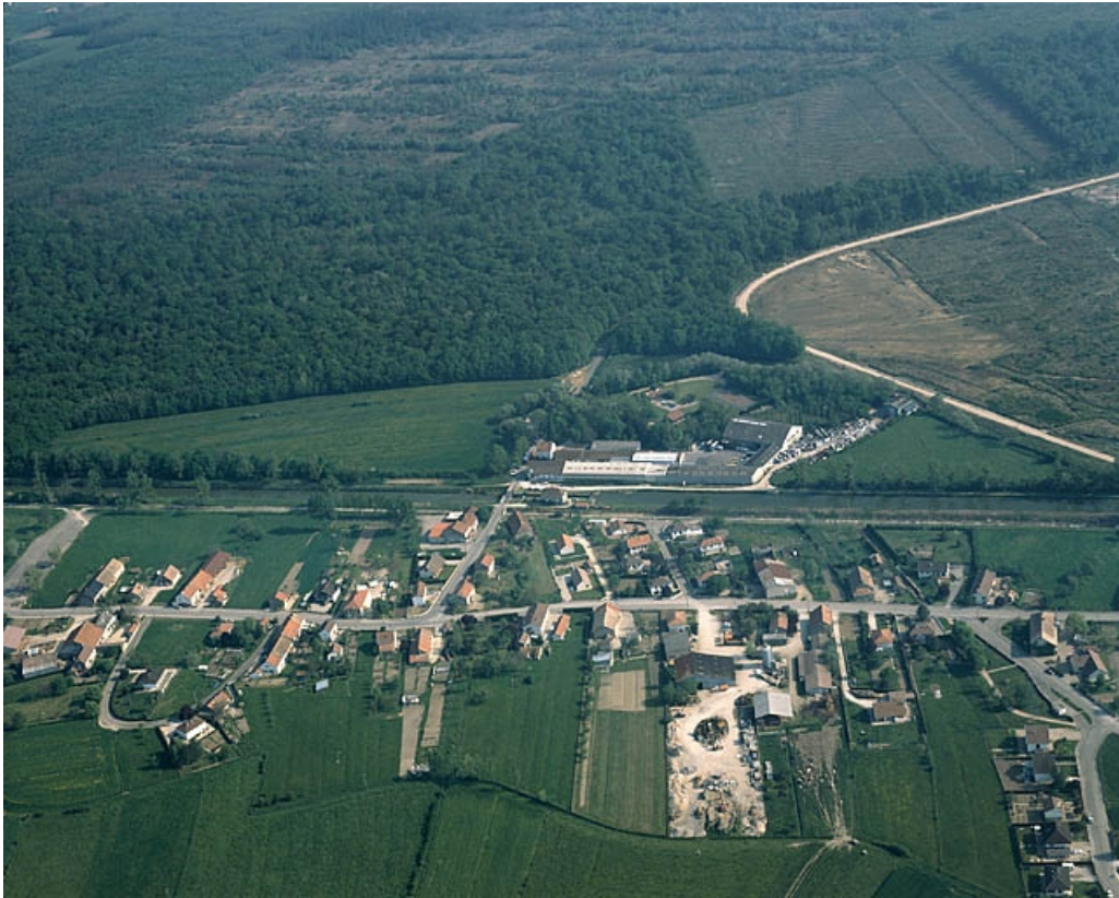
Vue aérienne, depuis le sud.

39, Abergement-la-Ronce, 3 route de Damparis