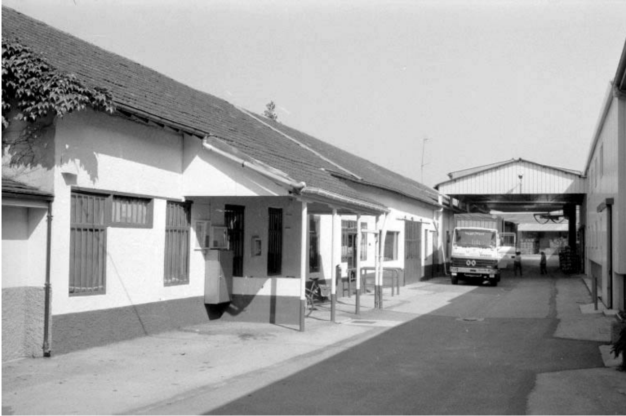
Magasin de commerce (I) et passage couvert. 39, Abergement-la-Ronce, 3 route de Damparis