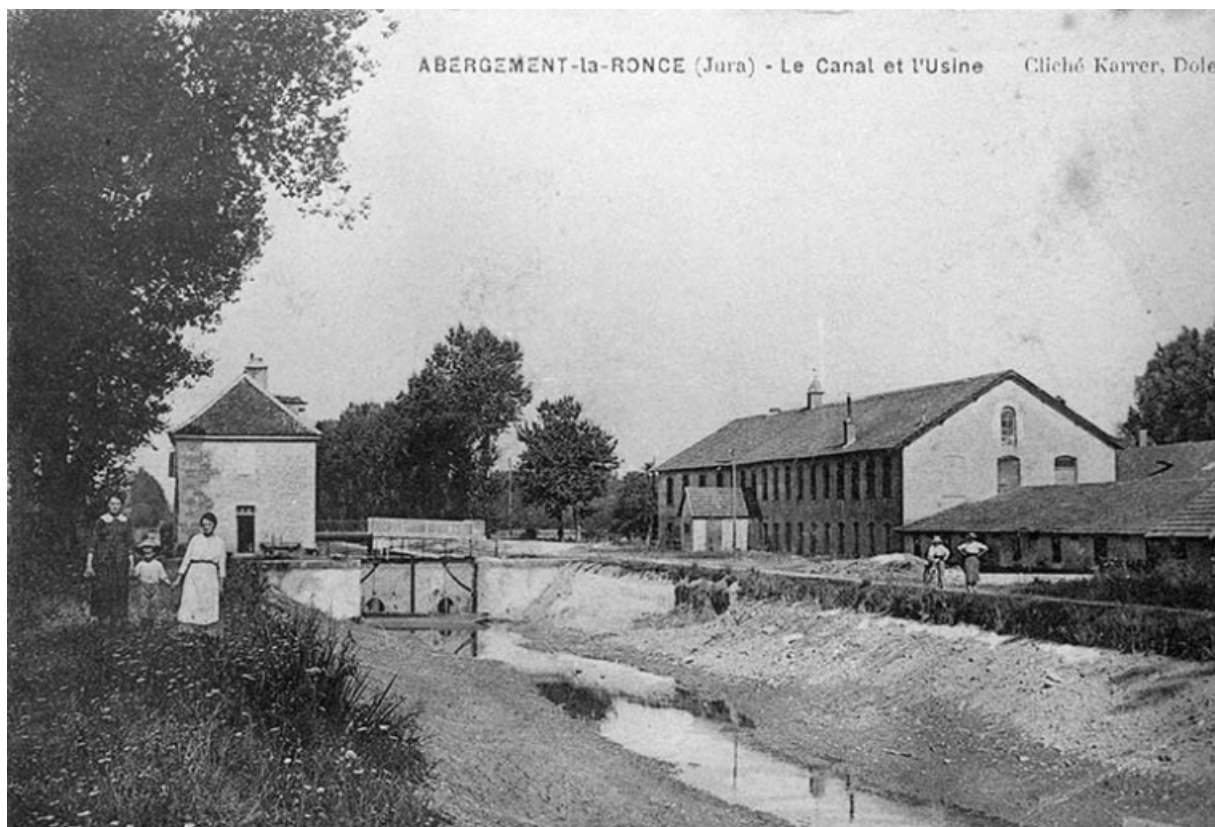
Abergement-la-Ronce (Jura) - Le Canal et l'Usine (canal à sec).

39, Abergement-la-Ronce, 3 route de Damparis