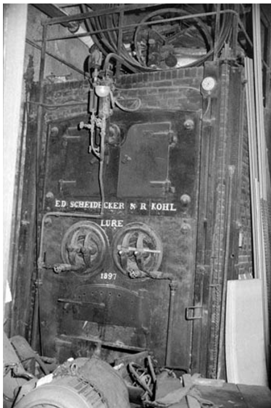
Atelier (C) : chaudière Scheidecker et Kohl. 39, Abergement-la-Ronce, 3 route de Damparis