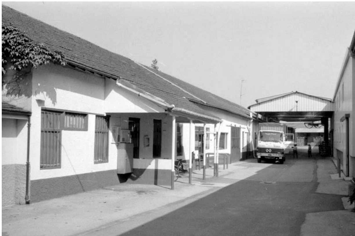
Magasin de commerce (I) et passage couvert. 39, Abergement-la-Ronce, 3 route de Damparis