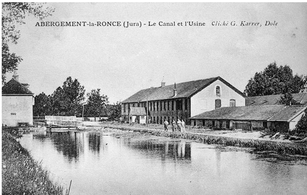
Abergement-la-Ronce (Jura) - Le Canal et l'Usine.

39, Abergement-la-Ronce, 3 route de Damparis