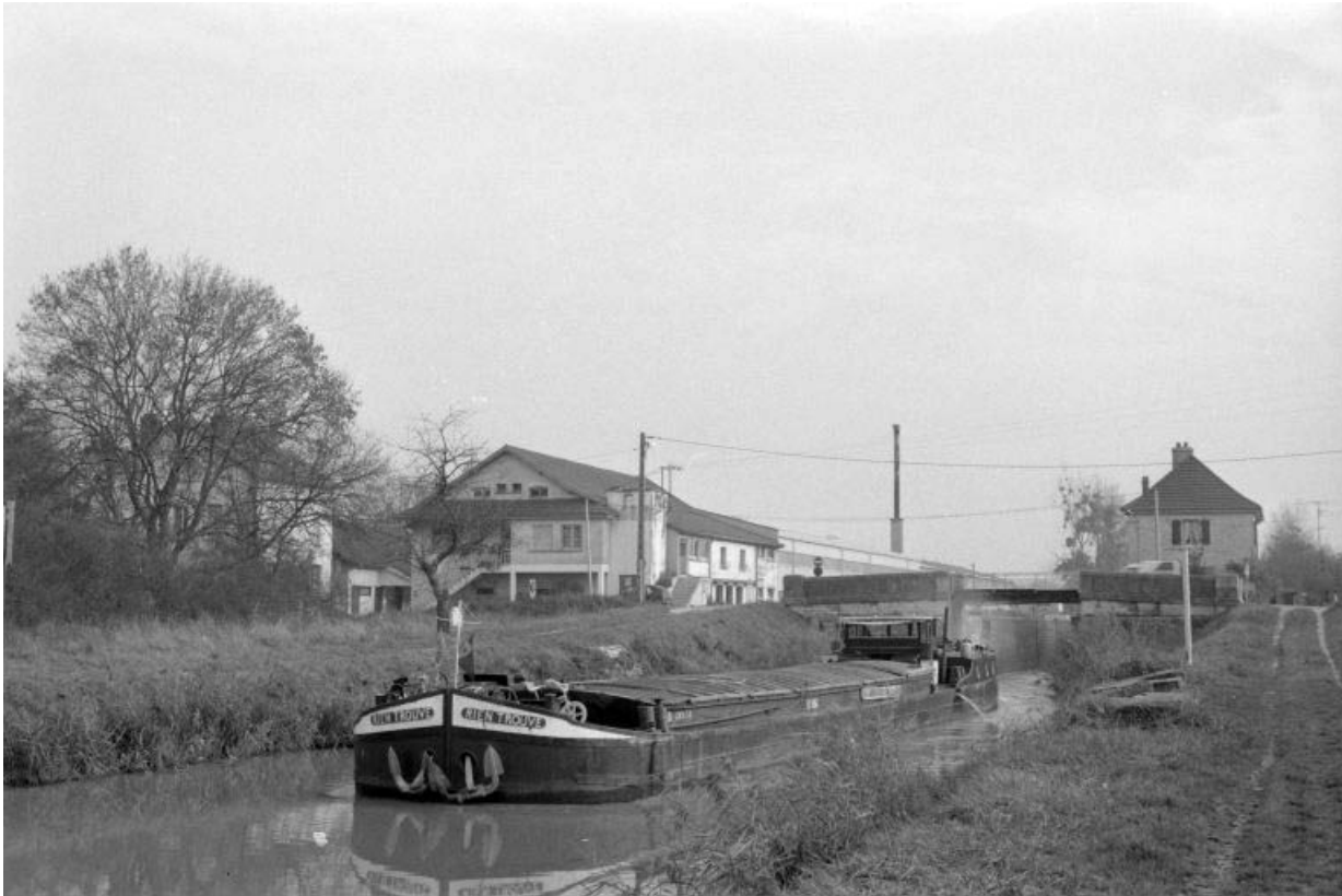
Vue d'ensemble depuis l'ouest, avec péniche.

39, Abergement-la-Ronce, 3 route de Damparis