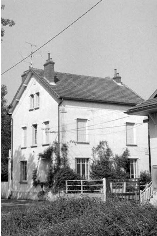
Logement patronal et entrée de l'usine.

39, Abergement-la-Ronce, 3 route de Damparis