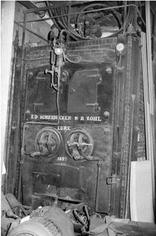
Atelier (C) : chaudière Scheidecker et Kohl. 39, Abergement-la-Ronce, 3 route de Damparis