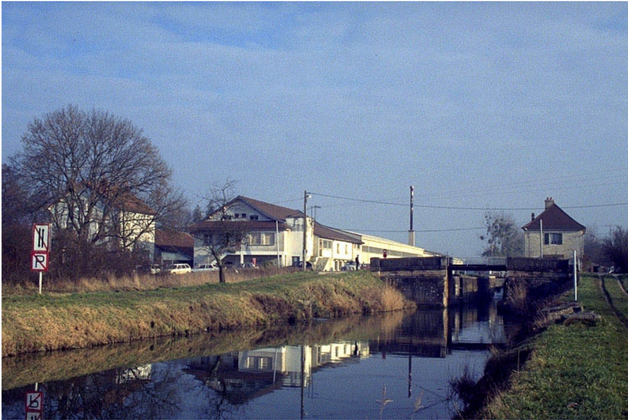
Vue d'ensemble depuis l'ouest, avec le canal.

39, Abergement-la-Ronce, 3 route de Damparis