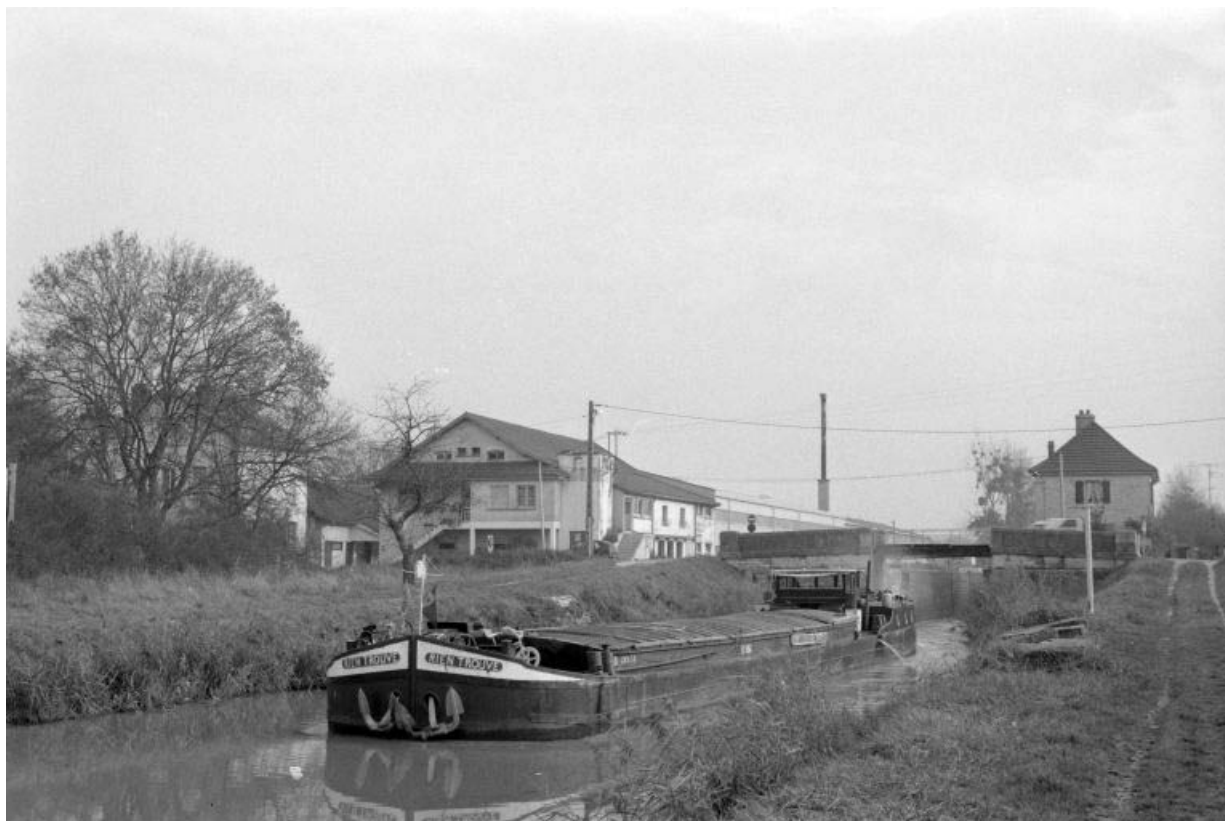
Vue d'ensemble depuis l'ouest, avec péniche.

39, Abergement-la-Ronce, 3 route de Damparis