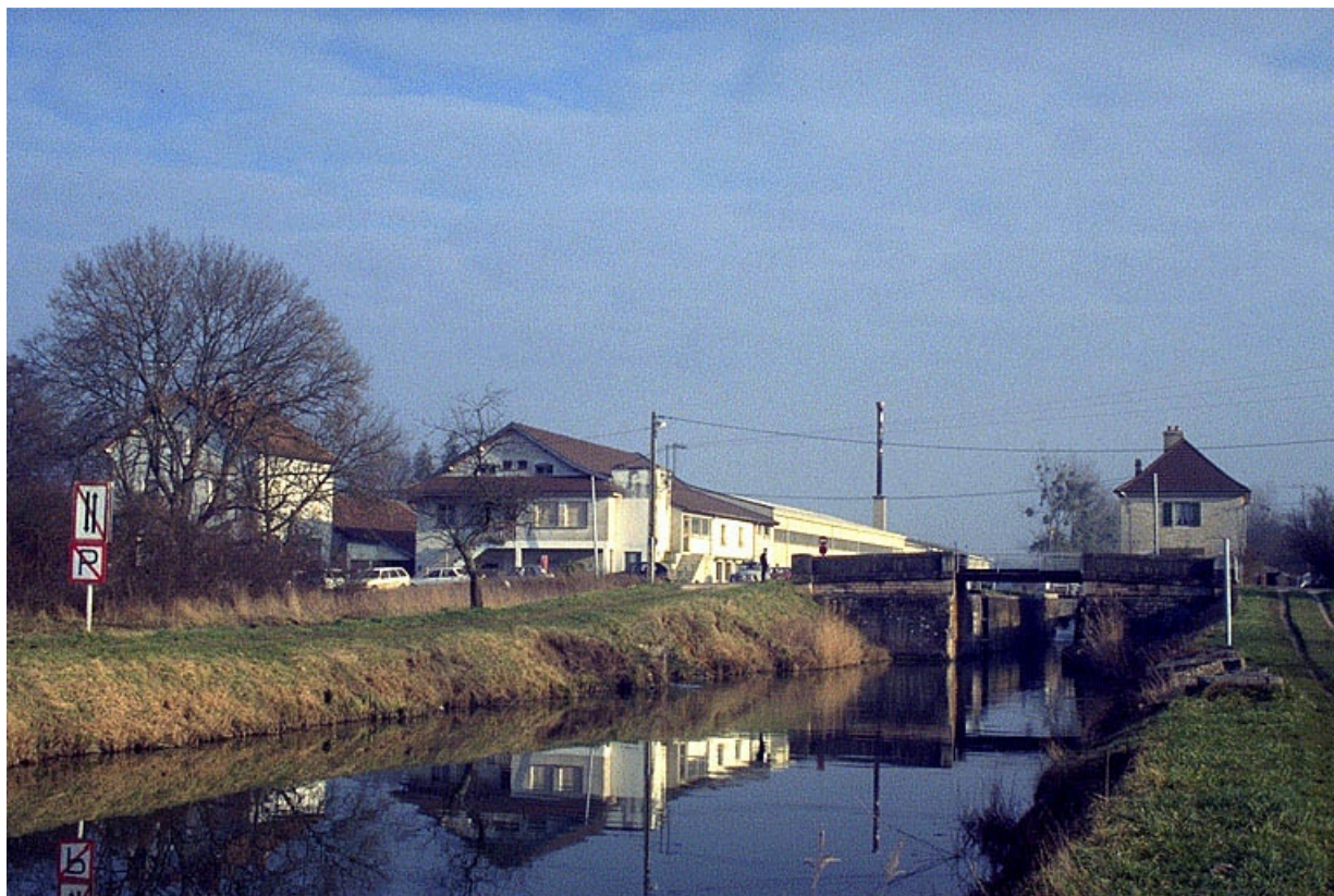
Vue d'ensemble depuis l'ouest, avec le canal.

39, Abergement-la-Ronce, 3 route de Damparis