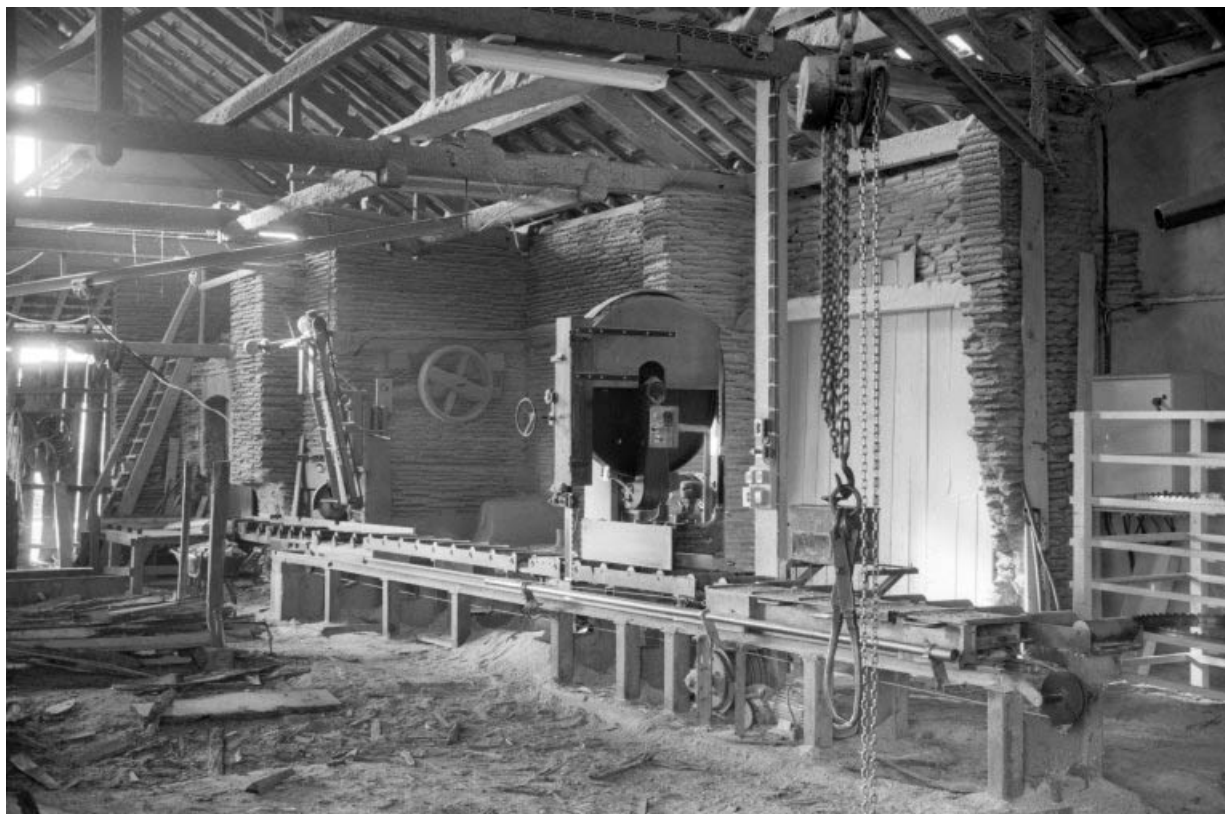
Intérieur de l'atelier de fabrication : scie Marcol.