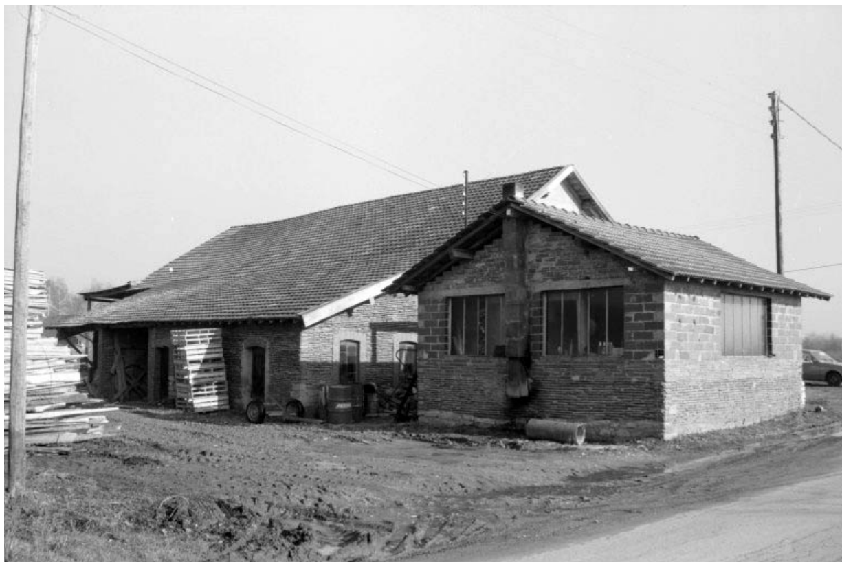
Bureau et atelier de fabrication, vus de l'ouest.