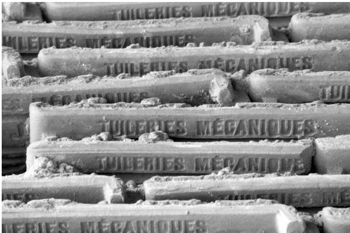
Détail de l'appareil de tuiles en gros-oeuvre.