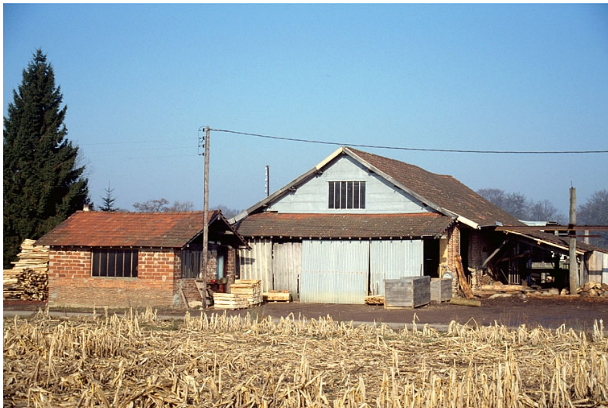
Bureau et atelier de fabrication, vus du sud.