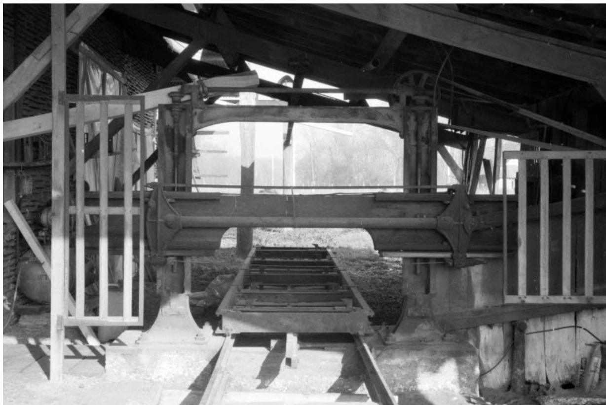
Scie "manchette" : châssis horizontal à lame unique. Le châssis est actionné par la bielle oblique à droite. 39, Commenailles, lieudit : l'Argillois