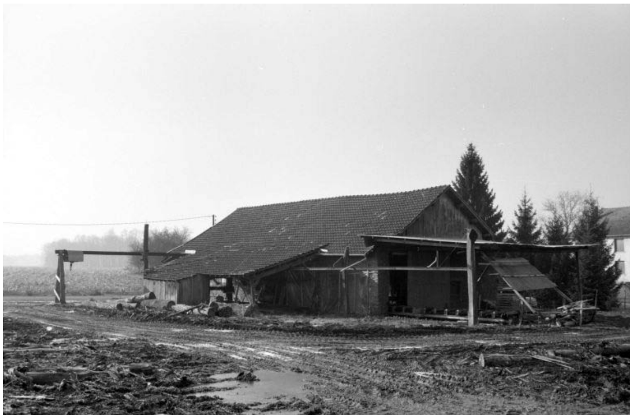
Atelier de fabrication, vu du nord-ouest.