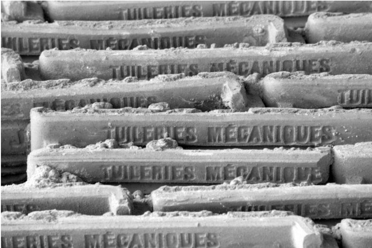
Détail de l'appareil de tuiles en gros-oeuvre.