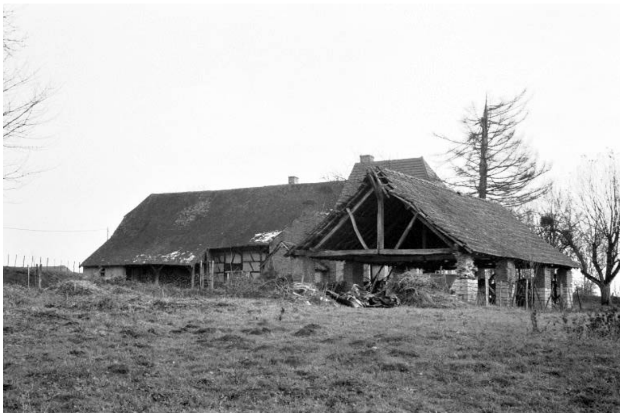
Etable et halle de séchage (D), depuis l'ouest.