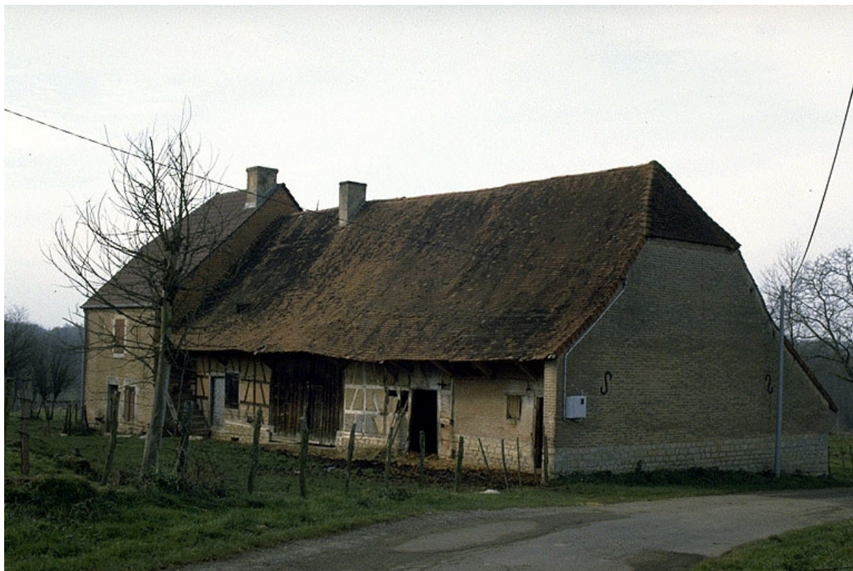
Etable et logement patronal, depuis l'est.