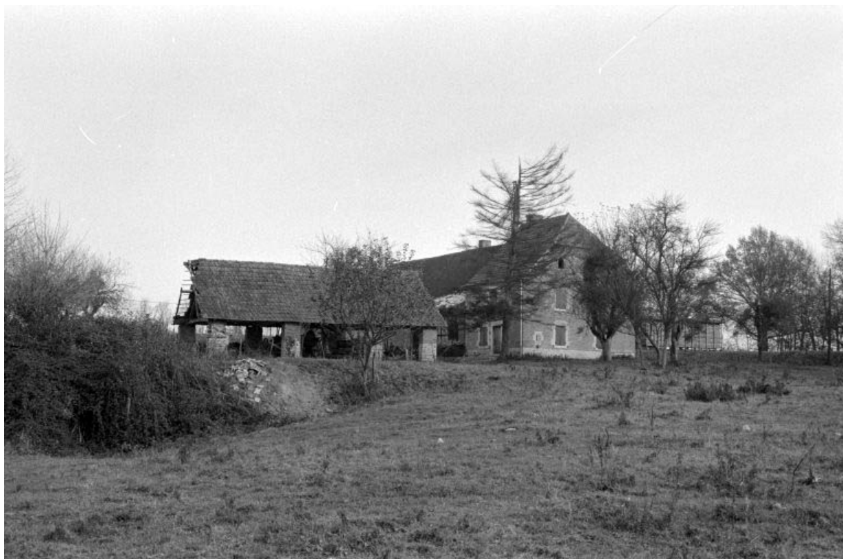
Vue d'ensemble, depuis le sud-ouest.