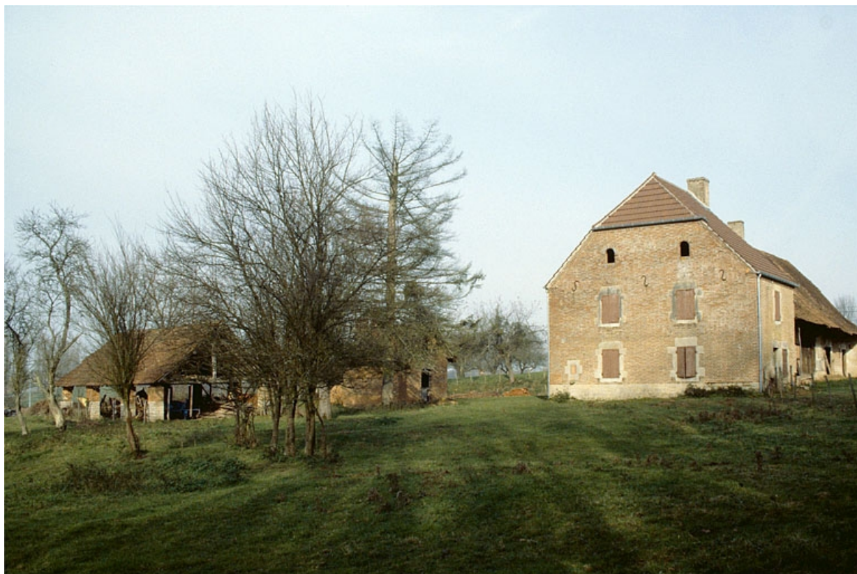
Vue d'ensemble, depuis le sud-est.