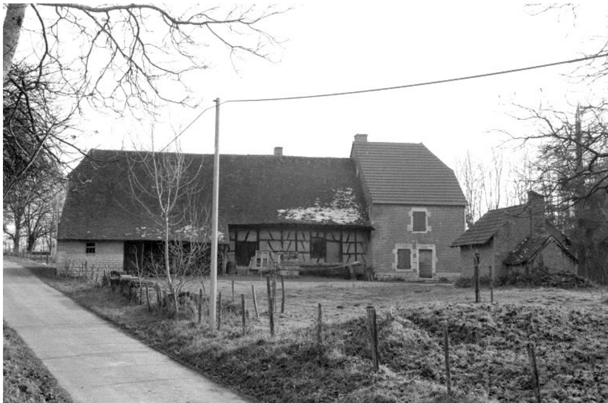
Etable, logement patronal et four à pain, depuis le nord-ouest.