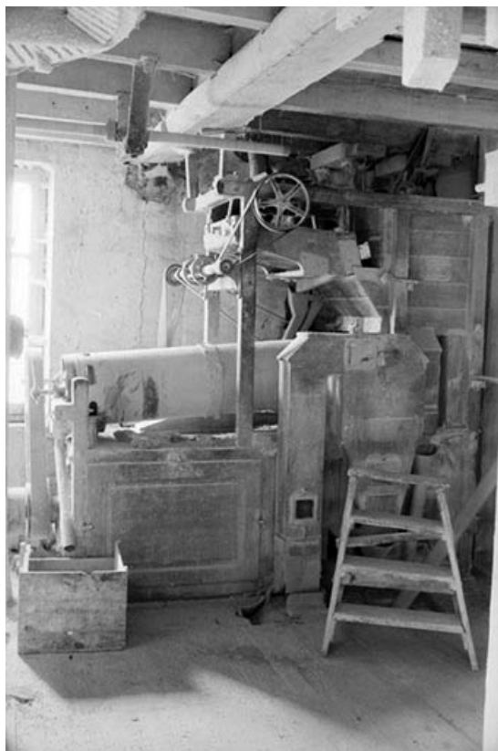
Trieur à grains Lacroix.