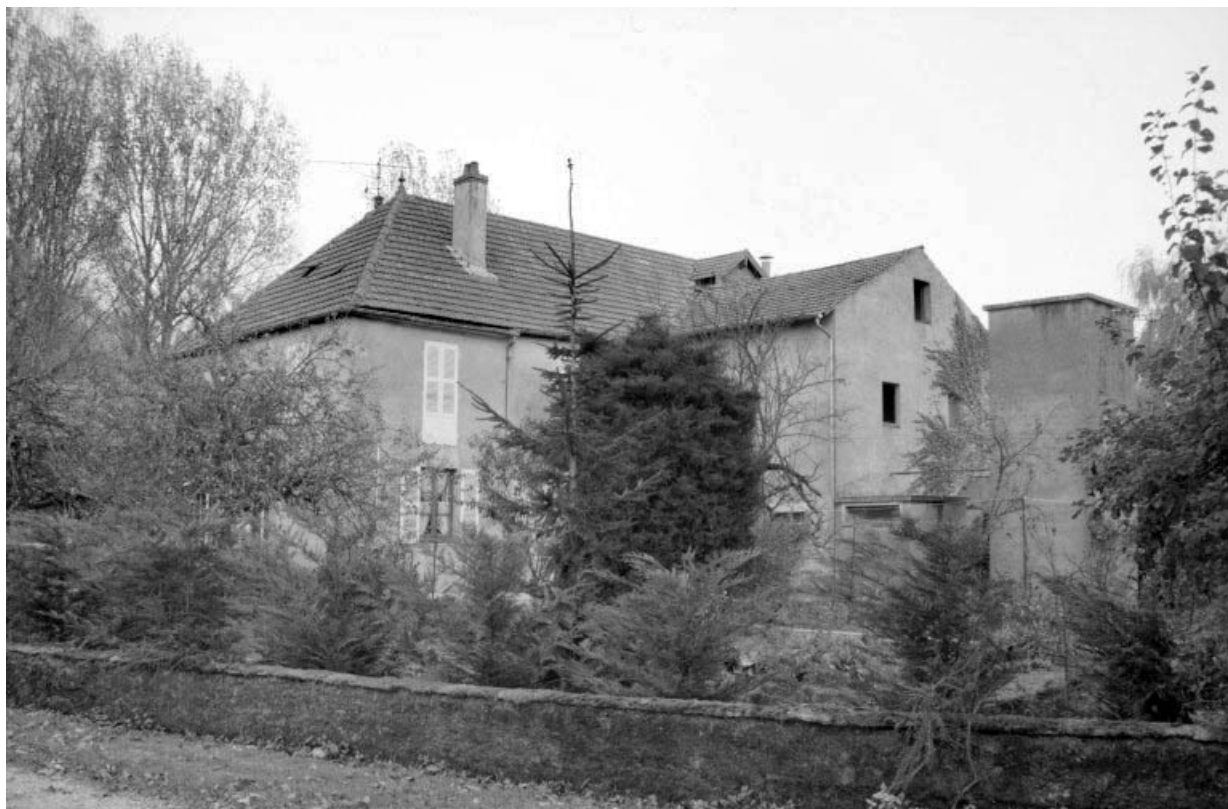
Atelier de fabrication et logement patronal, depuis l'ouest. 39, Saint-Loup