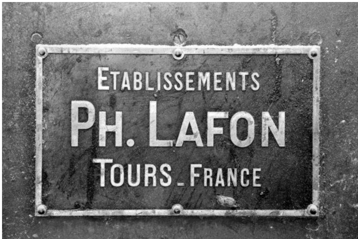
Plaque de constructeur de l'appareil à cylindres Lafon. 39, Saint-Loup