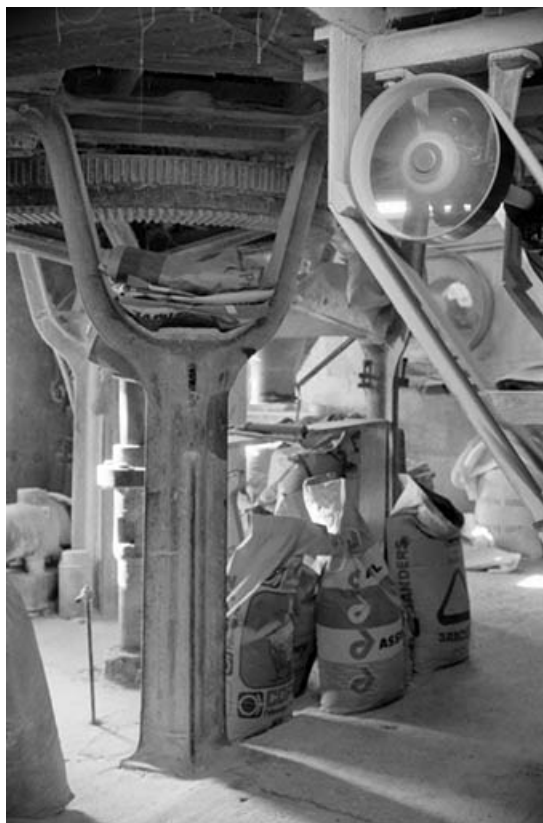
Transmission et support de meules (beffroi). 39, Saint-Loup