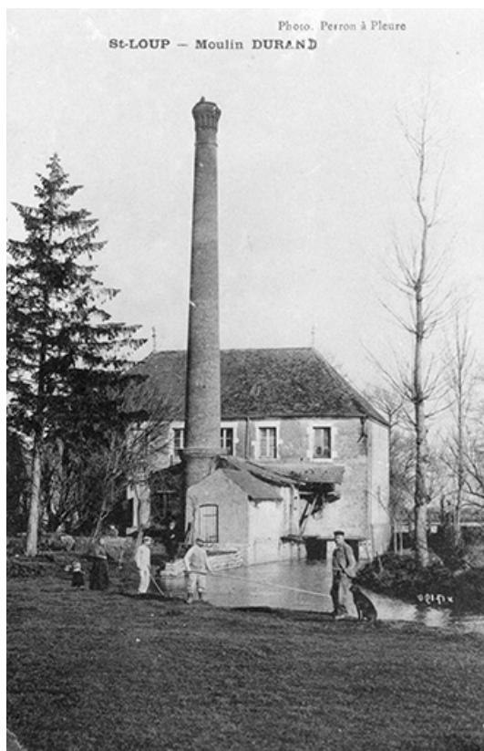
St Loup - Moulin Durand.