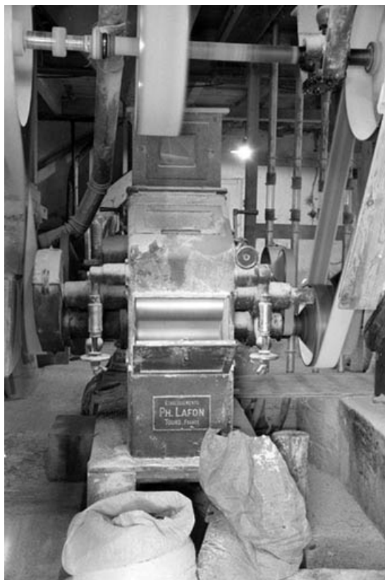
Appareil à cylindres Lafon. 39, Saint-Loup