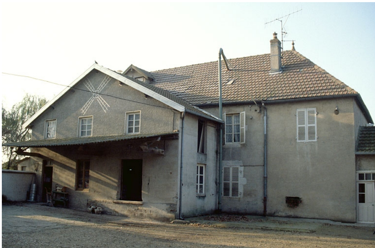
Atelier de fabrication et logement patronal, depuis le nord.