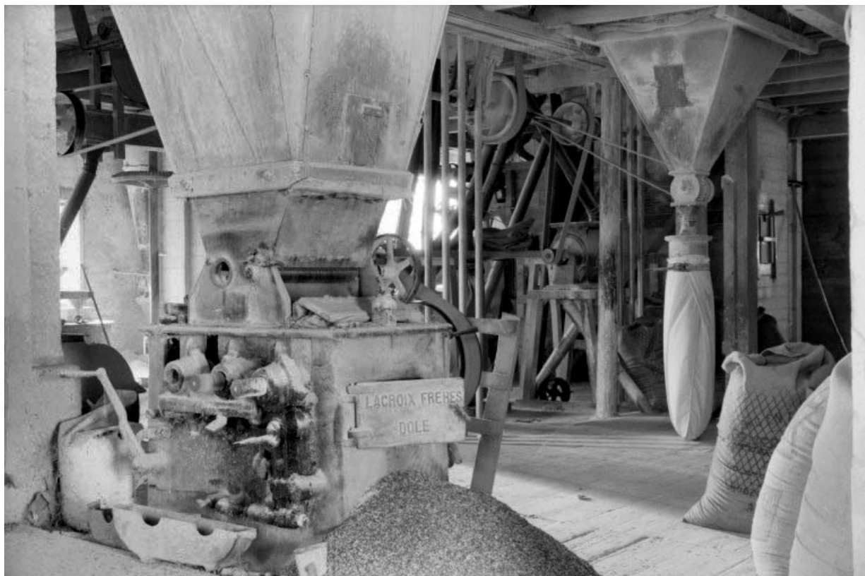
Appareil à cylindres Lacroix.