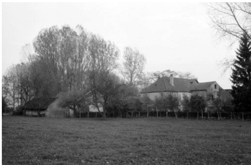
Vue d'ensemble, depuis l'ouest.