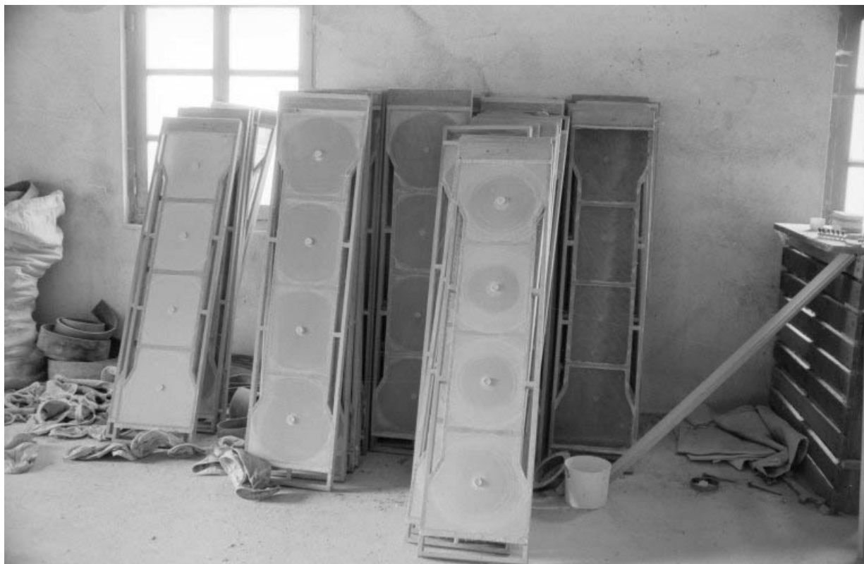
Tamis du plansichter.