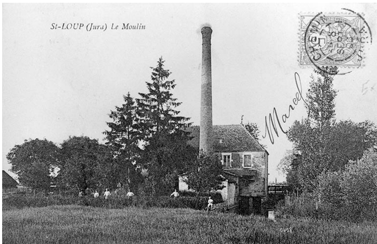
St Loup (Jura) - Le Moulin. 39, Saint-Loup