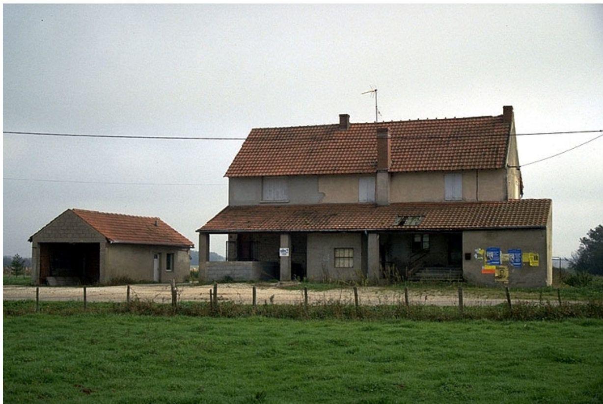
Ancienne fromagerie et remise, vues de l'ouest.