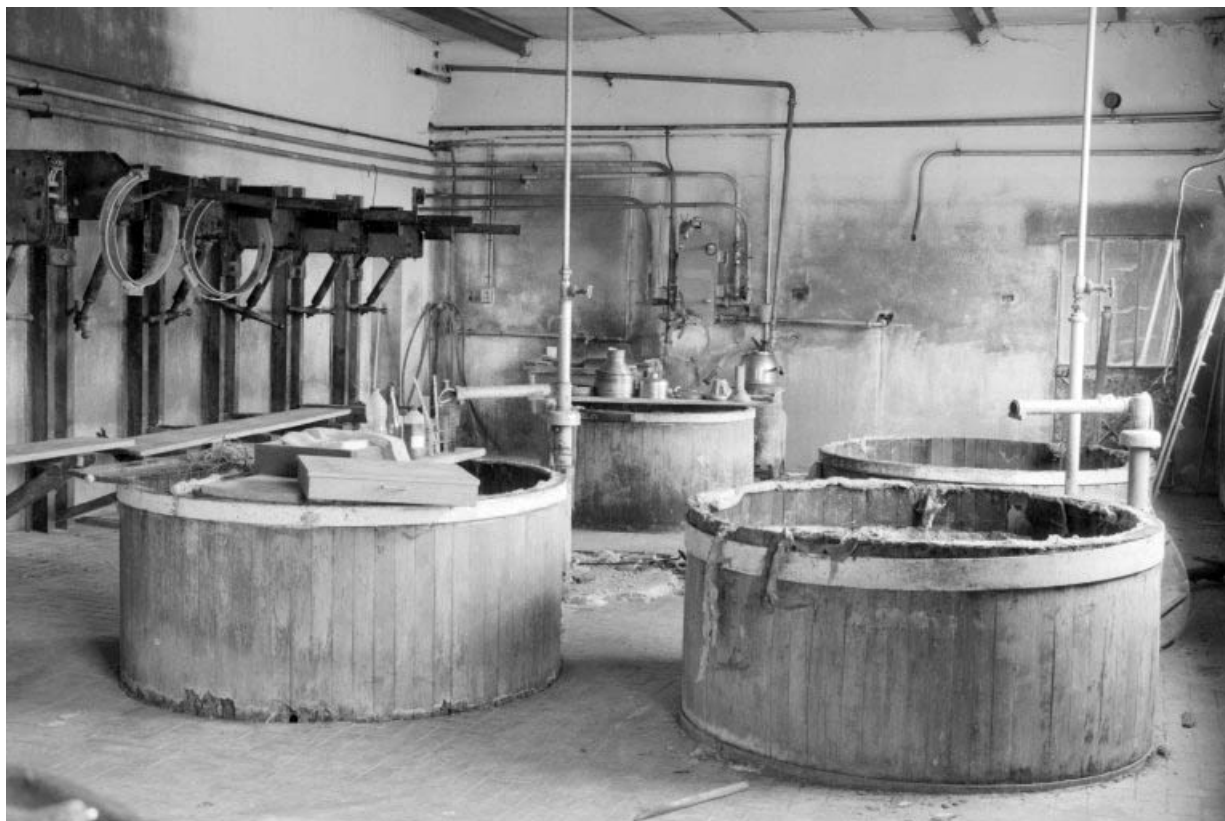
Intérieur de l'atelier de fabrication.