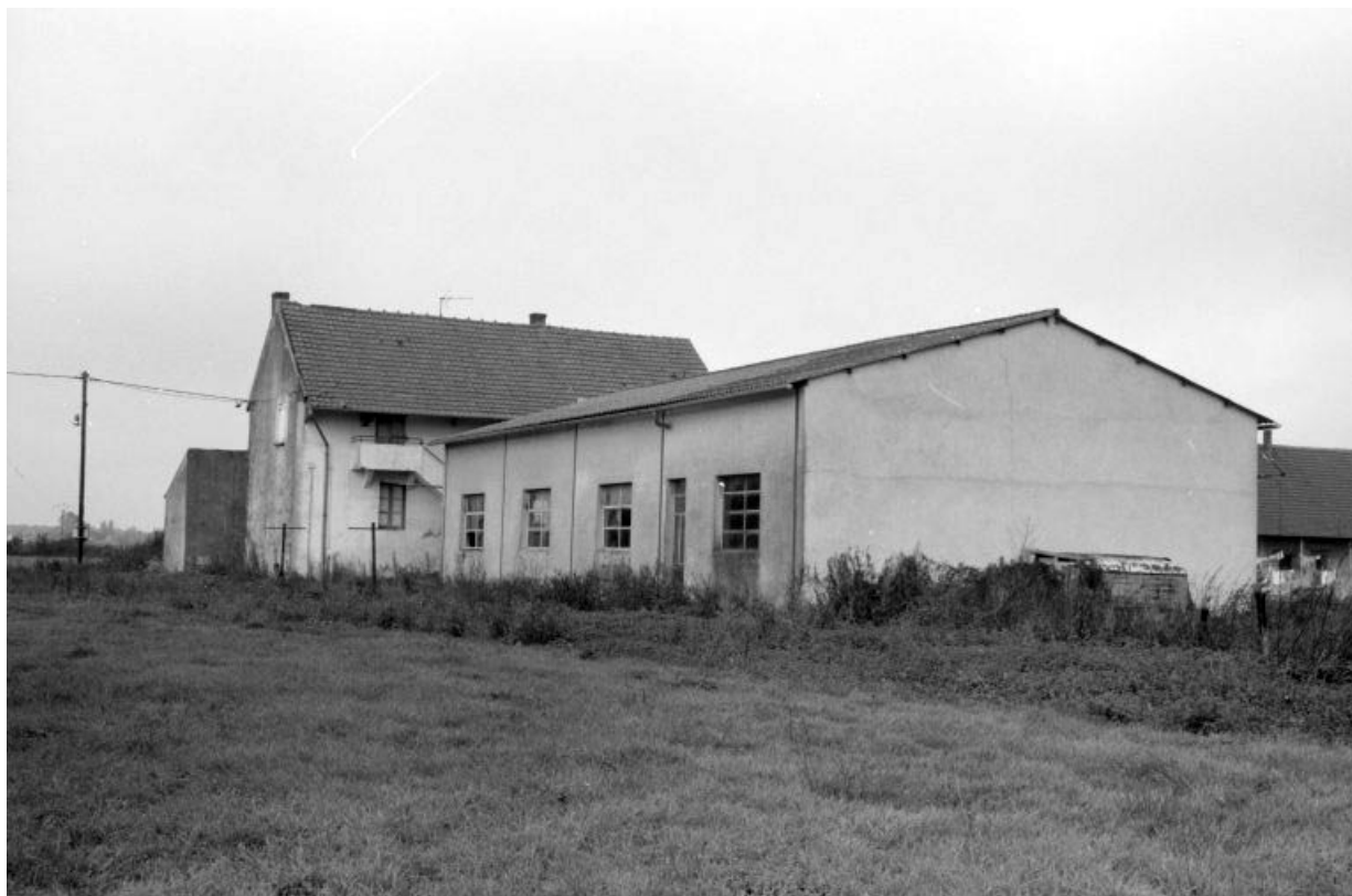
Nouvelle fromagerie, vue de l'est.