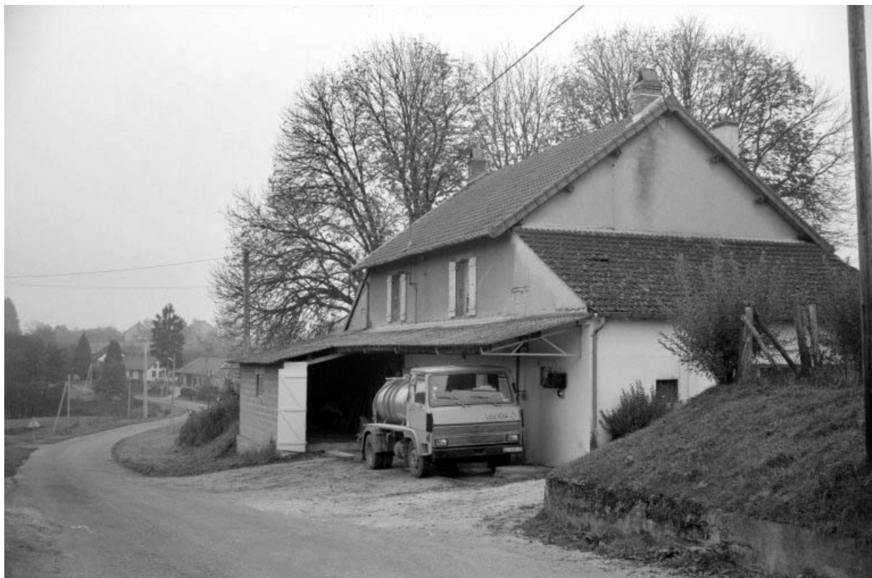
Vue d'ensemble, depuis le nord-est.