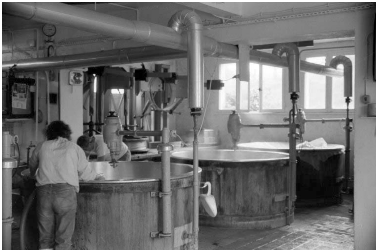
Atelier de fabrication : les cuves.