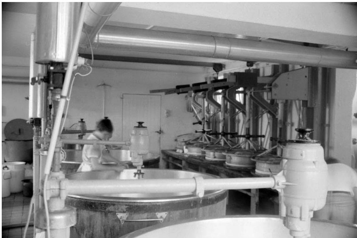
Atelier de fabrication : cuves et presses.