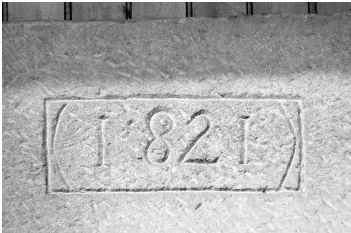
Moulin, porte d'entrée orientale : date portée.

39, Villers-Robert, lieudit : Pré du Moulin