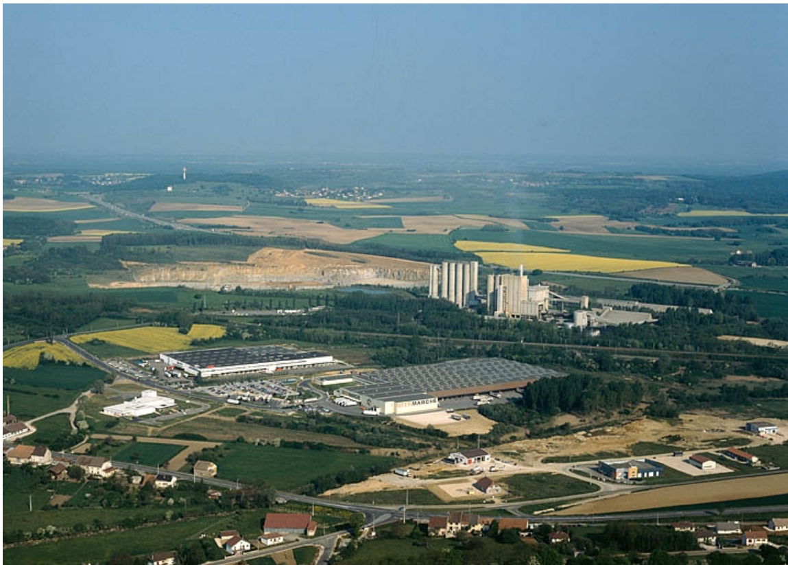
Vue aérienne, depuis le sud-est.