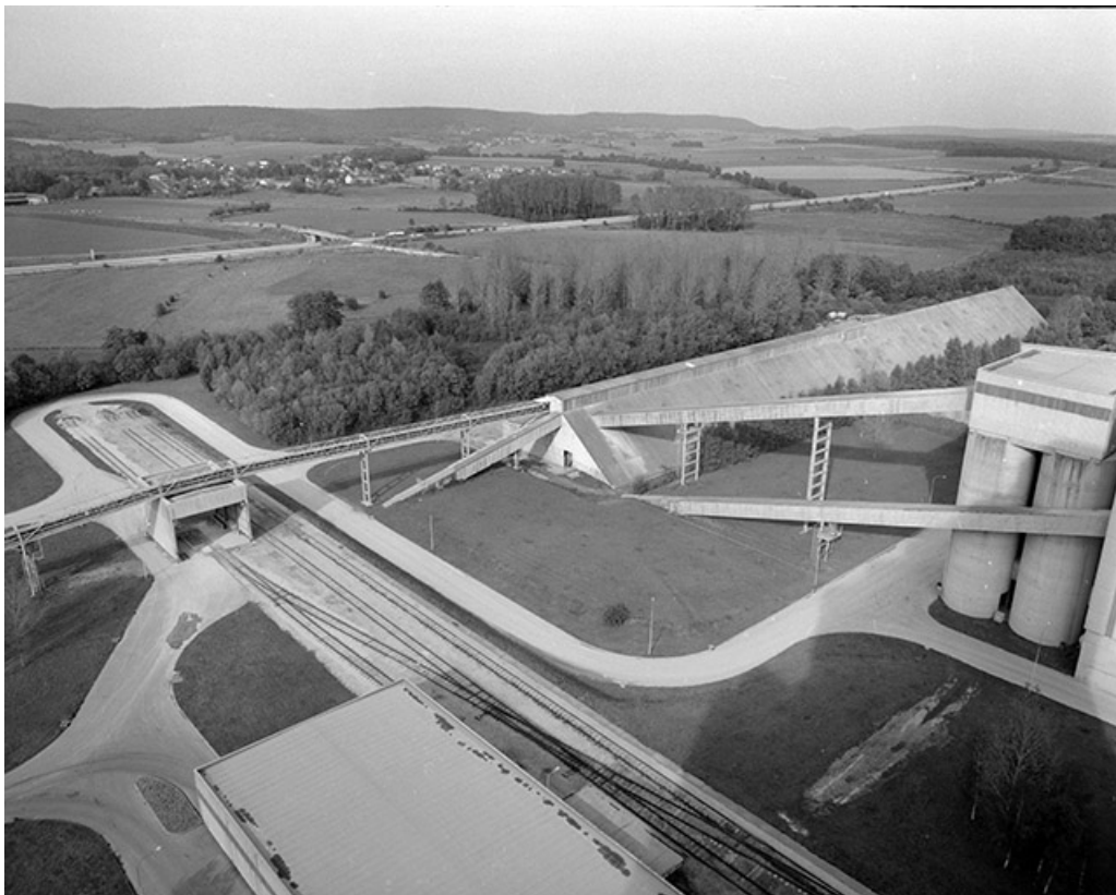
Voie ferrée et "hall de préhomogénéisation" (C), depuis le haut des silos.

39, Rochefort-sur-Nenon chemin de la Cimenterie, lieudit : les Etrapeux Nord