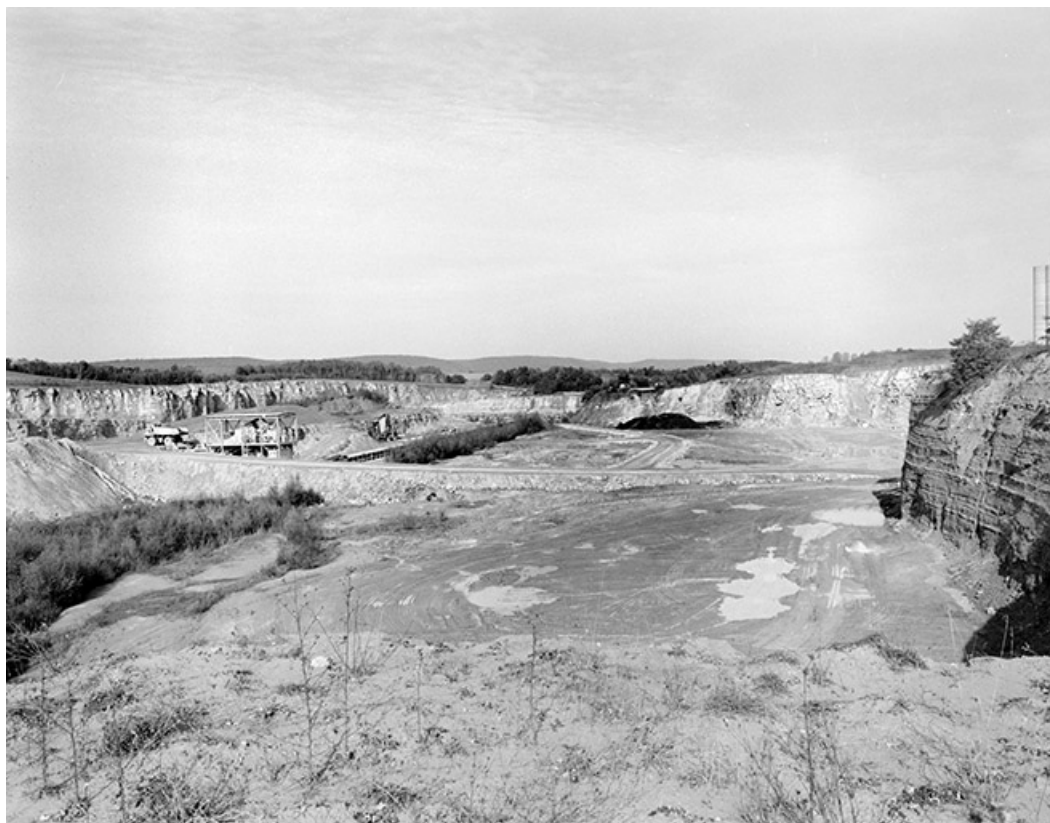
Vue d'ensemble de la carrière, depuis l'ouest.

39, Rochefort-sur-Nenon chemin de la Cimenterie, lieudit : les Etrapeux Nord