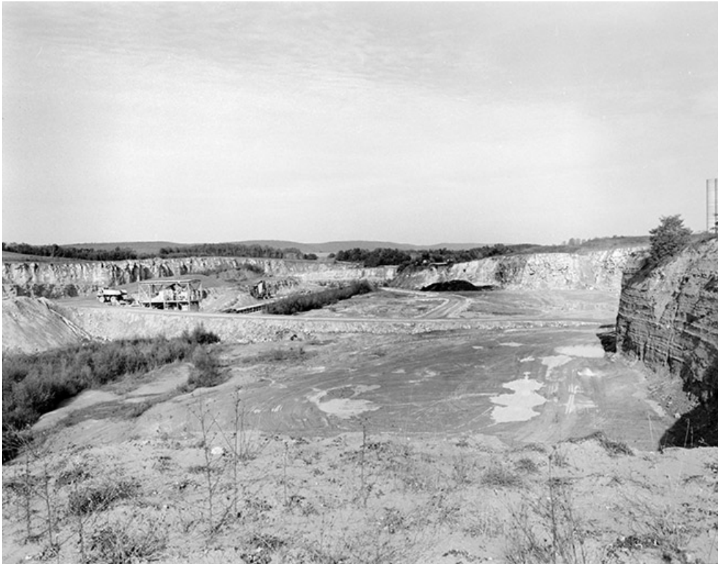
Vue d'ensemble de la carrière, depuis l'ouest.

39, Rochefort-sur-Nenon chemin de la Cimenterie, lieudit : les Etrapeux Nord