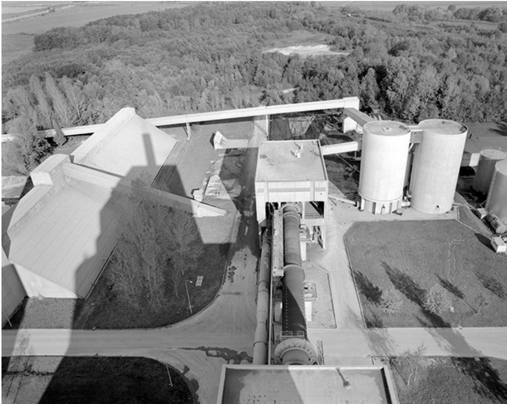
Stockage clinkers (D) et four rotatif, depuis le haut des silos.

39, Rochefort-sur-Nenon chemin de la Cimenterie, lieudit : les Etrapeux Nord