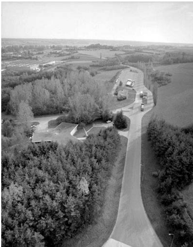
Entrée de l'usine, depuis le haut des silos.

39, Rochefort-sur-Nenon chemin de la Cimenterie, lieudit : les Etrapeux Nord