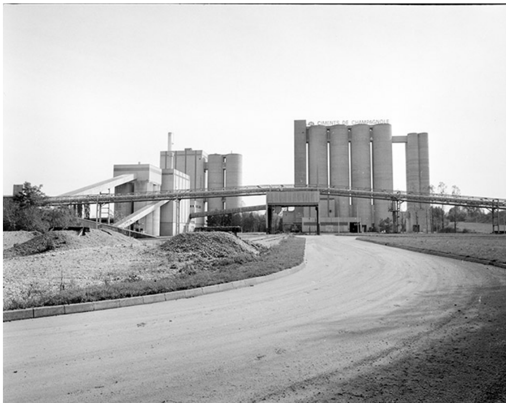
Vue d'ensemble depuis le nord-ouest : transporteur à bande, atelier de fabrication à gauche, silos et conditionnement à droite. 39, Rochefort-sur-Nenon chemin de la Cimenterie, lieudit : les Etrapeux Nord