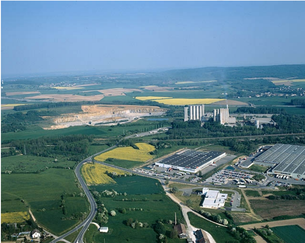
Vue aérienne, depuis le sud.

39, Rochefort-sur-Nenon chemin de la Cimenterie, lieudit : les Etrapeux Nord