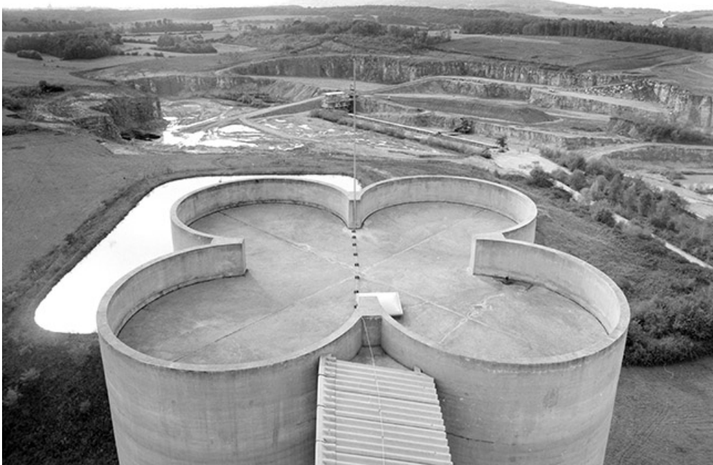
Terrasse de silos et carrière.