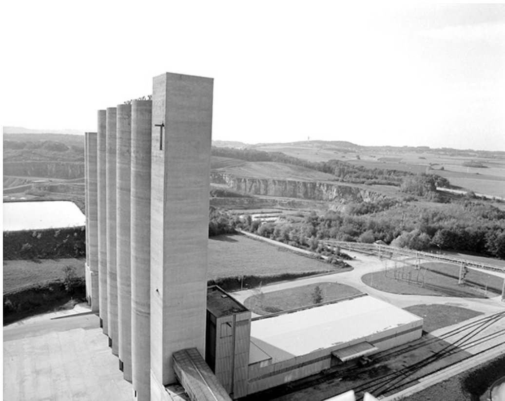
Silos et atelier de conditionnement, depuis le haut des silos de (F).

39, Rochefort-sur-Nenon chemin de la Cimenterie, lieudit : les Etrapeux Nord