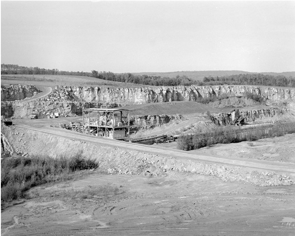
Broyeurs à calcaire (à gauche) et à marne.

39, Rochefort-sur-Nenon chemin de la Cimenterie, lieudit : les Etrapeux Nord