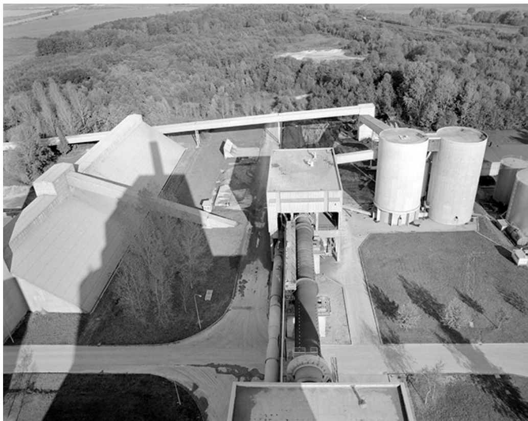
Stockage clinkers (D) et four rotatif, depuis le haut des silos.

39, Rochefort-sur-Nenon chemin de la Cimenterie, lieudit : les Etrapeux Nord