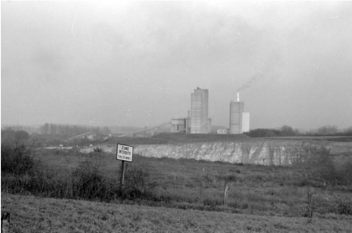
Vue d'ensemble, depuis l'ouest.

39, Rochefort-sur-Nenon chemin de la Cimenterie, lieudit : les Etrapeux Nord