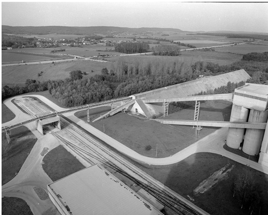
Voie ferrée et "hall de préhomogénéisation" (C), depuis le haut des silos. 39, Rochefort-sur-Nenon chemin de la Cimenterie, lieudit : les Etrapeux Nord