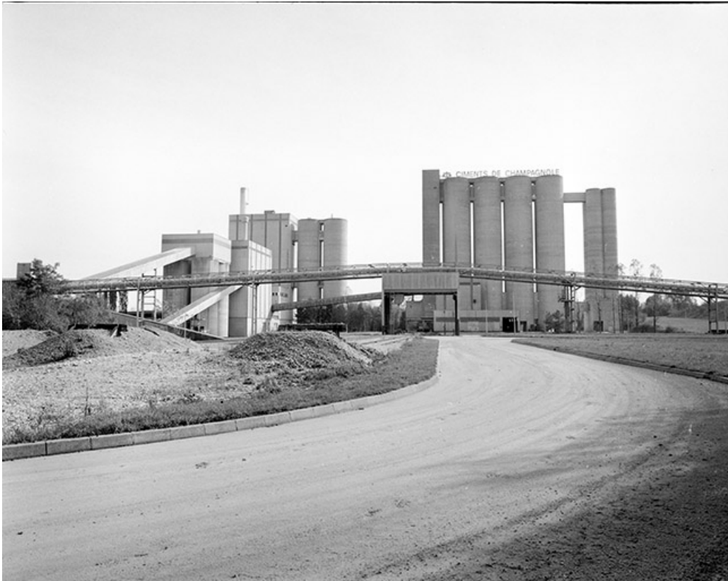
Vue d'ensemble depuis le nord-ouest : transporteur à bande, atelier de fabrication à gauche, silos et conditionnement à droite. 39, Rochefort-sur-Nenon chemin de la Cimenterie, lieudit : les Etrapeux Nord