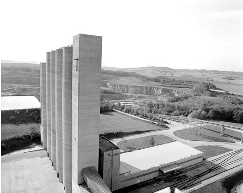
Silos et atelier de conditionnement, depuis le haut des silos de (F).

39, Rochefort-sur-Nenon chemin de la Cimenterie, lieudit : les Etrapeux Nord