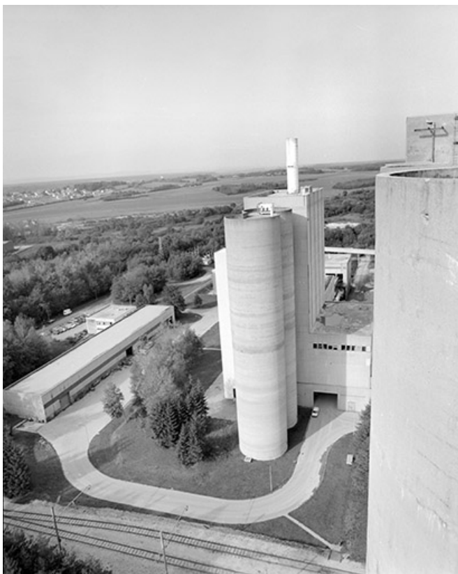
Atelier de fabrication et atelier de réparation (K), depuis le haut des silos. 39, Rochefort-sur-Nenon chemin de la Cimenterie, lieudit : les Etrapeux Nord