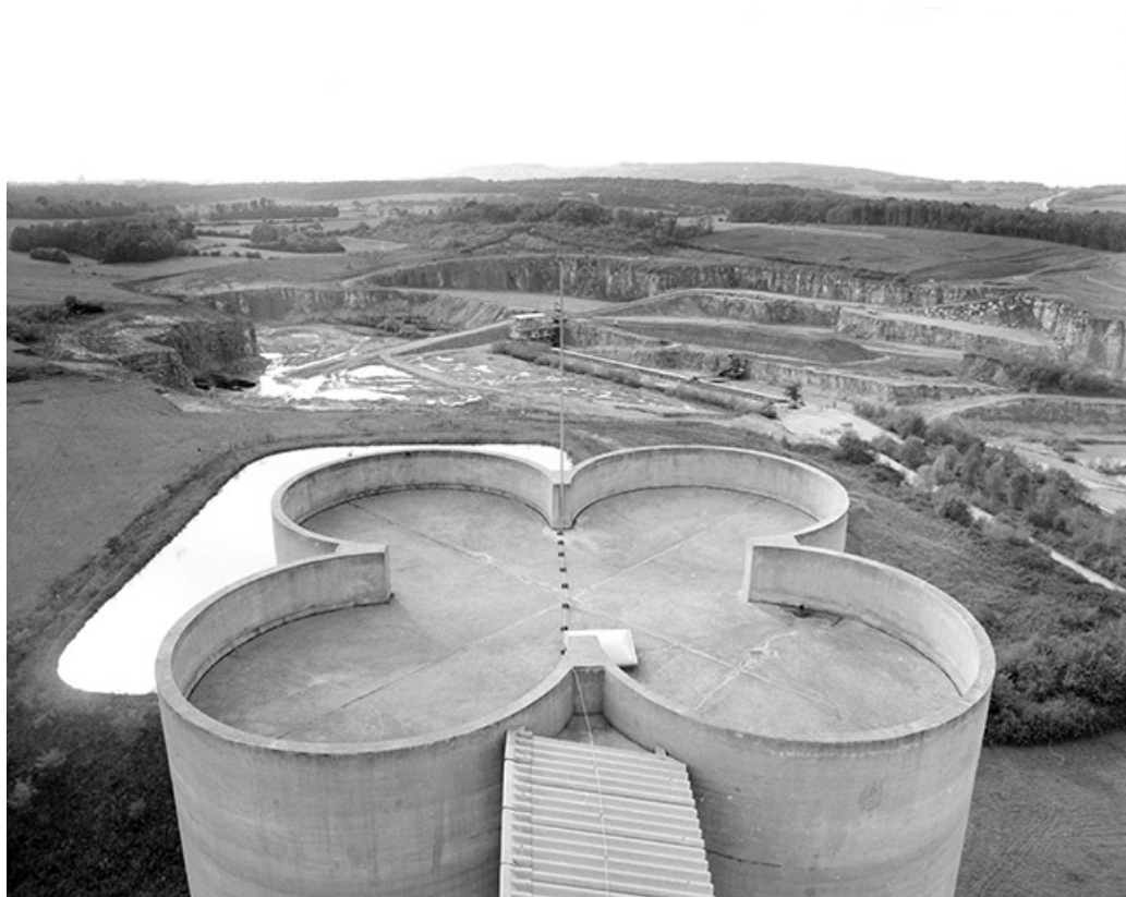
Terrasse de silos et carrière.