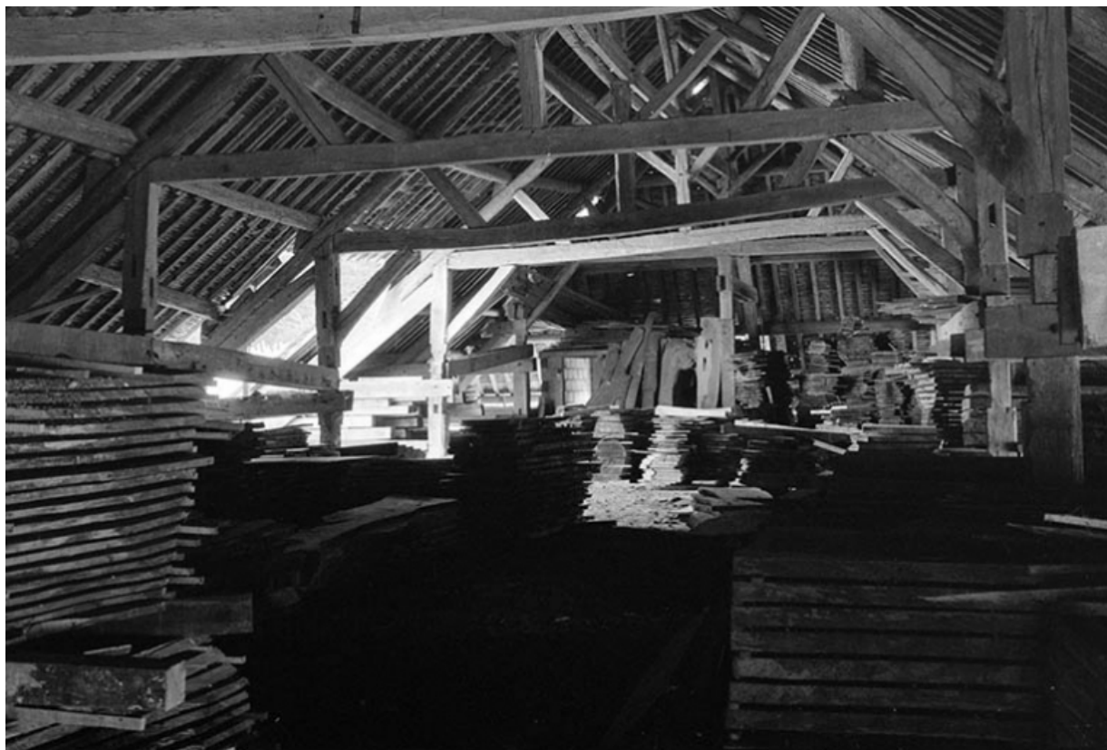
Intérieur de la halle de séchage.