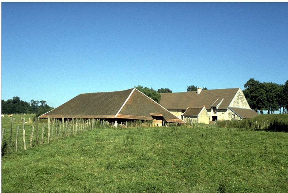
Vue d'ensemble, depuis l'ouest.