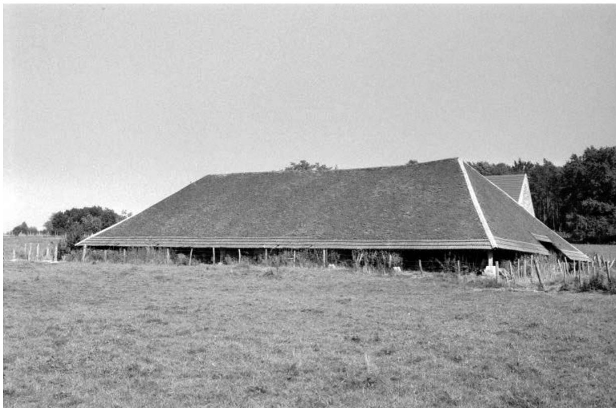
Halle de séchage, depuis l'ouest.