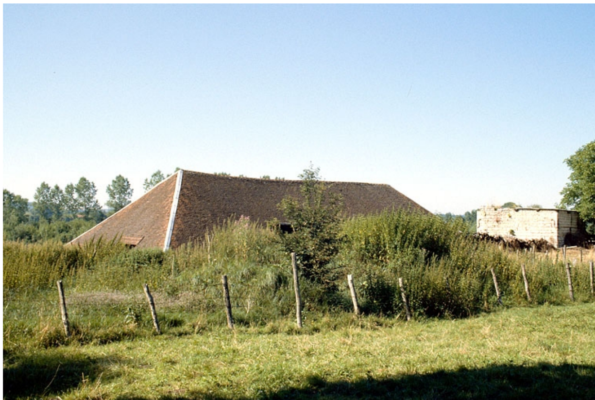
Vue d'ensemble de la halle de séchage et du four, depuis le sud.